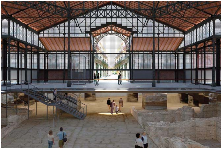
Imatge 3: El Born Centre Cultural. 2013.

La utilització de la dial·lèctica hegeliana i l'estudi de les relacions socials internes converteix l'espai teòric del marxisme dialèctic en un fet únic. El valor del seu enfocament no rau en polèmiques o abstraccions, sinó en la praxi. Aquesta praxi cerca criticar del món, conèixer-lo i canviar-lo. (McGuire, 1998). (imatge 3)