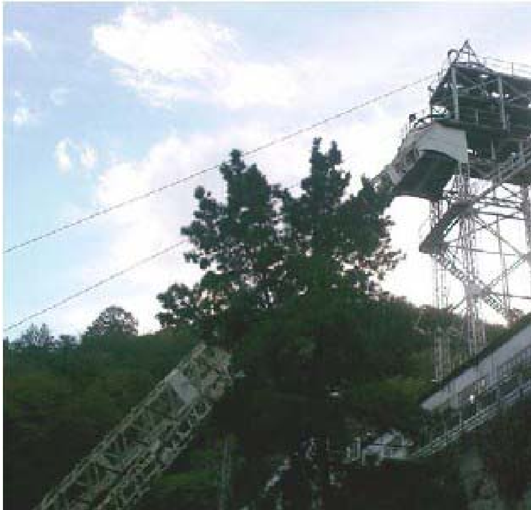
Fig. 2. El Pozo Barredo

Por lo tanto, se prohíbe la destrucción de la maquinaria industrial de fabricación anterior a 1940, así como el traslado fuera de Asturias sin la autorización de la Consejería de Educación y Cultura.