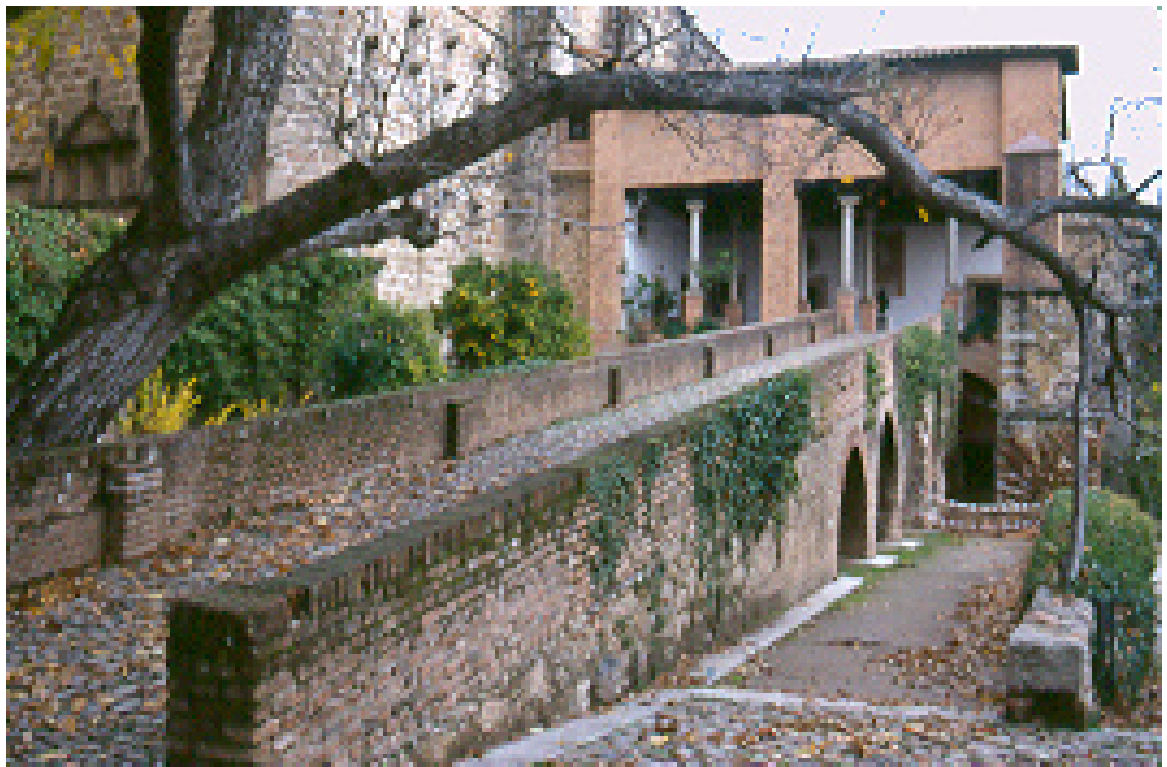
Fig. 1. Rampa del Monasterio de Yuste, ejemplo de accesibilidad del siglo XVI

Teniendo en cuenta los criterios mencionados, la accesibilidad al patrimonio cultural y natural es un valor añadido a los edificios para facilitar acceso universal y no solamente a los dignatarios, como se aprecia en algunos edificios históricos, como por ejemplo, la torre de la Giralda en la Catedral de Sevilla que tiene 35 rampas que permiten su acceso a caballo, o la rampa construida en el Monasterio de Yuste, para facilitar el acceso a caballo de Carlos V y de la comitiva que lo acompañó en el viaje a su retiro en noviembre de 1556 y que cubría una distancia de 10 km. Actualmente es conocida como la Ruta del Emperador por su valor histórico y por la calidad de su paisaje.