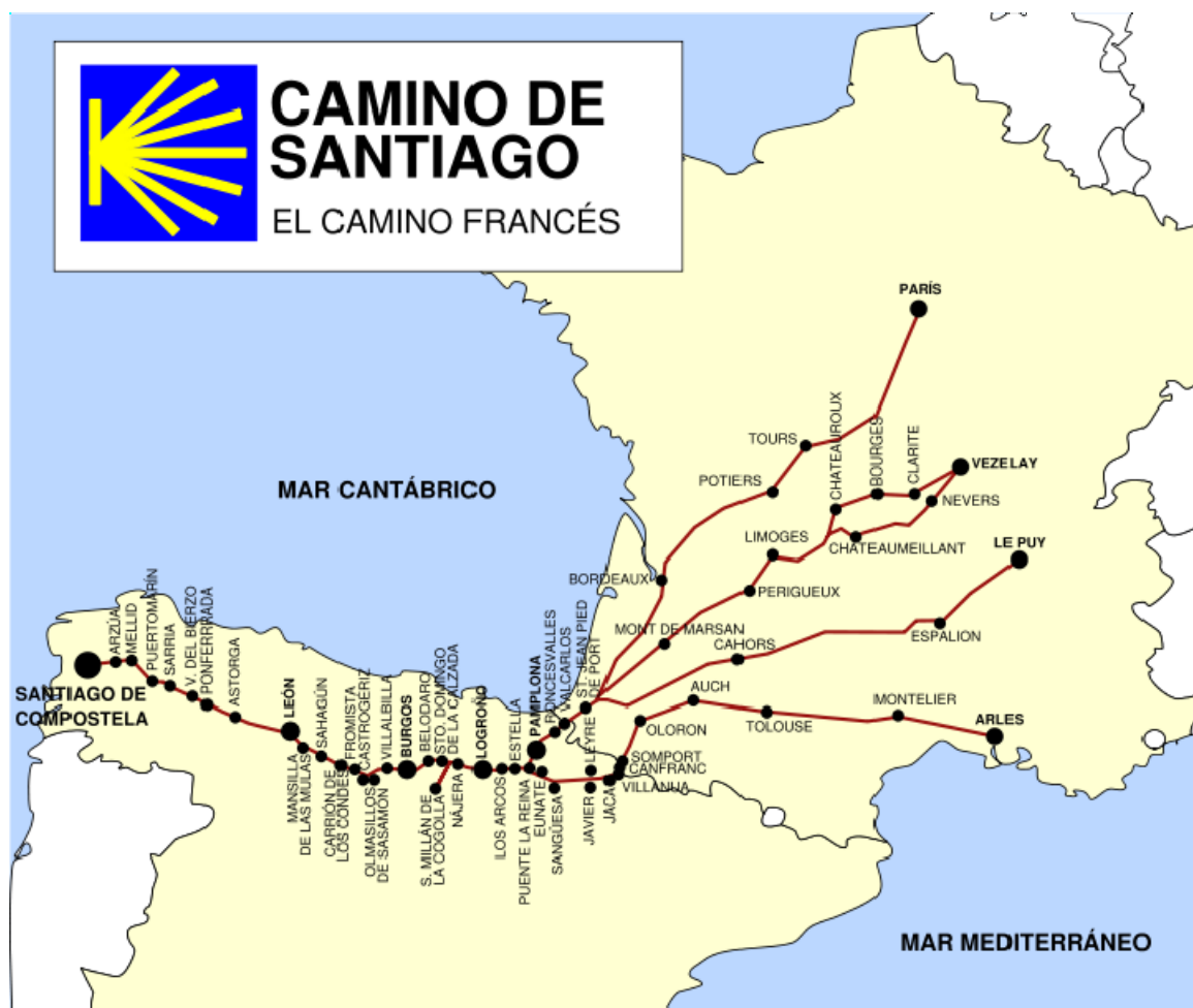
Fig. 4. Macroescala de actuación del Camino de Santiago

Existe abundante bibliografía pero son pocas las investigaciones sobre la accesibilidad del camino. Se puede citar la publicación “Guía del camino de Santiago para personas con discapacidad” que sigue el trayecto francés, editada por Ibertuamur, también en braille, y en la que han colaborado las Comunidades de Navarra, La Rioja, Castilla y León y Galicia.