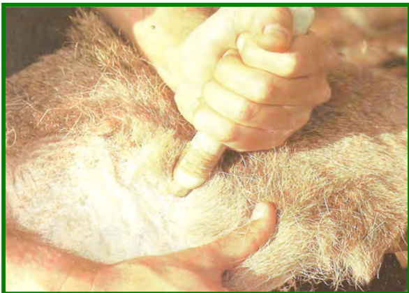
Foto de pruebas actuales, de un punzón de madera con esquirlas de piedra, usado como rascador de pieles. Sistema a semejanza al que hacían servir durante el Paleolítico superior.