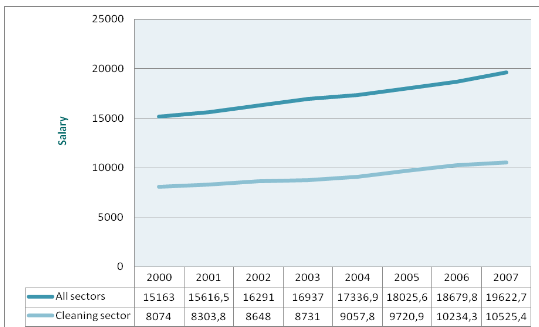
Tabla 3. Media de salarios general y del sector de limpieza (2000 – 2007).

La contrapartida de la estabilidad son los bajos salarios . La mayor parte del personal del sector, a excepción de los cuadros directivos y algunas “profesiones” masculinas (limpieza de cristales, maquinas de pulido de suelo) están englobados en la categoría de limpiador/ limpiadora, un empleo prácticamente copado por mujeres. Los salarios varían bastante según cada convenio provincial pero, a excepción de la provincia de Guipuzcoa (situada en la región del país con salarios más altos) el salario base siempre oscila en un rango de 608-916 € mensuales para una jornada de trabajo de 38- 48 horas (Tabla 3).