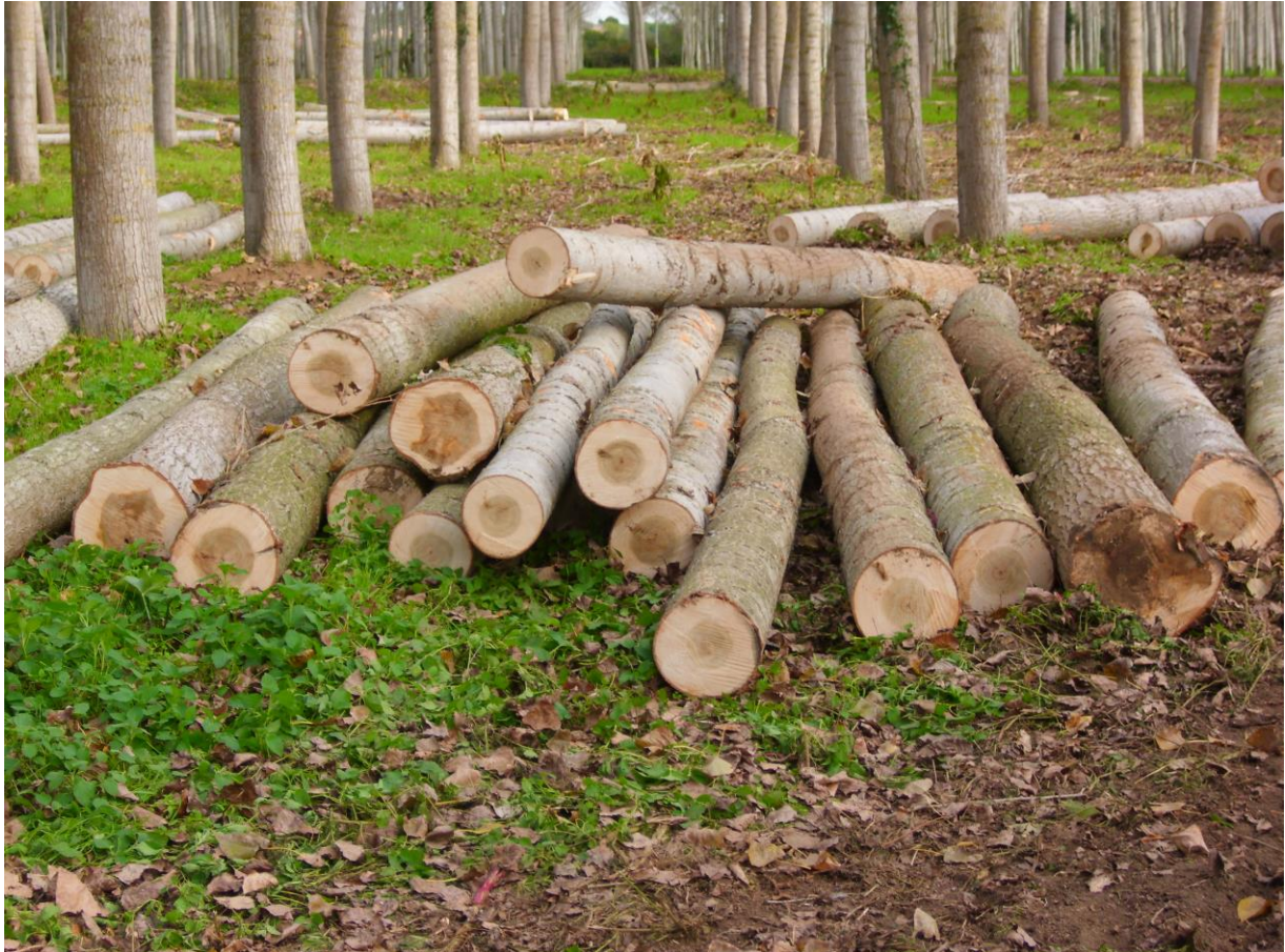
Madera de chocho del clon MC, de finca certificada sostenible, para desarrollo. Mas Hostal de l'Arrupit (2013)