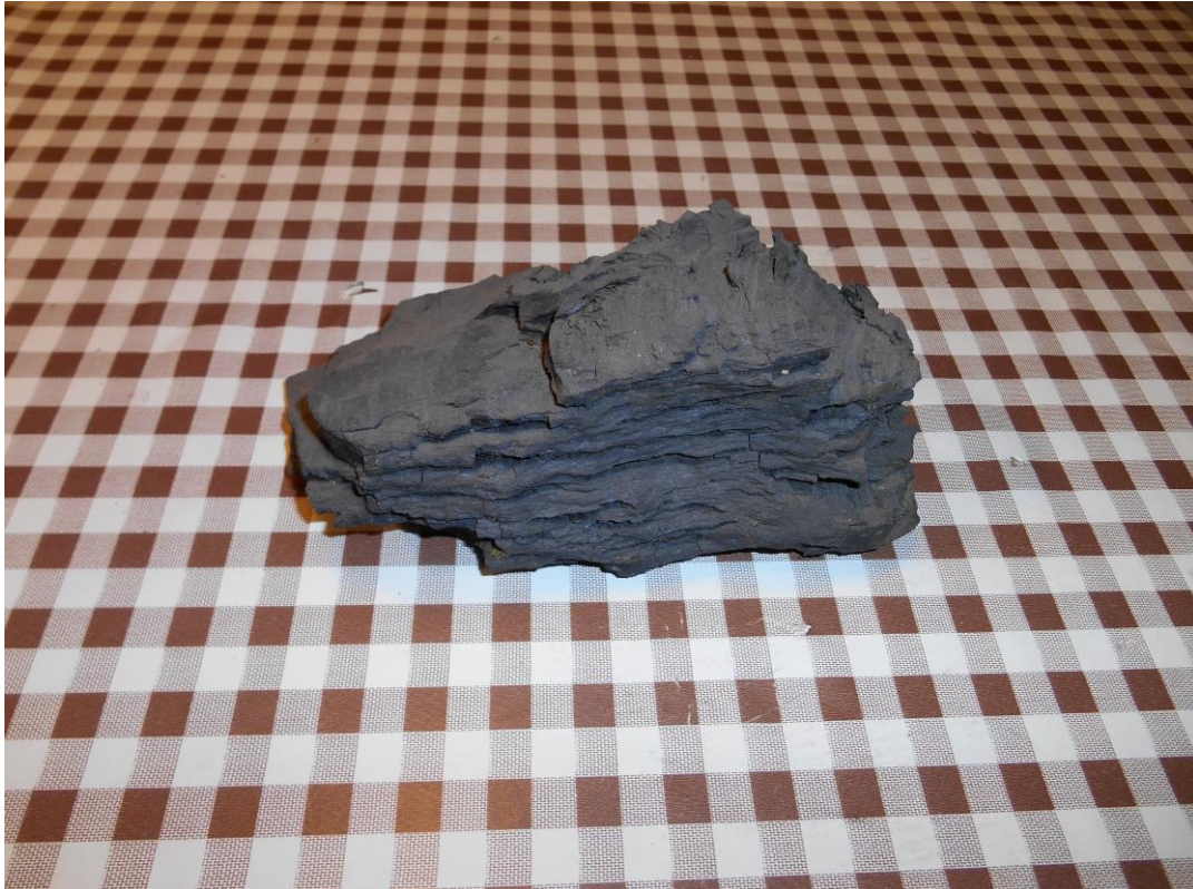
Carbón vegetal. Mas Hostal de l'Arrupit (2021)