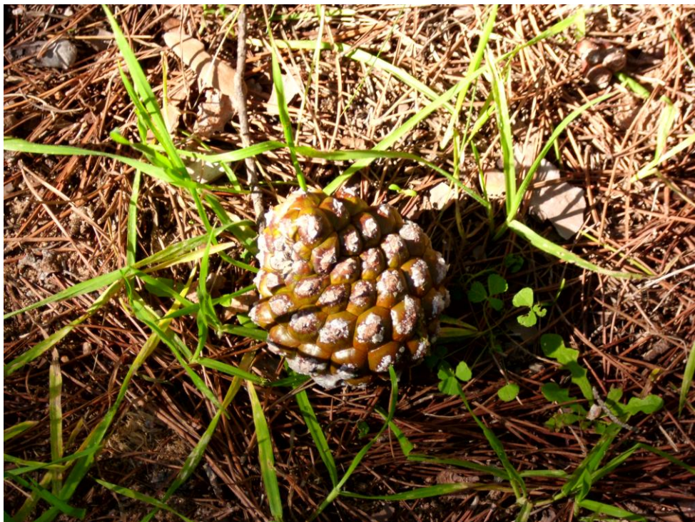
Piña de pino piñonero