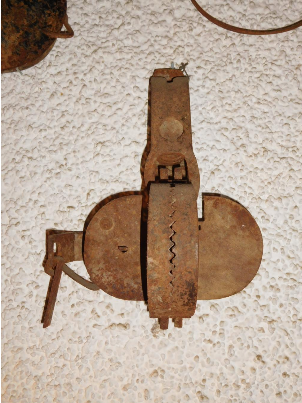
Cepo perteneciente a Peixa, el último trampero del Montenegro (2018)