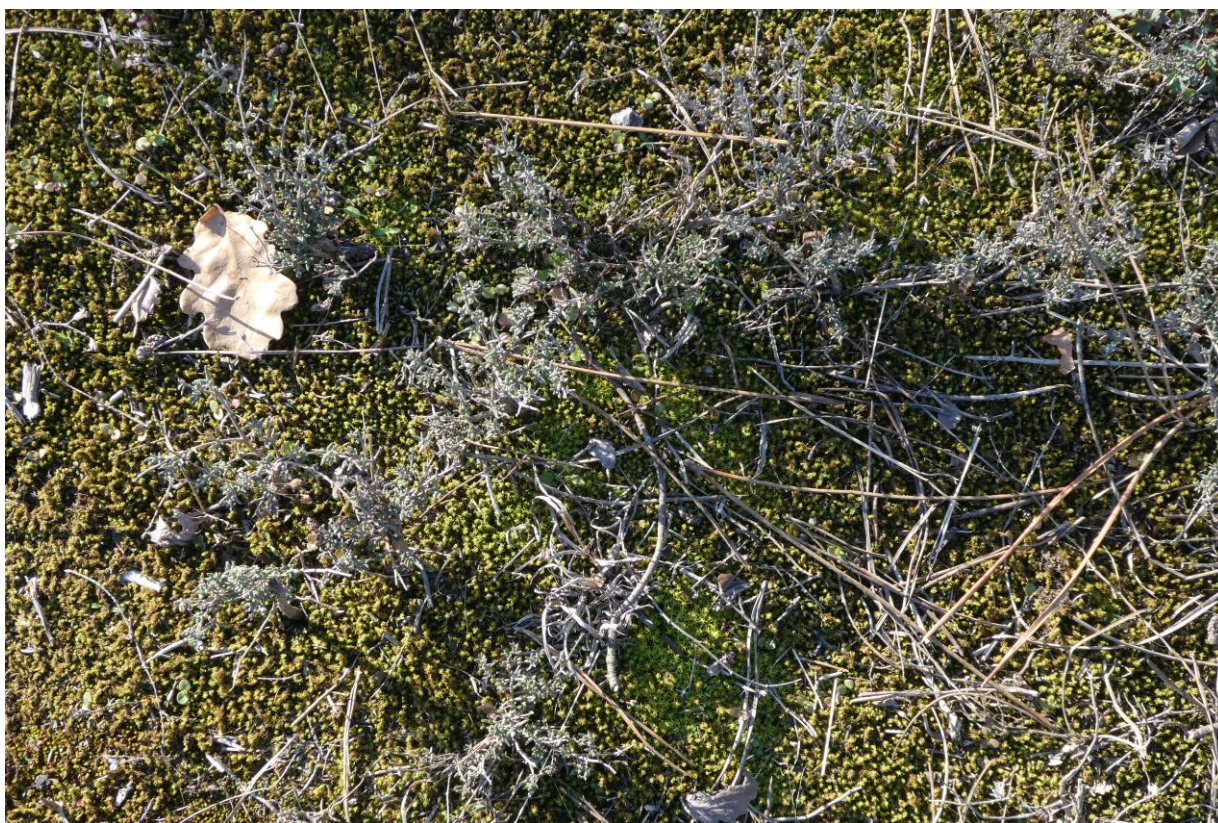
Plantas de tomillo en invierno, en una solana