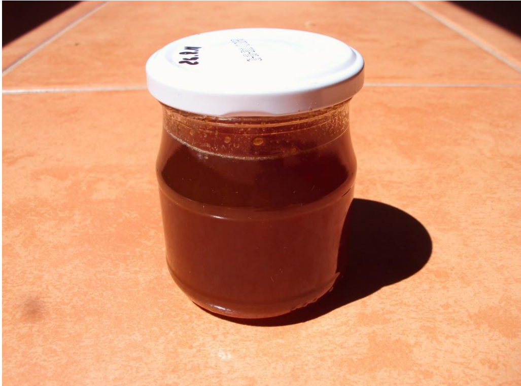
Miel de castaño y tilo, procedente de colmenas biodinámicas. Can Ginesta (Montseny, 2010)