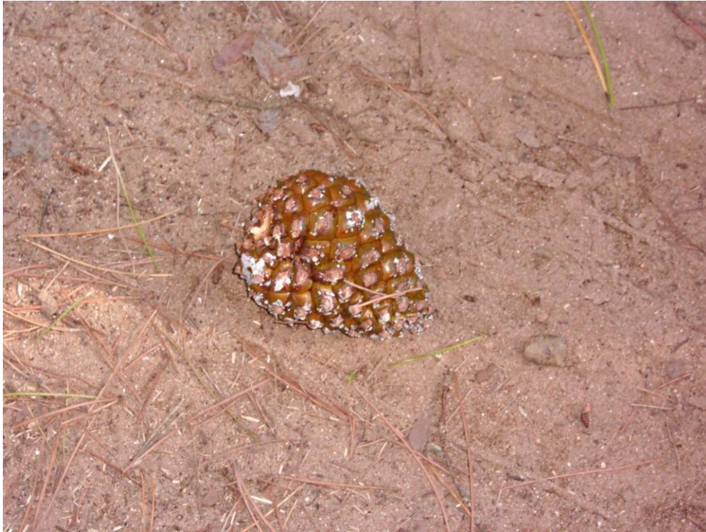
Piña de pino piñonero. Montañas de Begur (2012)

Romper piñones es un trabajo femenino y de las familias de pinyonaires. , que se hace delante de la puerta de la casa, al sol, utilizando dos piedras. En el Alt Vallès y en la Plana de Vic, las mujeres también los partían a pie de calle, a primera hora de la tarde. En el aplec /romería del día de Sant Nicolau [6/12/XXXX] en la ermita dedicada a él, cerca de l’Ametlla del Vallès, se consumían muchos piñones. A esta romería acudían muchos pinyonaires de Sant Feliu de Codines, con sacos llenos, que vendía a mesurons , a la gente que se sentaba alrededor de un gran fuego para calentarse, mientras la juventud bailaba el Ball rodó y la Bolangerera .