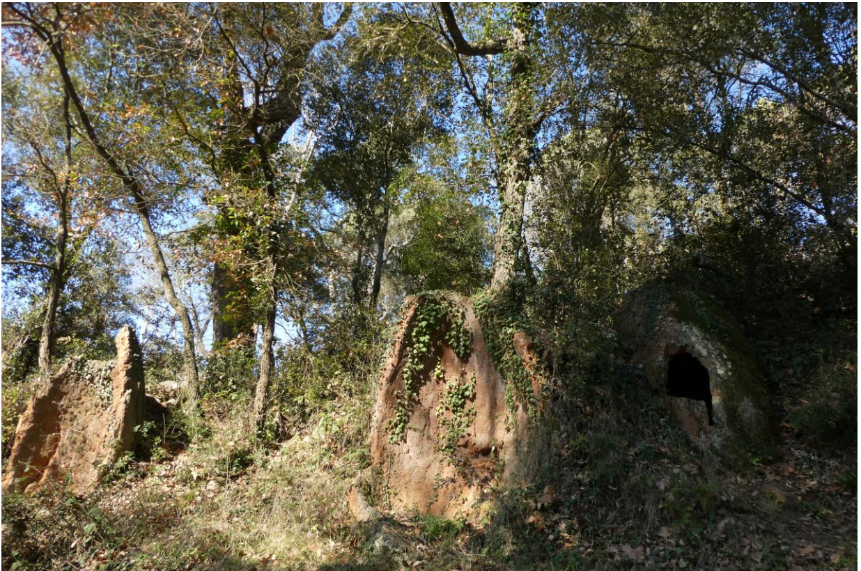
Forns de pega de Can Valls, s. IX (Montnegre, 2022)