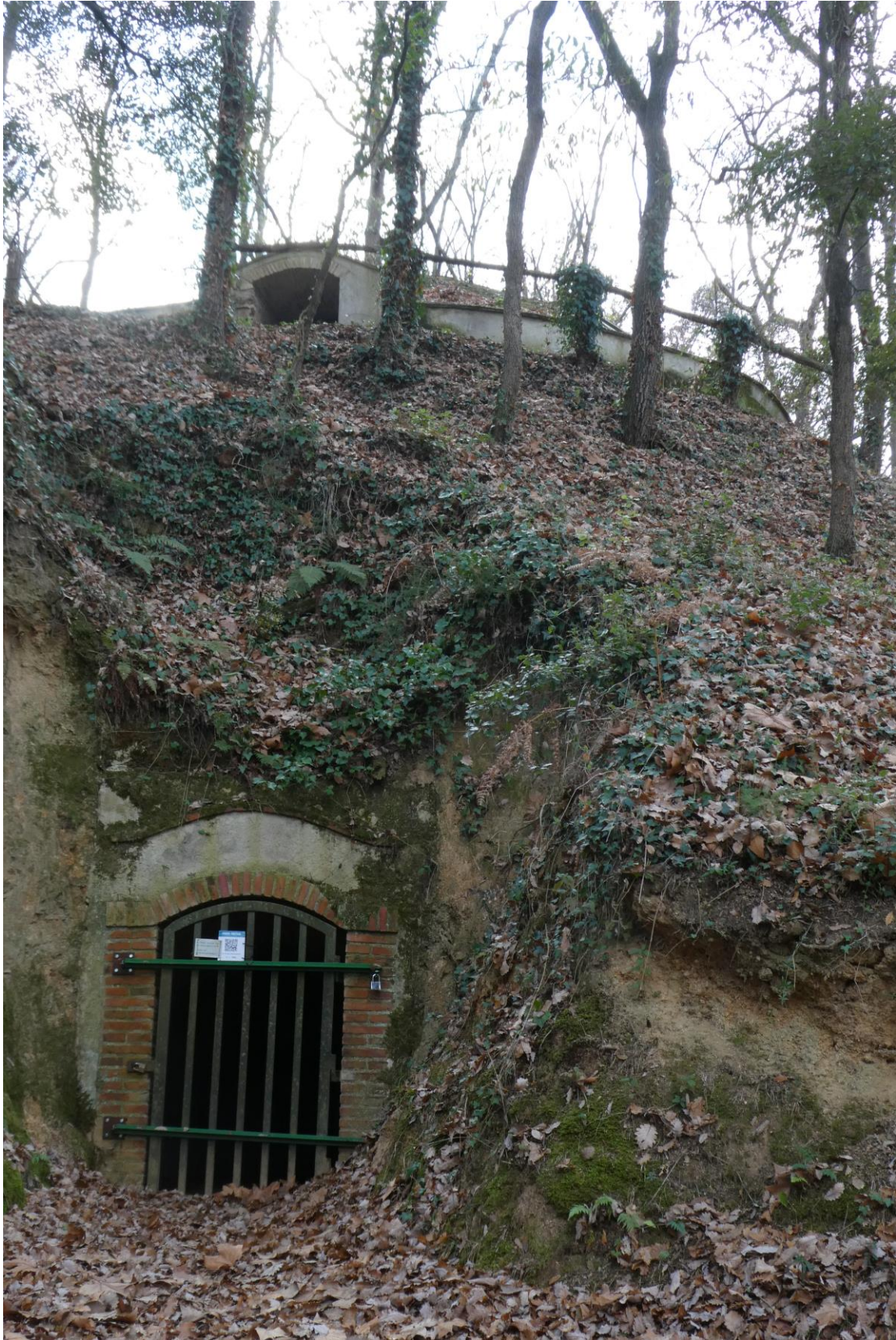
Pou de glaç de Buscastell, s. XVII (La Selva, 2022)

Restauración promovida por el Taller d'Història de Maçanet de la Selva