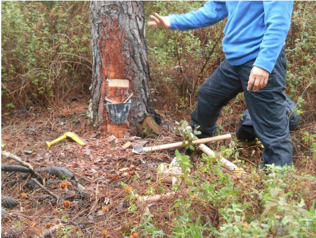
Obtención de resina de pino marítimo. Jornades Tècniques Silvícoles Emili Garolera, del Consorci Forestal de Catalunya. Montnegre (2010 aprox.)

Cada oficio tenía su advocación particular, además de las generales. La Mare de Déu d'Agost [15/8/XXXX] era reclamada por pegaters , herbaires , resinaires , teiares , escorçaires y trementinaires , mientras que San Juan [24/6/XXXX] era patrón de los oficios de los bosquerols que vivían y trabajaban en el bosque y que estaban relacionados con el fuego.