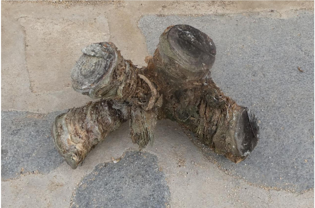
Teia de tronco de pino piñonero, con 4 ramas (es la parte interna y dura del pino, que queda después de pudrirse la corteza y la madera). Mas Hostal de l'Arrupit (2021)