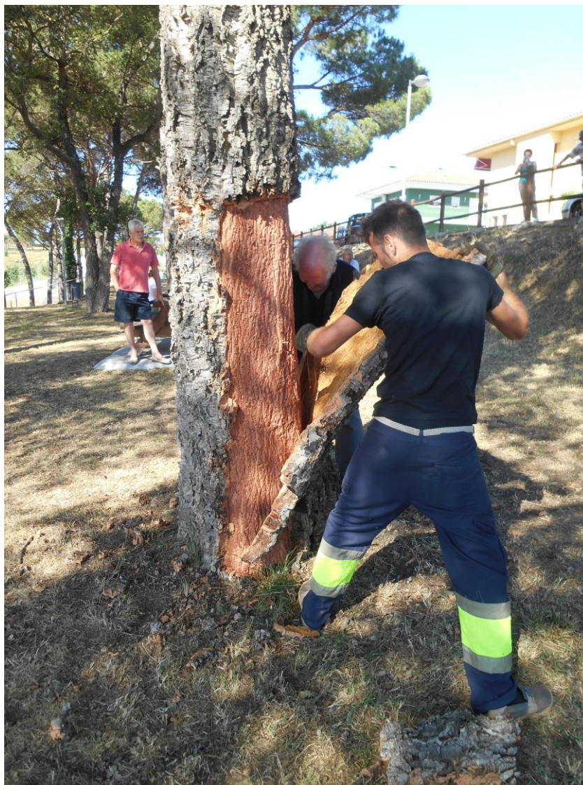
I Demostració de pela de suro de Sils (2016): Carreras padre (EPD) e hijo, separando una buena panna de bornizo/pelagrí, de una zona verde de Mallorca

Según el color del ventre (la parte interna del corcho), también deducen si está a punto o no. Para ello también pueden desmenuzar la tatxa y observar si está bastante seca o si está hecha del todo.