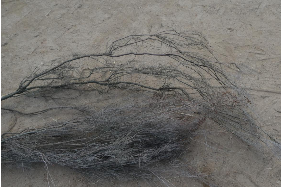
Brezo blanco ( Erica arborea , arriba); brezo de escobas ( Erica scoparia , abajo). Can Patufo (2022)