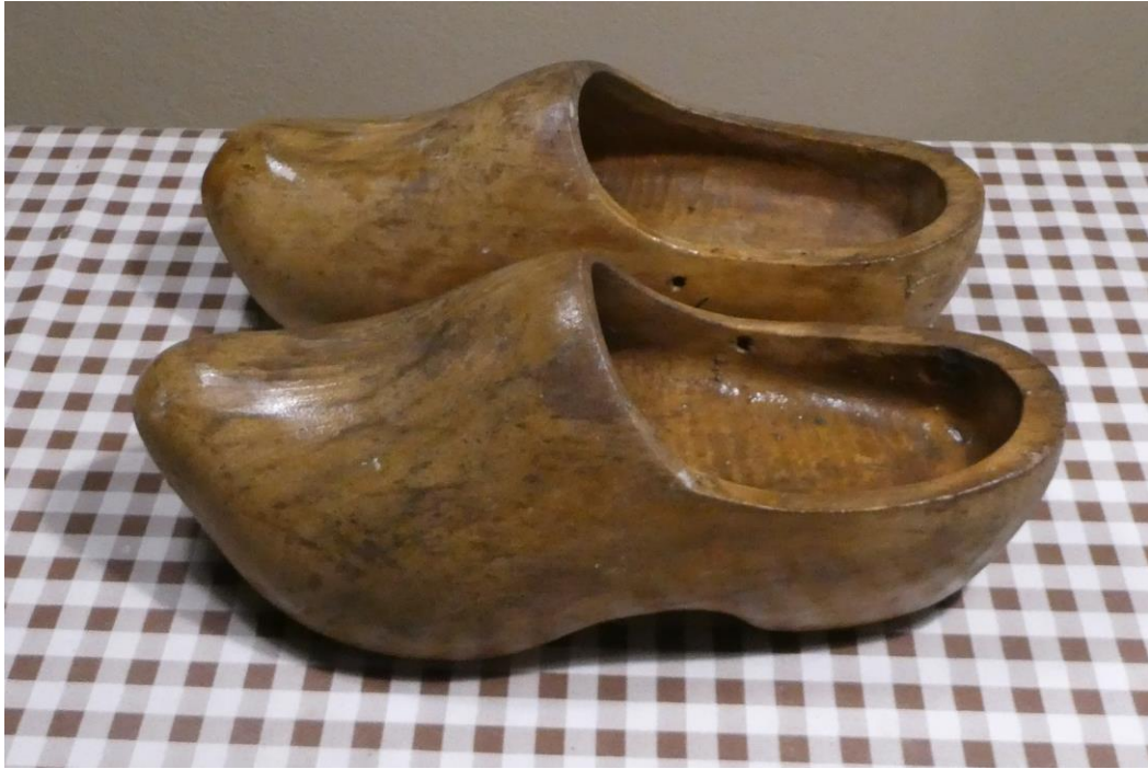
Zuecos de madera