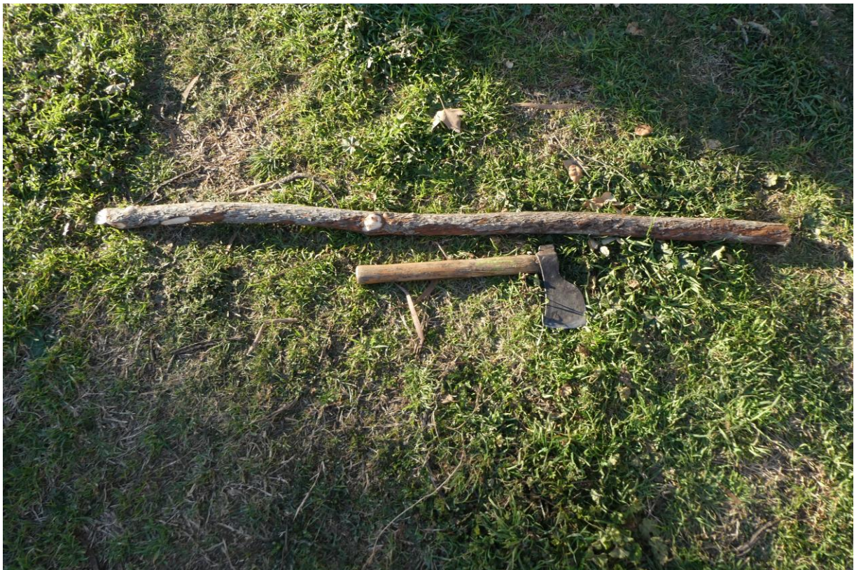
Burxa corta hecha de un rebrote de madroño (con la punta, parte izquierda en diagonal para burxar . Mas Hostal de l'Arrupit (2022)

Amades explica detalladamente el proceso de obtención de carbón. Se cortan las encinas por claros o a matarrasa, cercanas (para evitar el transporte) a una placita de tierra preparada donde hacer la carbonera, que ocupa un círculo de unos 5 m de diámetro . Se comienza la carbonera formando en su base, un emparrillado con los troncos más gruesos, que serán el “corazón” y se superponen a su alrededor, los otros troncos hasta formar una pila, en forma de medio ovalo, con un agujero o chimenea central, desde el corazón hasta la parte superior, a la que llega perpendicularmente. Cuando está hecha la pila, se recubre con ramas de brezo y sobre estas, una capa de tierra de 15 cm de grueso . Entonces se enciende, introduciendo por la chimenea, brasas y troncos encendidos. Cuando está encendida, se tapa este agujero pero se hacen otros, pequeños, justo encima del nivel del suelo, todo alrededor de la carbonera, con una barra puntiaguda de encina llamada burxa .