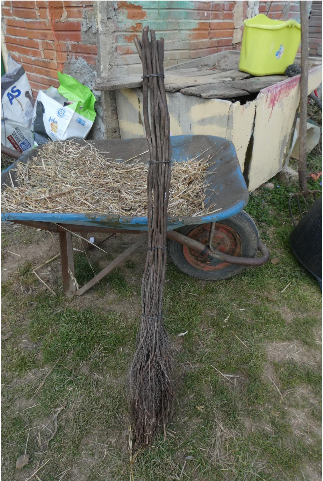
Escoba de brezo ( Erica scoparia ) de Can Patufo (2022)