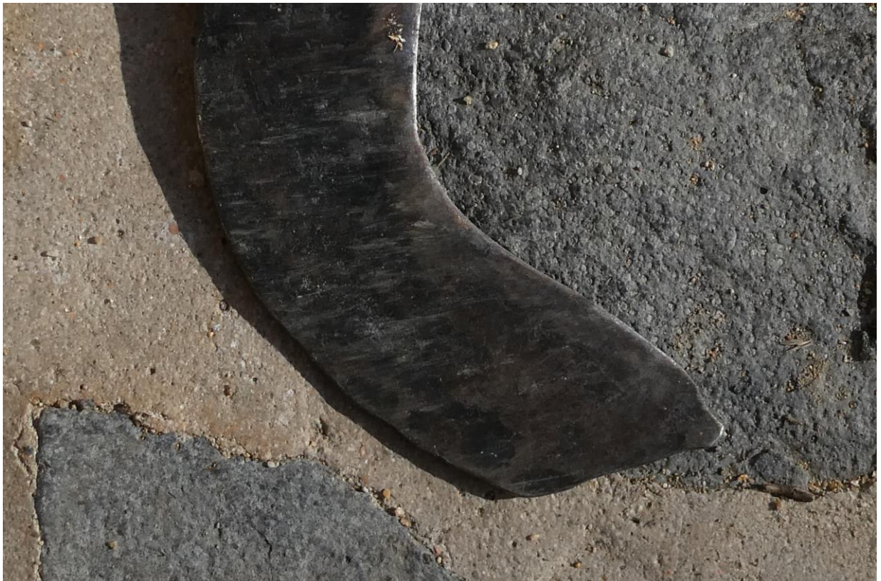
Detalle de la hoja de un tallant : la punta roma y gruesa, para evitar riesgos laborales