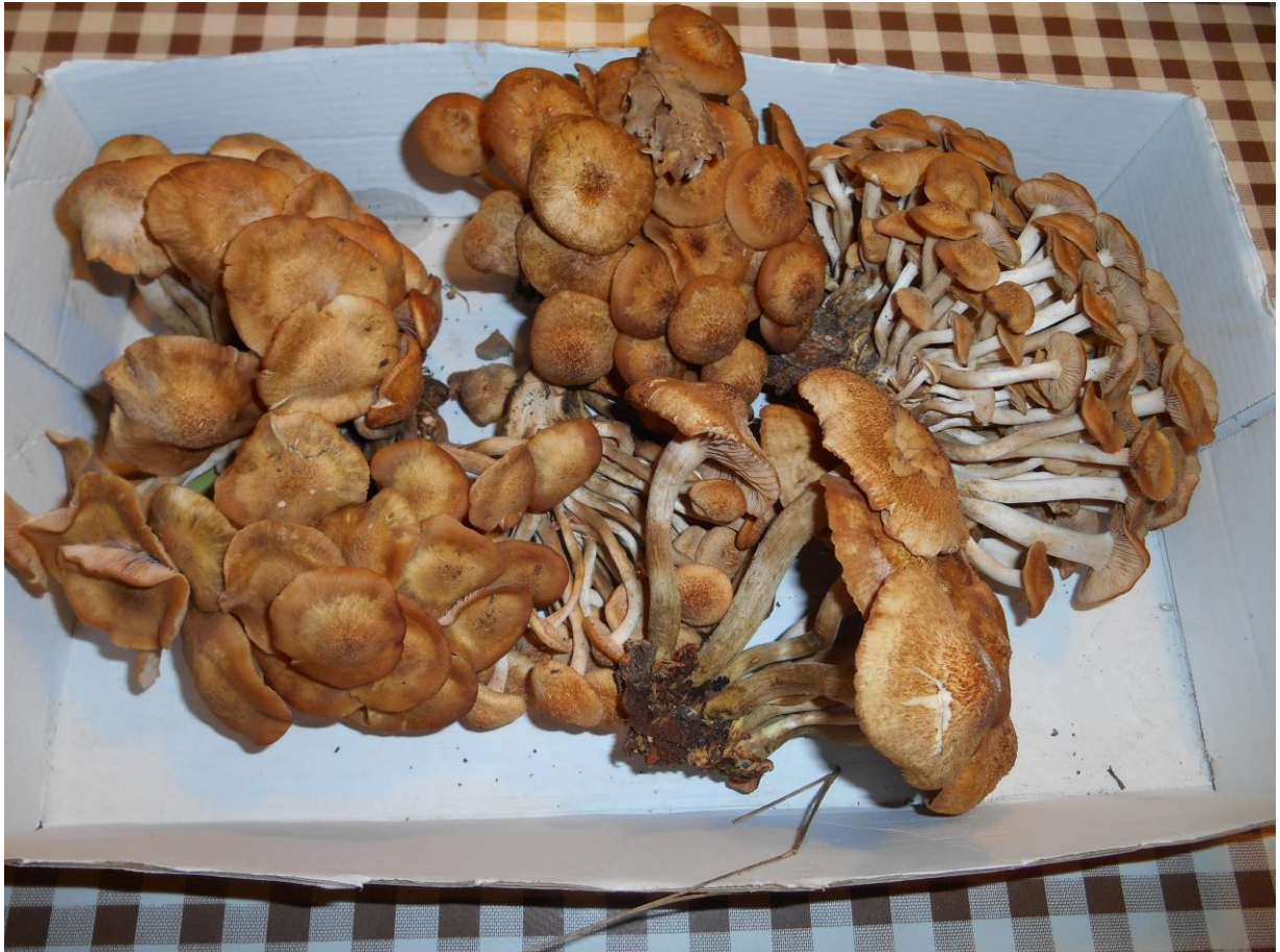
Setas: mata de roure