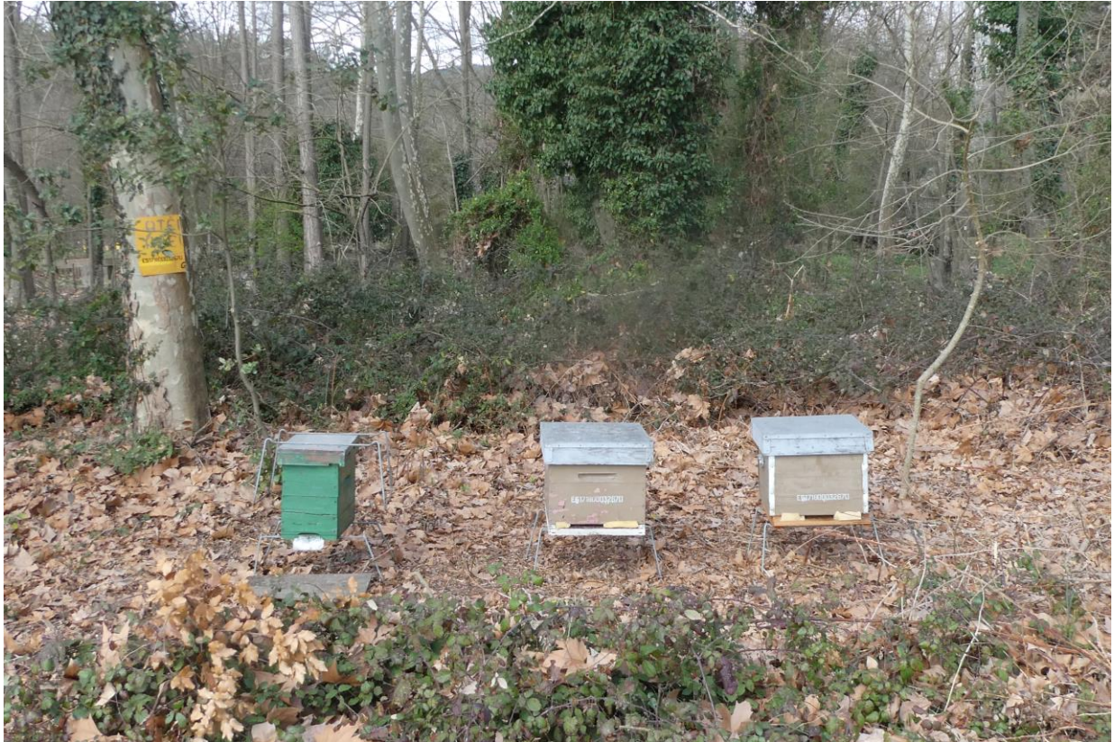
Colmenas en la linde este-sudeste de una plataneda (Santa Coloma de Farners, 2021)