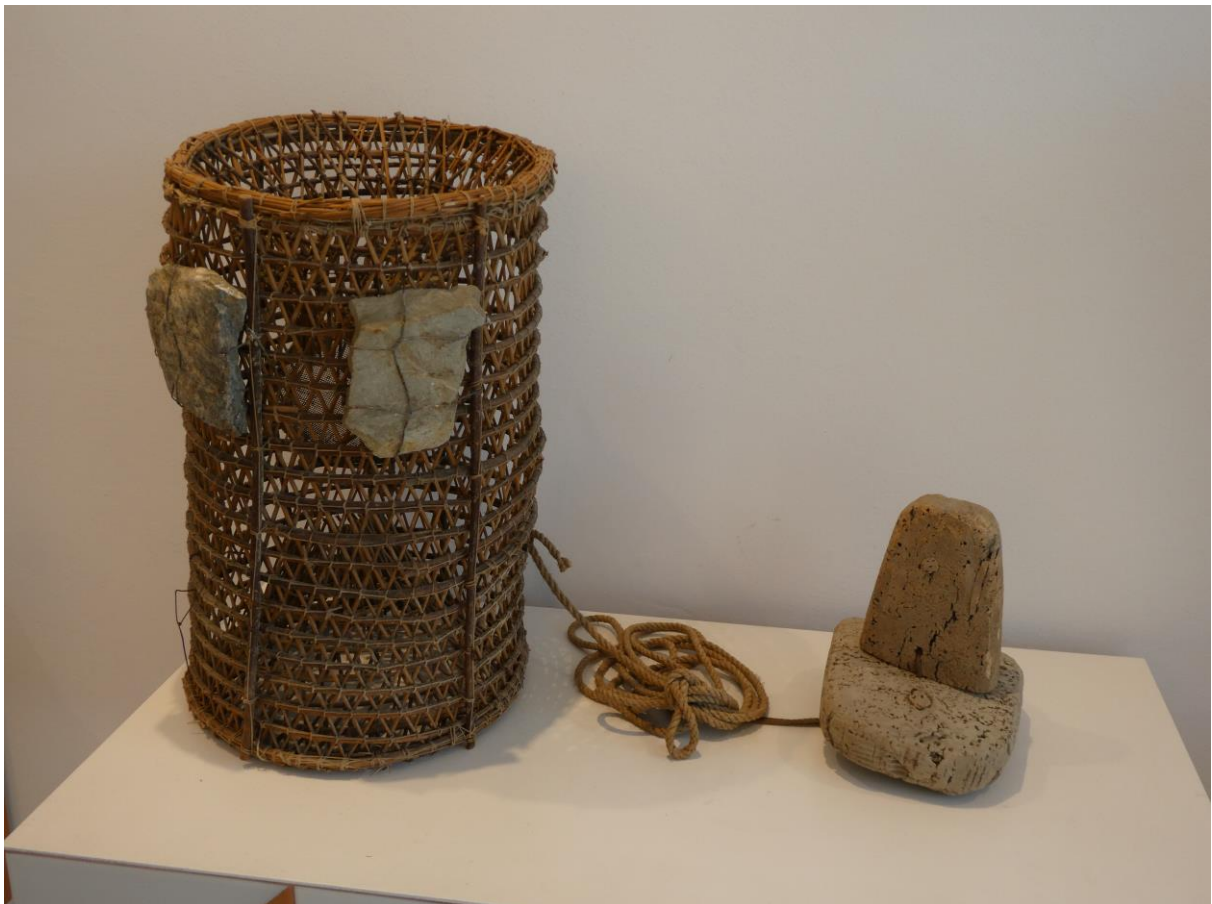
Boya de corcho de una nansa de pesca. El Port de la Selva (2021)

En junio se pelan /descorchan los alcornoques/ alzines sureres , que se suelen descorchar [en Catalunya], cada 12, 14 o 18 años. Se considera que cuanto mayor es el turno, mejor es el corcho. En un bosque no son descorchados todos los alcornoques; se escogen solo los del grosor adecuado. El primer corcho es el llamado pelegrí /bornizo, que se usa para hacer pesebres y armar aparejos de pesca. Para descorchar alcornoques se forman también colles de 3 hombres: 2 peladors y 1 burricaire , que con un asno transporta el corcho del bosque hasta un buen cargador, donde puedan llegar los carros para su transporte.