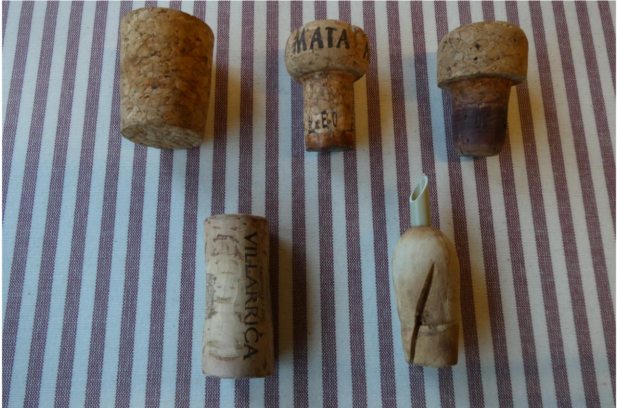
Tapones (de izq. a dcha. y de arriba a abajo.). De corcho: de aceitera/multiusos, de cava usado, de botella reutilizable y de vino. De madera, para beber vino a galillo