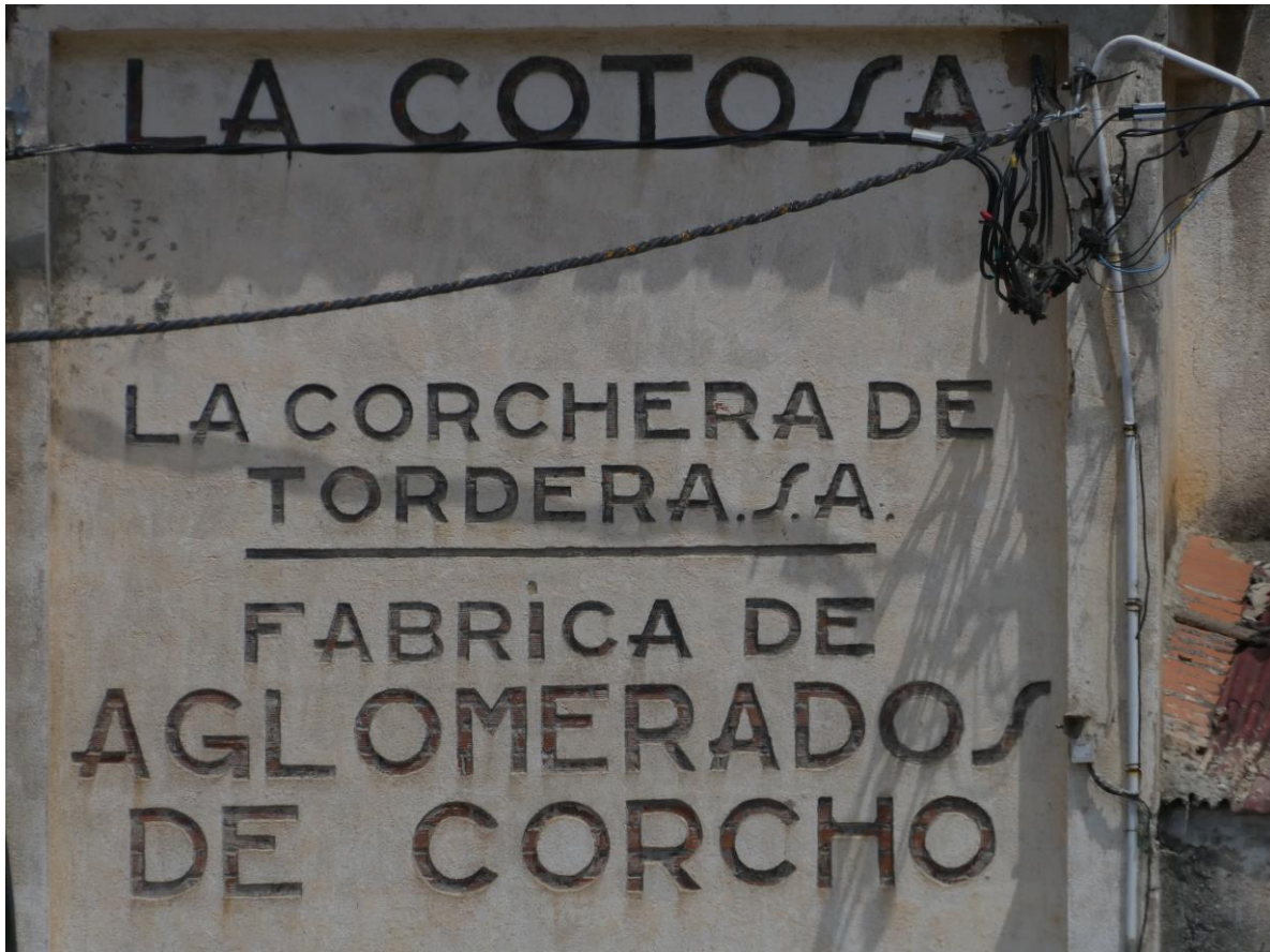
Antigua fábrica del principal producto industrial del corcho: el aglomerado (Tordera, 2019)