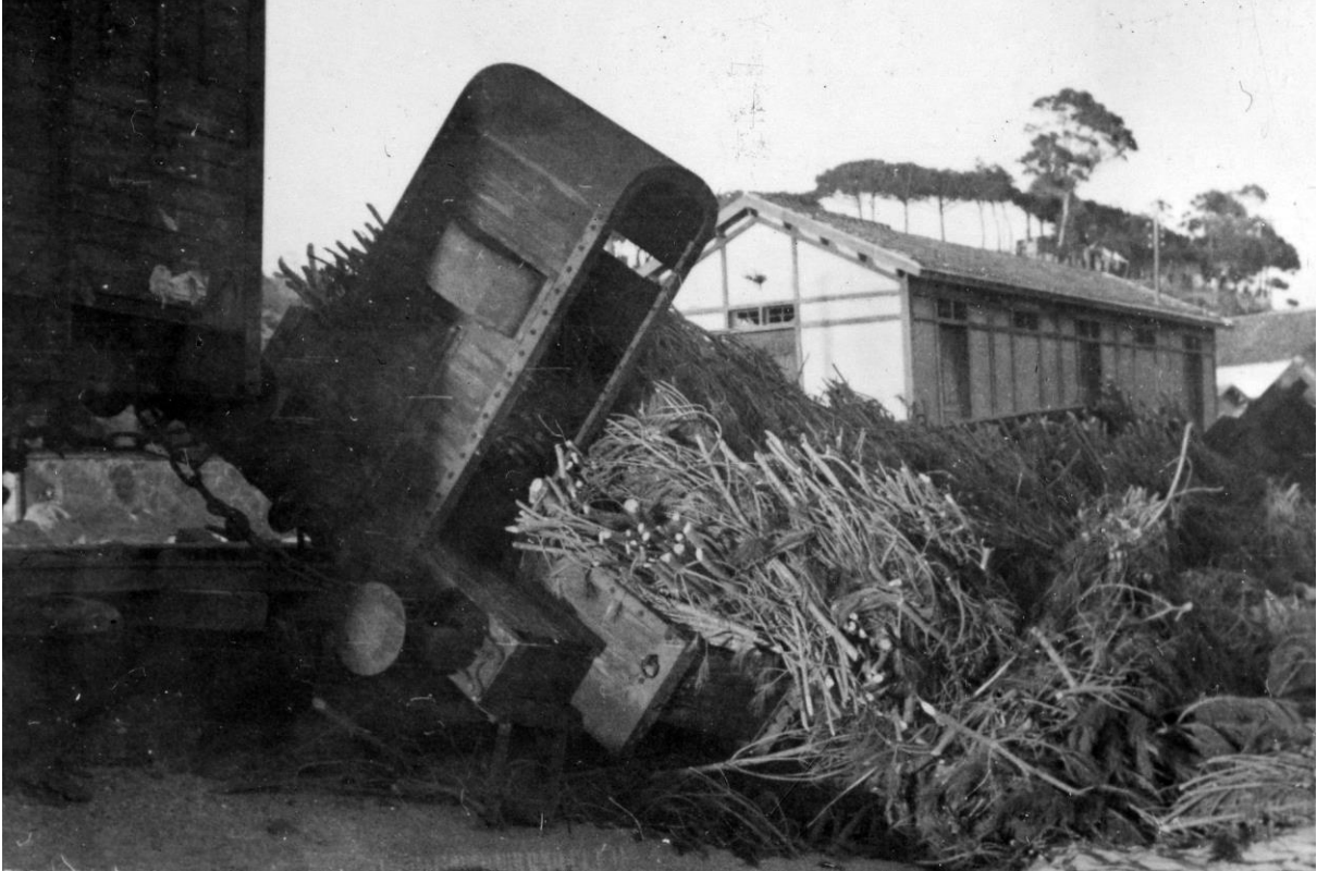
Costals de pino (parecen de piñonero), en un vagón de carga de un tren accidentado (1950)