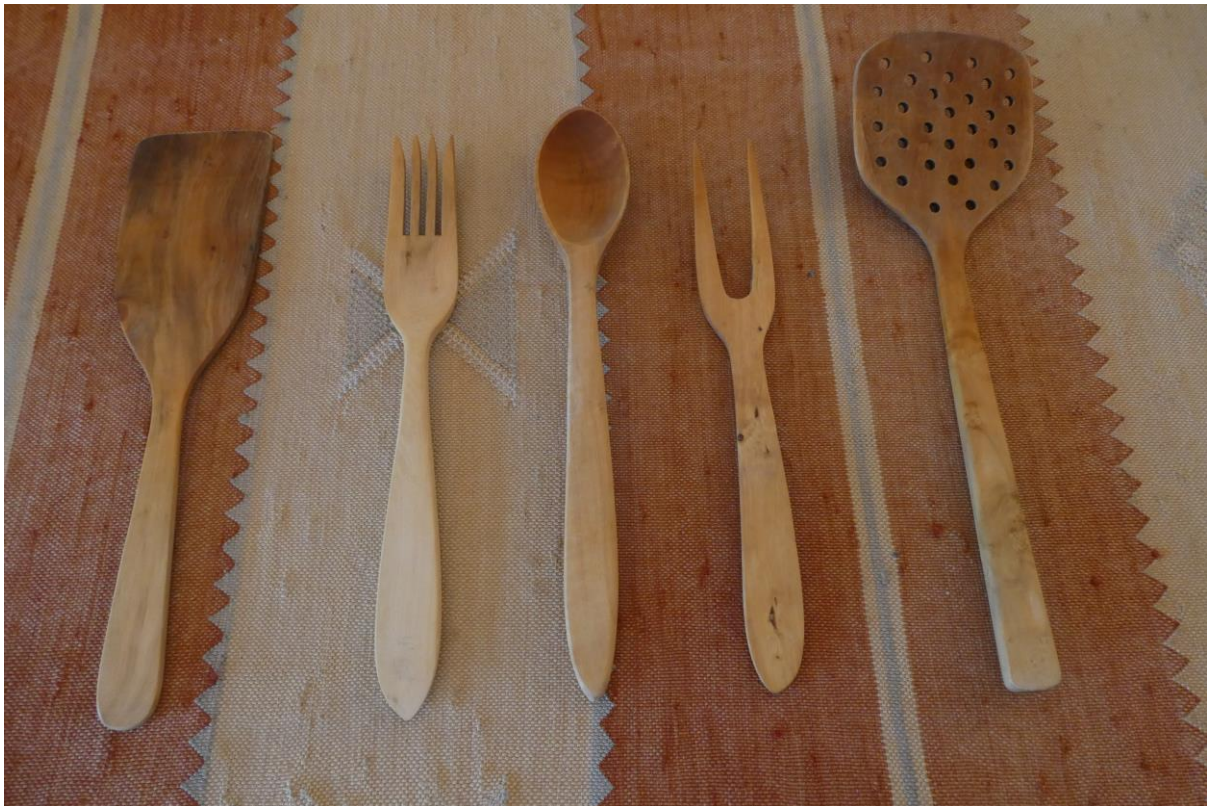
Utensilios de cocina de madera