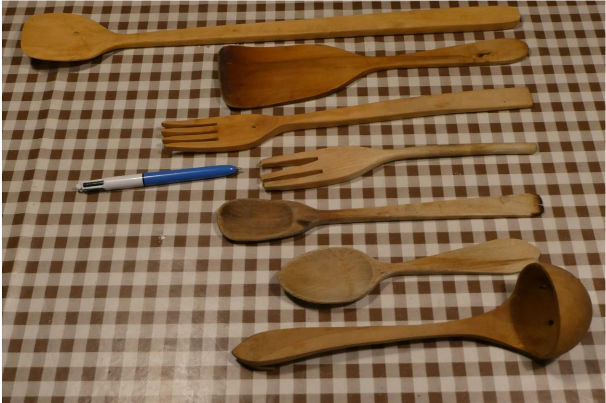
Utensilios de cocina de madera