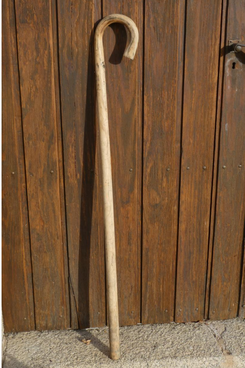
Bastón de pastor