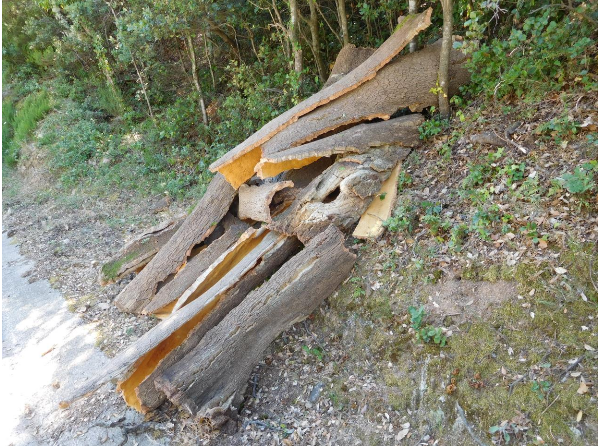
Pila de pannes de corcho, a pie de carretera en la Vajol (Alt Empordà, 2018)

Su transporte corre a cargo del comprador y es tradición que ese día, el amo del alcornocal pagase una buena comida a los carreteros y al resto de participantes de la saca.