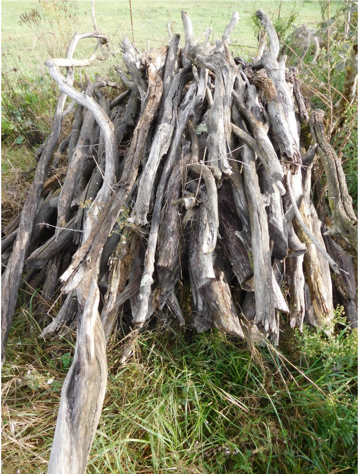
Pila de leña vieja de bosc de tall (foto: madroño, brezo,...). Mas Hostal de l'Arrupit (2021)