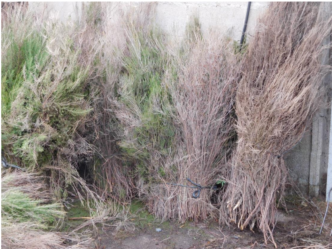
Feixines de brezo ( Erica scoparia ), para confección de vallas de ocultación