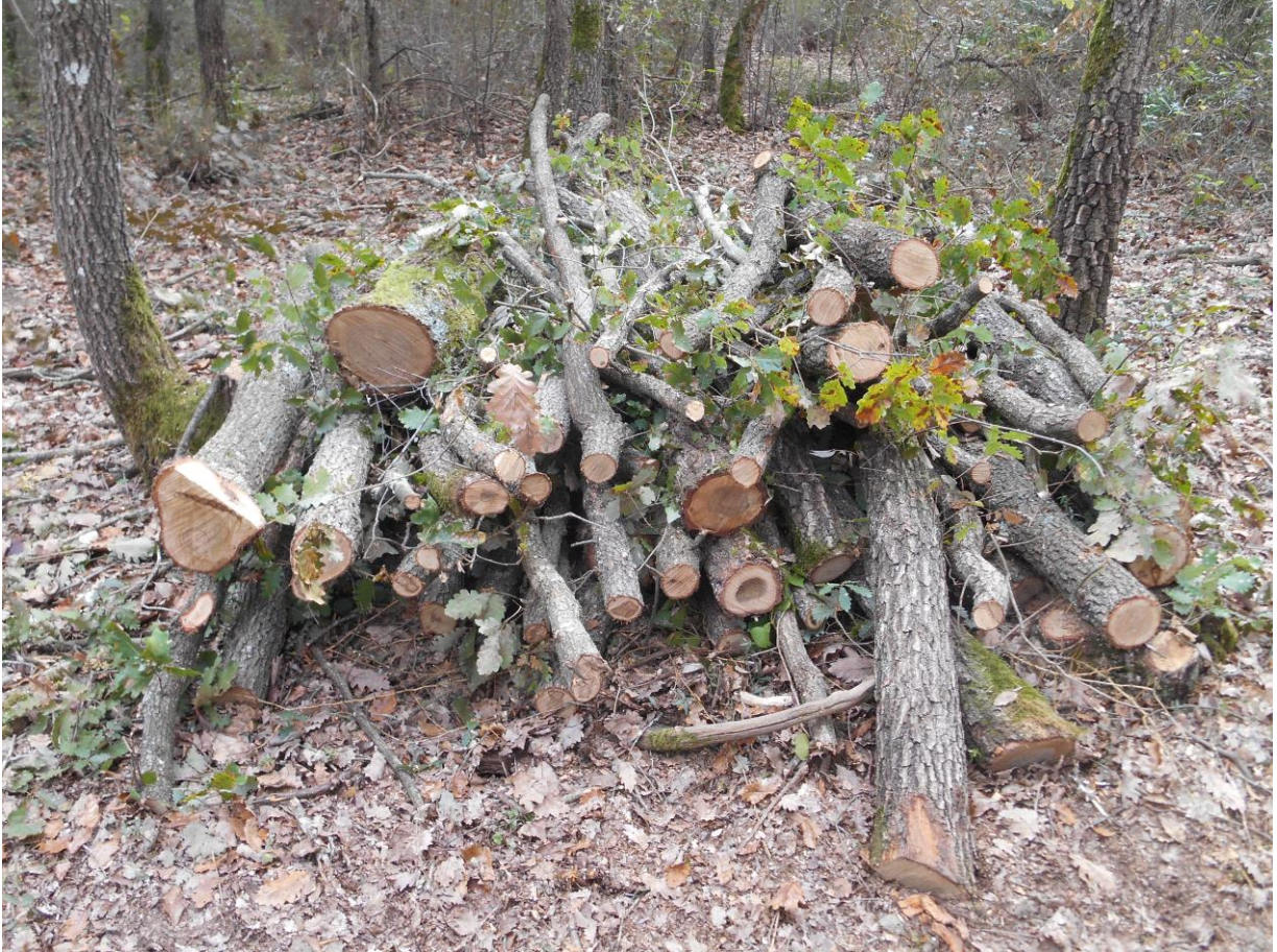
Pila de leña de roble, procedente de finca certificada sostenible.