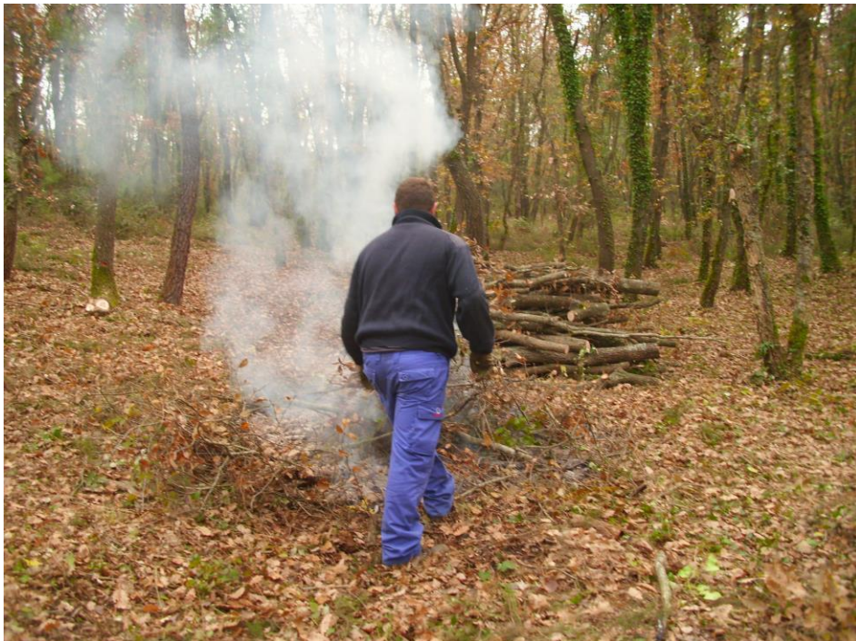
Prendiendo el fuego... Mas Hostal de l'Arrupit. Campaña de leña 2013

Se presenta un resumen sobre los bosquerols , del apartado Oficios, del capítulo Costumbres, que trata el libro Folklore de Catalunya , de Joan Amades (1980).