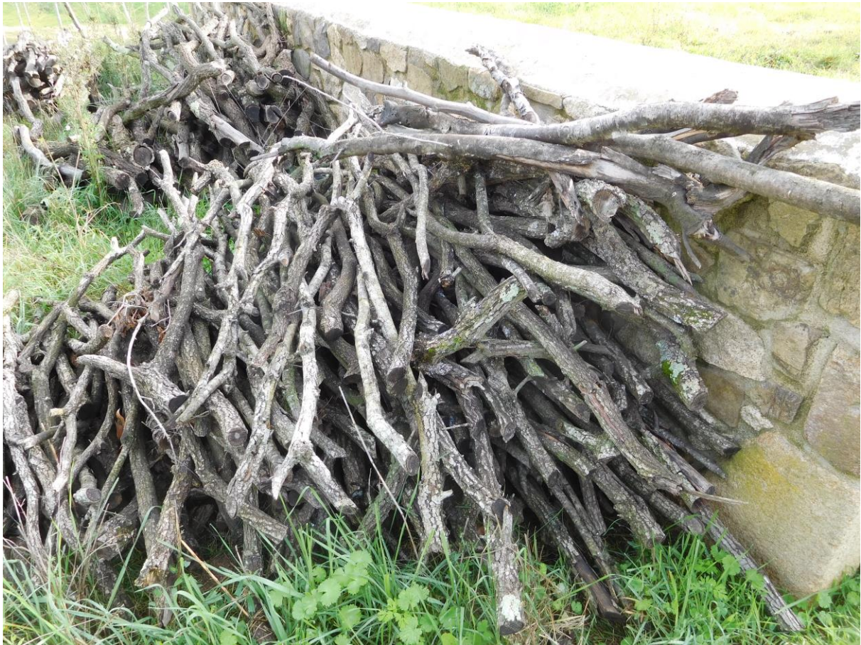
Pila de ramas secas de roble, obtenidas de un clareo para leñas. Mas Hostal de l'Arrupit (2021)