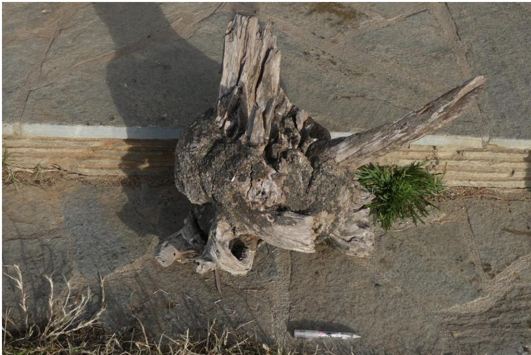
Cepa de brezo seca: leña perfecta, que quema como carbón vegetal. Mas Hostal de l'Arrupit (2021)