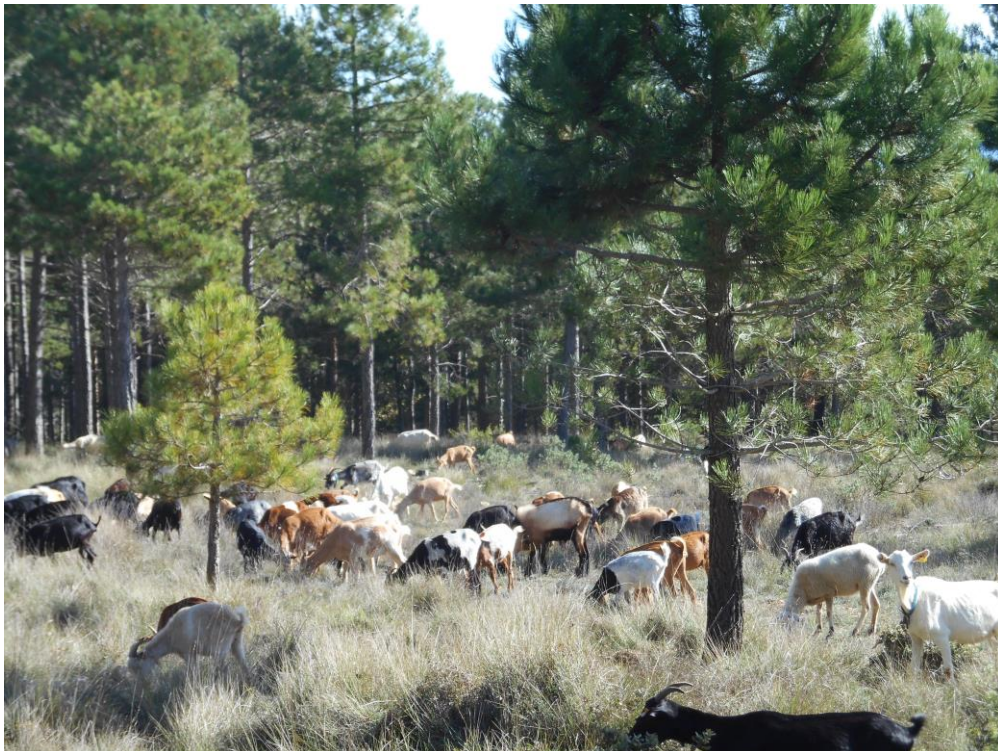
Silvopascicultura en Rojals. Montañas de Prades (2018)