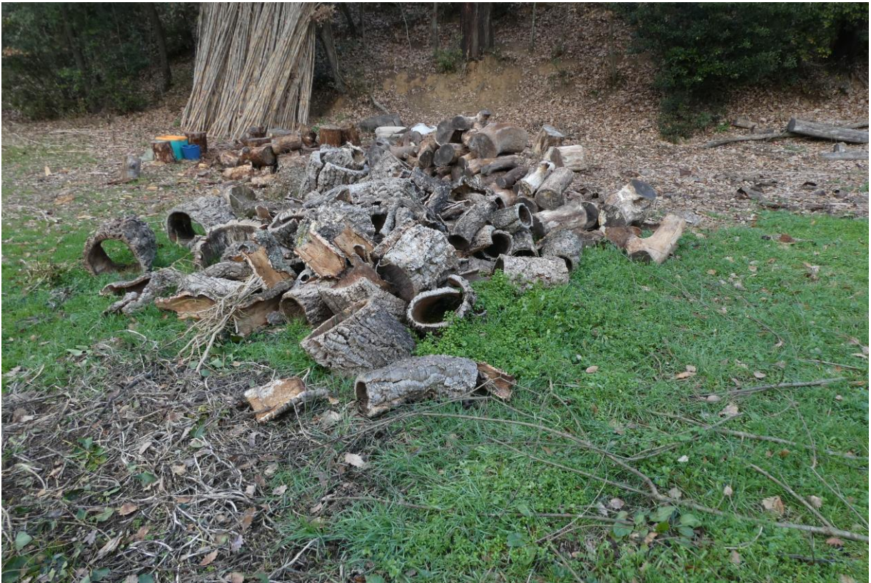
Leña de alcornoque pelada (dcha.), con bornizo y capa madre separados (izq.). Can Patufo (2022)