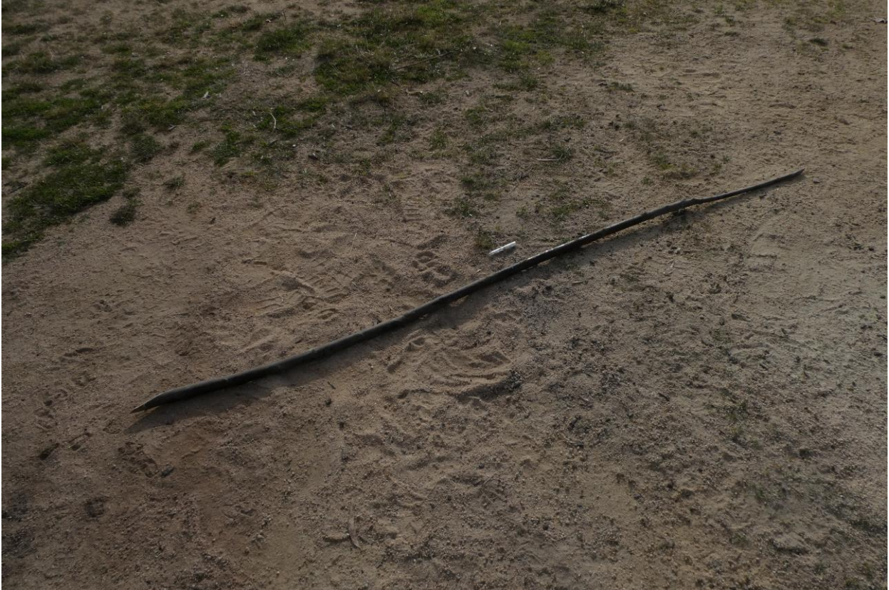
Aspre (estaca) de castaño para el huerto (230 cm aprox.)