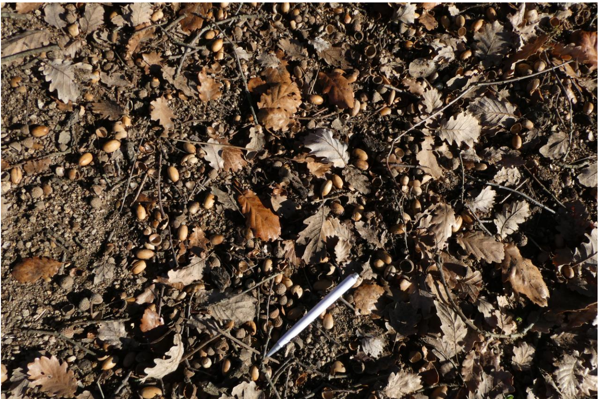
Bellotas de roble (son pequeñas, ha sido un año muy seco). Mas Hostal de l'Arrupit (2022)