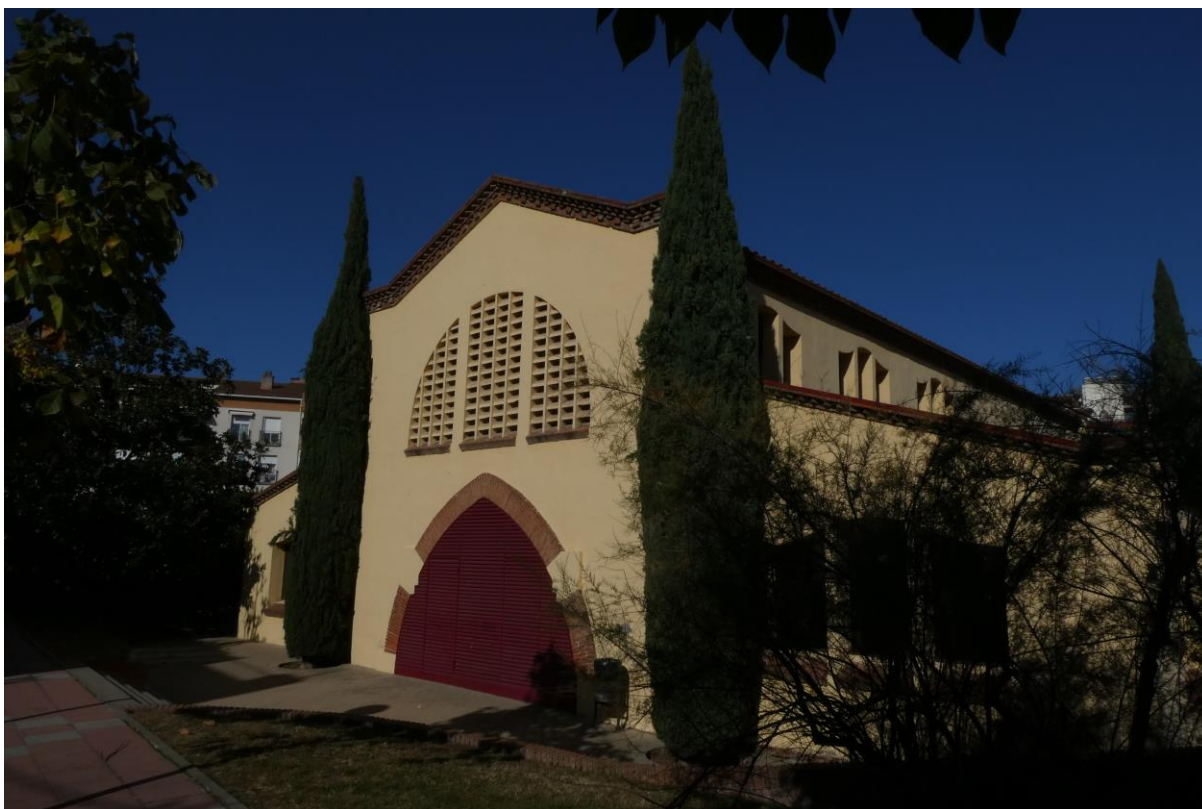
Escorxador municipal de Sant Celoni (1925-1927)