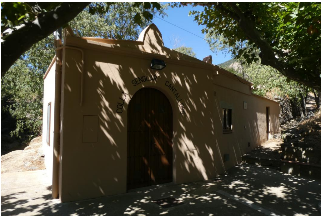
Equipament de la Colla del Senglar de Cantallops

https://www.arquitecturacatalana.cat/ca/obres/escorxadors-municipal-de-figueres