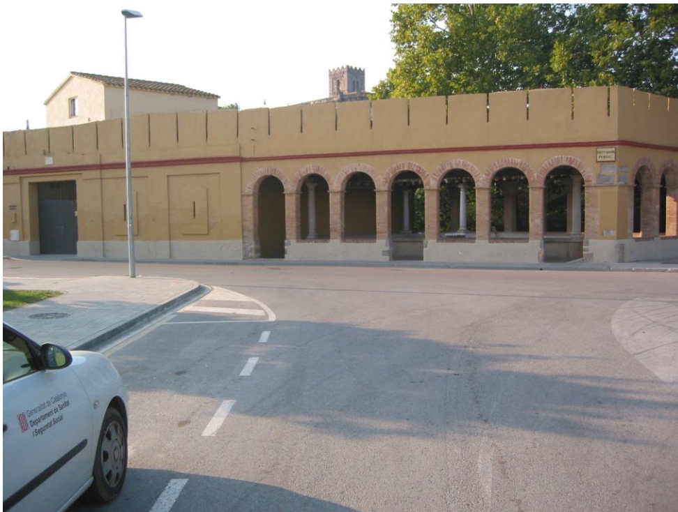
Antic Escorxador municipal de Castelló d'Empúries (porta a l'esquerra), aleshores Establiment de Manipulació de Caça (2005). A la dreta (arcades), el Rentador públic

En aquest apartat s'inclouen antics escorxadors municipals de titularitat dels ajuntaments i explotacions ramaderes d'animals domèstics (vaqueries i aviram, principalment) de propietat particular o de l'Administració, especialment les construïdes en els períodes de la Mancomunitat de Catalunya i de la II República espanyola. Les explotacions inventariades coincideixen amb el desenvolupament de l'avicultura científica (1896), el boví lleter (1950) i de la ramaderia intensiva d'altres espècies (1960 –inici de la fabricació i ús de pinsos compostos-). Aquestes construccions rarament estaran ara encara en actiu; han estat rehabilitades com a equipaments municipals (biblioteques, etc.), tal com s'indica. Una possibilitat real de reciclatge d'aquests edificis encara en desús per a una activitat alternativa similar actual, és la proposta que va fer el Grup de Treball de Caça, per aprofitar-los i engegar-los com a Establiments de Manipulació de Caça/EMC (Castelló d'Empúries -Alemany et al., 2005-) o com a renovats escorxadors comarcals de baix volum de sacrifici (Escorxador municipal de l'Armentera), fet que s'ha portat a terme en alguns casos com aquests.