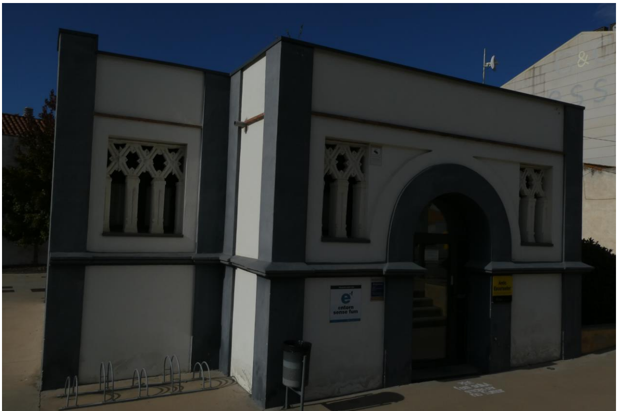
Escorxador municipal de Vidreres