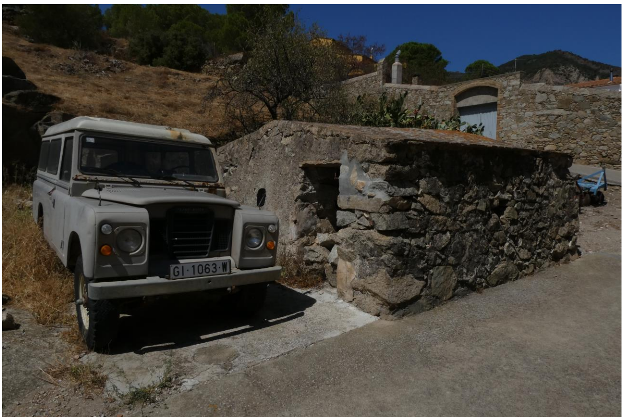
Cantallops: cort de porcs (2022)