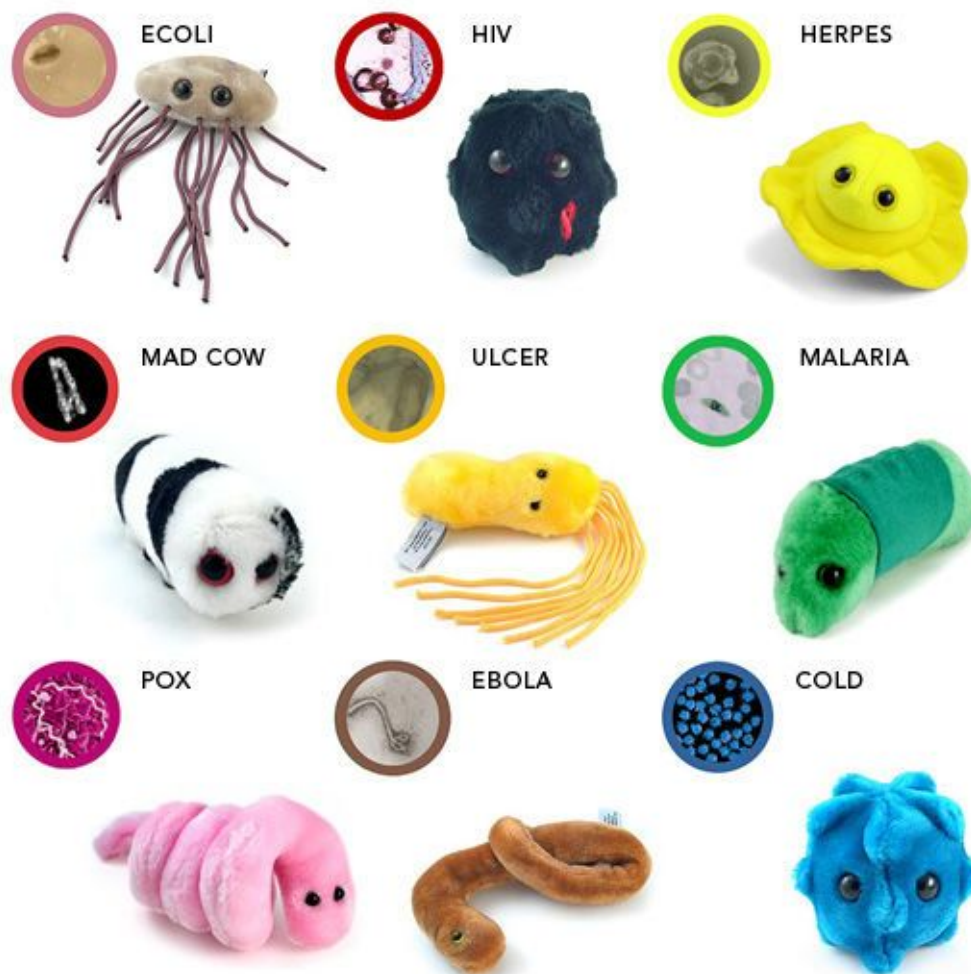
Diversité des Micropeluches

de 5 à 12 ans, auteur/interprète: Jordi Cardoner cie BAO, musique Alain Féral