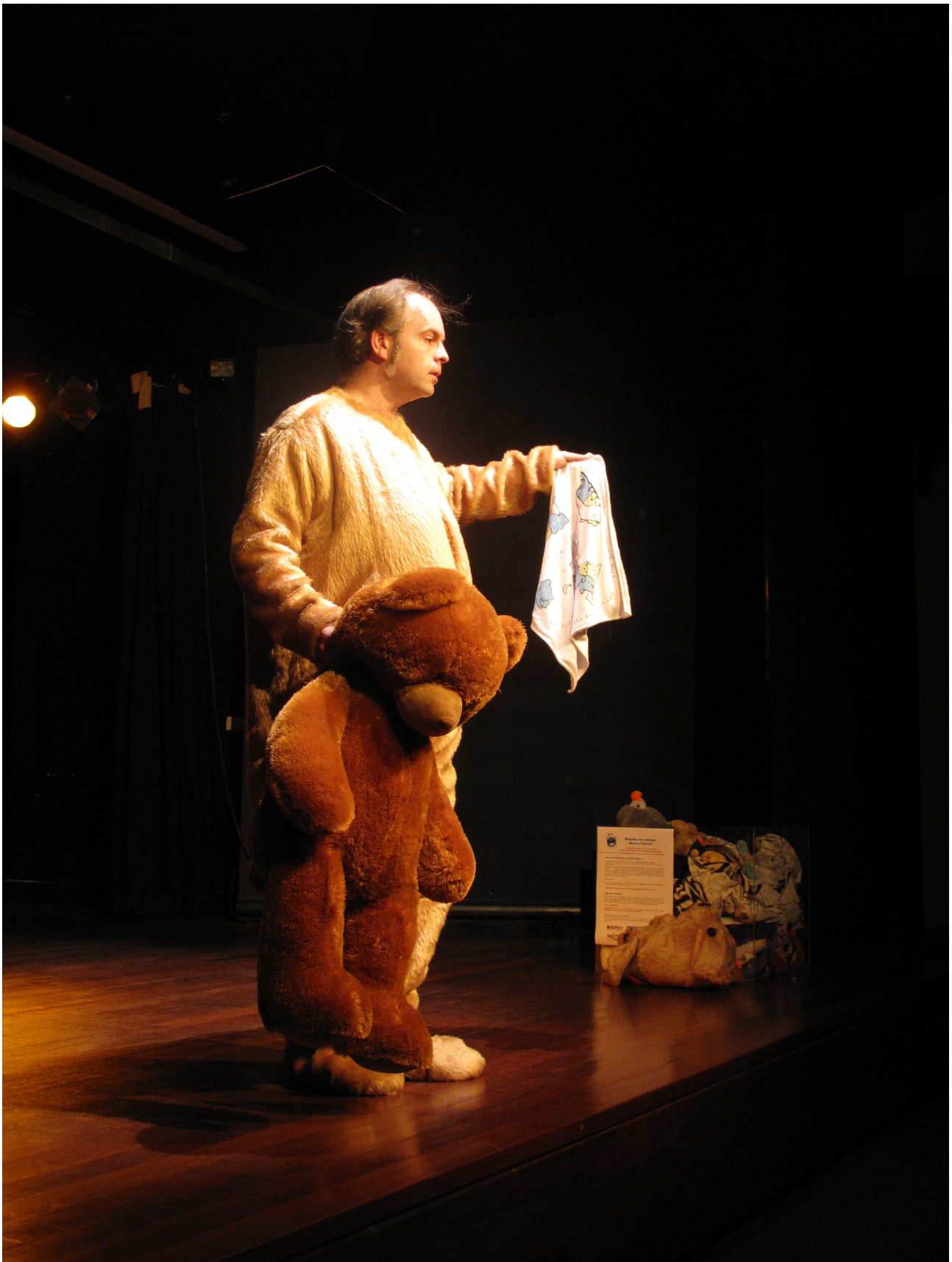
Le Comte de Pilou-Pilou comparant scientifiquement un doudou et une peluche.