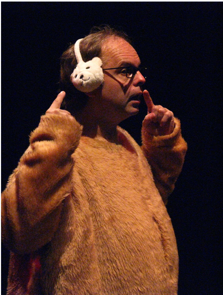
Utilisation d'un Capteur de pensées (Matériel offert par l'université de Montréal)

Nous le connaissons également dans le milieu jeune public, pour être l'auteur d'une trilogie de spectacles pour enfants qui est véritablement une relecture moderne de contes classiques : "Princesse Raiponce", "Blanche-Neige décongelée", "Cendrillon, combien tu chausse?".