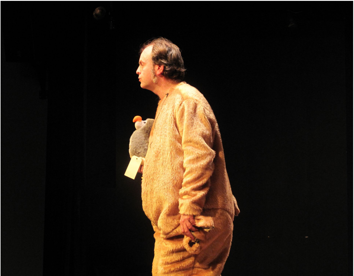
Le comte et son dodo pour faire dodo.