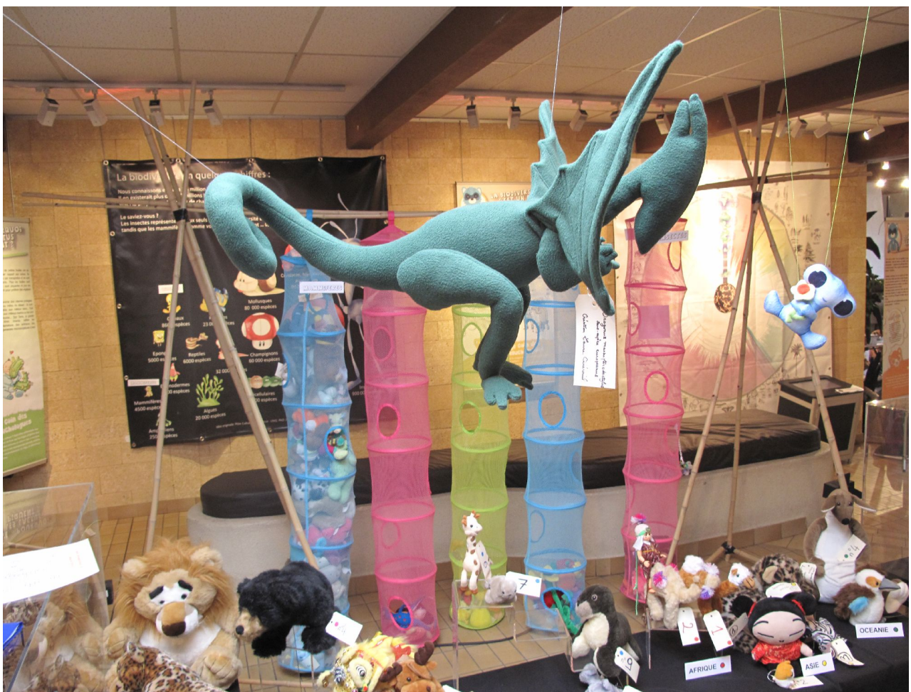
Les panneaux, et les installations diverses.