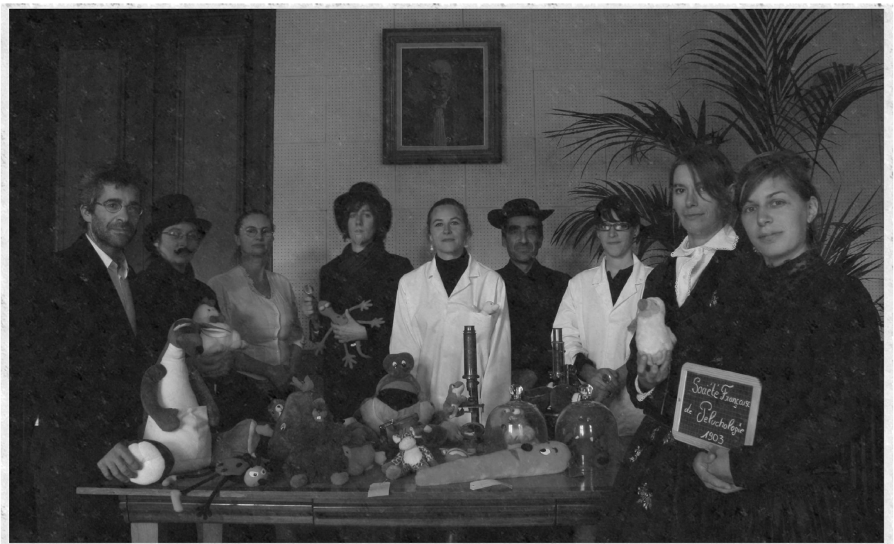
La société française de Peluchologie, créée en 1903.

Les enfants peuvent également apporter leurs propres peluches pour participer à cet inventaire. 12 panneaux, 8 vitrines de peluche, des bornes multimédias, des murs d'images, un studio-photo et d'autres éléments scénographiques constituent cette exposition étonnante et hors-norme.