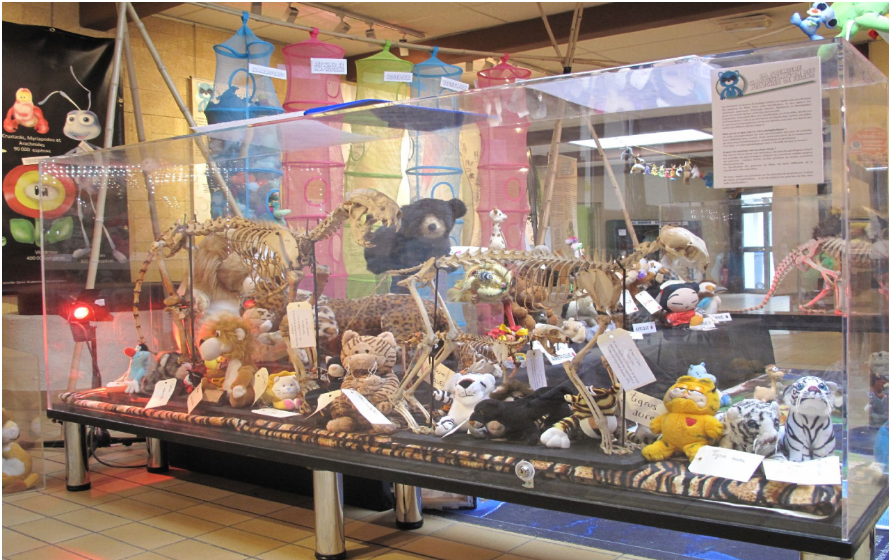
Les vitrines contenant les peluches.