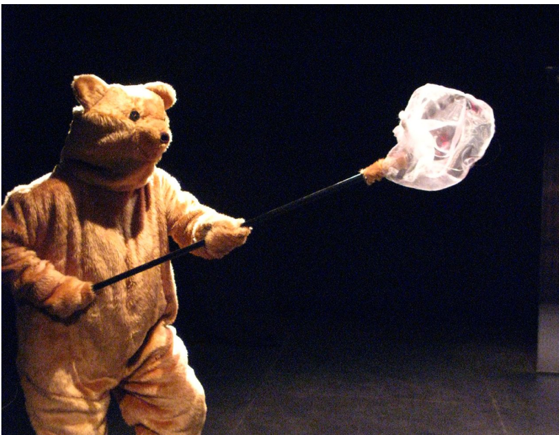
Chasse d'un Lépidoptera Pilosa (Papillon peluche)