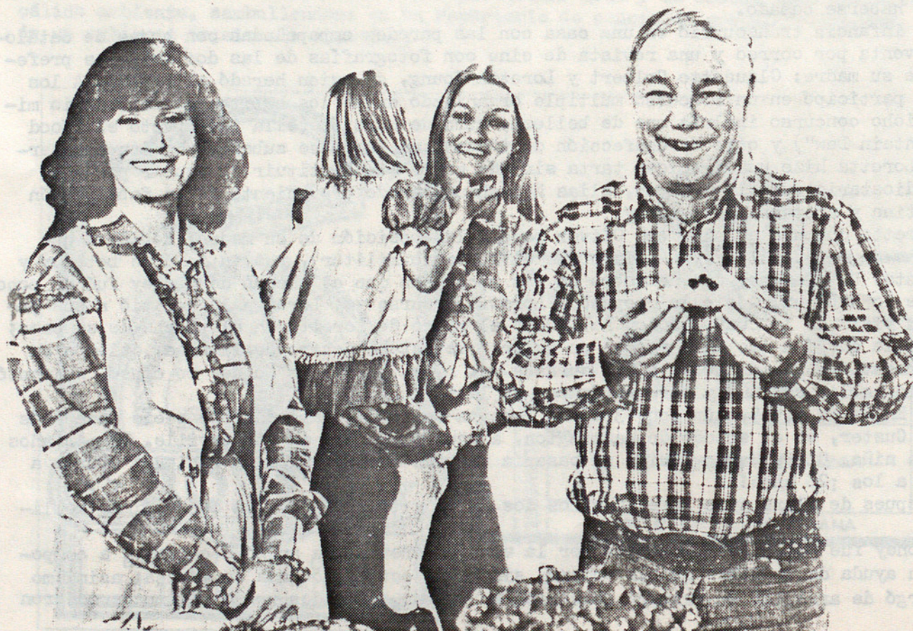
Loretta, Mooney, su hija Sissy y su nieta Beth Anne Lyle

Hasta el momento Loretta ha grabado cerca de 30 Lp's más otros 10 álbumes de duos con Conway Twitty. En todos ellos Loretta ha incluido canciones de otros compositores junto con temas propios, en los cuales ha ido contando su propia historia o la de personas que ha conocido, dando a su música (puro country, sin concesiones al pop) una sinceridad y una fuerza que pocos artistas han conseguido.