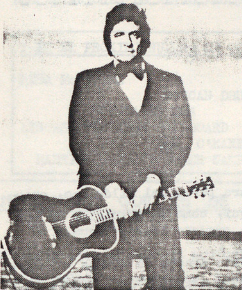
Johnny Cash, Man in Black