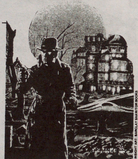
RESERVA ART. BARCLAY SHAWTON BOOKS