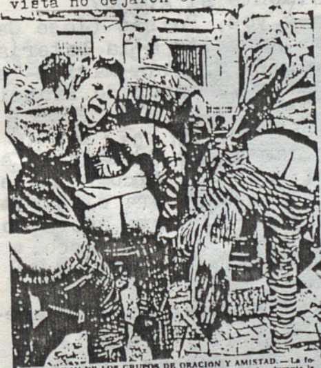
• REUNIÓN DE LOS GRUPOS DE ORACIÓN Y AMISTAD. — La fo- tografía recoge un momento de la celebración de la misa durante la XII Reunión anual de los Grupos de Oración y Amistad, presidida por Monseñor Josep Maria Cases i Doval, obispo de Segorbe-Castellón y creador de este movimiento de vida cristiana. Los grupos de oración viven el compromiso de la plegaria en comunión con toda la Iglesia, en especial con el mundo del dolor y con la actividad de las misiones. Por esto cada grupo está en relación con un enfermo, con un misio- nero y con un convento de vida contemplativa, para expresar la fecun- didad de la plegaria y del dolor en la vida apostólica de la Iglesia.

Conclusiones extraias tras la entrevista de La Unión en Tiempos de Locura: ¿No será que las multinaciona- les, ante el poderío que están adquiriendo las indies se inventan a sus grupos semisinistroides para in- tentar joder a las independientes dentro de su pro- pio circuito? Lo digo porque durante toda la entre- vista no dejaron de criticar a las cias indies.