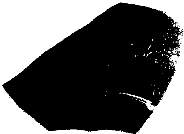
Fig. 2. Fragmento conservado del plato de TSA A-2, con la inscripción ibérica que se estudia.

La inscripción aparece en un plato de la forma Hayes 27, 1-2 = Lamboglia 9 A de la TSA A, que presenta las características típicas de la frase productiva que denominamos TSA A-2 4 . Este plato procede de las officinae ce-