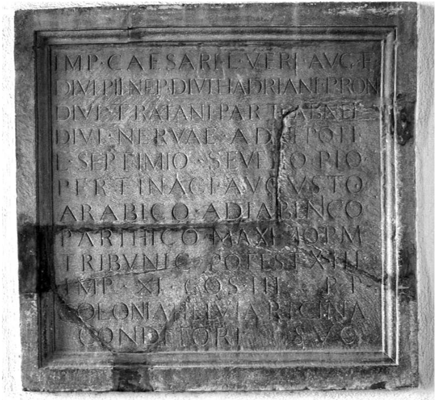
Figura 3. CIL IX 5747 (Helvia Ricina Pertinax).