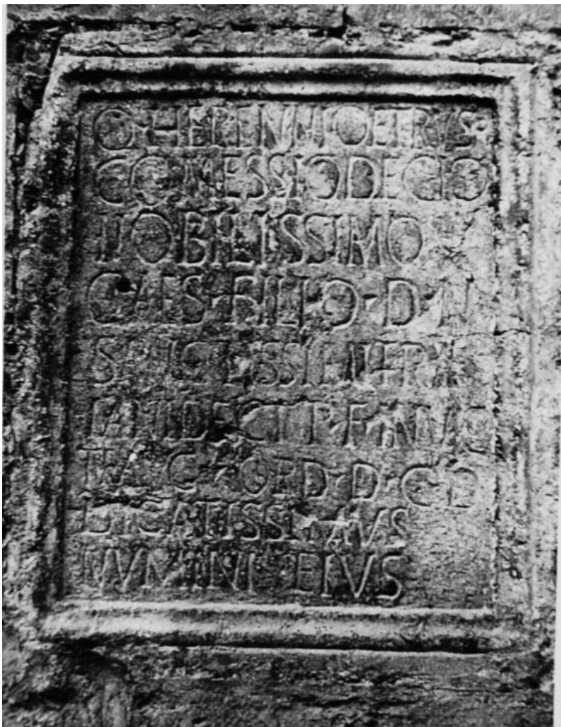
Figura 1. CIL II 2 14, 788 = CIL II 4058 ( Dertosa ).

Evidentment, amb aquesta opció, ens alineàvem amb la posició de R. Wiegels, en el seu estudi sobre les tribus de les ciutats hispanes 2 . Una de les causes per haver adoptat una posició d'aquest tipus tenia com a arrel la definitiva exclusió de l'encunyació pertanyent a Dertosa de les monedes que s'havien llegit tradicionalment