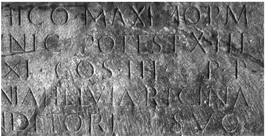
Figura 4. Detall de CIL IX 5747.