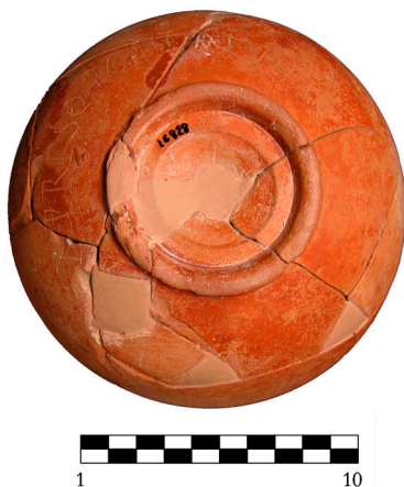
Figura 2. Cerámica TSH con grafito.