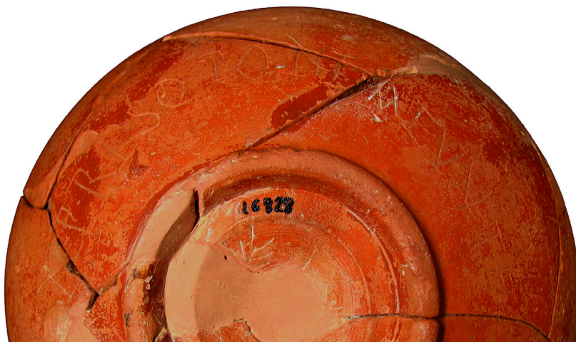
Figura 3. Detalle del grafito.

de cerámica romana con inscripción Post Coctvram del Museo de la Romanización en Calahorra», Kalakorikos 14, p. 213-226 ( Eutychetis pone ). Para Pone fur : CIL XV 6899 ( Pone fur ); cf. HEp 7 (1997), 405 ad. ( Saronis pone fur , Alcalá de Henares); J.M. ABASCAL y R. CEBRIÁN (2007), «Grafitos cerámicos de Segóbriga (1997-2006)», Lucentum XXVI, p. 127-172 (p. 151, n. 133: [---] pone fu[r] ). Otras expresiones con pone : cf. J. GORROCHATAGUI (2009), «Vaso antiguo: algunas cuestiones de geografía e historia lingüísticas», Palaeohispanica 9, p. 539-555 (p. 551: ([---] pone aut pidico , Iruña-Veleia). Sobre la lectura de poni en lugar de pone , véase: J.M. ABASCAL y J.R. LÓPEZ (1993), «Inscripciones latinas de Sayatón. (Guadalajara) en Territorium de Ercávica», Wad-al-Hayara 20, p. 357-364 (p. 362, figura 3: [---] ne panna sum poni [---?]).