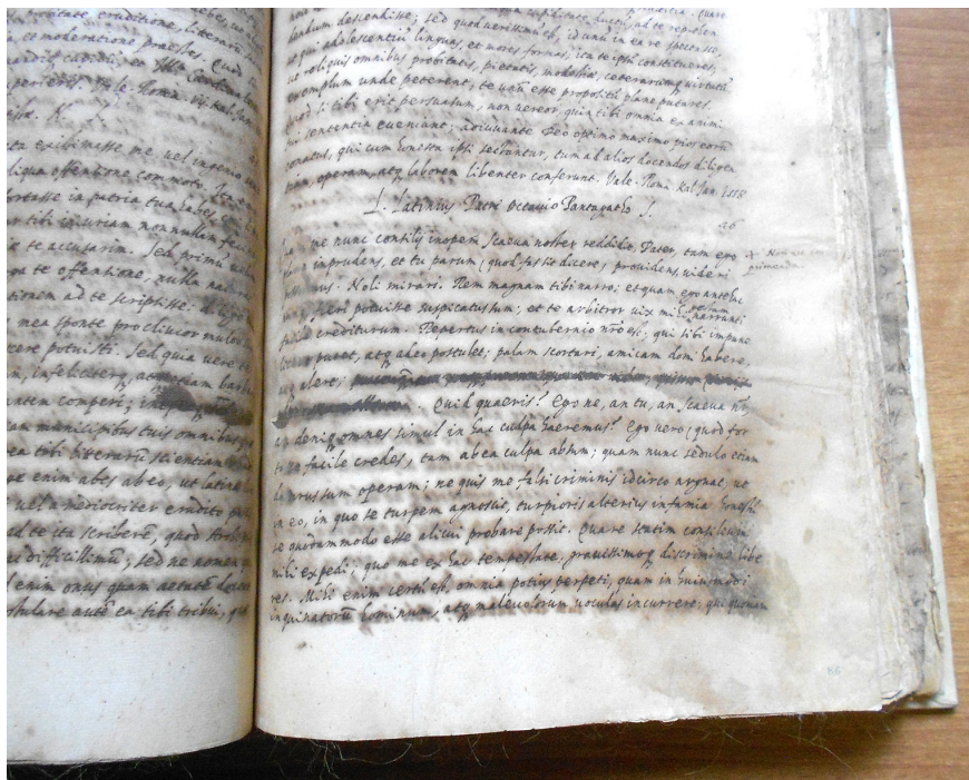
Figura 1. MS Vit. 8bis f. 86r.

enim certum est omnia potius perpeti quam in huiusmodi inquinorum hominum atque maleuolorum uoculas incurrere; qui quoniam domestici sunt et uitari nullo modo possunt alia ratione continendi erunt. Eam autem unam optimam esse semper putavi, si nullam de me loquendi aut suspicandi uel leuissimam occasionem darem. Quare pro tua prudentia considerabis, <quid fraus> fiat quaque ratione apud Scauam excusatum me praestes, hominem neque leuem neque impudentem tui certe atque illius amantem et studiosum. Vale. Prid(ie) Id(us) Decemb(ris) 1556.