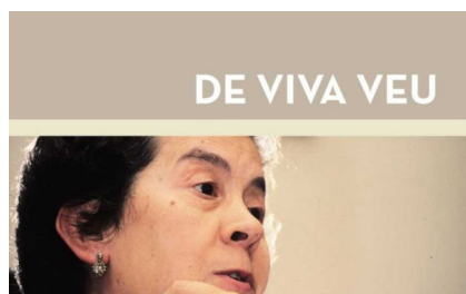
DE VIVA VEU