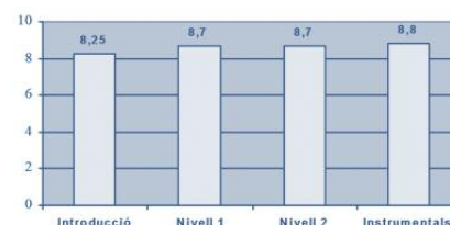
Nivell de satisfacció dels participants segons modalitats formatives.

Pel que fa al nivell de satisfacció dels participants, aquest ha resultat similar en tots els cursos oferts, amb una puntuació mitjana de 8,6 sobre 10. Un resultat positiu que ens indica la satisfacció de la docència rebuda.