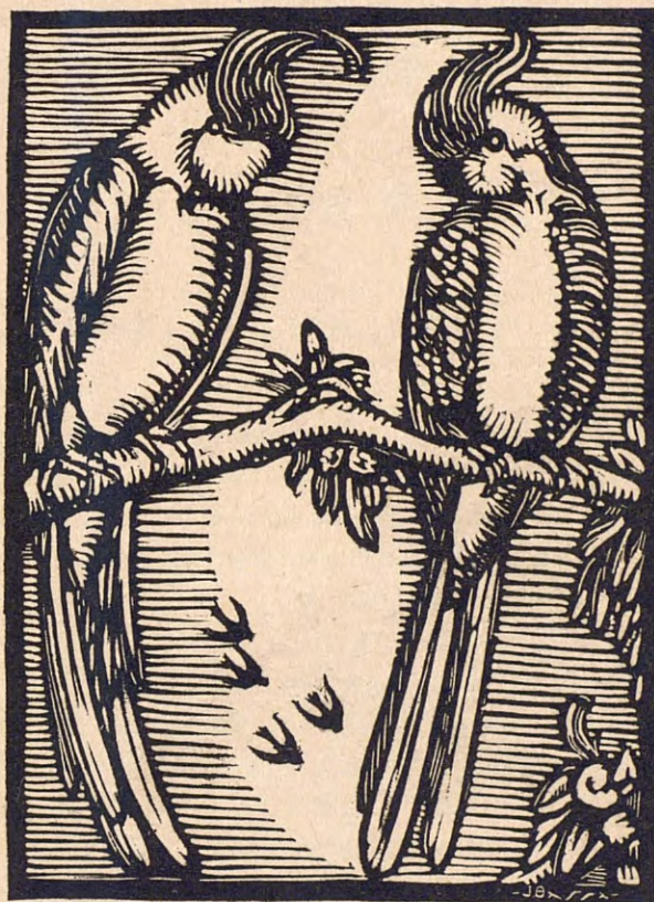
Gravat al boix per J. Bassa Ribera.

SUMARI: Paisatges espirituals. Gravat al boix, per Oriflana . — Flor de febrer, per Josep Cardona, pure . — Evocacions de joventut, per Júlia Victòria . — Bibliografia. — El boix, per Segimon Vendrell . — L'amor novell de la donzella, per Josep Carner i Ribalta . — Cròniques d'art. Exposició Planas Dòria, per Joan Matas . — El Teatre Liric Català.