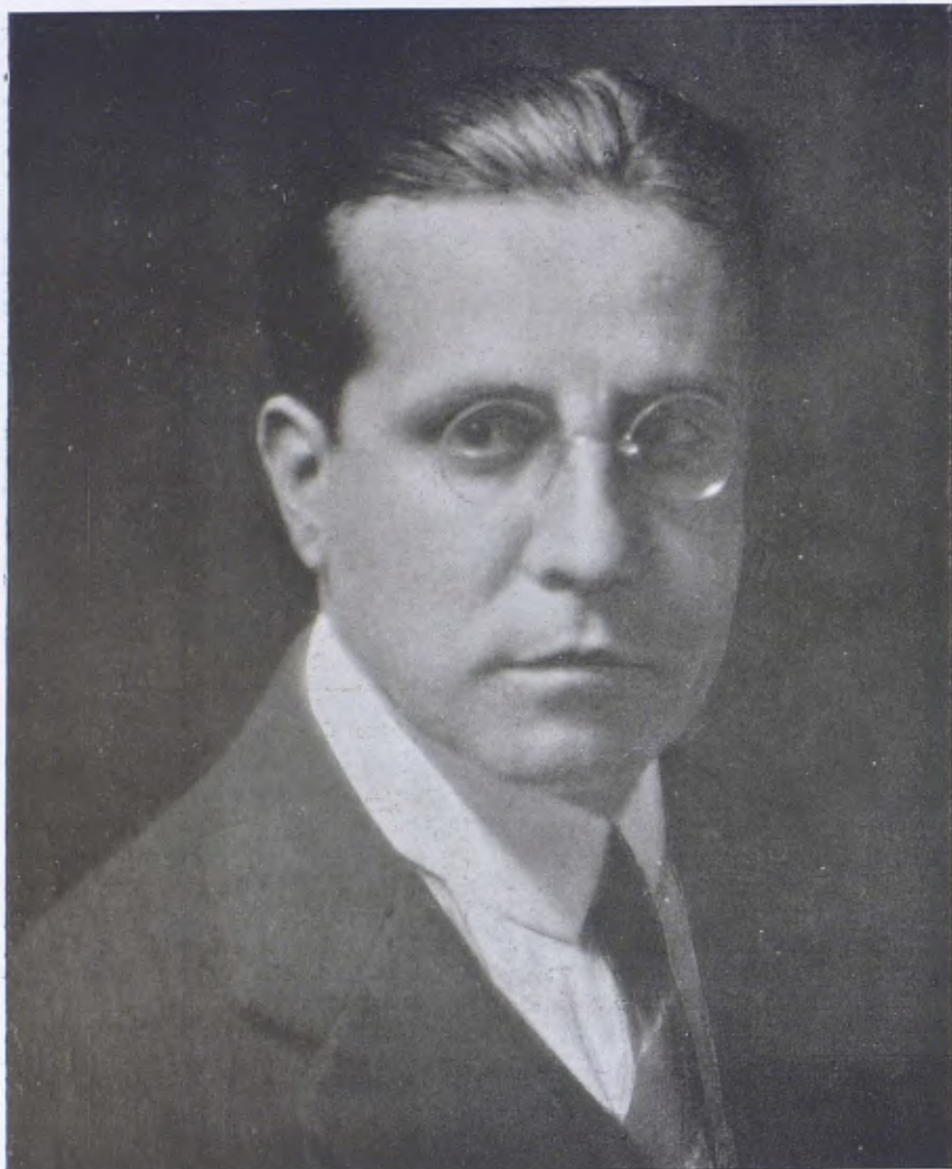
El pintor Domènec Carles.