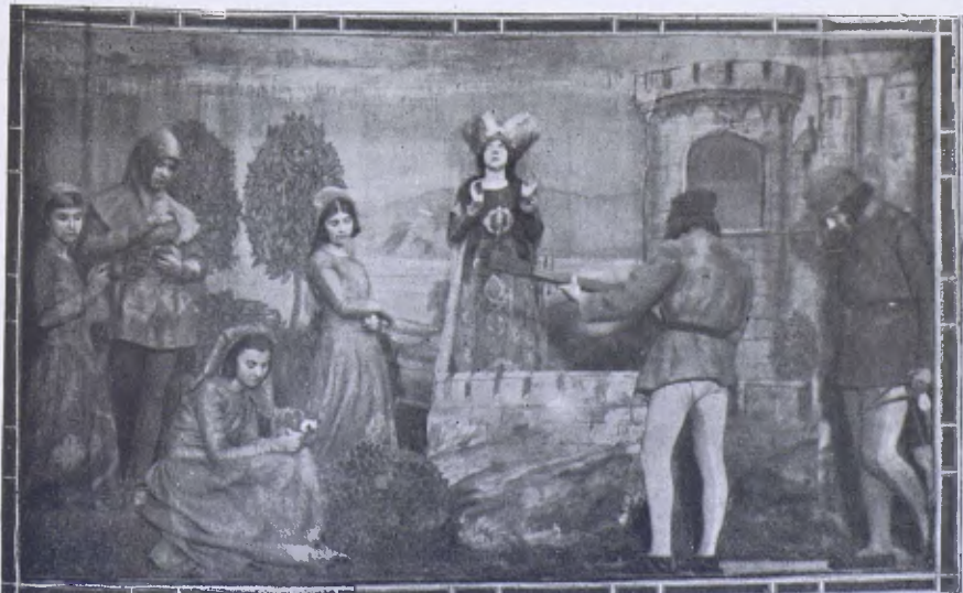
Una escena d'«Els Tapissos de Maria Cristina».