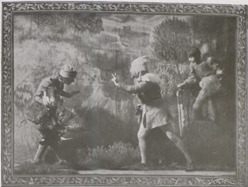
Una escena d'«Els Tapissos de Maria Cristina».