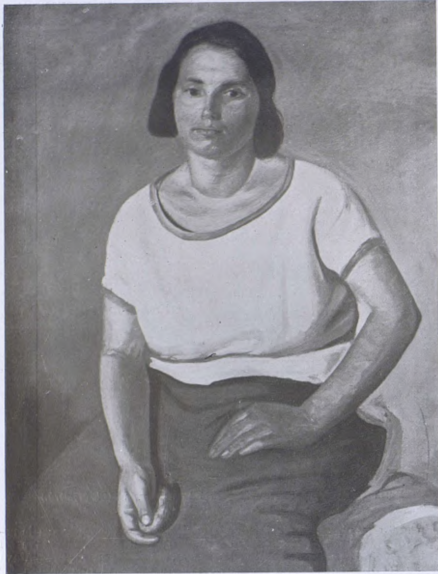
«Retrat de dona» a l'Exposició del pintor Llavenera, a les Galeries Laietanes.

«l'herba per a les bèsties, a quina hora aixecaria el camp l'endemà, quin camí pendria com el més segur i en quin ordre faria marxar les tropes. Així havia tan bé exercitat el seu esperit des de sa infantesa, per meditacions semblants, que res no podia sorprendre'l en la guerra, que ell no hagués ja entreuist i no hagués resolt per endavant.»