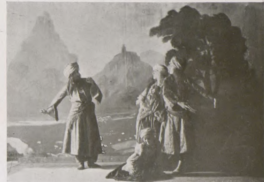
Una escena de «La Pastorale Comique» de Molière.