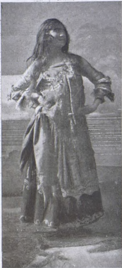
El Teatre Masriera.—Gitana en l'obra «La Reineta s'espera».

tar, que és el més difícil i gentil de tots. Certament, els salons literaris de la França, que tant influïren i influeixen en la vida artística i literària i en la cultura d'Europa, no haurien nascut pas en les sales d'un hotel i entre els acords d'una música de salvatges. I és per això que a França, a l'Anglaterra d'avui encara, la noble gent no hi va a dansar pels cafès i a fer amistats pels cafès, sinó que encara es reuneixen a casa i conversen a casa i ballen a casa. Als cafès a dansar, a l'Anglaterra no hi van els senyors, i a França, hi van una mena de gent que els senyors barcelonins, quan són a París, els prenen pels senyors francesos i no ho són.