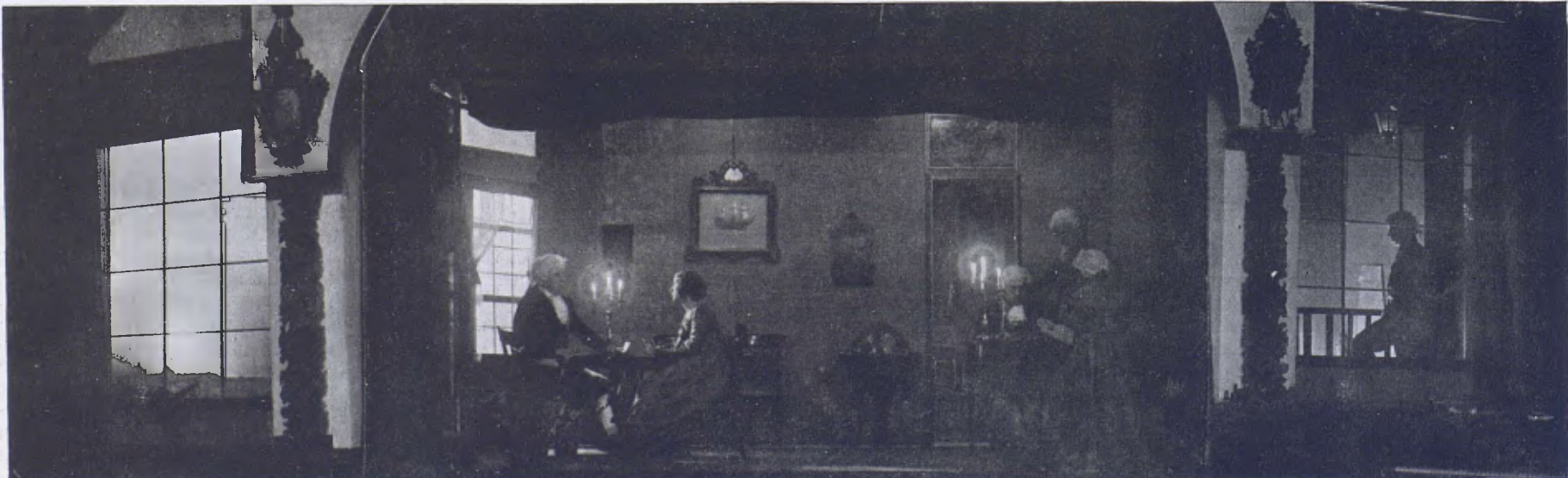
El triple escenari del Teatre Masriera, durant la representació de «La Bossa».