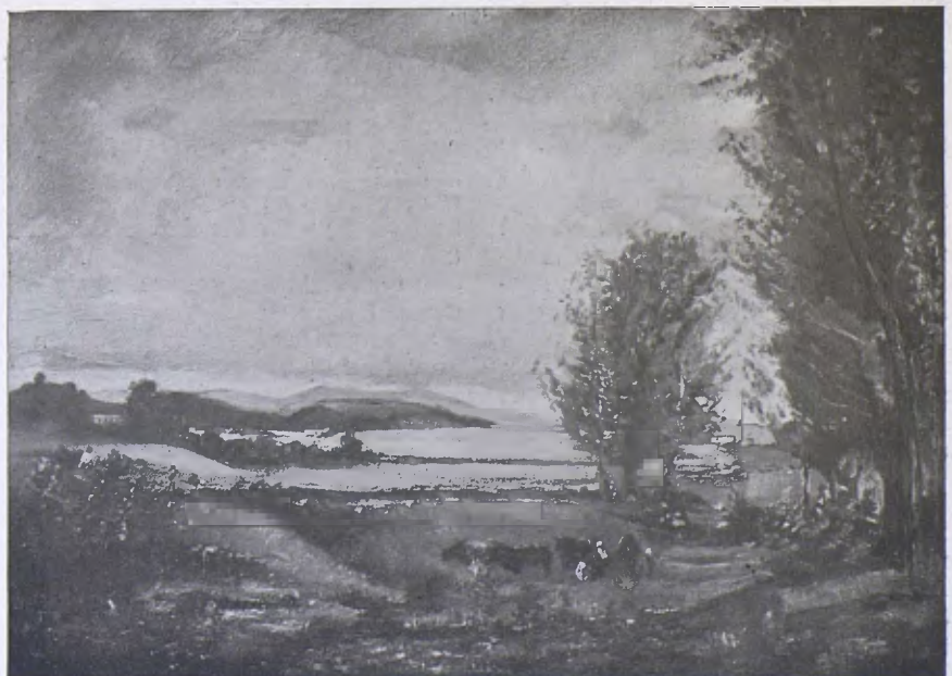
DOMÈNEC CARLES.—«Paisatge.»—Exposició de «El Camarín». (Cl. Mombrú.)