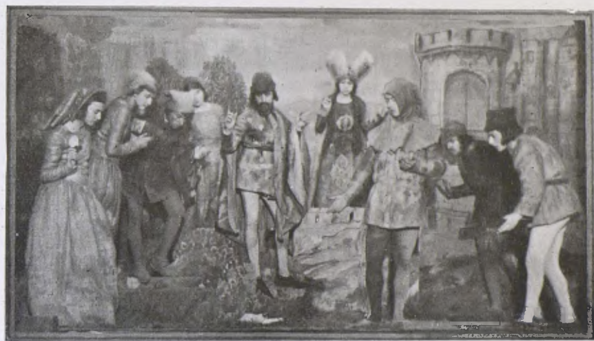
Una escena d'«Els Tapissos de Maria Cristina».

Permeti'm, doncs, que, abans de començar, els hi faci dos quartos de lo que són aquestes reunions, del per què d'aquests spectacles i quina finalitat tenen.