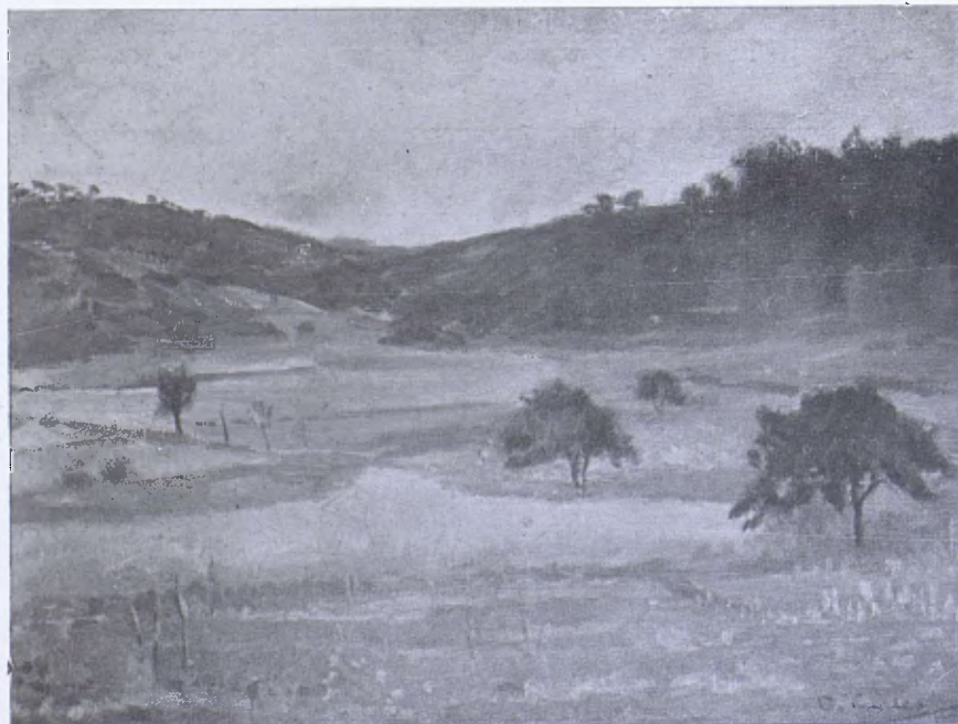
DOMÈNEC CARLES.—«Paisatge.»—Exposició d'«El Camarín».

Superstizione di Ernest Blumchen è un quadro fantastico nel quale il pittore si serve con abilità dei valori cromatici propri al soggetto. Ammirabile in primo piano è una faccia di pellirossa fortemente rilevata e potente nella sua immobilità di sfinge. Eugene Higgins ha un quadro Sgombro , singolarmente condensato e robusto nei toni bassi e un po' terroso. La forza operosa e