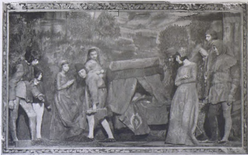
Una escena d'«Els Tapissos de Maria Cristina».