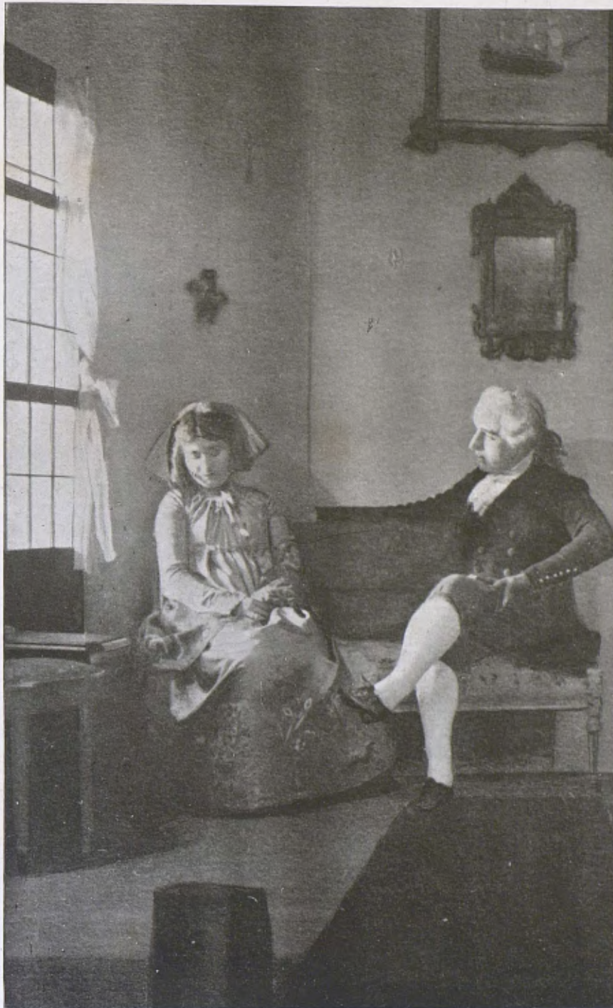
El Teatre Masriera. — Una escena de la comèdia «La Bossa». (Adaptació de Baizac per Lluís Masriera.)

A can Masriera es veu que aquesta tradició del teatre no s'ha interromput mai, i que bé que fins ara no ha transcendit a l'esfera d'un públic extens d'amics i coneguts, el caliu hi era i el teatre s'anava fent, i