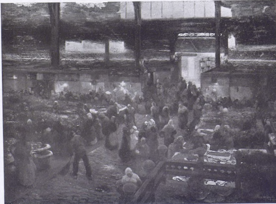
RICARD URGELL. — El Mercat. — Museu de Belles Arts

Cap d'ells és arribat sençer fins als nostres dies, i les dues peces s'han separat, sovint per manca de coneixement de l'objectiu que te-