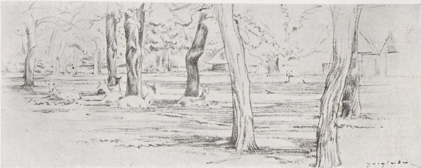
PERE INGLADA. — «Bosc de França amb cèrvols»