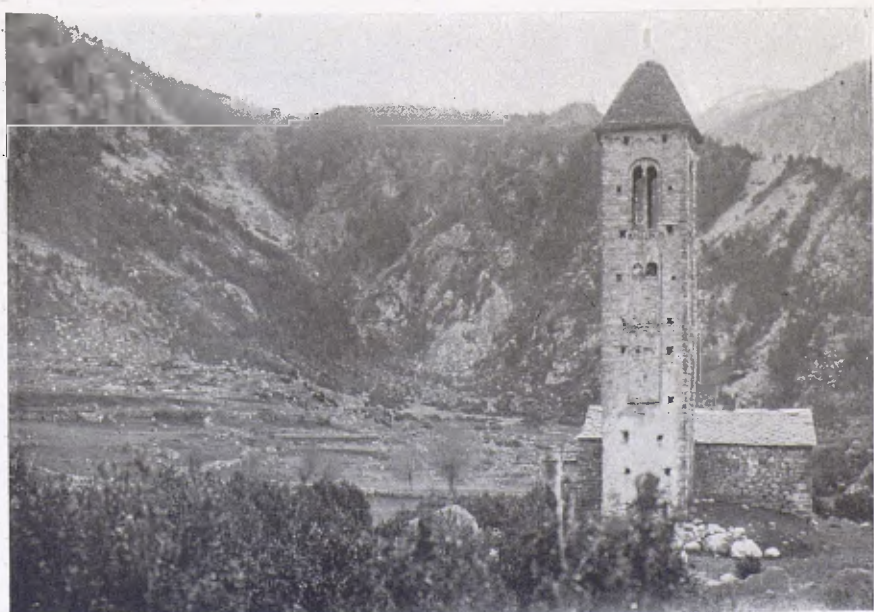
L'ermita de Sant Miquel d'Angulasters, a la Vall d'Andorra, amb el seu alt cloquer romànic del segle XII.