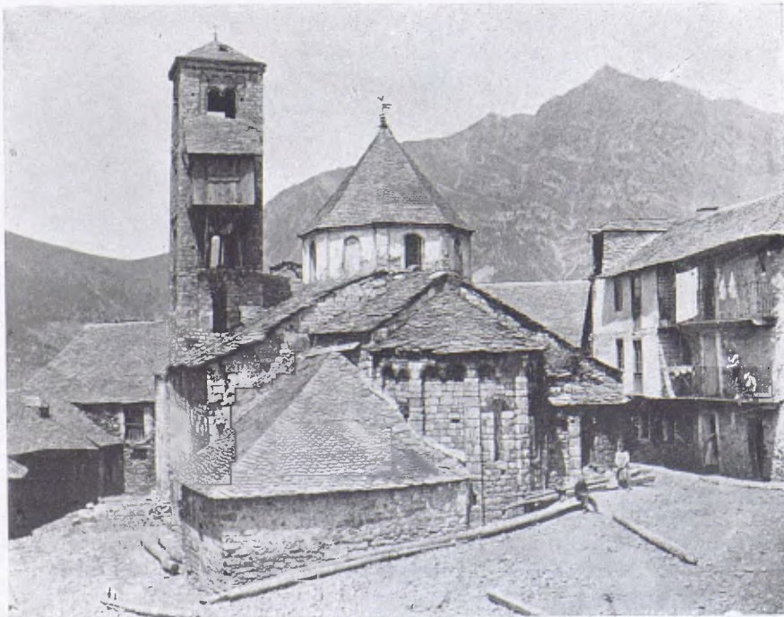
La plaça del poble de Tahull amb l'església de Santa Maria.