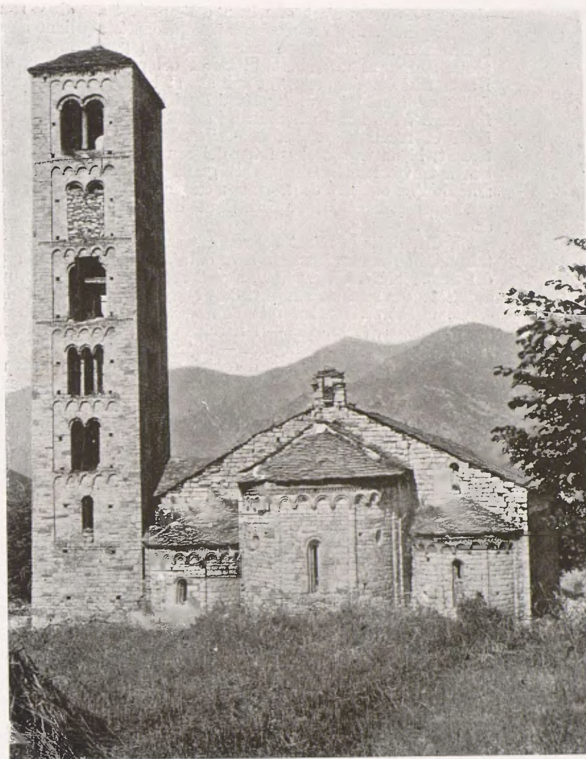
L'església de Sant Climent de Tahull, vista per la banda dels absis, amb el seu cloquer romànic.

«Aquest primer grau és en pintura ço que és la gramàtica en literatura: una preparació general necessària a tots, sia el que sia el gènere a què l'alumne voldrà dedicar-se un dia. Es amb raó que el talent de dibuixar, modelar i emplear els colors ha estat anomenat el llenguatge de l'art; i els honors i recompenses que veniu de rebre diuen bé prou que en aquests estudis heu fet progressos considerables.