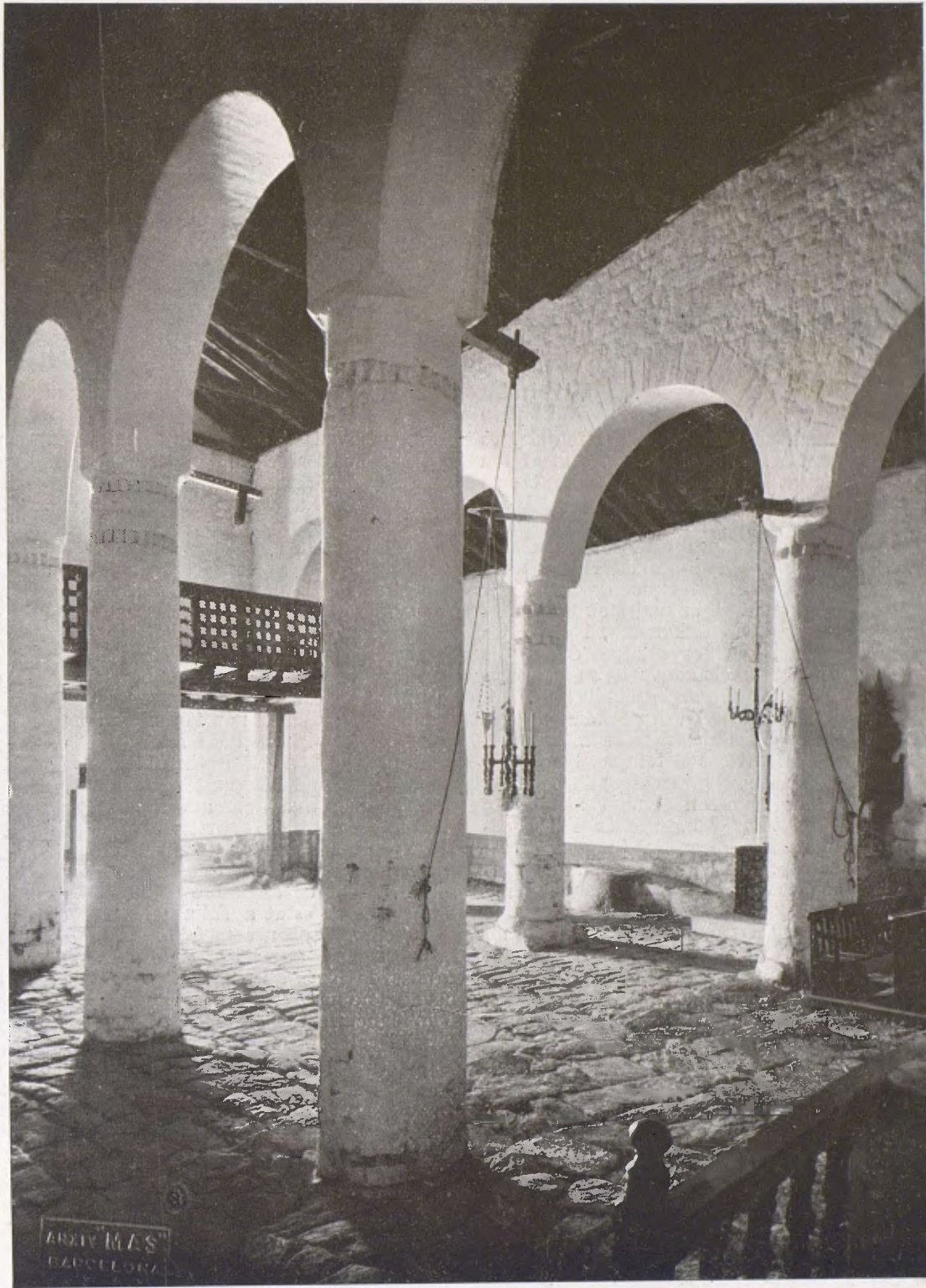
Fig. 1.—Interior de l'església de Sant Climent de Tahull, consagrada l'any 1123.

Els temples on hi havia les pintures són tots al Pireneu: la Seu d'Urgell, la Vall d'Andorra, la Ribera de Cardós, la Vall d'Aneu, la Vall de Bohí i Pedret, a les muntanyes de Berga. No és que en altres indrets de la terra no hi hagués hagut esglésies pintades. Probablement ho foren la majoria, i encara avui Pireneu enllà cap a l'Aragó i al Rosselló, i cap ençà en la Plana de Vich i en el Vallès, se'n conserven algunes. El que hi ha, és que el Pireneu ha guardat les coses velles més que la terra baixa, on els cor-