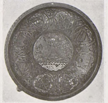
Aigüamans d'esmalt de Limoges, del segle XIII-XIV, ingressat darrerament a la Col·lecció Plandiura.

L'aigua era preparada amb quantitat de perfums, i a aquesta operació el Mestre d'Hostatge hi posava així mateix una cura especial.