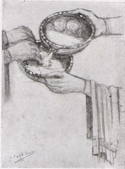
Reconstrucció de l'ús de l'aigüamans del tipus del que ara ha ingressat a la Col·lecció Plandiura. (Dibuix de J. Folch i Torres.)

nien. Aquesta forma de rentamans, no obstant, és d'origen antic, i a l'Egipte han sigut trobades bacines amb brocs semblants. En una cuina d'una casa empurritana, descoberta a les excavacions de la Junta de Museus l'any 1920, s'hi trobà un plat de terrissa romana proveït d'un llarg broc que alhora servia de mànec, molt semblant al que es veu representat en una miniatura d'un Psalteri del segle ix de la Biblioteca Nacional de París.