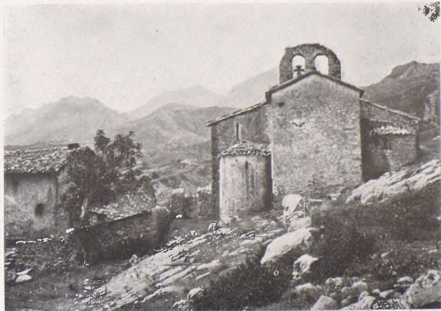
L'església de Pedret, amb el reste de dos dels seus absis del segle X.