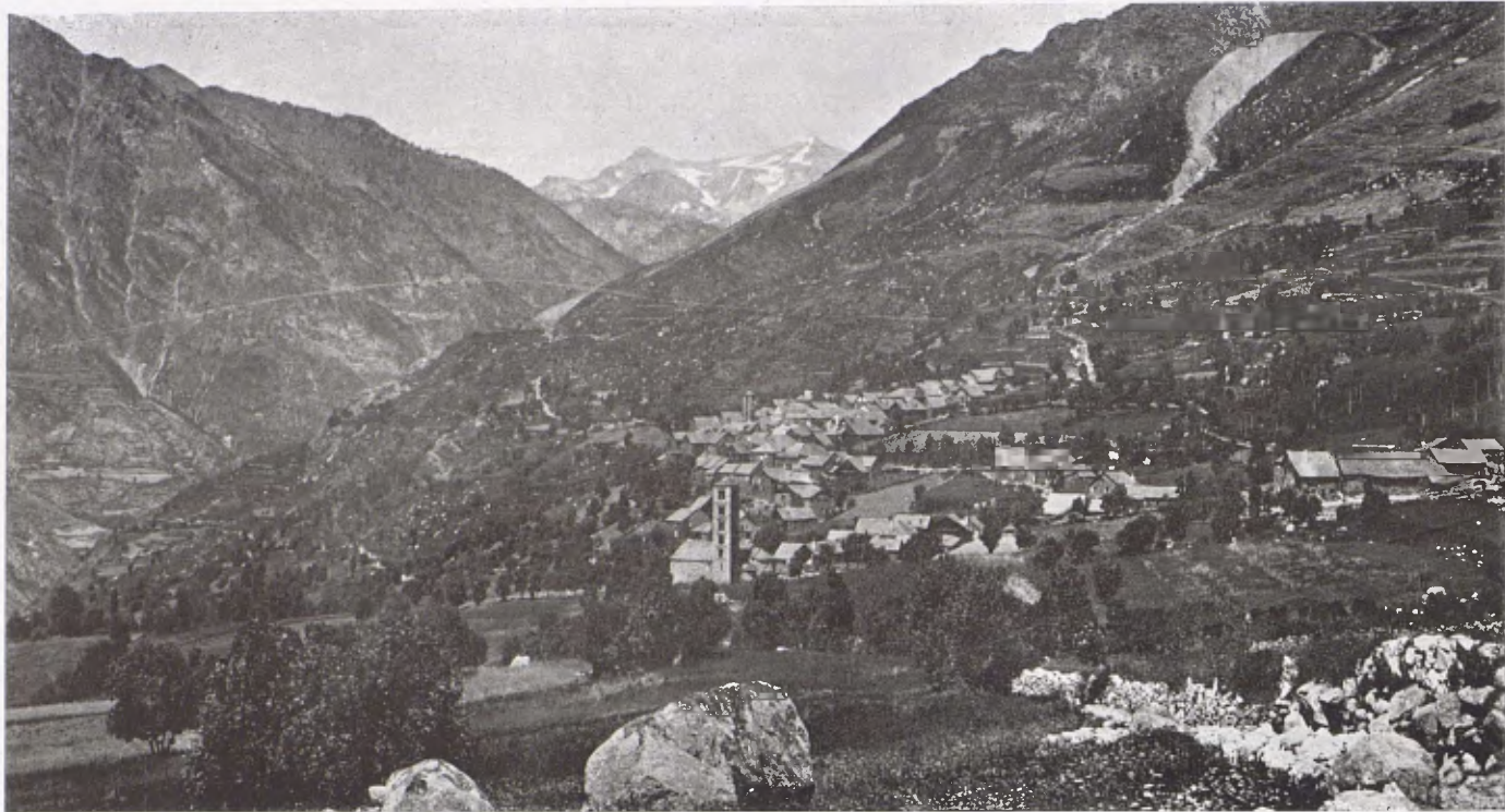
El sot de la Vall de Bohí amb el poble de Tahull i els dos cloquers de les esglésies romàniques de Santa Maria, al mig del poble i Sant Climent a primer terme.

Aquestes coses altes i misterioses, que deien aquelles pintures que jo sabia abscondides darrera l'altar i sota les gruixes de l'emblanquinat, cobrint amb colors de drap de