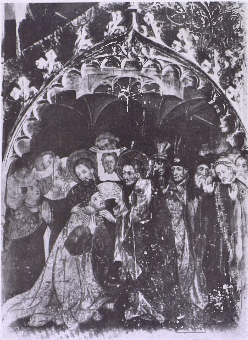
Taula central del retaule de Lluís Borrassà, una de les joies cabdals del Museu Diocesà de Vich.

Per tal d'adquirir la ciència, ningú podrà negar que s'hi hagi plangut gens ni mica. S'és passat i es passa la vida estudiant. Els viatges que ha fet per Itàlia, encara seminarista i després ja sacerdot, a París i Colònia en la plenitud de la edat i de la producció científica, els innumerables per totes les terres hispàniques, no han sigut mai passeigs de mera recreació ni esplais de turista, sinó expedicions d'investigació i d'estudi. Encara avui, quan d'altres — la majoria — s'haurien tombat temps ha sobre els