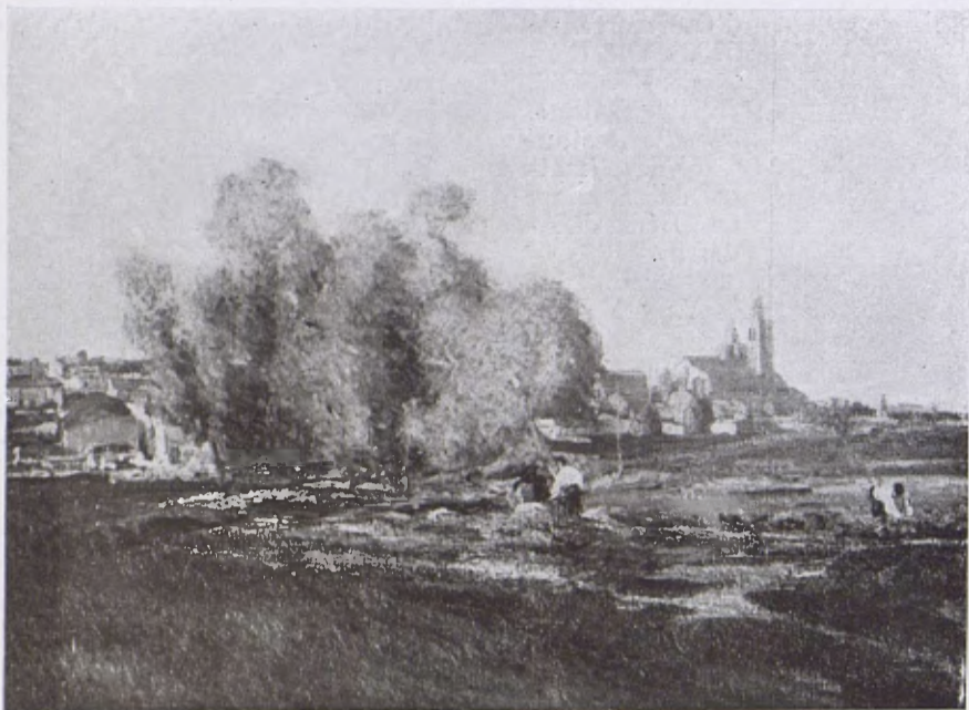
Paisatge de Sant Cugat del Vallès, per J. Colom. (De la Col·lecció Sala llegada al Museu.)

(G., nota d'Arxiu).—299, «Hierros artísticos. Colección de láminas, por Luis Labarta» (Just Cassador).