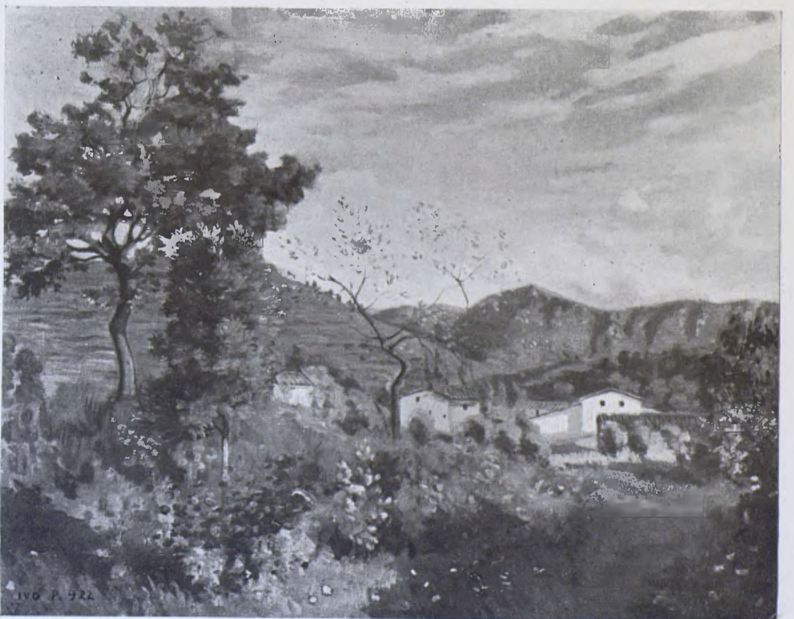
Paisatge d'Olot, per Ivo Pasqual. (De la Col·lecció llegada al Museu per en F. Sala.)

Planes 133, «El Museu Episcopal de Vich en 1900».—258-290-330-377-412, «Col·locació de les santes relíquies en els altars».—353, «Canvis introduïts per la impremta» (Just Cassador, nota d'Arxiu).—452, «Dos documents sobre els antics drets senyoriais» (Just Cassador, nota d'Arxiu).—470, «El Sant-Christ en les troncs» (M. T., nota d'Arxiu).—470, «Sobre llegir en els refetors»