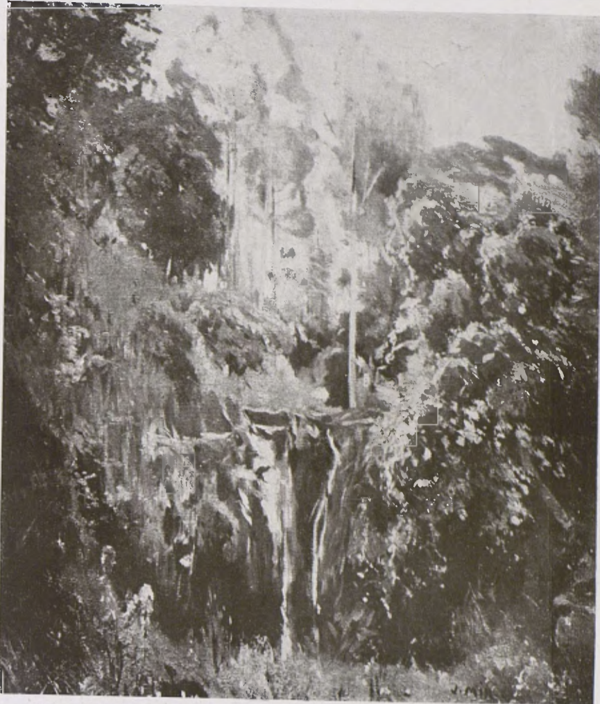
JOAQUIM MIR. — Paisatge de Caldes. (De la Col·lecció Sala llegada al Museu.)

Núms. 588 i següents, «Impressió».—674, «El jurisperit vigatà Jaume Callís».—«Dos episodis vigatans». (Tiratge a part.)