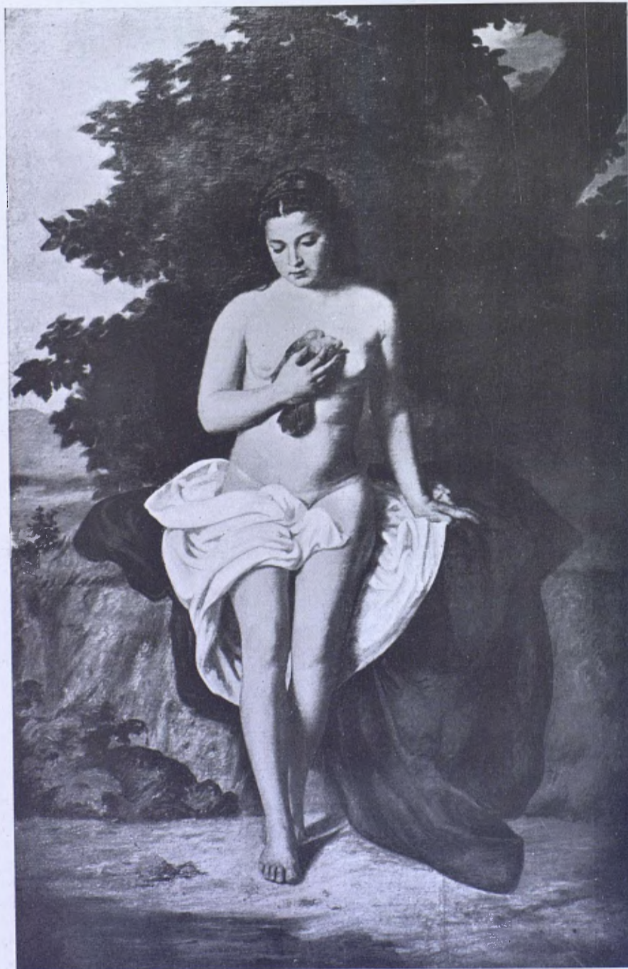
«La noia del colom», de la Col·lecció F. Sala, atribuïda a Clavé (Martí i Alsina?)

Núms. 164, «Neules i neulers». — 169, «La decoració pictòrica de la Catedral de Vich». — 170, «La passió de Jesucrist segons un còdice català de París». — 188, «Els gravadors