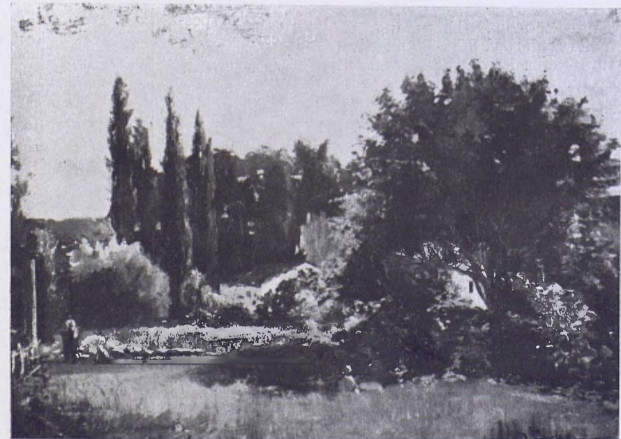
Paisatge d'Olot, per D. Carles. (De la Col·lecció Sala llegada al Museu.)

Núms. 5 i següents, «Mestre Gascó» (1907). (Hi ha tiratge a part.)—9 i següents, «El Col·legi de pintors de Barcelona a l'època del Renaixement» (1908).—«L'església del Brull i les seves pintures» (Juliol i agost 1909).