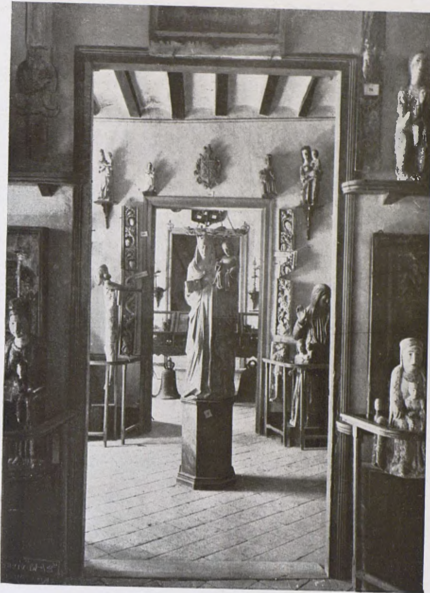
Les sales d'escultura del Museu Diocesà de Vich.