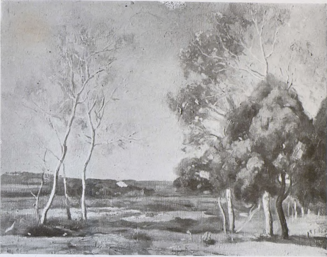
Paisatge de la Garriga, per en Enric Galwey. (De la Col·lecció F. Sala llegada al Museu.)

Abadal».—191, «Guadamacils catalans».—194, «El pali de Santa Perpètua de Moguda».—198, «Caixes i caixers gòtics».—205-206, «L'Exposició de Creus».