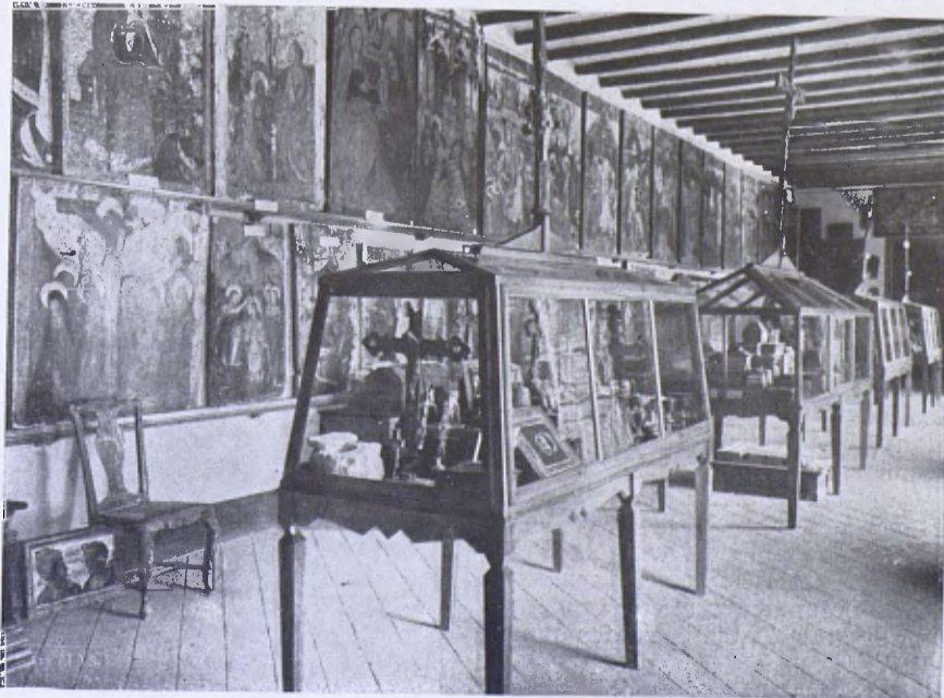
Altra de les Galeries de taules gòtiques i orfebreria al Museu Diocesà de Vich.

Aquestes virtuts de l'home que ha fet i fa un Museu, són una de les seves glòries, i com que ha assistit de bell començament a la naixença de la casa, ell és un dels pocs directors de Museu del món que té tots els objectes, no ja catalogats científicament, sinó biografiats, diríem.