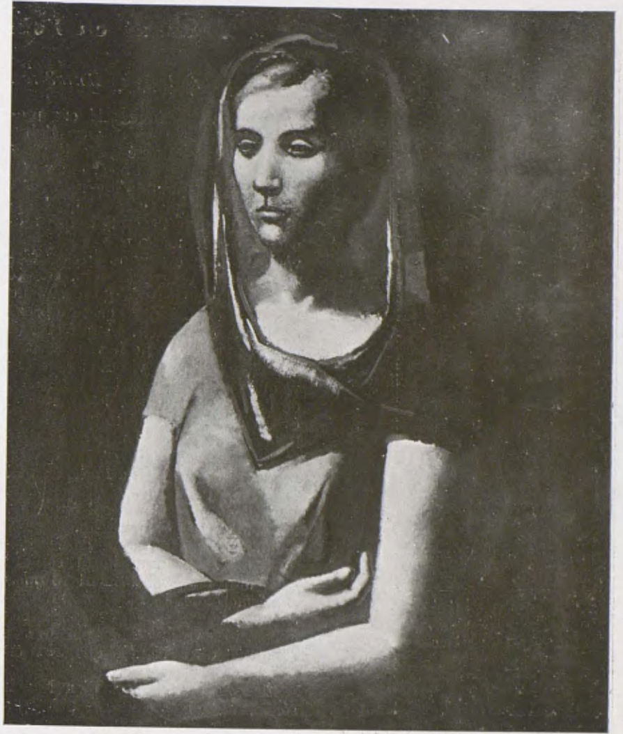
PERE PRUNA. — «Dona en vermell» (Galeria Percier a Paris 1924.)

Jo ja sé que avui formen llegió, ben nombrosa, ben brillanta, els homes nous que, impulsats amb generosa inquietud per l'ideal d'una vida plenament urbana, menyspreuen, per puerils i per vulgars, els retrets anecdòtics referents a les rudimentàries societats d'ahir. Mes, així i tot, alguns d'aquells esperits poc amants de tradicions estantiques i anècdotes pintoresques, es probable que experimentin, per lo que es relaciona amb l'obrador d'en Viladomat, certa curiositat, no enterament aixuta de tendresa, si tan sols es paren a reflexionar que en aquest cas nostre, com en tants altres, les benvolgudes modernitats reposen sobre ròncs sediments de casolanes incipiències. Les ciutats ideals que avui major estímul ens promouen amb llur complexa i afinada civilització, han tingut humil origen en senzilles aglomeracions veïnals. I àdhuc les més perfectes i enginyoses institucions, hem de pensar que són filles de primitius organismes, ben minços i barroers. Per això és que, si volem veure els lligams que uneixen la nostra ànima de l'actual moment amb l'ànima d'altres dies, no ens és lícit preterir, per miserios i casolà que ens sembli, un nucli inicial de cultura com l'obrador d'en Viladomat, primer centre artístic que apareix en les auba-