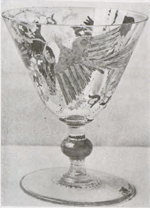
EUDA SOLÉ. — Copa. Exposició de les Arts Decoratives de París.