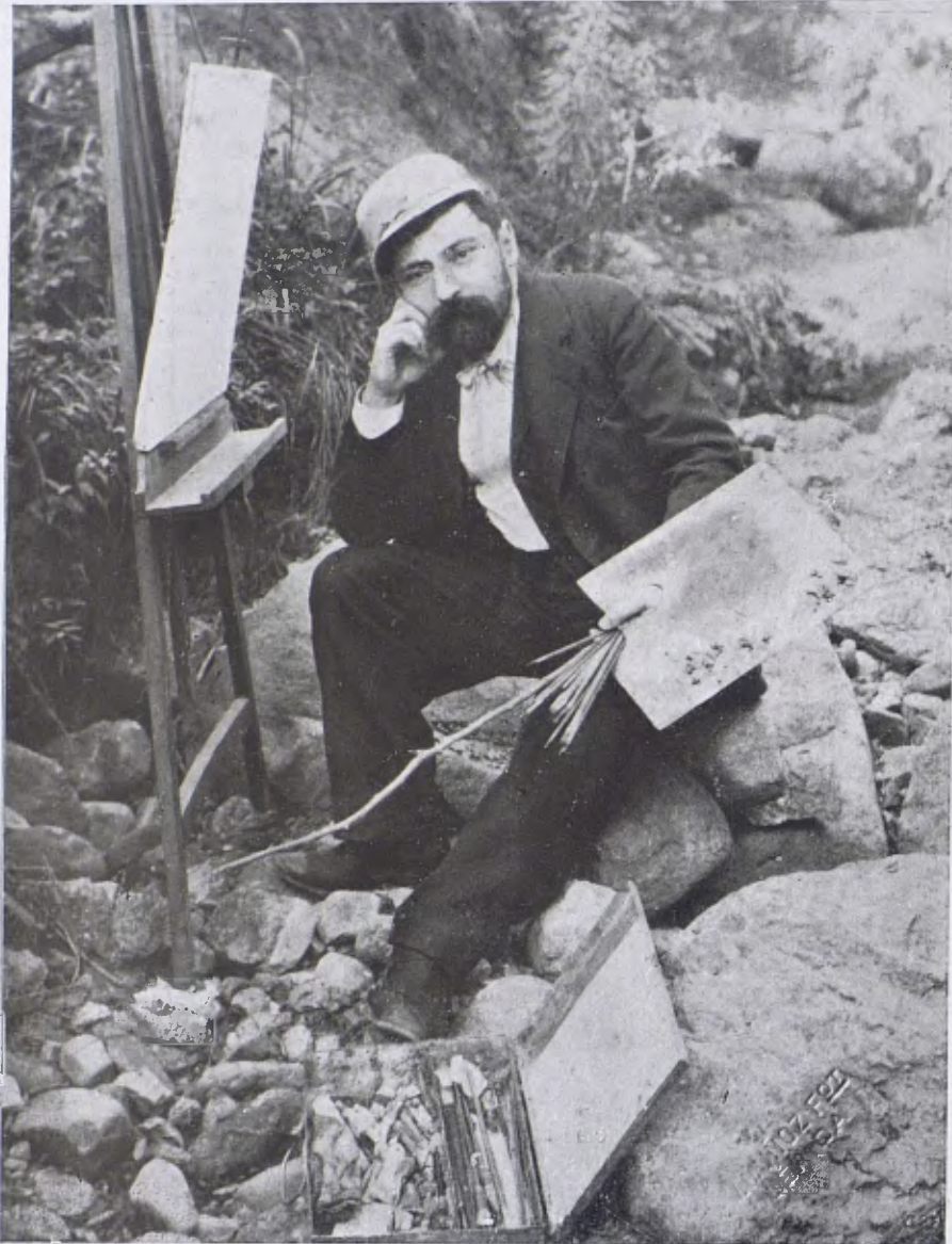
El pintor Miquel Carbonell Selva, nat a Molins de Rei en 1855, i mort a Barcelona l'any 1896.

Sala Parés. — A Can Parés, s'inaugurà el dia 17 una exposició i venda d'algunes obres de la Col·lecció Estruch. El més notable dels quadres exhibits, són uns fragments de re-