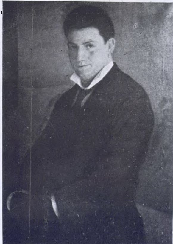
Retrat d'home, per M. Carbonell Selva.