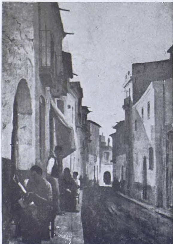
«Un carrer», per M. Carbonell Selva.