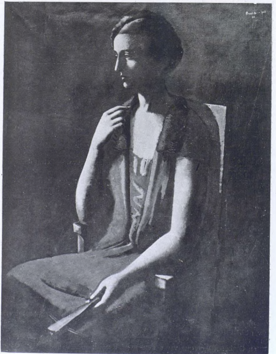
PERE PRUNA. — «El ventall» (Galeria Percier a París 1924.)