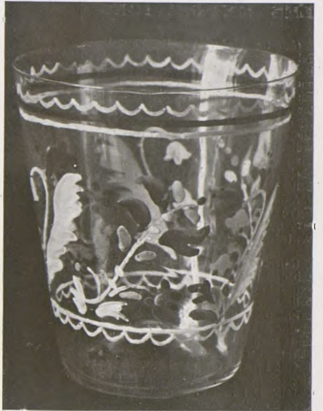
AMÈRICA CARDUNETS. — Vas esmaltat. Exposició de les Arts Decoratives de París.

composició de Poussin quelcom de la corporeïtat de les figures corotianes. Els redactors de Luz oferiren al serè decorador un fascicle monogràfic.