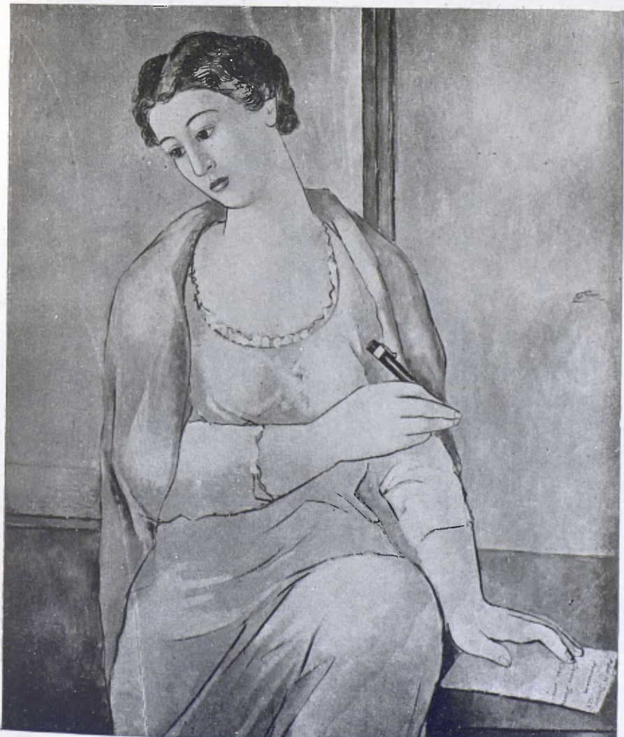
PERE PRUNA. — «Dona de la Watermann» (Col·lecció Jean Cocteau a Paris 1923.)