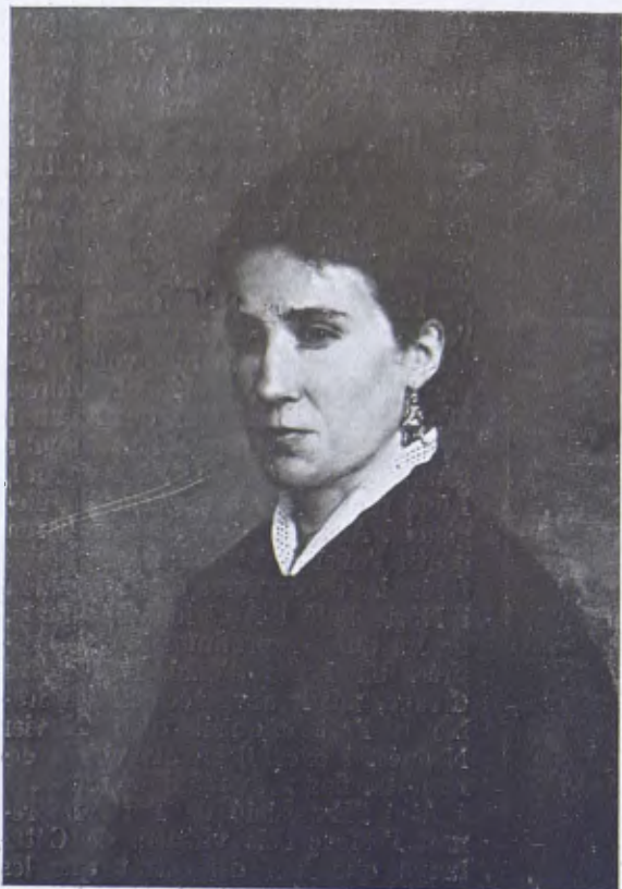
Retrat de Senyora, per M. Carbonell Selva.

Està en premsa i apareixerà pròximament, editat per l'Editorial «David» un Manual resum d'Historia General de l'Art. L'autor del Manual és el nostre amic En Joaquim Folch i Torres. Es publicarà una edició catalana d'aquesta obra. L'il·lustració serà abundosa i escollida d'entre els materials poc coneguts i de recent descobriment.