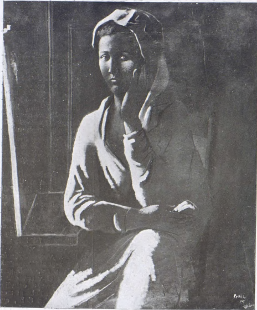
PERE PRUNA. — «La Coiffeuse» (Galeria Percier a París 1924.)

Pruna cal no oblidar que es tracta, com havem dit, d'un artista jove, nissim, que en ple període de normal formació, cau dins l'òrbita del mestratge feliç i potent d'en Picasso. Així és com la seva producció gravita al voltant d'una de les constel·lacions del gran pintor mundial, i es fa difícil l'estudiar-ne la psicologia particular, puix que cal arribar a l'obra d'aquests darrers temps per començar a descobrir, a través del meravellós enlluernament de l'obra mestra, la fesomia característica i personal del venturós deixeble. Però, per bé que aquesta personalitat sigui difícil de descobrir, llur existència és indubtable i revela en els seus productes —les seves teles, els seus dibuixos — la presència d'un temperament de pintor i d'artista capaç de posar una fita esplendorosa en el temps i en l'espai, honorant ensems una època — l'art modern — i un país: el nostre.