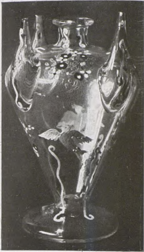
NÚRIA SOLÉ. — Morratxa. Exposició de les Arts Decoratives de París.