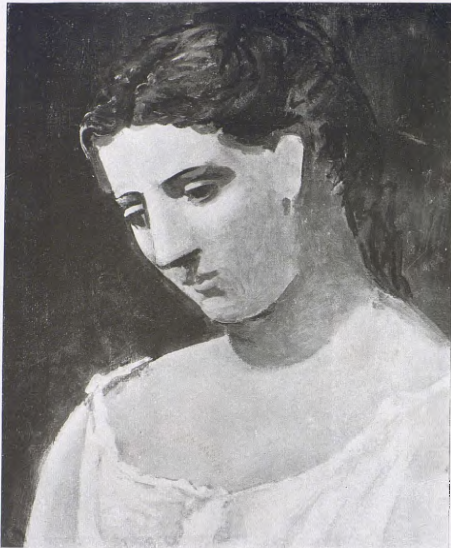
P. RUIZ PICASSO. — Bust

L'olotisme, que era una tornada a la natura amb el cor anhelant i els nervis singularment afinats, ens salvà de la corrupció acadèmica del fi de segle i preparà l'adveniment de l'impressionisme, l'última gran escola pictòrica que positivament ha existit. En aquesta sala, al costat de l'iniciador del moviment oloti, hi trobareu la seva més preclara descendència espiritual: Berga, Galwey, Llimona, Russinyol, Mir, Pascual, Vayreda (Francesc), Carles, Mallol, Benet... Aquests noms representen cinquanta anys de pintura catalana. Tots, amb més o menys insistència, han llegit el gran llibre d'Olot que obrí el vell Vayreda: cada un n'ha tret una veritat pròpia. Però a través del variat panorama de les seves obres un hom hi sent palpitant una emoció única. Aquesta que es manifesta tan diversament, és el fil d'or que lligarà amorosament al llarg de la nostra història artística aquestes tres generacions de pintors catalans.