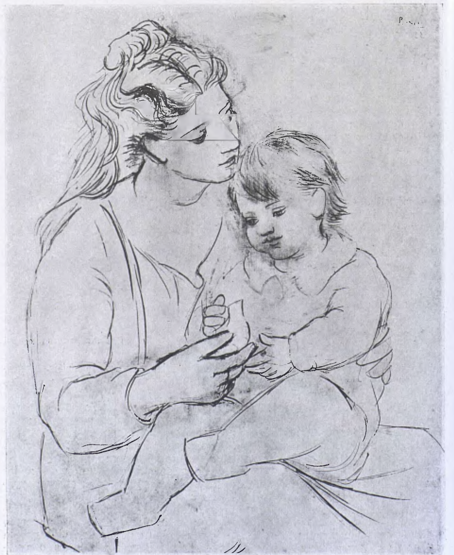
P. RUIZ PICASSO. — Maternitat