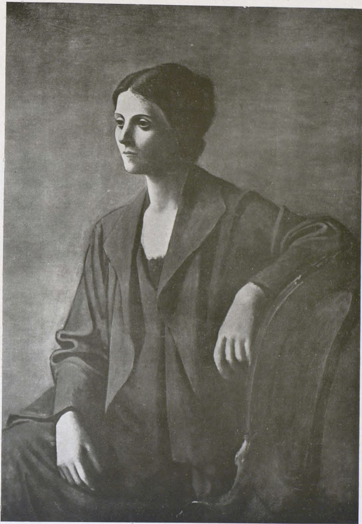
P. RUIZ PICASSO. — Retrat de l'esposa de l'artista

A «La Pinacoteca». — Una interessant exposició de pintors catalans contemporanis que han pintat el bell