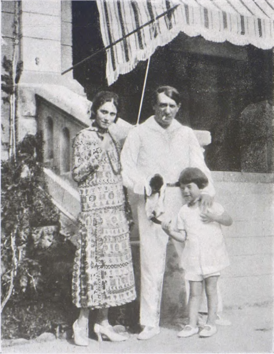
Retrat íntim d'en Picasso amb la seva esposa i el seu fill. — Estiu de 1924

nar per regles lògiques la seva producció futura.