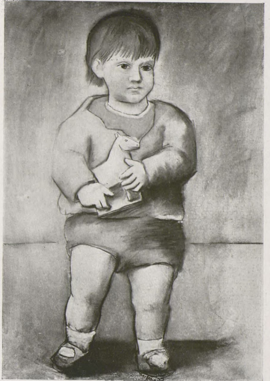
P. RUIZ PICASSO. — «El petit Picasso»

Així, doncs, aconsellem, si es volen fer Exposicions oficials d'Art, que es demani a l'Ajuntament que, d'acord