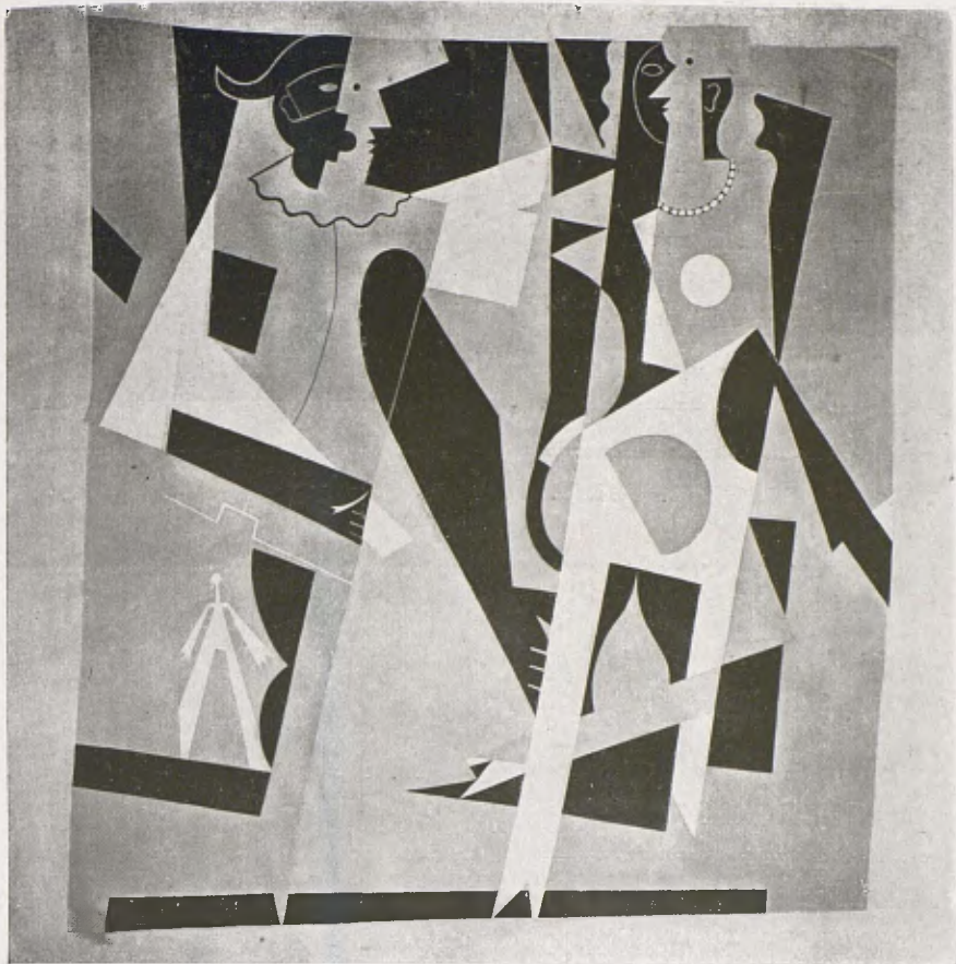
P. RUIZ PICASSO. — Les disfresses

cions. Ben aviat s'hi donaran, demés, uns curssets lliures per a l'enobliment dels Bells Oficis, dels que és lògic esperar-ne veritable profit per a tots.