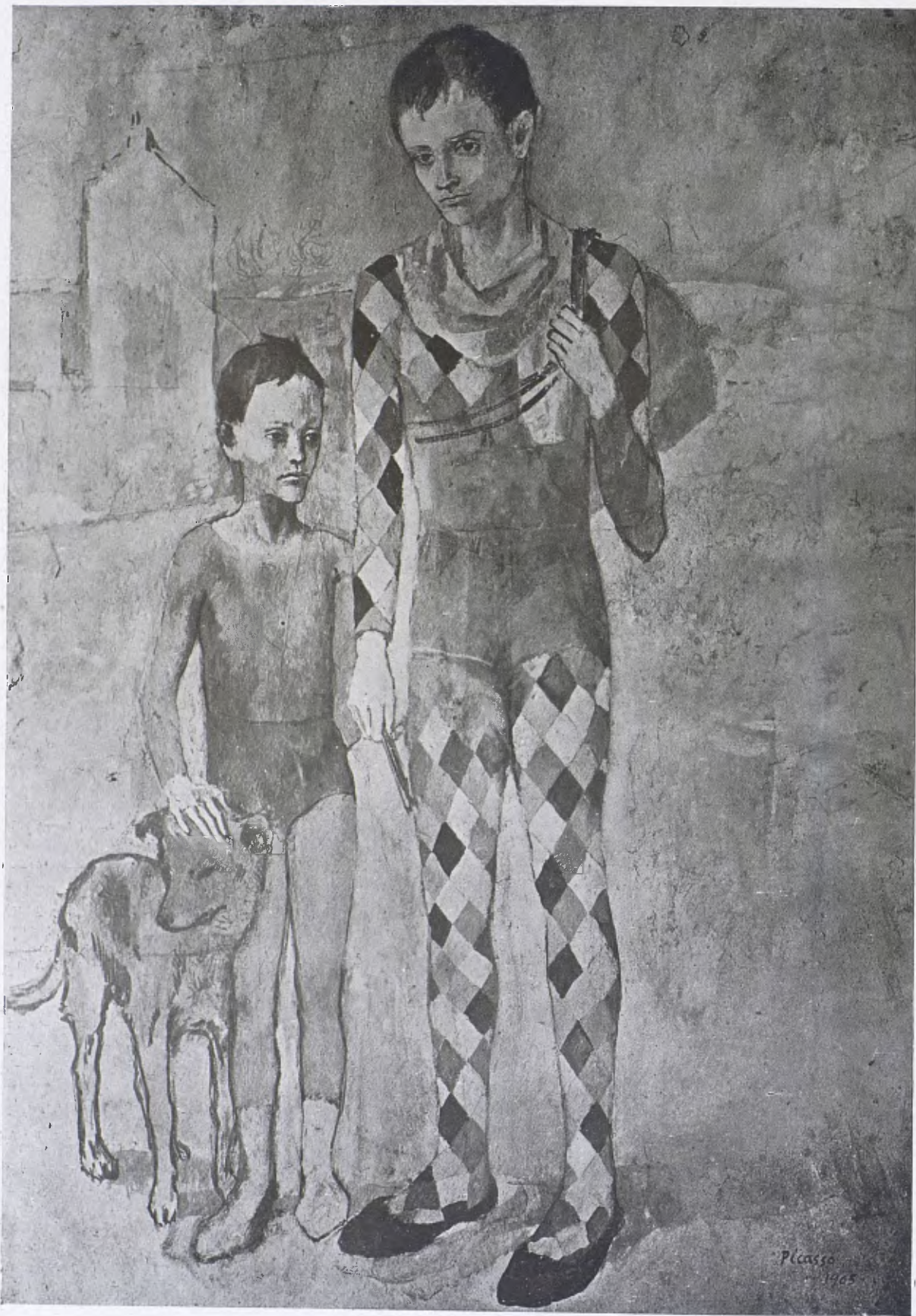
P. RUIZ PICASSO. — Els Saltimbanquis (1905)