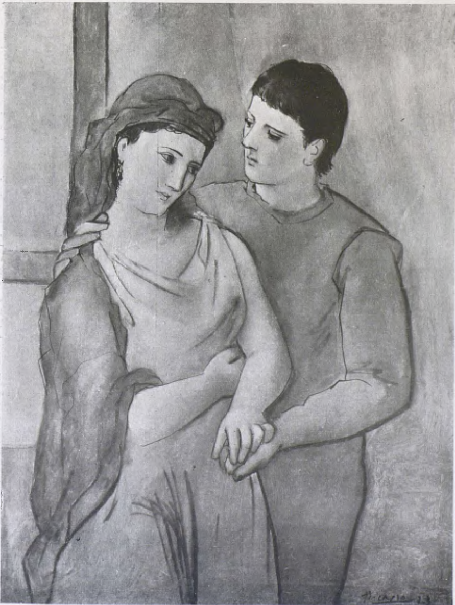
P. RUIZ PICASSO. — «Els Enamorats»

amb el projecte que ja té aprovat, es constitueixi l'organisme que ha de realitzar-les. Es dins aquest organisme on cal plantejar després totes les altres qüestions, i entre elles una de les més importants, que és la del local on celebrar-les. L'autoritat i la pressió que aquest organisme exerceixi és qui ha de decidir al Municipi a donar una solució definitiva al problema. Tot el que es faci i es digui sense que hi hagi l'organisme que ho reculli i ho tramiti, no direm que sia en va, però sí que cau en el pou sens fons de les mil preocupacions municipals, generalment allunyades de l'esfera on es mouen els artistes.