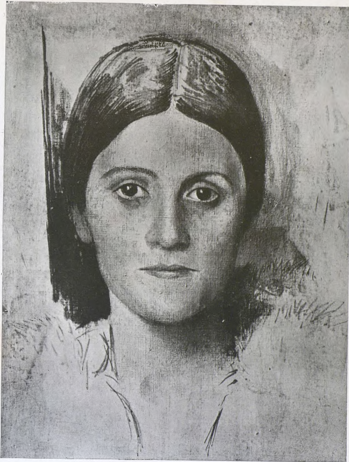
P. RUIZ PICASSO. — Retrat de l'esposa de l'artista.

Pau Ruiz Picasso apassiona als artistes de tot el món i revoluciona les arts. No diem «ha apassionat» ni «revolucionarà» perquè en Picasso és una activitat present i, el que és més notable, una capacitat d'influència sobre el món artístic, també present, d'efectes immediats. Des de les seves primeres obres, malgrat els canvis de procediment adoptats, malgrat les característiques divergents de cada època — particularitat que l'ha convertit en una mena de