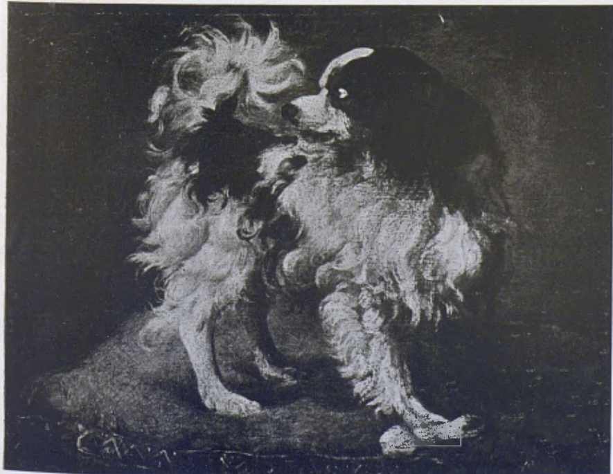
Col·lecció ANÉS. — «Gos». (Escola madrilenya, segle XVII.)

Els Vidres esmaltats d'en Gol mostren les noves conquestes de l'artista en el seu art difícil. Els seus esmalts arriben a esclats fins ara inaconseguits, i la fogosa manera decorativa de l'artista s'ha enriquit amb un