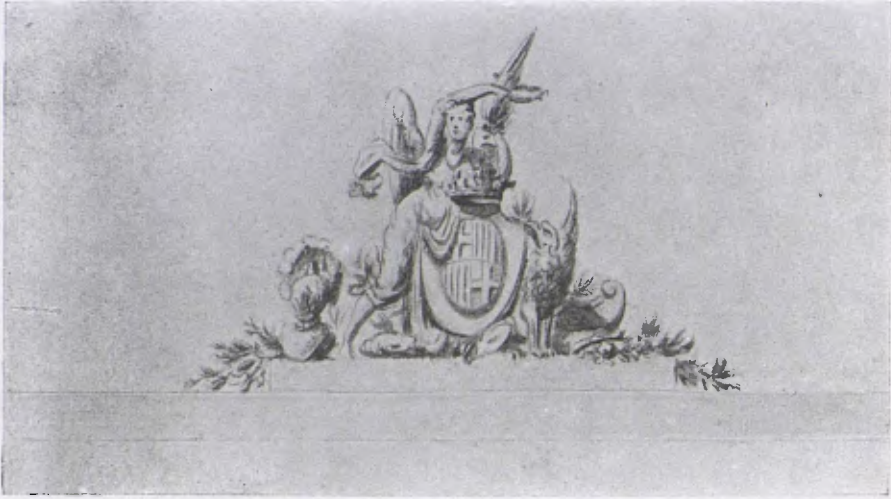
Dibuix que corona la façana en el plan projectat per l'arquitecte municipal En Josep Mas i Vila, que's troba en l'expedient de rectificació i ornament de la Plaça de Sant Jaume, Fol. 72, a l'Arxiu Administratiu de l'Ajuntament de Barcelona i altre exemplar còpia del mateix, en l'Arxiu històric.