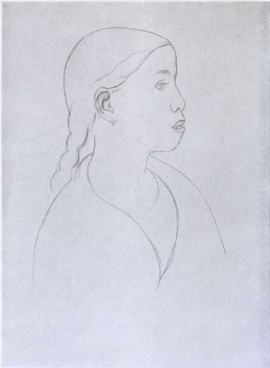
DERAIN. — Dibuix.

Folis 363, 366 i 367. — Tramesa la comunicació el dia 4 a l'Acadèmia, aquesta contestà el 9 dient havia nomenat els comissionats que passarien a efectuar l'examen el dia 11 de gener a la una de la tarda, i en data del 13 de febrer oficiava l'Acadèmia de Belles Arts dient que en junta general celebrada el dia abans s'havia aprovat el parer emès per la comissió examinadora del model, que trobà exacta amb el