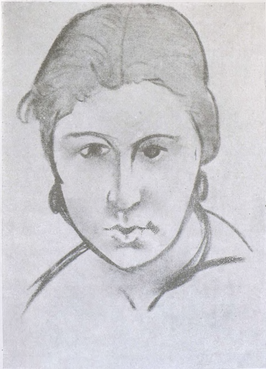
DERAIN. — Dibuix.

estava contractada i actualment ha sigut entregat per l'escultor.