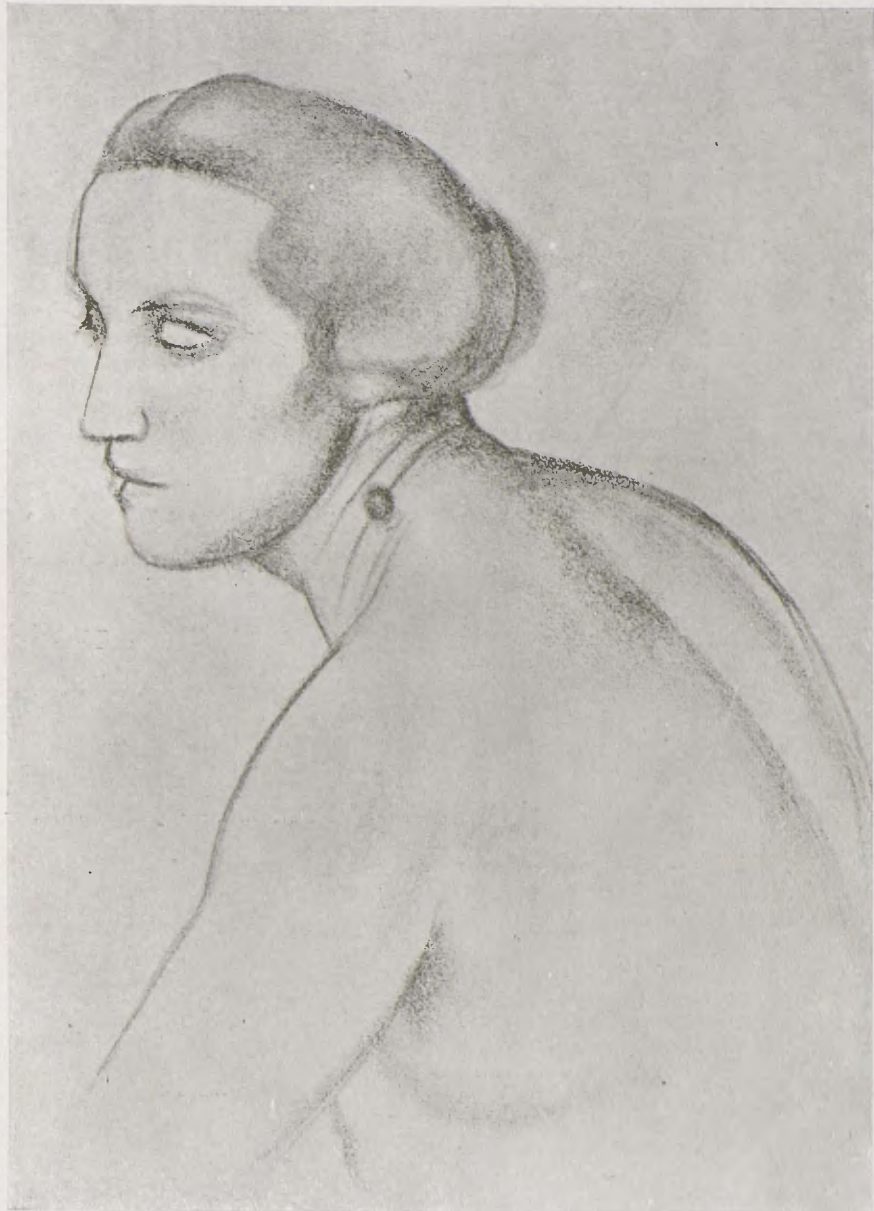
DERAIN. — Dibuix.

24 GENER 1855. — Diario de Barcelona: Es diu que va col·locarse en el centre de la façana de Casa la Ciutat el remate amb l'escut de Barcelona, qual construcció fa mesos