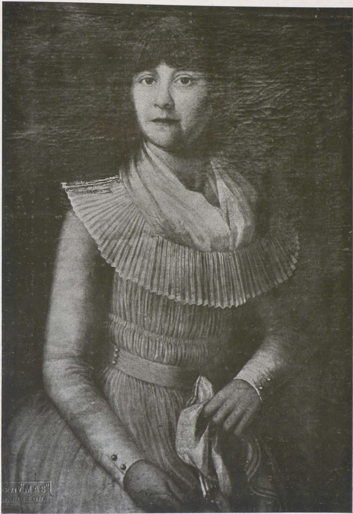
Retrat d'una dama catalana. — Principis del segle XIX. — Col·lecció dels Srs. Comtes de Güell. (Autor català desconegut.)

Per als contradictors de la personal dolçor espiritual de Velázquez,