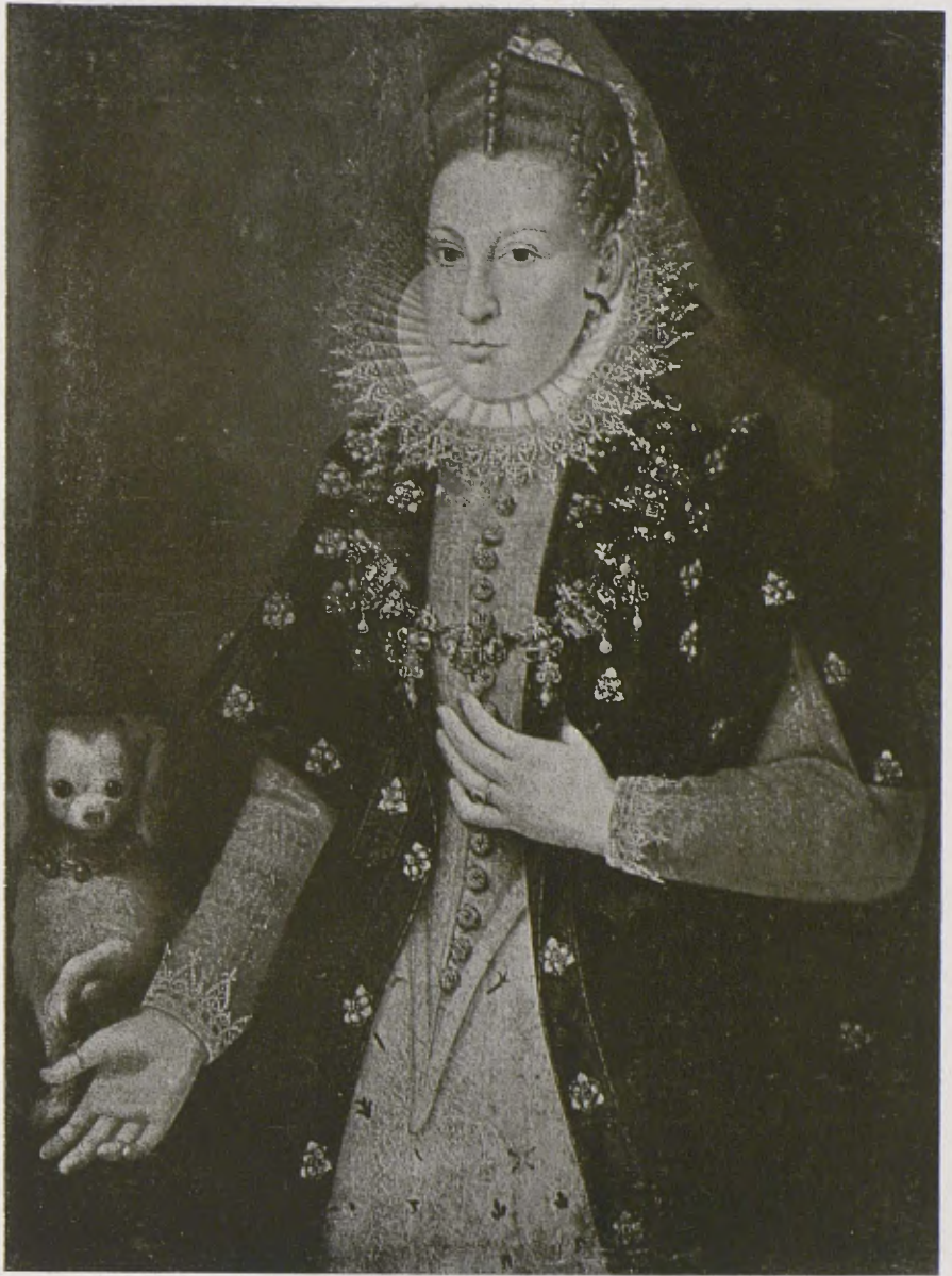
Col·lecció ANÉS. — Retrat de Dama, atribuït a Alonso Sánchez Coello. (Epoca de Felip III.) (Cl. Serra).

Galeríes Arenas. — Exposa el paisatgista Puig Perucho. Aquest pintor meritíssim no ofereix cap aspecte nou del seu art, constant recercador d'harmonies dins una unitat ambient que, més que a la natura, respon a un sentiment personalíssim. Esperit delicat, diu amb la seva finor melancòlica de sempre la poesia del nostre paisatge vallesà. El poblet, el camp llaurat, el marge roig, l'arbre tofut besat pel sol morent. El seu llenguatge pictòric, cada dia més clar i més franc, té un to d'intimitat confidència.