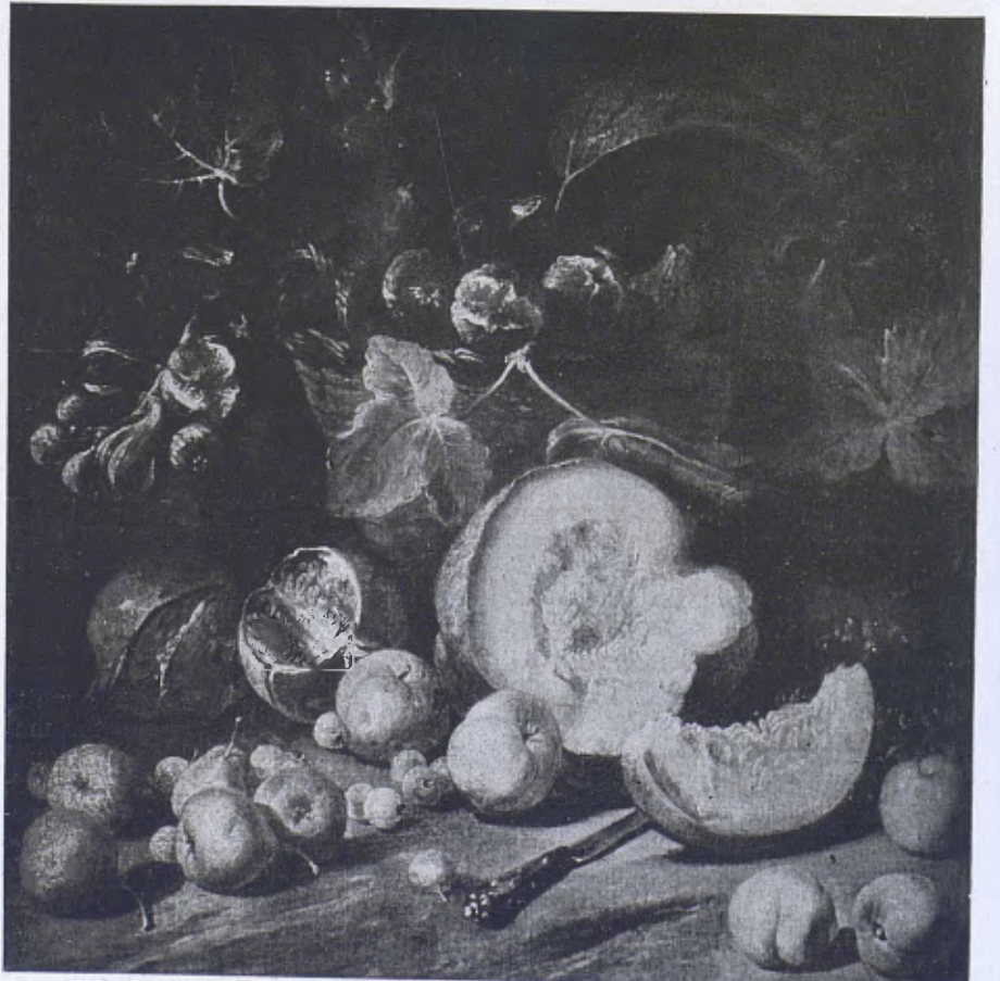
Col·lecció AÑÉS. — Natura morta. (Escola Sevillana, segle XVII.)