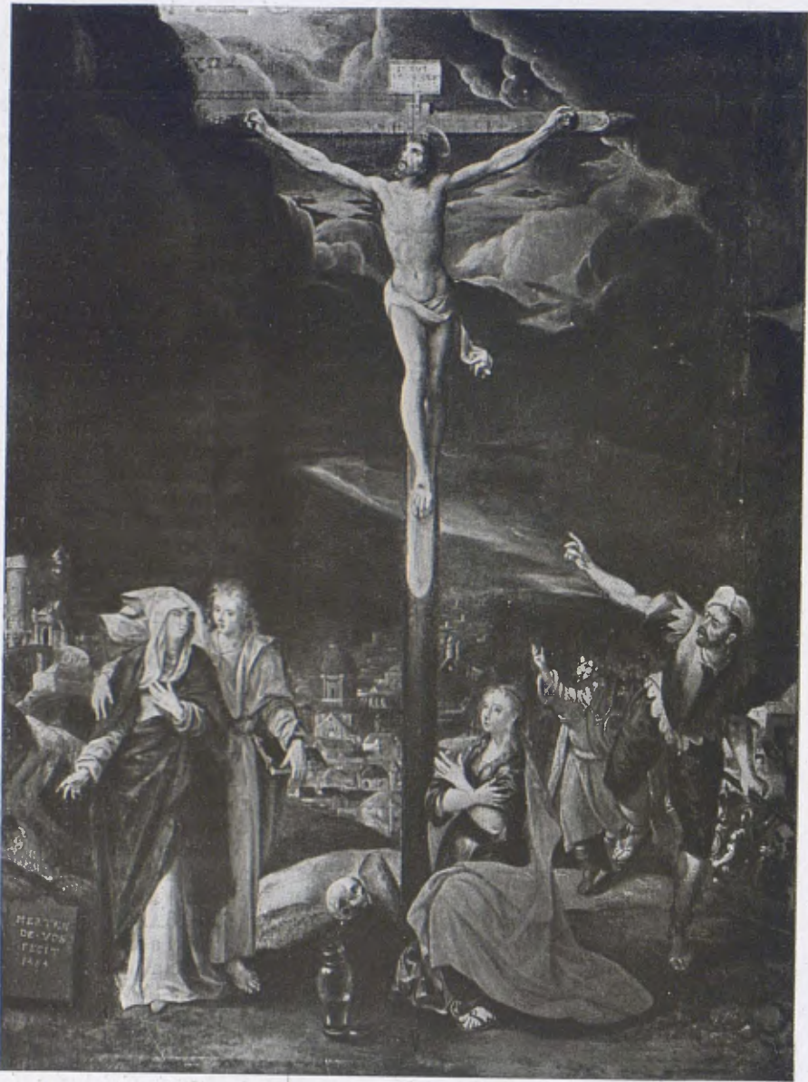
Col·lecció AÑÉS. — «El Calvari», per Marten de Vos, mestre flamenc deixeble de Tintoretto, segle XVI.

secret al qual no va poder encloure-hi completament, al qui va traïcionar, puix que la seva ànima, per estar plena de la Vida, no podia estar per sempre encadenada per la seva voluntat, malgrat la seva cortesia de gentilhome refinadíssim.