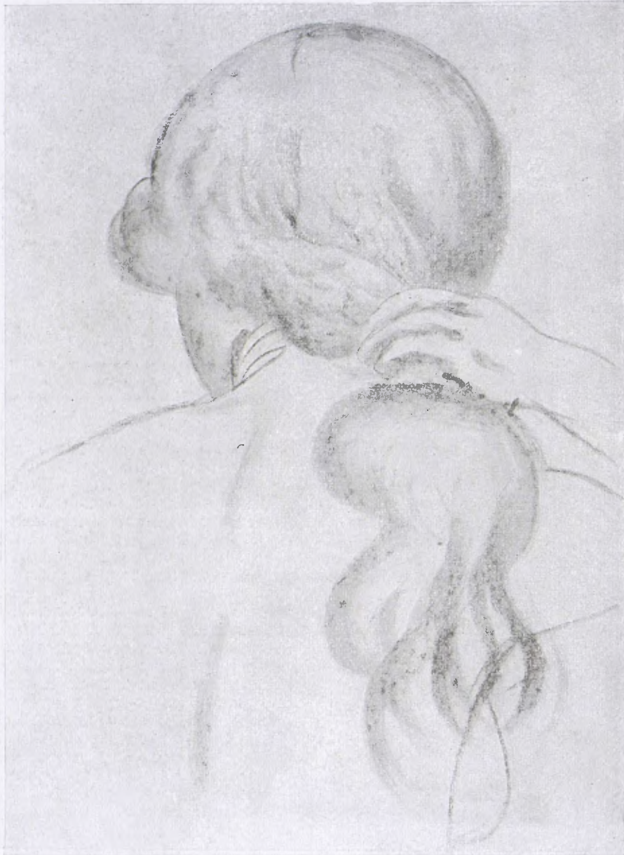
DERAIN. — Dibuix.