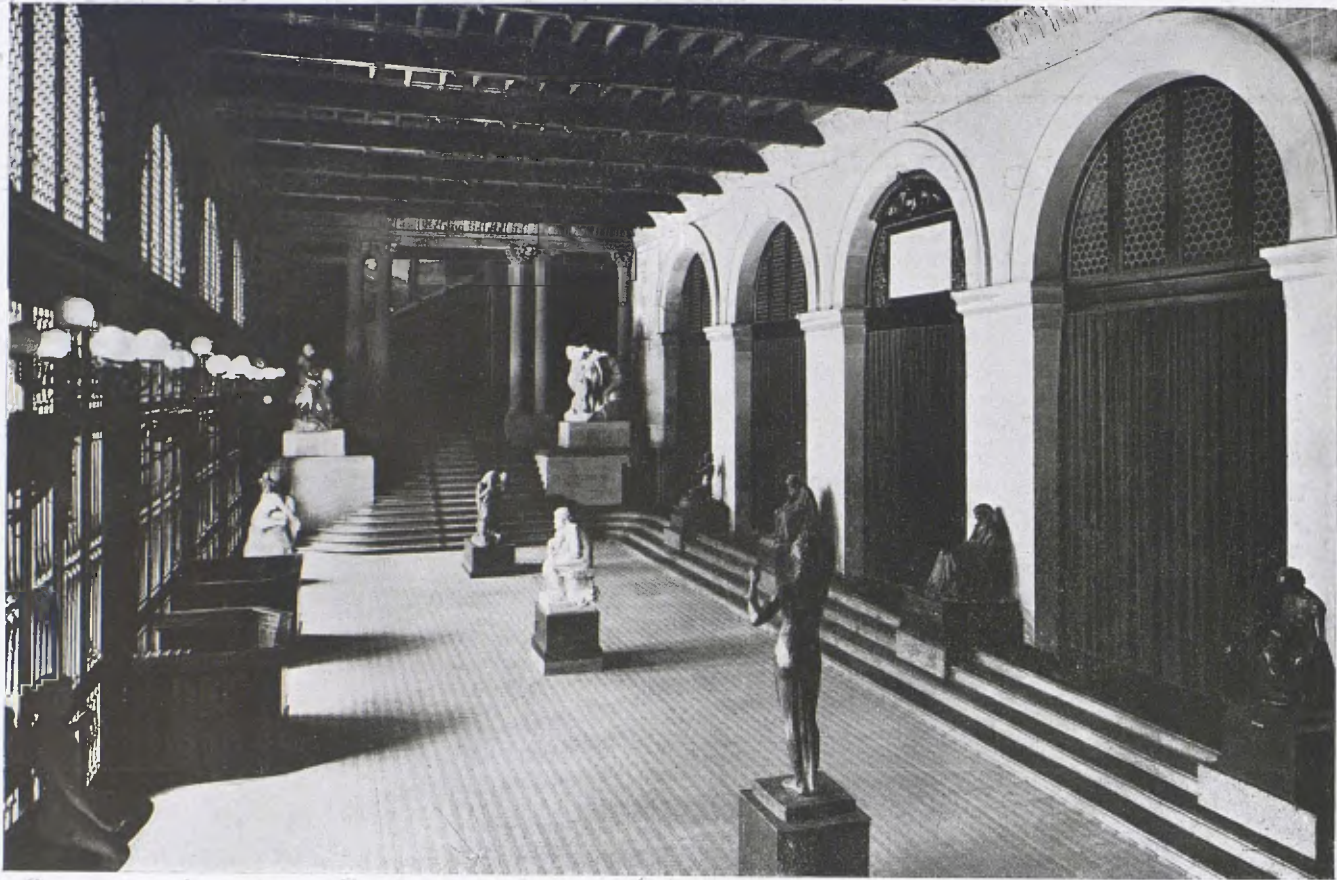
Vista de conjunt del hall d'escultura al Museu de Belles Arts. (Cl. Laboratori del Museu.)

Com s'ha nodrit el Museu. — Així va anar-se nodrint el Museu, a base de les Exposicions Oficials d'Art principalment. Així creixien les seccions de pintura estrangera i dels artistes vivents del país; però el Museu restava orfe de la representació dels artistes morts amb anterioritat a la fundació del Museu, si es descompten els casos d'obres que ja posseïen, anteriorment a ella, l'Ajuntament i la Diputació. En 1907, però, en constituir-se la Junta de Museus, que reuní en el seu sí les representacions de totes les corporacions artístiques, l'Acadèmia de Belles Arts de Barcelona aporta, amb gran part del seu Museu, gran quantitat d'obres d'artistes de la primera mitat del segle XIX, que ella guardava. Així la col·lecció anava devenint una sèrie cíclica del nostre art vuitcentista, però, no obstant i això, pesaven més en el Museu les