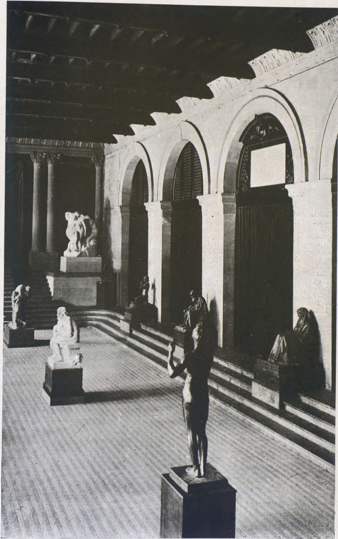
Vista parcial del vestibul d'escultura al nou Museu de Belles Arts.