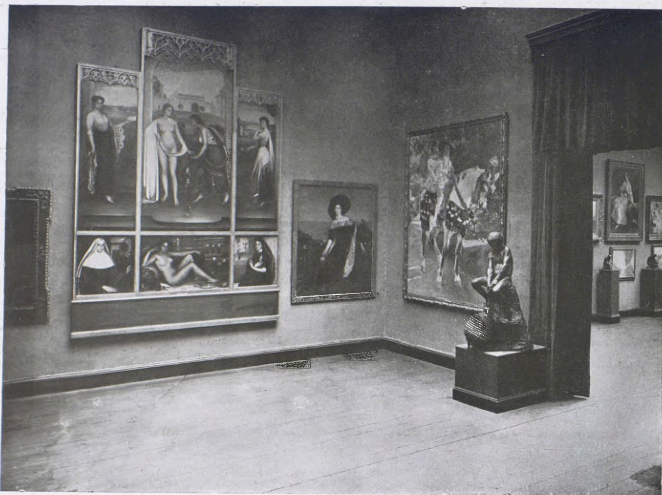
Museu de Belles Arts. — Una de les Sales dels moderns pintors castellans, valencians i andalusos. Romero de Torres, Zuloaga, Sorolla, etc.