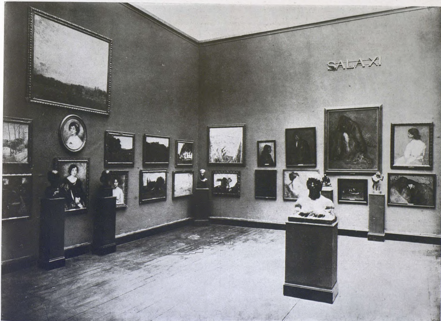
Museu de Belles Arts. — La Sala 11. a Nonell, Canals, Picasso, Urgell i Raurich, presideixen els panys de mur.