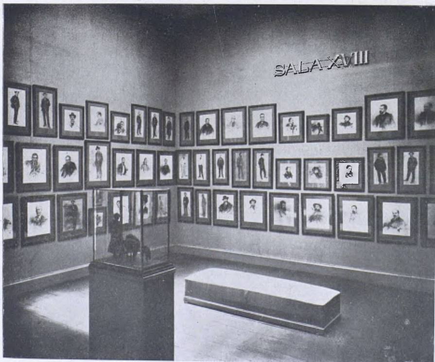
La Sala XVIII que clou la sèrie amb la col·lecció monogràfica de pintors, escultors, crítics d'art, arquitectes, músics, literats, dibuixada per en Ramon Casas, i de la qual feu donació al Museu.