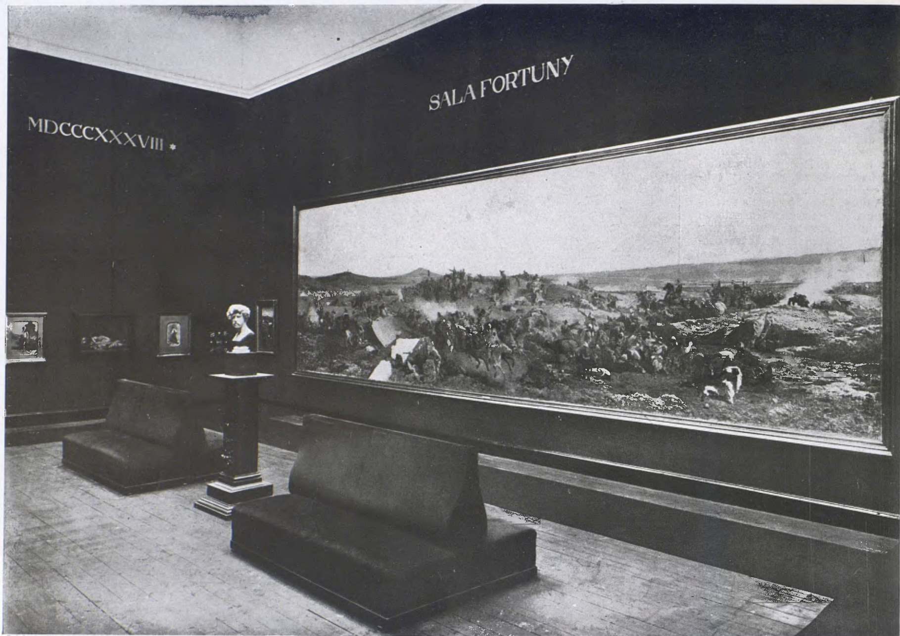
Museu de Belles Arts. — La Sala Fortuny. Al centre el gran quadre «La Batalla de Wad-Ras», propietat de la Diputació de Barcelona. Demés «La Vicaria» i «La Odalisca» junt amb altres obres. Al centre el bust de Fortuny d'en Rosend Nobas.

el moment anterior, per mitjà d'un anecdotisme folklorista, es transformà per l'art d'en Joan Llimona, d'en Baixeras i dels seus seguidors, en un noble corrent d'alta valor espiritual.