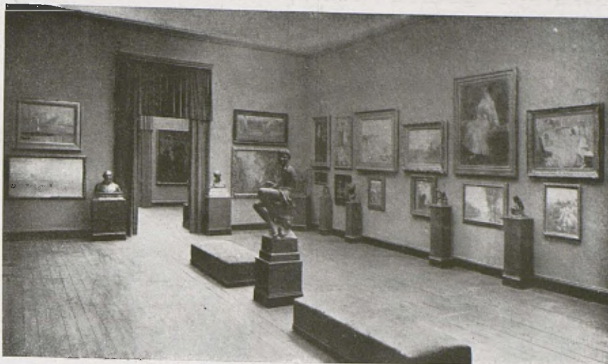
Museu de Belles Arts. — Una de les Sales de pintura i escultura estrangeres. (França, Anglaterra i Itàlia.)