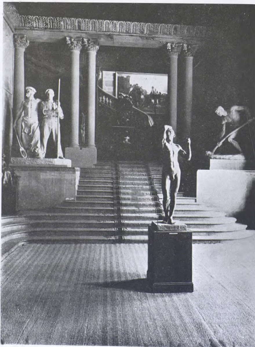
Museu de Belles Arts.— Detall del vestibul d'escultura presidint «L'Age d'Arain» de Rodin. (Cl. Laboratori del Museu.)

L'Amor ha mancat un xic a les darreres generacions, que han sigut noblement actives, però poc comprensives. Un moviment de revisió, però, molt saludable s'ha desvetllat de fa uns anys, i a ell creiem que, quant a la pintura, les exposicions retrospectives de mestres del segle XIX hi han tingut gran influència. La dissolta Junta d'Exposicions que les organitzava, per ella sola ha complert