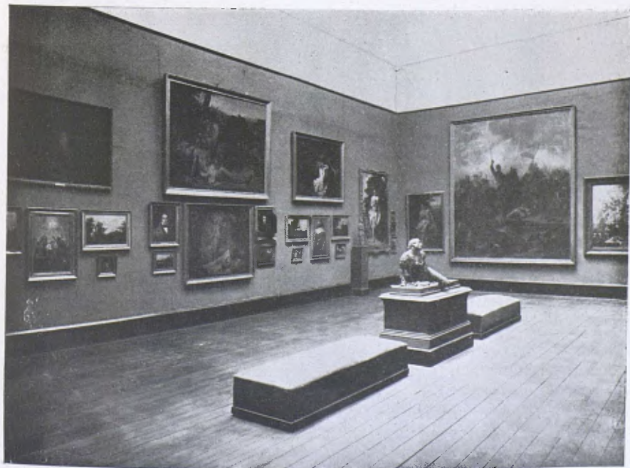
Museu de Belles Arts. — La Sala 2.ª Pintura romàntica.

Del 1890 al 900 predomina l'humanisme naturalista, que iniciant-se en