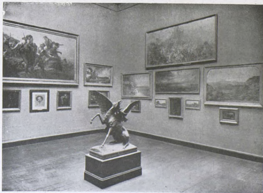
Museu de Belles Arts. — La Sala 4.ª La pintura dels començos del naturalisme. (Rigalt, Martí i Alsina.)