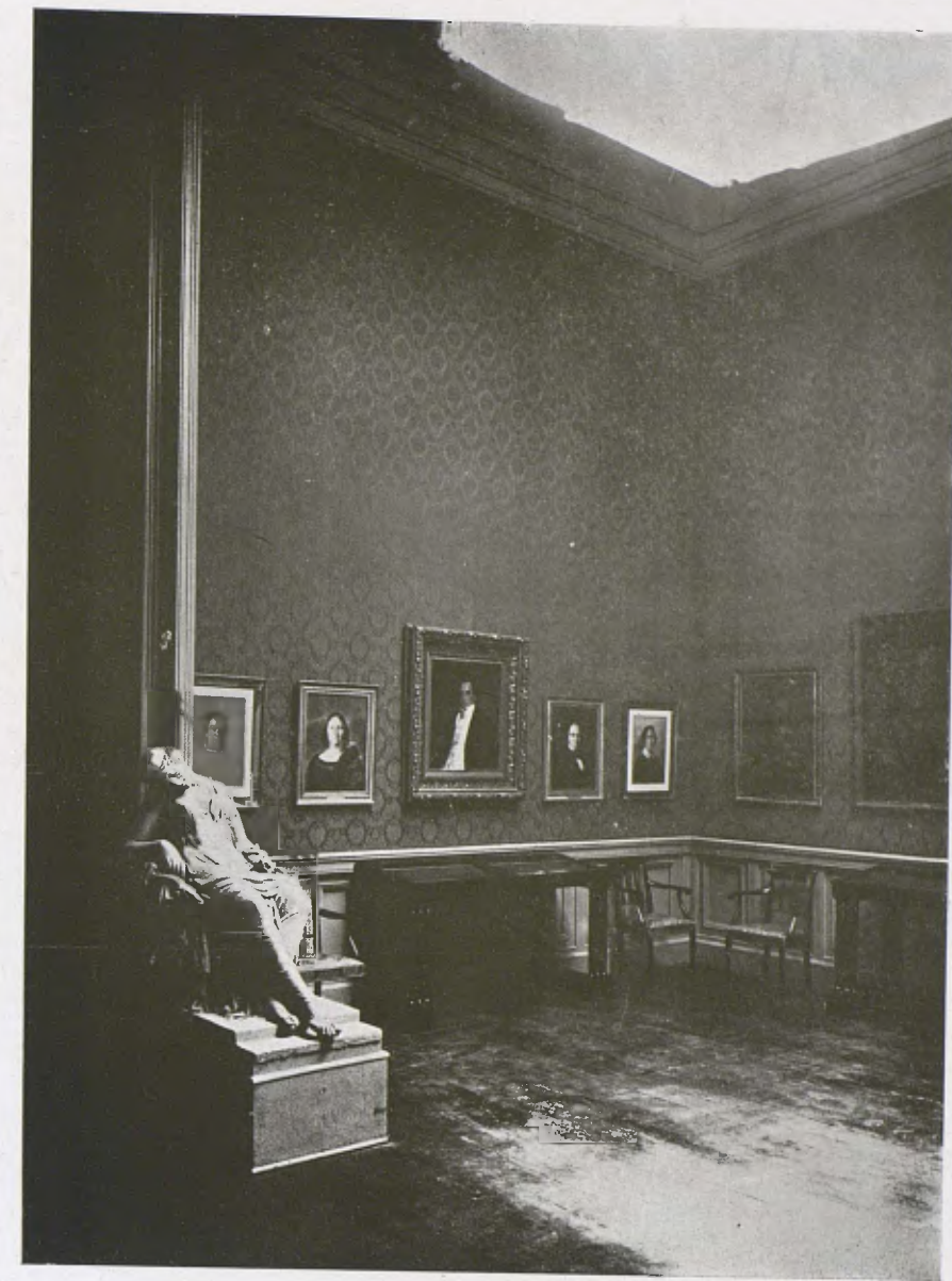
Museu de Belles Arts. — La Sala 1.ª Escultura i pintura novo-clàssica i romàntica.

Comença doncs, l'ordre de l'instal·lació amb una Sala on hi ha els nostres neo-clàssics i els primers retratistes romàntics: Flaugier, el francès catalanitzat, Director de Llotja durant l'invasió Napoleònica (mort en 1812), Mayol, el seu deixeble, que el 1805 estava en plena edat de producció; Pau Rigalt, que feia els trent'anys al moment de la guerra amb França; l'escultor Campeny, el darrer barroc, que envià a Roma, aprenia amb Canova el novo-classicisme que importava a Barcelona; Cerdà, Farran i alguns