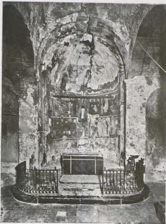
Conjunt de l'Absis amb les pintures descobertes.

Julia l'Apòstata. De la part baixa de l'absis, on corresponia segons costum una decoració de cortinatges estilitzats, no en quedà res.