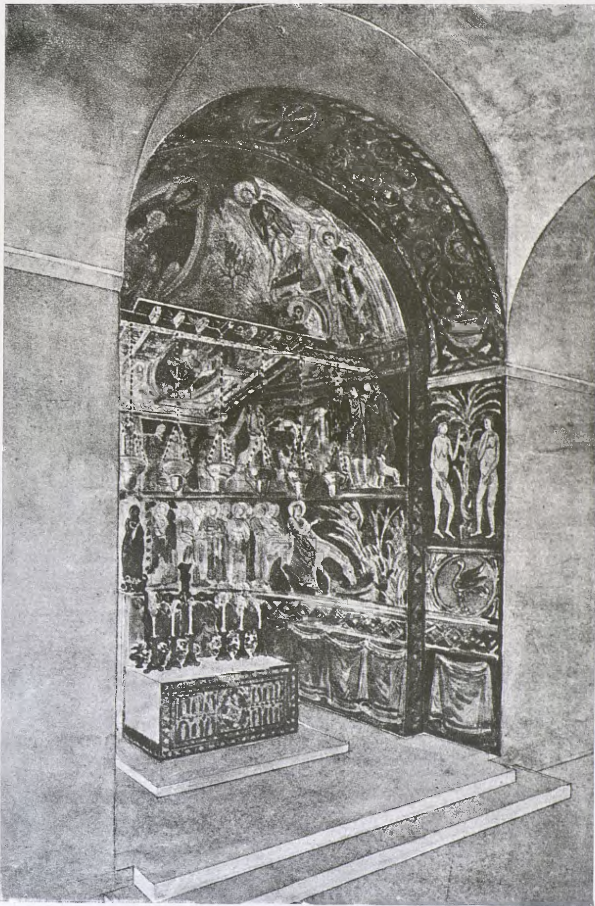
Projecte de restauració de les pintures i construcció de l'altar romànic de l'església de Sta. Maria de Barbarà. (Cl. Abat.)

Mirarem ara de resumir aquests parlaments per a donar als lectors de la GASETA DE LES ARTS una idea tan clara com sia possible, de l'importància d'aquesta esplèndida església de Barbarà i de les seves pintures.