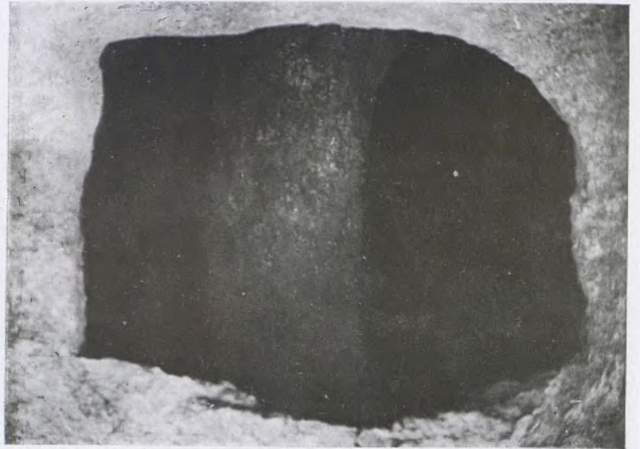
Forn ibèric descobert a Rubí. Detall de la boca del forn.

raren aviat el vermell tradicional de can Parés, i veïem sovint la Sala que, malgrat i el gris del fons, a instàncies dels expositors cobria els murs amb un vellut granat.