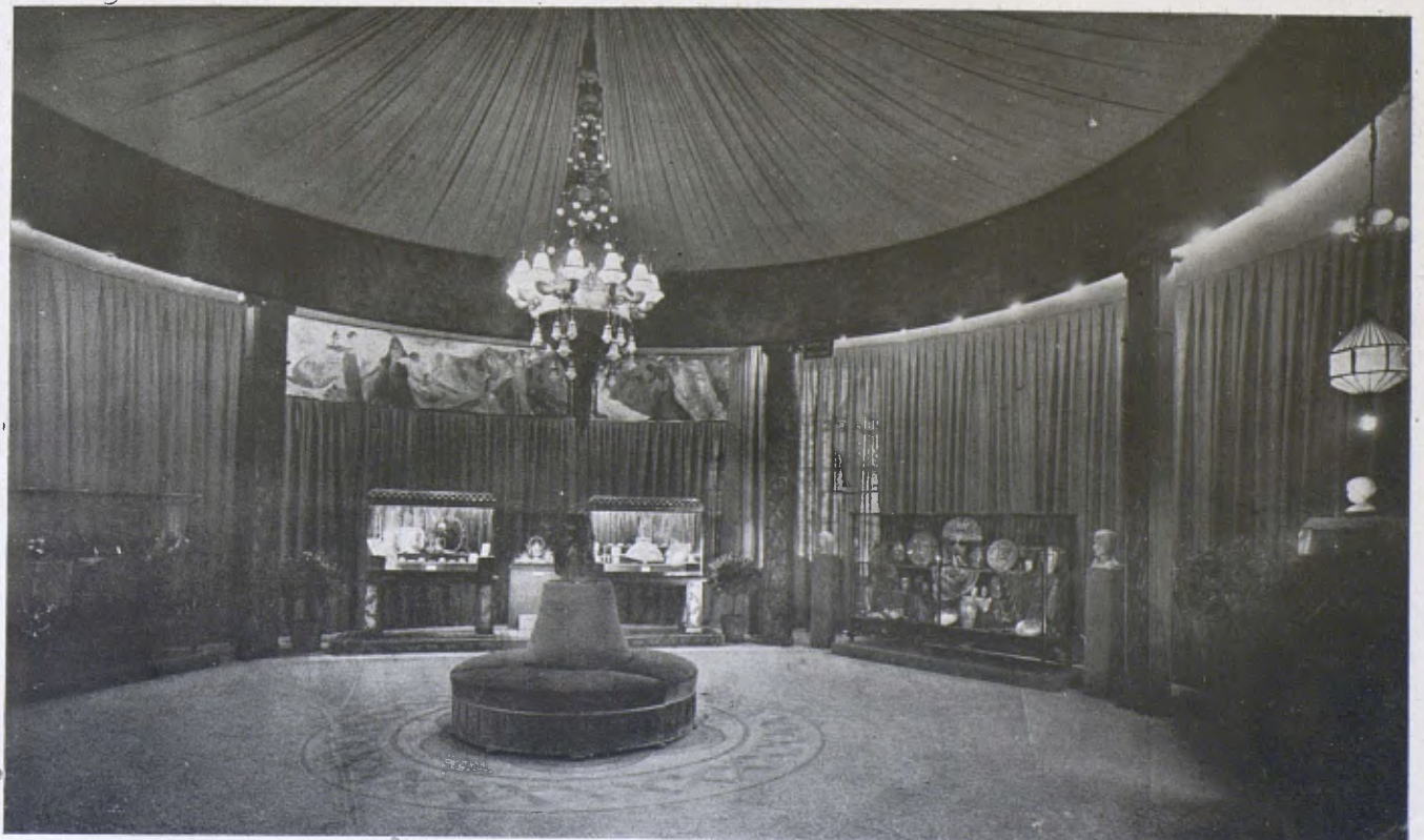
Altra instal·lació del Foment en la rotonda del Grand Palais a París.

La Sala Parés, segona, decorada per l'Olivella, famós ornamentista barceloní del 88, fou reformada l'any 1911. La moda del gris com a fons de les pintures imposà a en Parés un canvi de decoració. Es suprimiren les velles al·legories que l'Olivella havia pintat al fris i se les substituï per un gris de gust modernista... Els pintors, però, enyo-