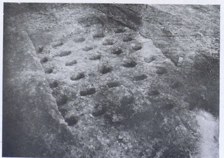
Solera de la cambra de cocció del forn ibèric de Rubí.