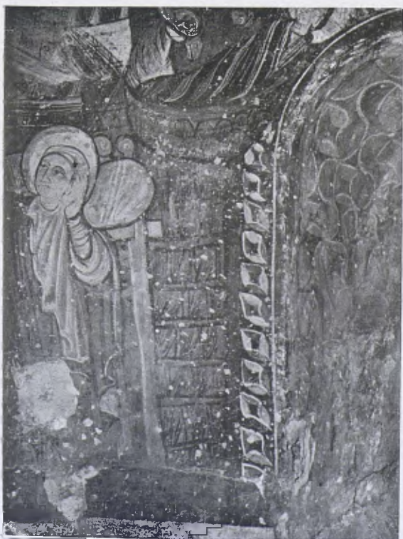
Detall de les pintures de Barbarà.