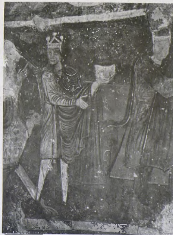
Detall de les pintures de Barbarà.