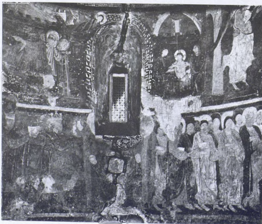
Pintures murals de l'Absis de Barbarà

Finalment en la part mitgera de l'absis trobem unes representacions en molt mal estat de conservació degut a humitats. Després de molt mirar i de confegir detalls hem deduït que a la banda esquerra hi ha una figura asseguda en un escambell encoixinat, tenint al davant un personatge de peu dret. A l'altra banda es veu un fragment d'una figura acotada o agenollada, i a la seva vora un fragment d'inscripció que no arriba a formar el mot complet. Probablement es tracta del martiri del sant bisbe Ciriac que ja havem anomenat. Sant Ciriac havia estat jueu i fou ell qui, segons la tradició, senyalà el lloc on era enterrada la Veracreu. Després es convertí i fou nomenat bisbe de Jerusalem, tan bon punt morí Sant Macari, i finalment fou martiritzat per ordre de