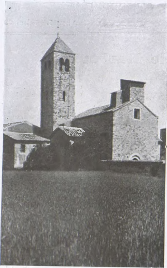
L'església de Barbarà (Façana i cloquer). (Cl. Abat.)