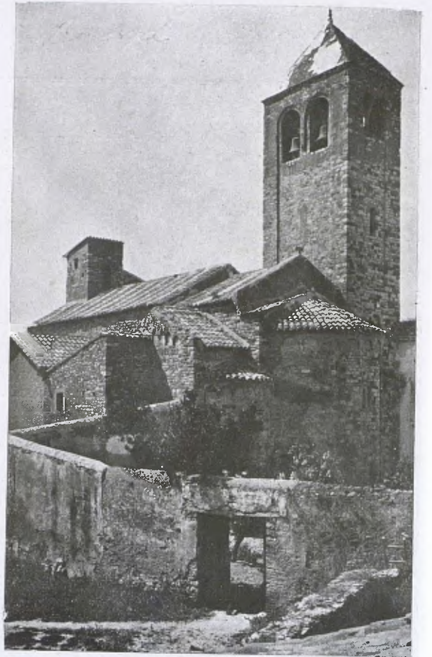
L'església de Barbarà (Absis i cloquer.) (C. Abat.)