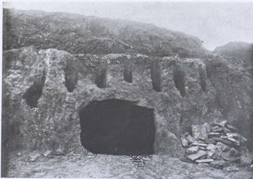
El forn ibèric de Rubí (Boca del fogar i conductes del foc a la cambra de cocció).