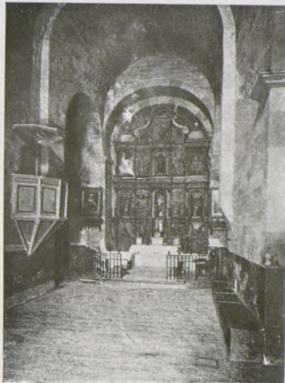
L'altar que tapava les pintures, avans del seu descobriment.

Aquesta entenem nosaltres que és la bona doctrina de conservació de les pintures murals que tenen un valor artístic. Tenim