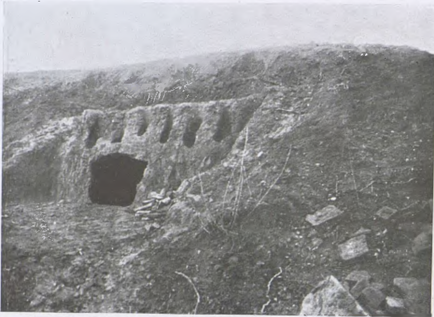
Forn ibèric descobert a Rubí. Conjunt.