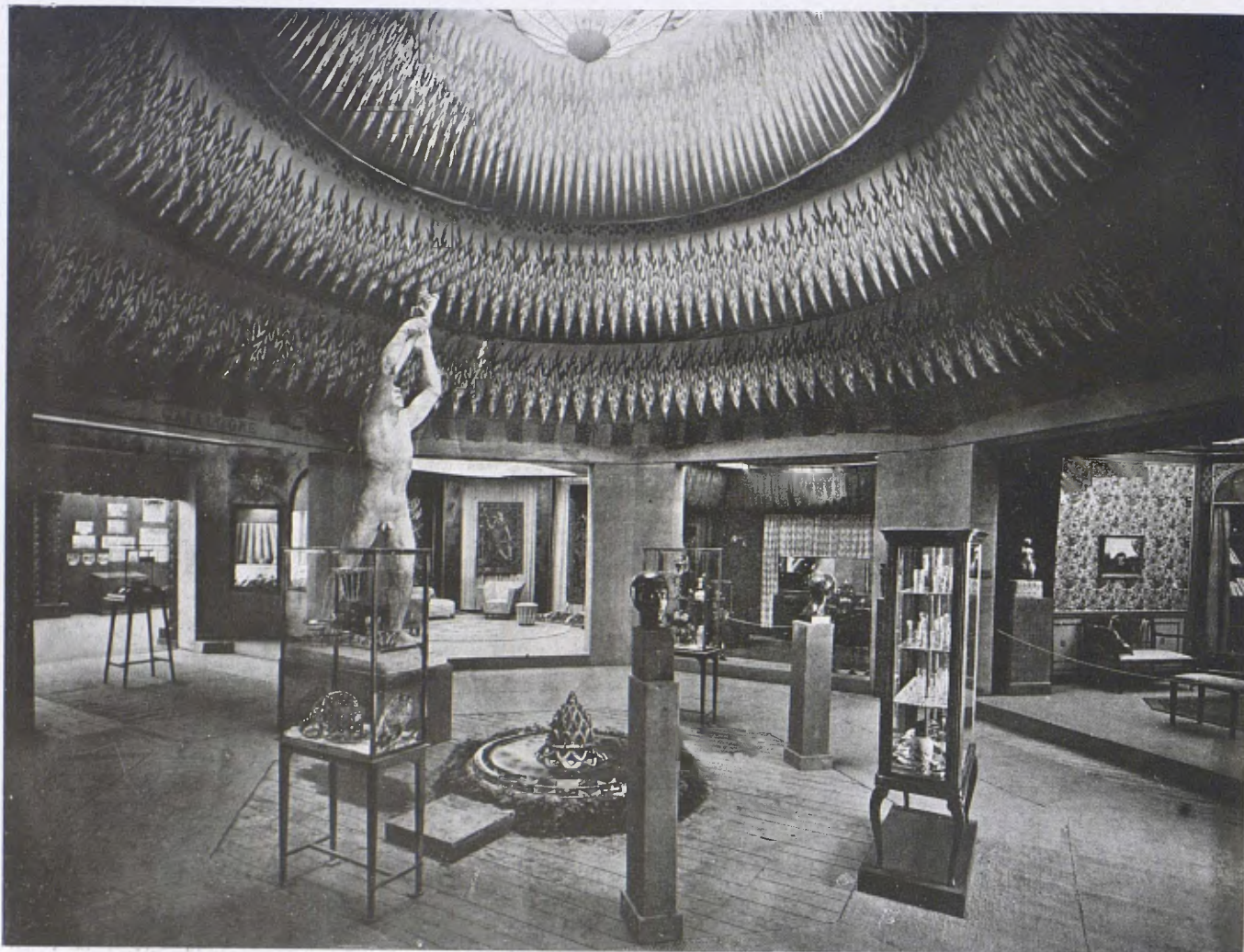
La instal·lació del Foment de les Arts Decoratives de Barcelona a l'Exposició Internacional de les Arts Decoratives de París (Galeria Saint Dominique).