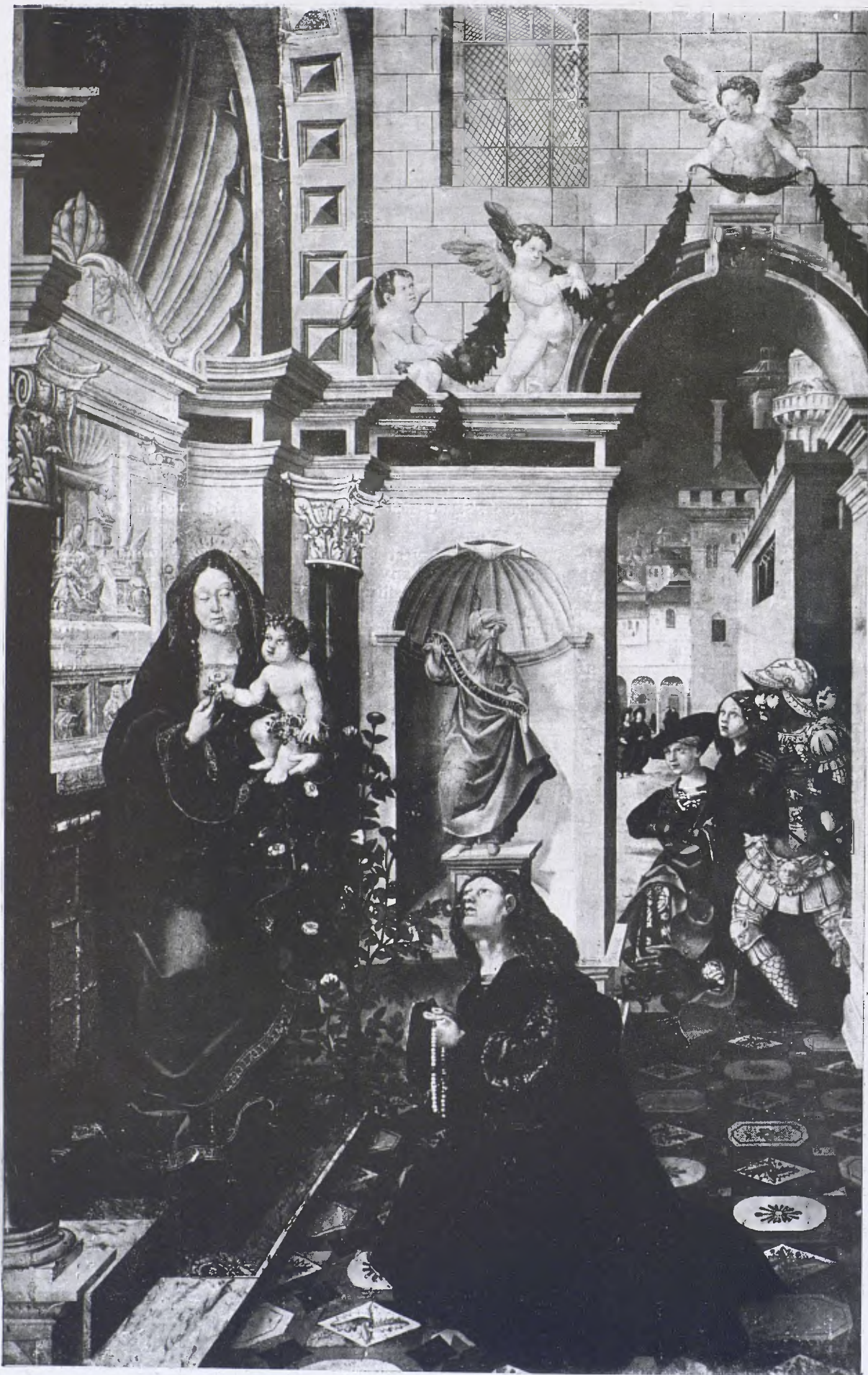
Retaule inèdit valencià amb la representació de la llegenda del Cavaller de Colunya, segle XVI.

fusta, els constructors han conegut la volta amb tota la complicació dels arcs de reforç. La solució és brutal: Hom comença a construir pilars des dels extrems dels arcs formers; hom segueix la nova estructura sense fer atenció a les columnes que s'in-