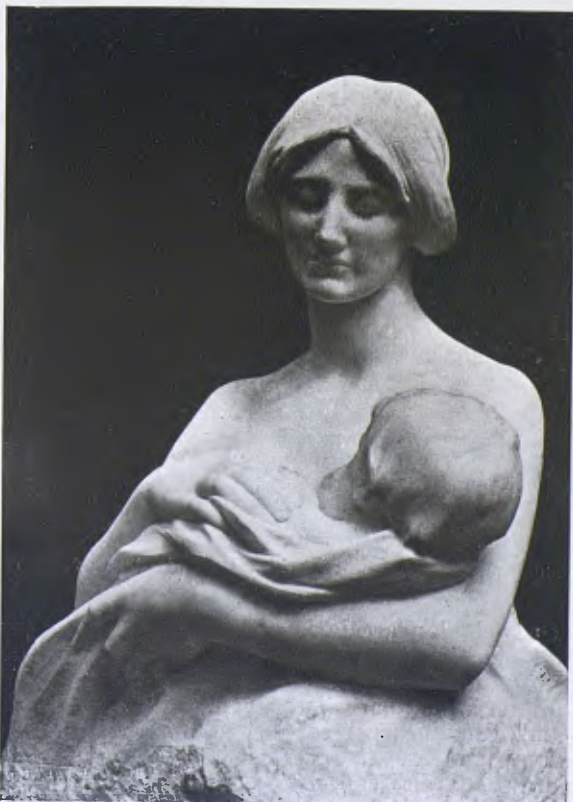
«Maternitat» marbre de Josep Llimona (1925).