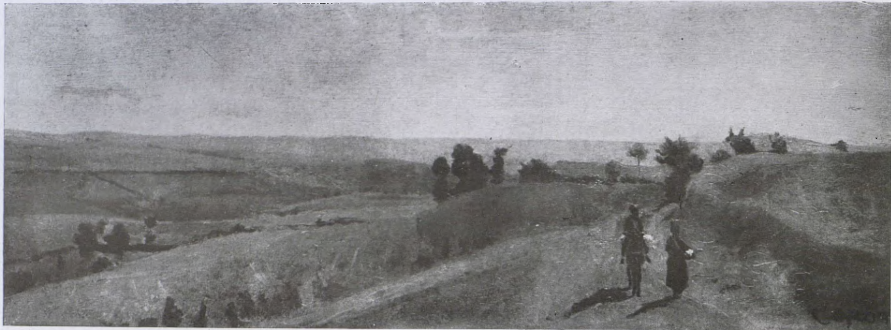
Corot. — Una obra inèdita de Corot, a l'Exposició dels Cent anys de Pintura Francesa, celebrada a París darrerament. (Comunicada per D. Carles.)

d'aquella data ençà, però no era cosa nova a la nostra terra si tenim en compte que un segle i més enrera era fundada a Valls, a Barcelona i a altres punts de casa; mes la victòria assolida al golf de Lepant amb l'ajut del Rosari és una pàgina de la història naval de tanta catalanitat, que català era el seu cabdill, catalana la nau capitana, catalans els seus principals herois, català el poeta que més altament va cantar-la, de naturalesa i ciutadania catalana aquell qui més gloriosament va posar-la en polifonia, i per si això no fos prou, dos catalans, per revelació divina, van hebre esment del resultat victoriós de les armes cristianes contra la mitja lluna. També havia d'aixecar-se a Catalunya el més gran monument de la memorable batalla de Lepant, i per això a la capella del Roser de Valls poden admirar-se unes rajoles vidriades representant aqueix fet tan fonamental en la història del Cristianisme.