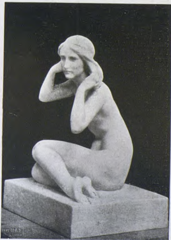
«La cabellera» marbre de Josep Llimona (1925).