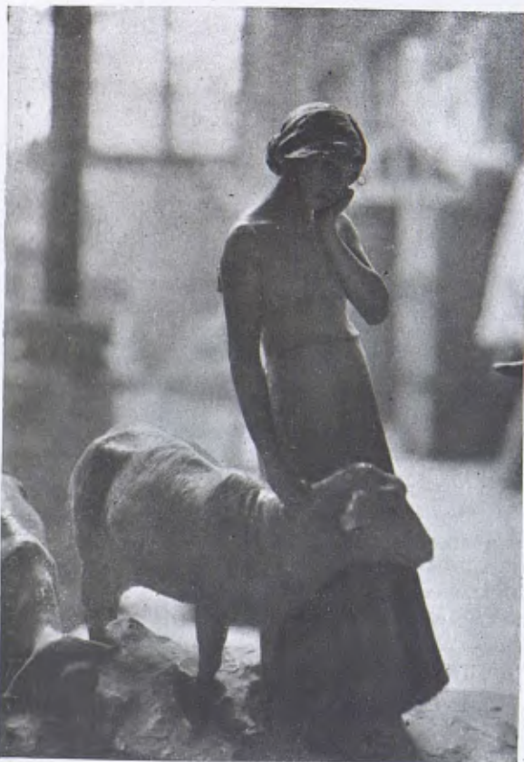
Detall de «Pastoral», per Josep Llimona.

Causes diverses han transformat la basilica coberta de fusta en basilica coberta en volta. La transformació fou feta en data primitiva a l'Orient, mes l'Occident ha conegut tan mateix primitivament la volta. El Mirhab i la Maksura de la Mesquita de Còrdova, construcció d'Alhaquem II (987-990), són en volta. La capella del «Santo Cristo de la Luz», resta d'una antiga mesquita del segle x, és també voltada. La volta ha existit en les esglésies mus-