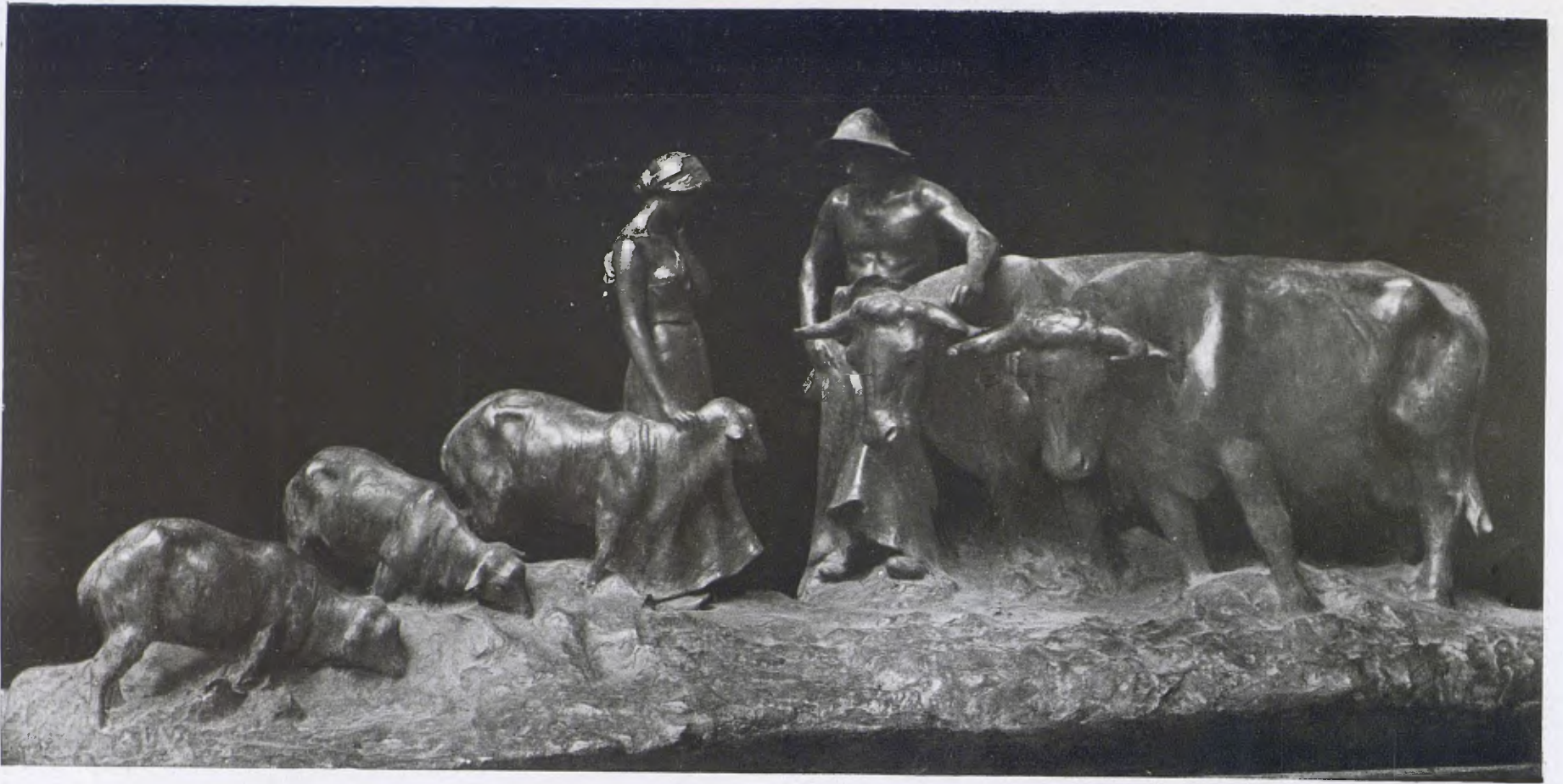
«Pastoral». — Grup escultòric en bronze de Josep Llimona en una col·lecció particular argentina.

ralista i el seu home escultòric és l'home transcendent i representatiu; el tipus humà; no el cas.