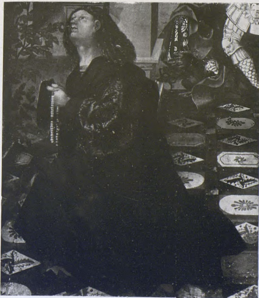
Detall del retaule del Rosari.

La batalla de Lepant fou causa de que es fundessin moltes confraries del Roser a tot arreu; també se'n van fundar moltes a Catalunya