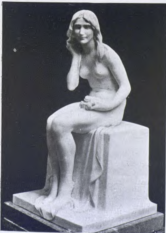
«La Primavera» marbre de Josep Llimona (1925).

Observem la permanència dels caràcters. Totes les esglésies que tenen el sistema de volta, el més elemental (volta a migpunt sense arcs torals, que és el d'imitació romana), tenen també els caràcters d'arcaisme remarcats en les esglésies primitives cobertes en fusta: arcs del cor precedint els absis, ben senyalats, i qualque vegada atrofiats, més baixos que les naus; l'antiga finestra de ventilació de les teulades, devinguda inútil, i que posada damunt el cor dona una llum pàlida a les voltes de la nau; decoració de petits arcs cegats, entre les faixes lombardes, concentrada als absis. El tipus creat és perpetua. La llei de permanència és confirmada. Trobem la forma igualment