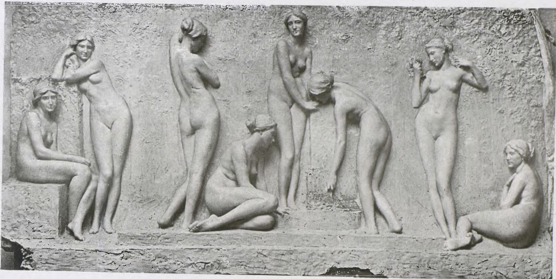
«La Font», baix relleu de Josep Llimona, Sala d'Honor a l'Exposició d'Art de Barcelona 1921.

aràbigues, i el reialme d'Astúries, al nord d'Espanya, ha conegut en ple segle IX l'«opus foniceum» en els temples i en els palaus, i d'ell parla el text «sine liquo miro opere infernis supernisque cumulatum».