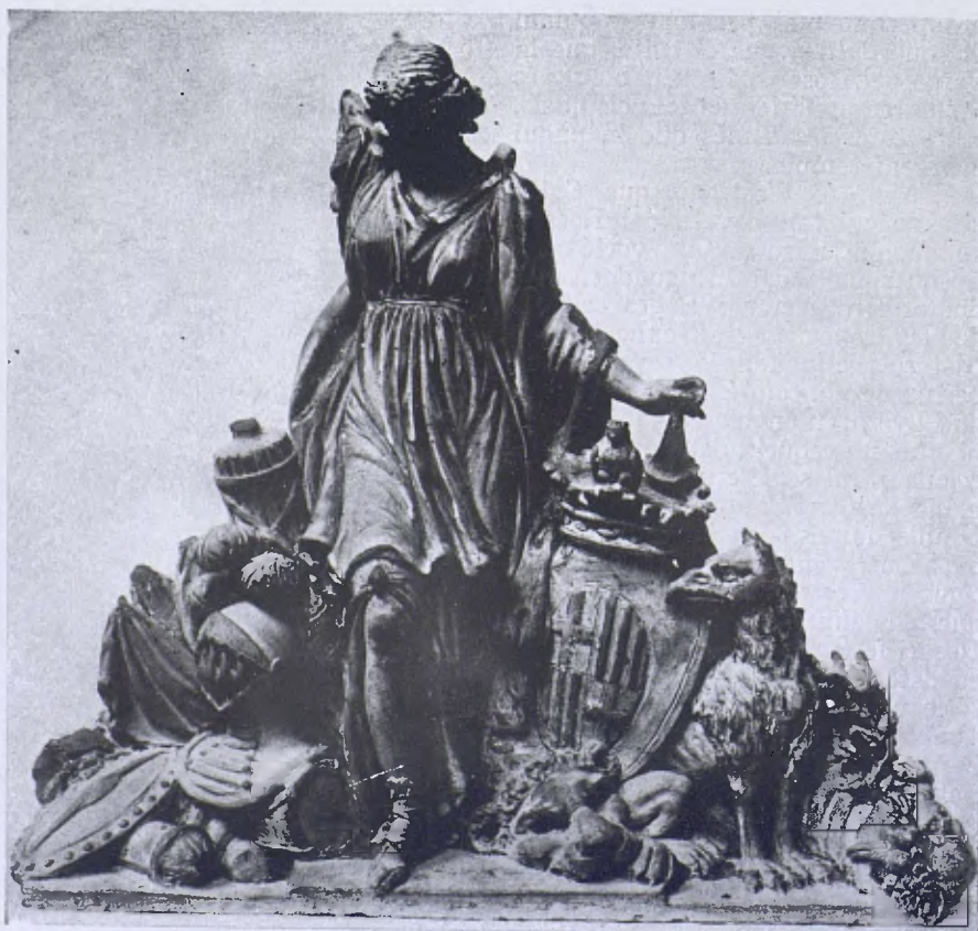
Bocet d'en Padró pel cimal de la façana de la Casa de la Ciutat. (Museu de Belles Arts.)

Així, doncs, ha d'ésser obra d'en Padró; però si ell ja presentà el seu model al concurs, quin origen té