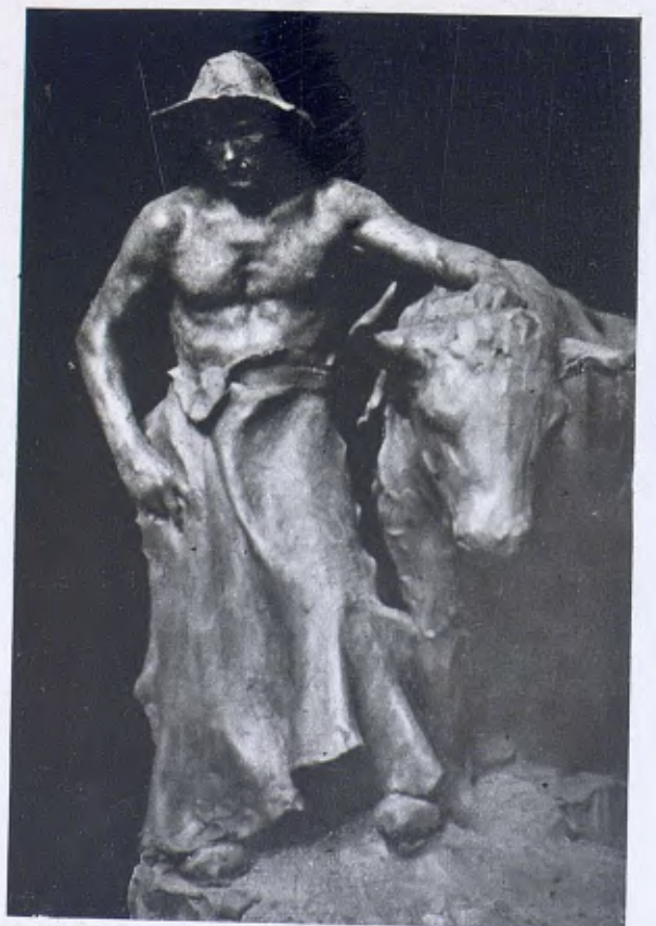
Detall de «Pastoral», per Josep Llimona.