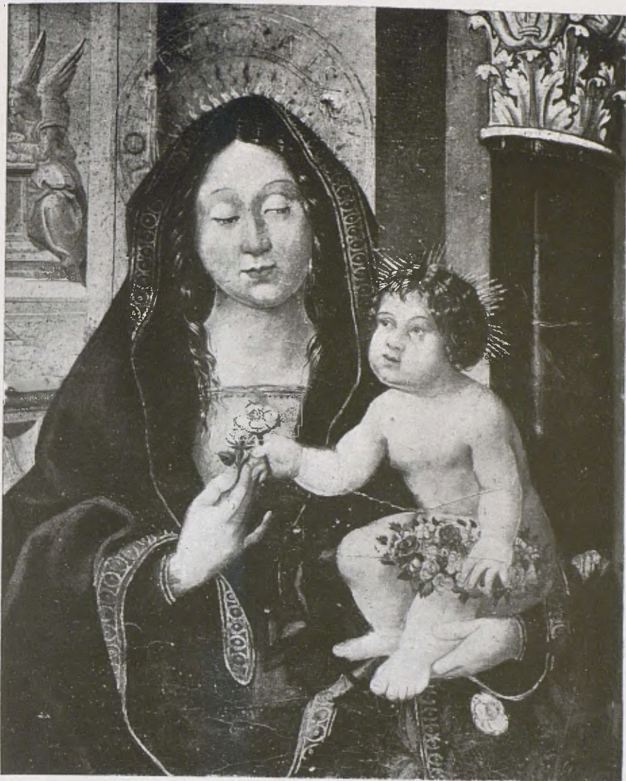
Detall del retaule del Rosari.