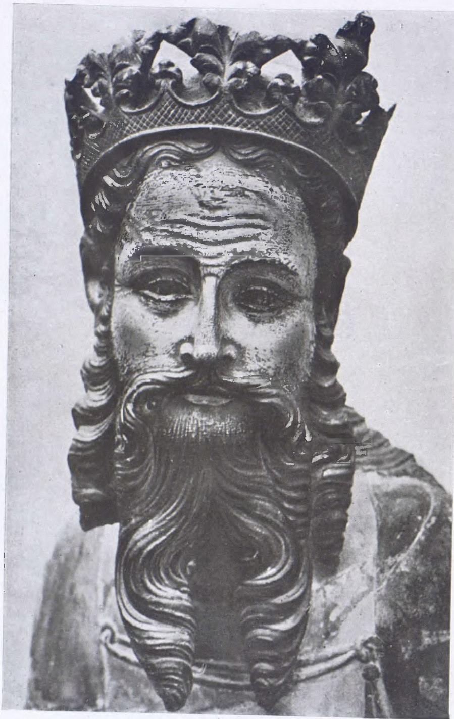
Bust de l'estàtua de La Figuera. (Segle XIV.)

L'interior de les esglésies ha sigut de vegades emblanquinat amb calç i el color blanc, com als Balkans, ha omplert també els murs exteriors; potser, en un sentit literal, la frase de Rahlou Glaber, és: la terra s'és veritablement vestida de la blanca roba dels temples , però molt sovint la rica policromia ha omplert l'absis i qualque vegada els murs de l'interior del temple. Els temes són la visió d'Isaïas: el Pantocrator entre els quatre animals sagrats, de vegades amb els serafins purificant els llabis del Profeta, amb una brasa encesa, o les rodes del carro de Déu descrites pel Profeta, d'altres on la Verge en el seu tron, dins la conca de l'ab-