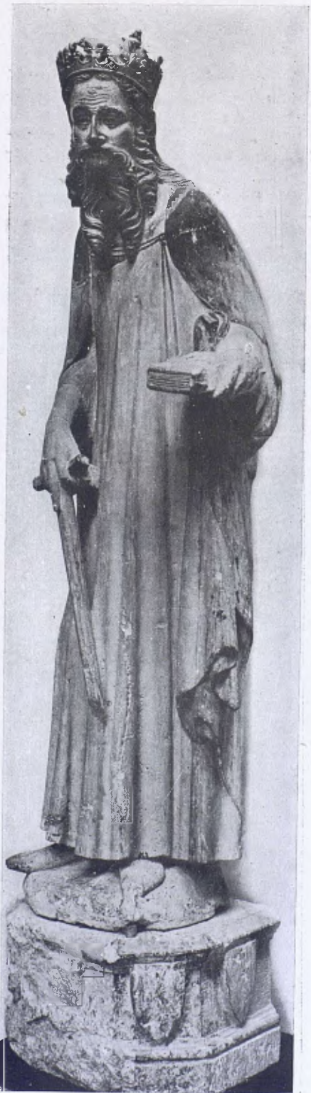
L'estàtua de la Figuera.