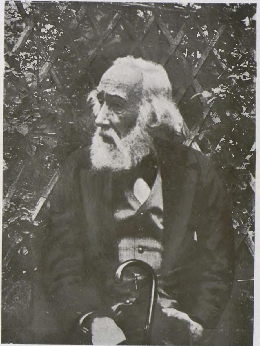
El darrer retrat del pintor Degàs.