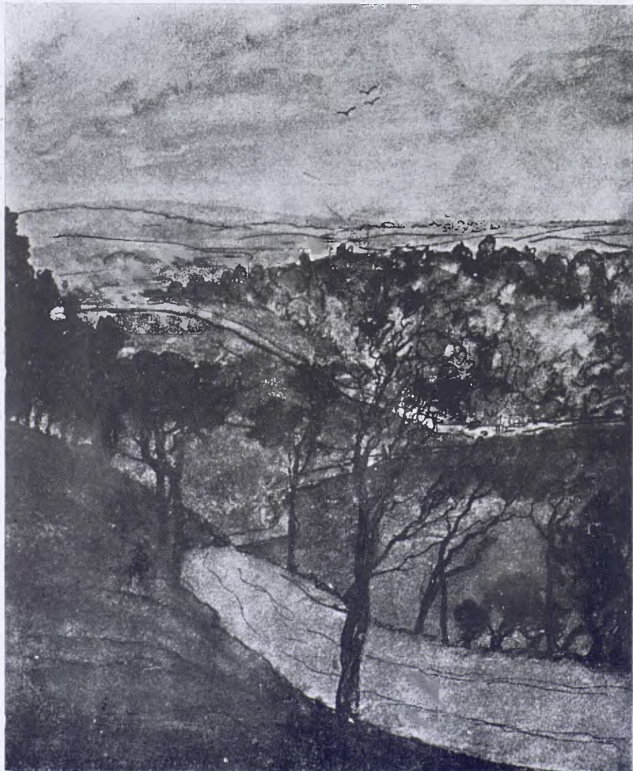
E. DEGAS. — Dibuix de paisatge, ploma i aigua-tinta.