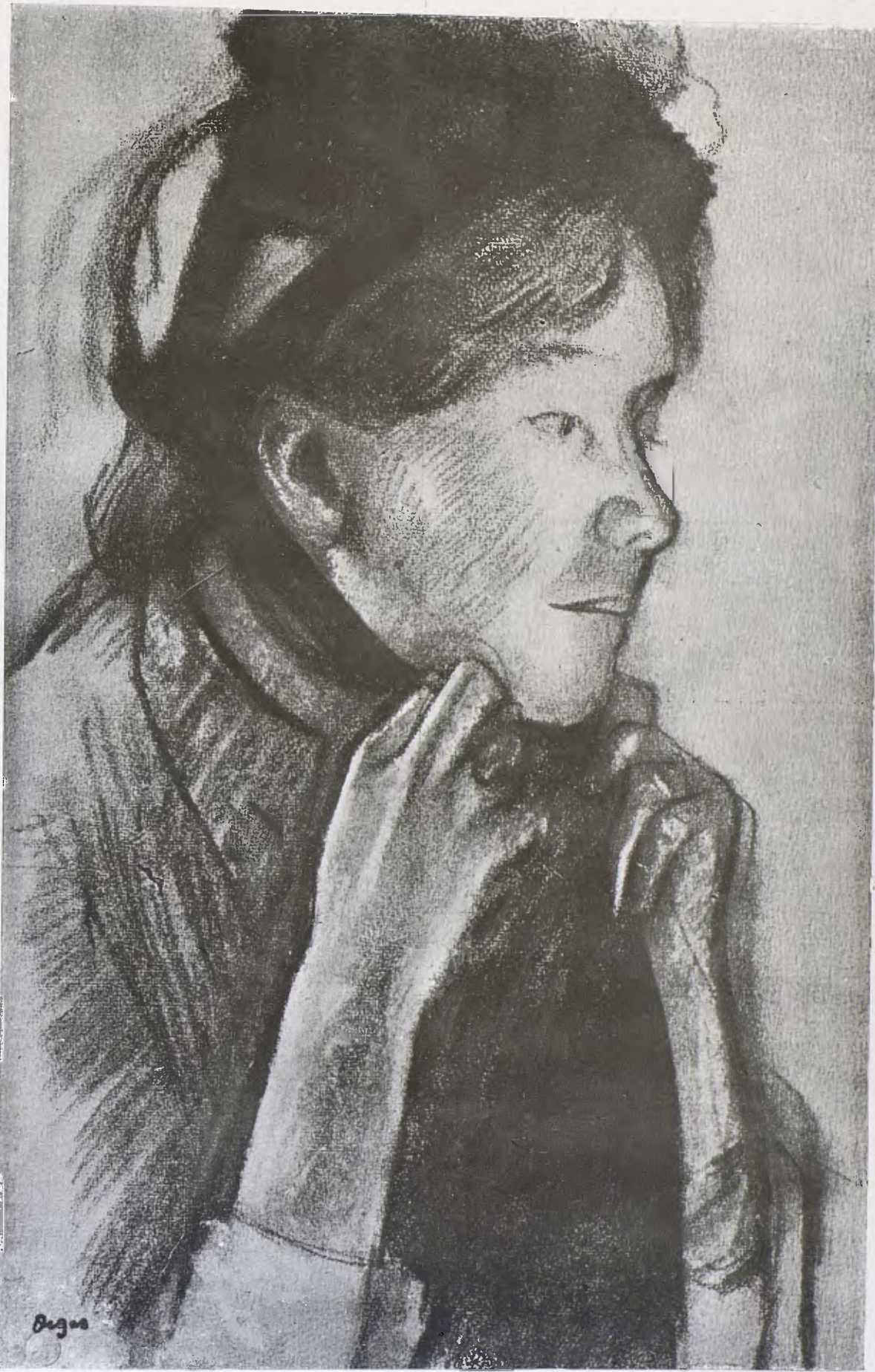
E. DEGÀS. — Dibuix.