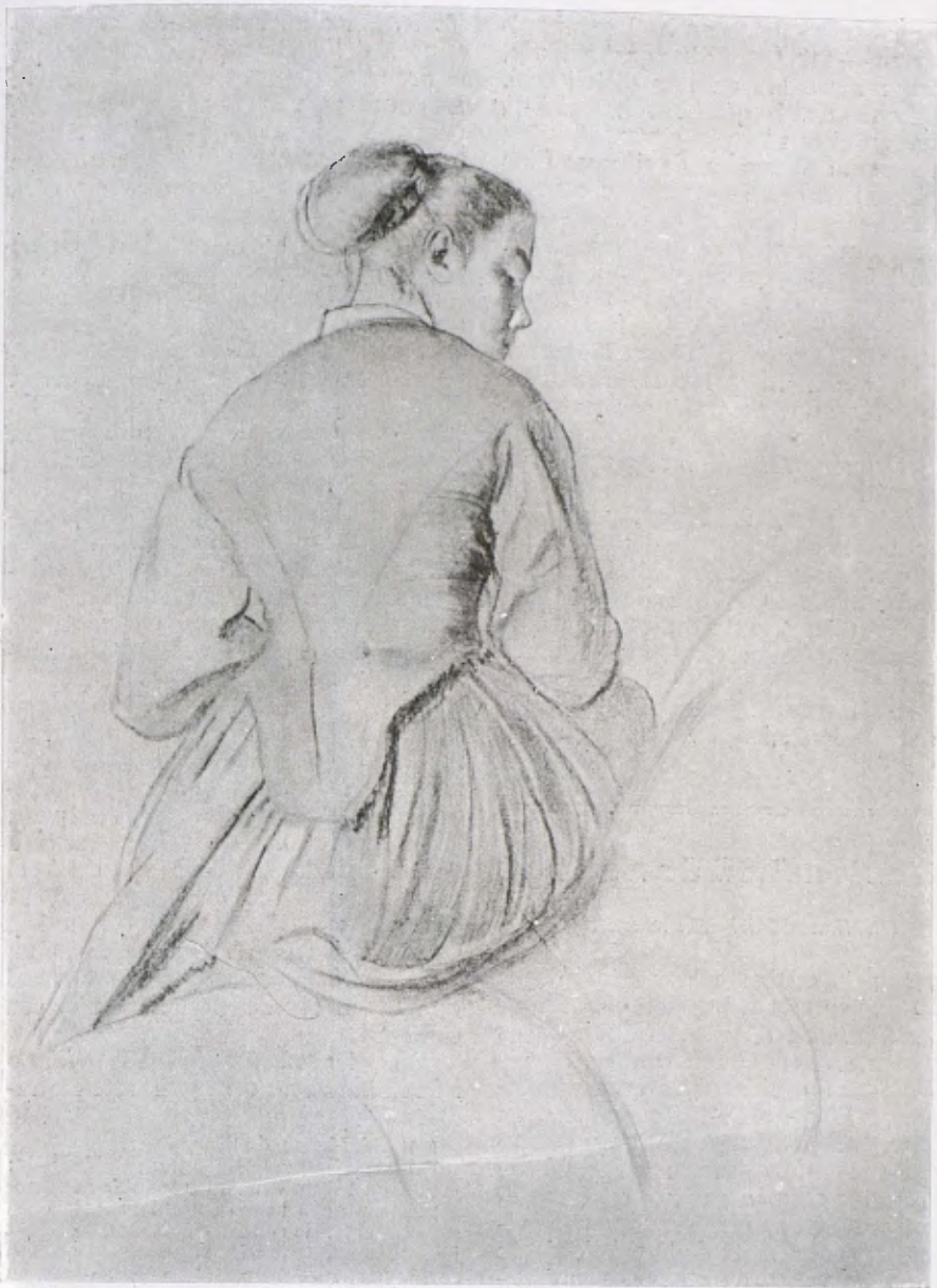
E. DEGÀS. — Dibuix de la primera època.

pòsit de Gustau Moreau, Degàs estava convençut de que «la individualitat de l'artista no deu en cap cas produir-se en públic, i que és convenient a l'home el desaparèixer darrera l'obra».