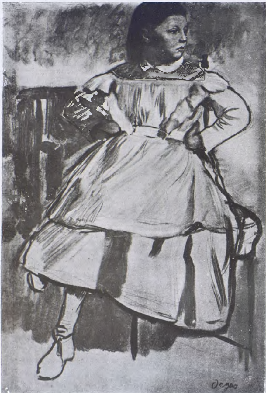
E. DEGAS. — Dibuix colorit.

que les seves obres aconseguien al mercat, els seus darrers anys pot dir-se que els passà fora de la vida, esperant la mort, els seus cabells llargs, enterament blancs, auriolant-lo; la barba blanca com els cabells, els trets del rostre reposats, tenia una figura bellament impressionant. No va deixar ja més el seu pis,