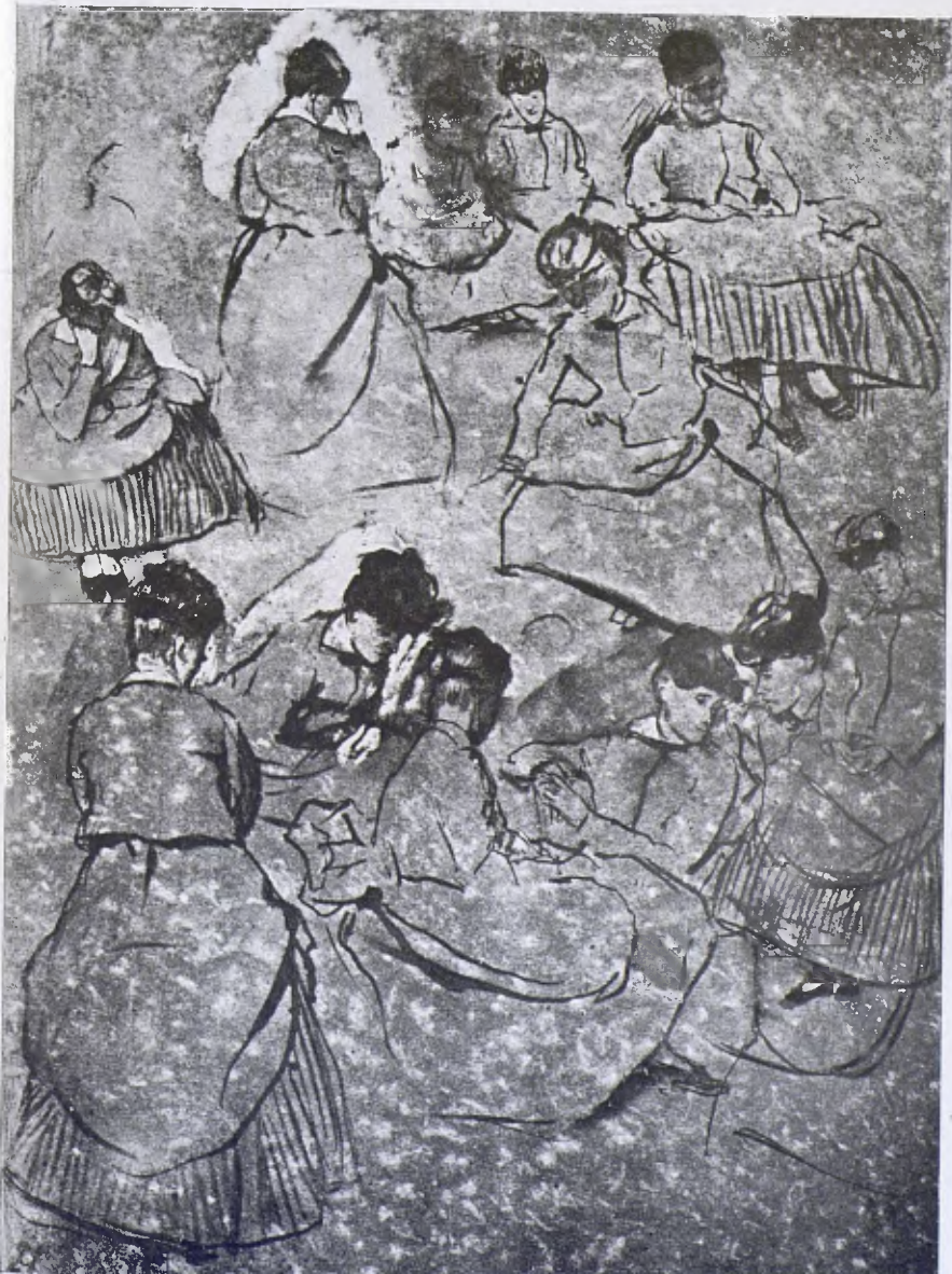
E. DEGÀS. — Apunts colorits.

també en actitud d'oració, vers la imatge superior central.