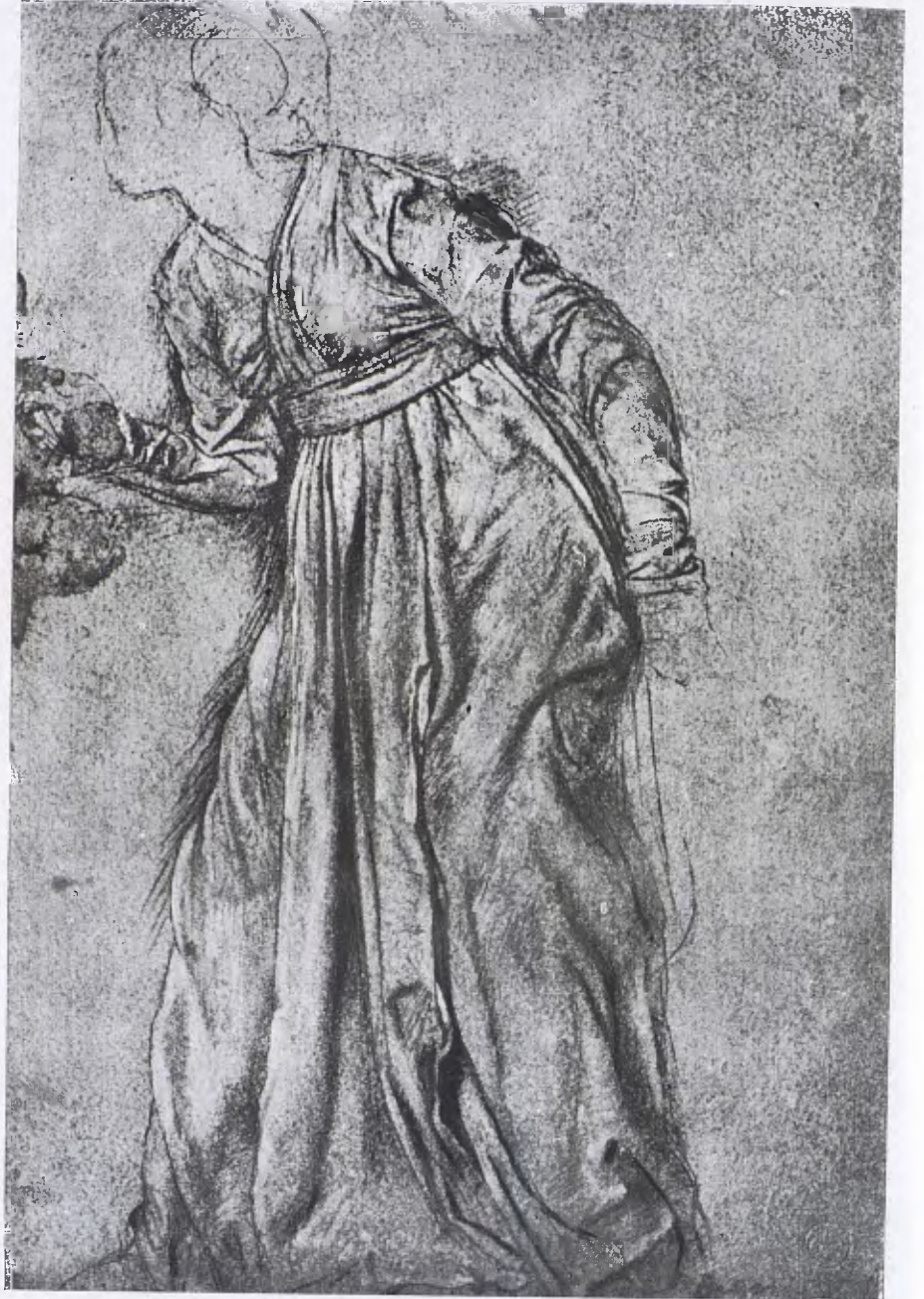
E. DEGÀS. — Dibuix de la primera època.

Sabina Neyt, en anar-se'n de vella, li presentà a una certa Clotilde, que