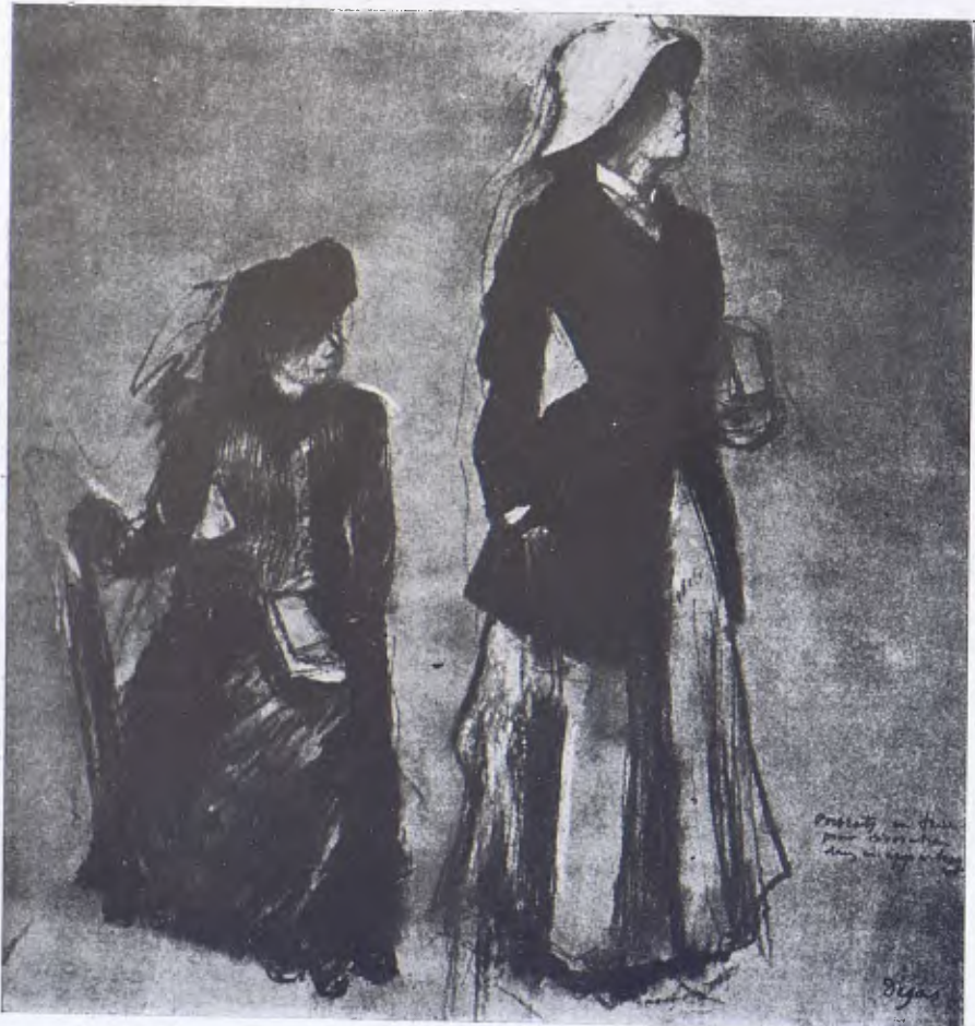
E. DEGÀS. — Dibuix colorit.

Mai no parlava de la seva obra. Tal com ho ha escrit Ary Renan, a pro-