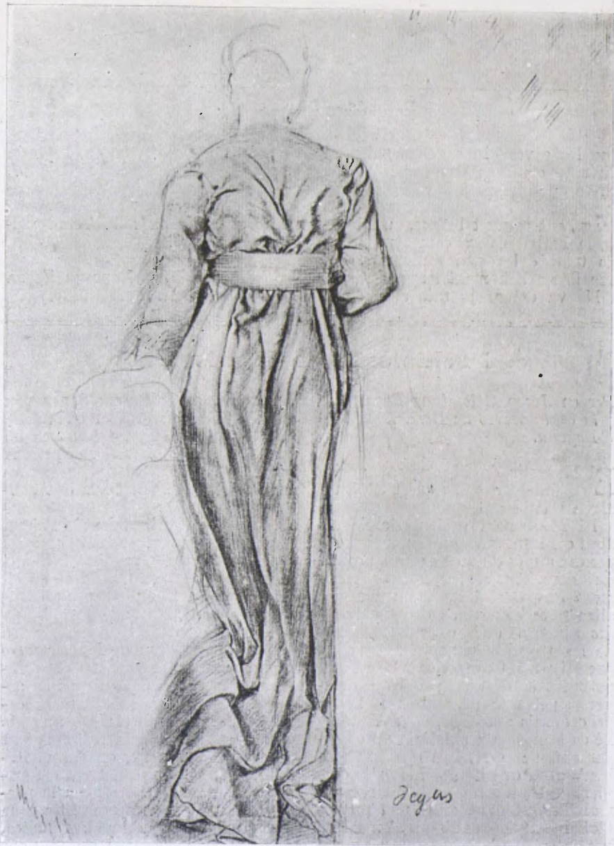
E. DEGÀS. — Dibuix de la primera època.