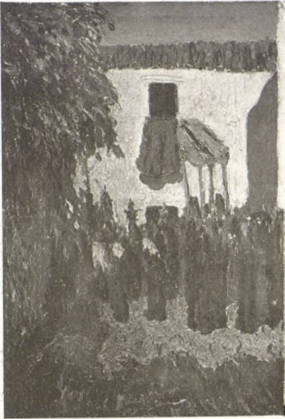
NICOLAU RAURICH. — «Processó». Exhibida a les Galeries Damians.