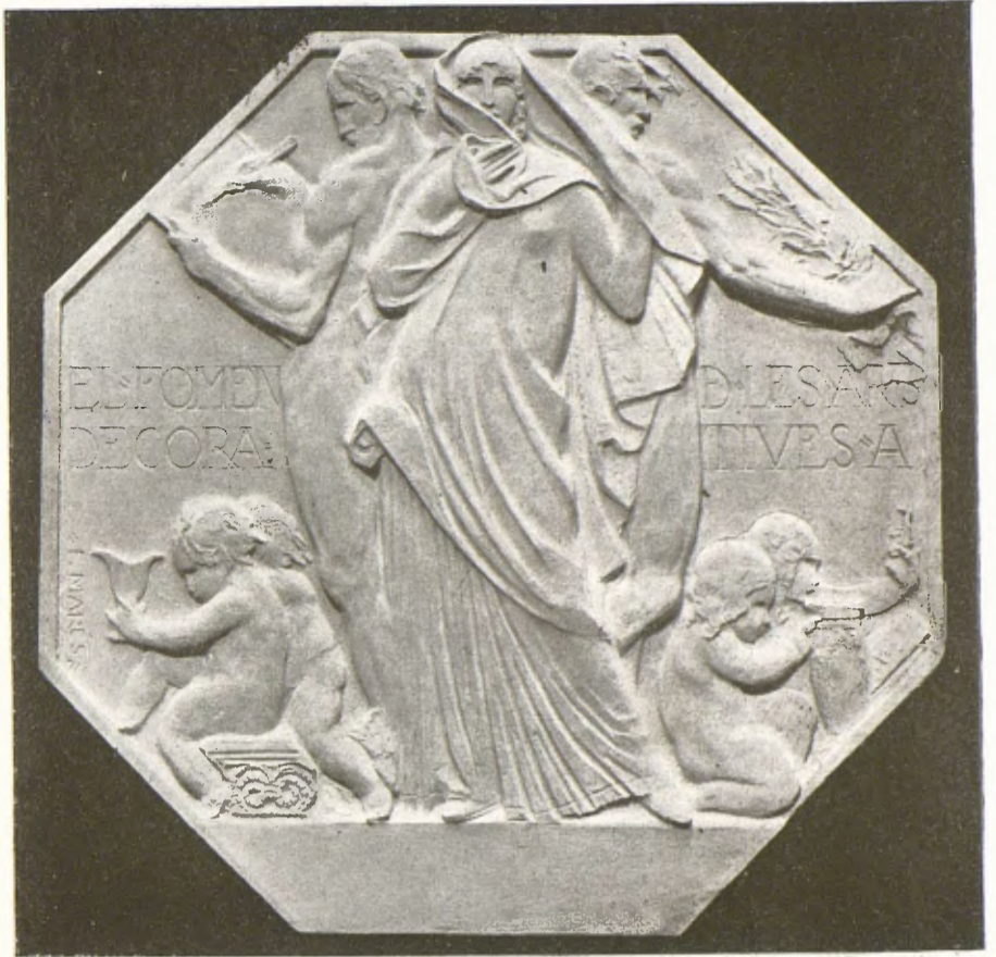
FREDERIC MARÉS. — Model de la Medalla del Fomento de les Arts Decoratives.

liric. Pensem en les paraules profundes de Walter Pater: «tot art aspira a la condició de la música»; és a dir, que forma i matèria — llegeixi's tema, llegeixi's joia o dolor, llegeixi's accident o fenomen plàstic — facin una sola valor d'expressió. Ni més ençà, ni més enllà: ni cap a la part de la intel·ligència, intransigent en la seva jerarquia, ni cap a l'embriaguesa dionisiaca, on les formes s'apassionen a encalçar-se elles mateixes per destruir-se, i reneixer continuament canviades, i esvair-se de nou. És l'instant líric, repetim: l'únic en què són compatibles els termes concret i inefable, ordre i transfiguració. És ja un tòpic, i si no ho és haurà d'esdevenir-ho, que un paisatge de Rafel Benet té ànima. Però, entengui's bé, no una ànima de préstec, rebuda per la ingerència d'una intenció especta-