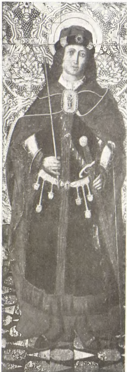
Taule de Sant Sebastià, d'escola aragonesa de la fi del segle xv, procedent del Monestir de Sixena a l'Aragó. Museu de la Ciutadella de Barcelona.

beneïda dels déus i maleïda dels homes, que tan fecunda sempre fou en grans escultors i on els escultors sempre han maldat com si fossin raça maleïda, ha tingut al menys la gràcia d'atorgar fortitud, si no fortuna, als nostres escultors. Són molts els nostres escultors que han hagut de bregar desesperadament fins entrada la maduresa, i alguns n'hi han hagut, i no pas dels pitjors ni dels mitjans, que han acabat a la bogeria o bé que han hagut d'arribar a la vellesa i a la mort sense haver aconseguit un sol jorn de contentament. Així i tot, ni un sol no ha defallit; tots han complert heroïcament fins al cap d'avall la missió llur de llegar-nos obres fermes i duradores que no són ben pagades ni a pes d'or.