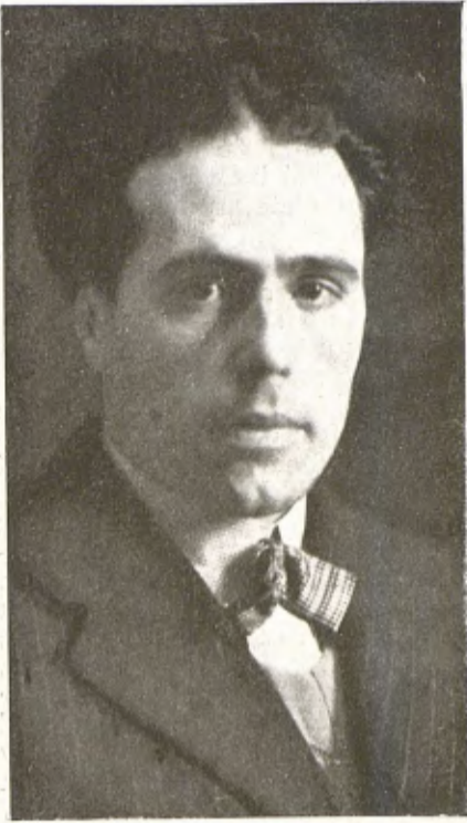
L'eminent escultor Frederic Marés, que ha celebrat darrerament una exhibició molt notable de les seves obres a la Sala Parés.

riència i la manca de la mica d'ironia (que dona a totes les coses humanes la valor relativa que tenen) fa explicables.