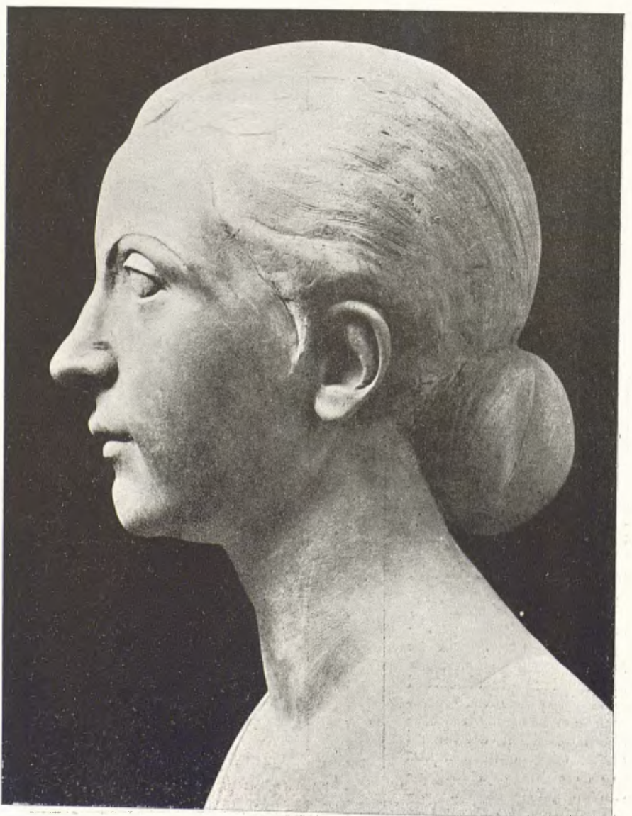
MÀRIUS VIVES. — Retrat.