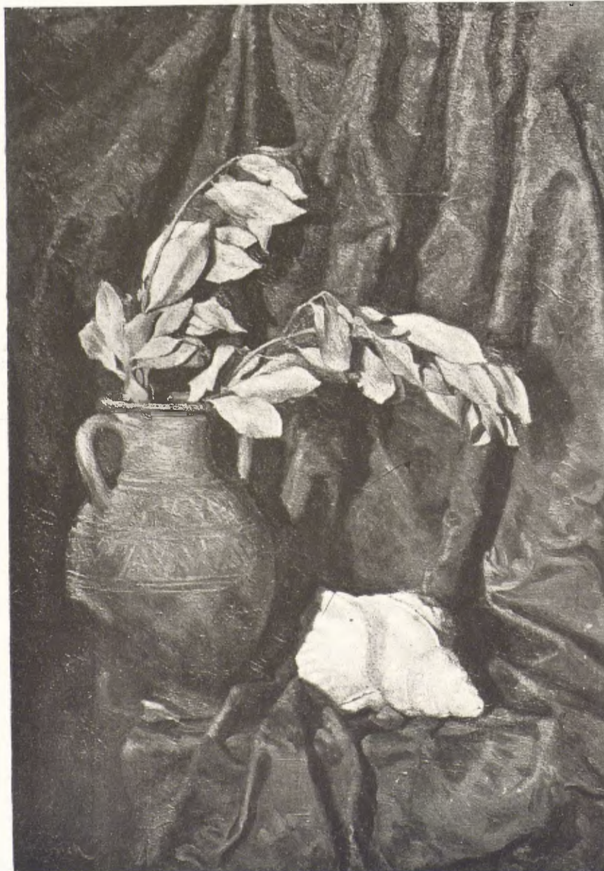
«El gerro i el corn». Una de les darreres obres de Nicolau Raurich, exhibida a les Galeries Damians.