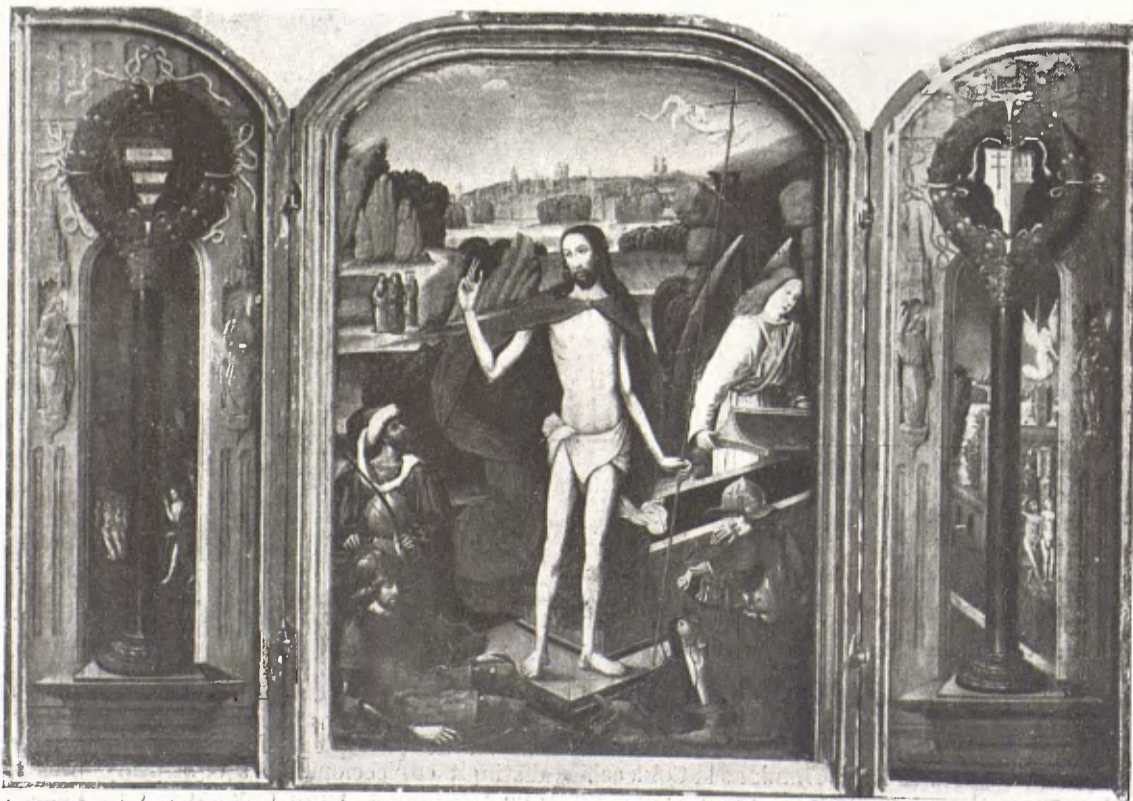
Triptic d'escola espanyola de principis del segle xvi, de la Col·lecció Sabater, de Badalona, ara exhibida a les Galeries d'Exposicions d'Art de la Casa Damians.