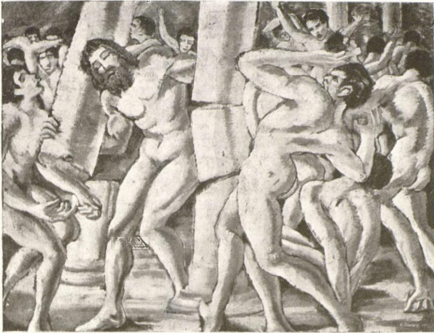
K. GOUSSEFF. — «La venjança de Samson.»