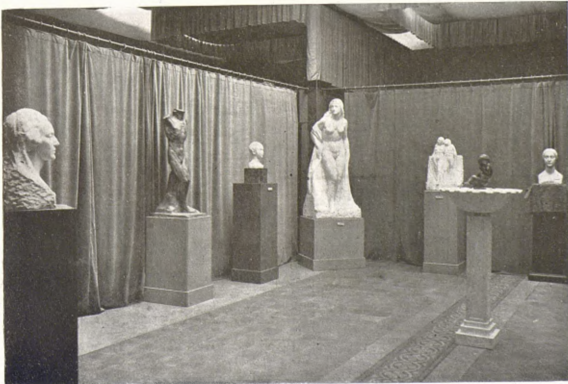
Un aspecte de l'Exposició Marés a la Sala Parés.

Però, encara que faci paradoxa de dir-ho d'un artista que tan tenaçment ha renovat la seva pròpia tècnica, el pintor d'aquests paisatges resta més aviat també fora amb nosaltres, quasibé espectador, quasibé anònim. Ha cercat la humilitat vera de l'artista, la qual és en l'habilitat que sempre troba el mitjà per a adequar-se, i no pas en la il·luminació, massa ràpida, i també massa hàbil perquè la mà sempre la pugui seguir. Hom li ha dit incorruptible, i des d'aquest punt de vista ens