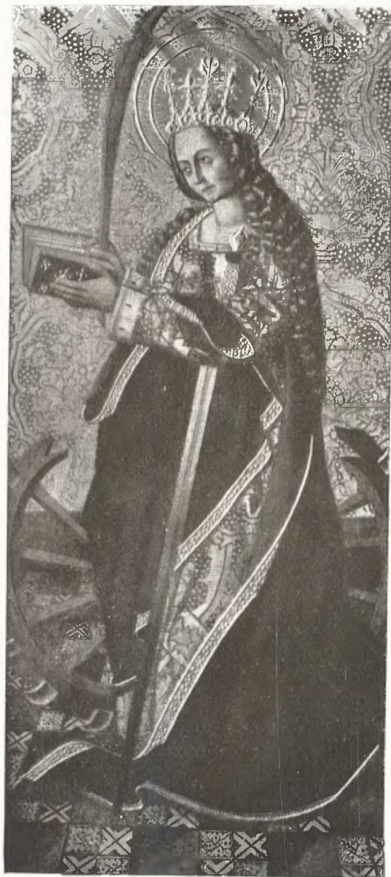
Taule de Santa Caterina a la Col·lecció Kuno Kocherthaler a Madrid.

Marés s'ha fet, doncs, dins el seu art, una personalitat i una especialitat ben definida. Totes les seves obres de joventut assenyalen ara l'estel·la del seu esforç adreçat cap a aquesta finalitat artística, dins la qual tan plenament va triomfar a Madrid l'any passat, i ara, a Barcelona, en l'exhibició celebrada a la Sala Parés.