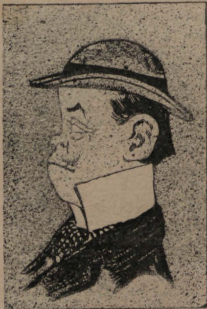
—Daremos un paseo y disfrutaremos del día.