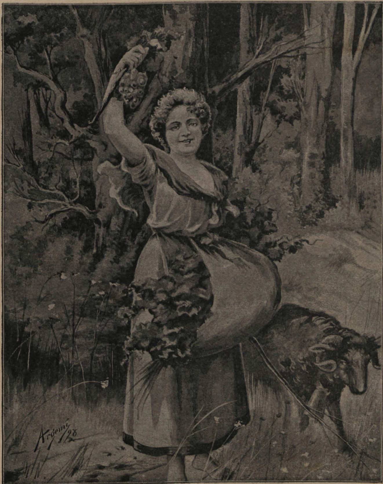
ALEGORÍA, POR ARGEMÍ.