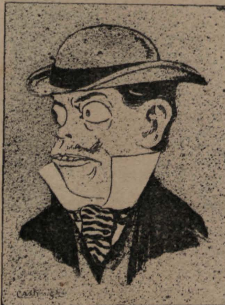
—Allí viene el sastre; ¡me partió!