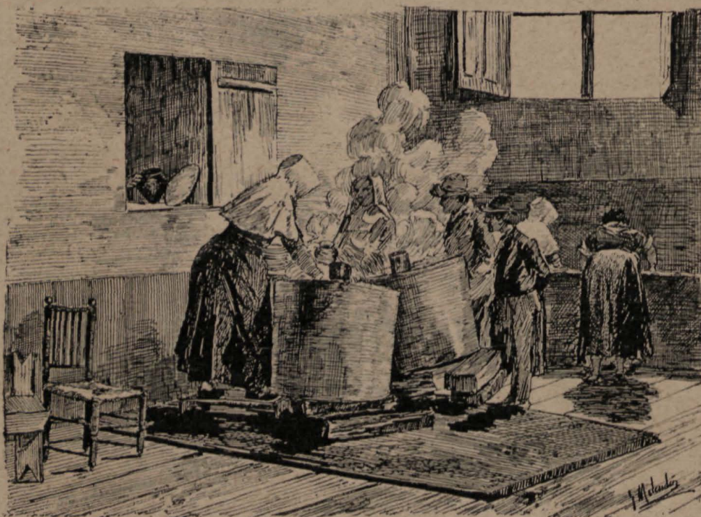
LA CARIDAD OFICIAL.

ción, y emprenderán viajes de recreo, ó mejor dicho, paseos higiénicos en bicicleta, desde Madrid á Aranjuez y vuelta, ó del Congreso á Leganés ó á Puerto Lápiche.