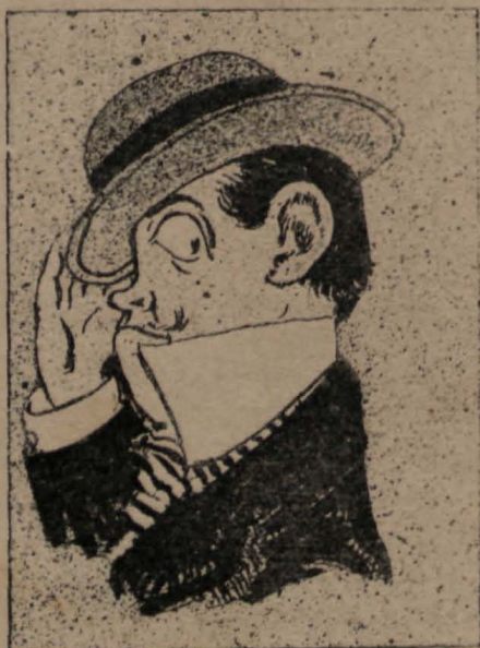
—Nos taparemos, que no nos vea!