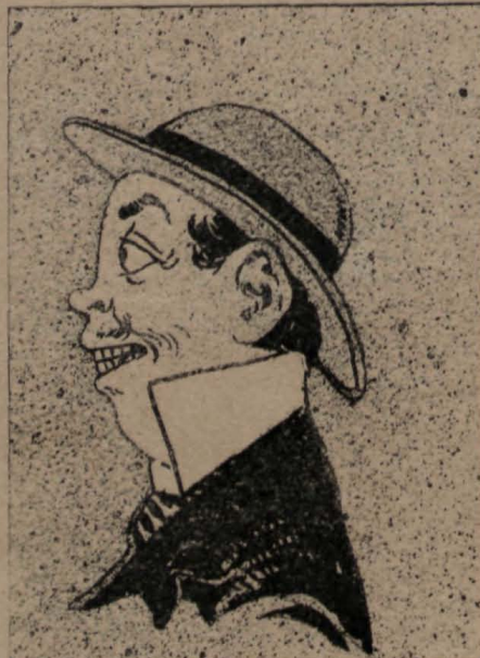
—Se fué por otro lado ¡respiremos!

Ni esto se puede sufrir ni esto se puede aguantar; y si hay quien sabe tachar con indecible... frescura , eso, más bien que censura, es ganas de jorobar.