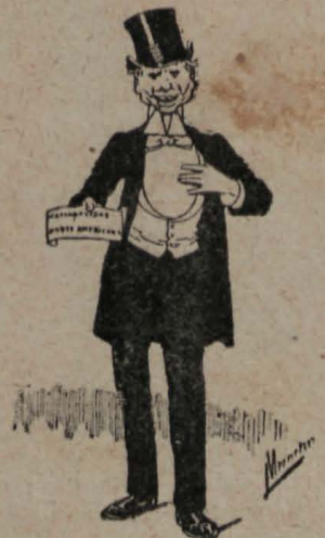
12.—Mas, el caballero acredita su nacionalidad norte-americana..... ¡y boca abajo todo el mundo!