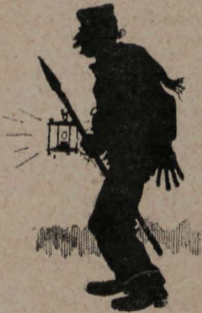
6.—Y hasta á las autoridades nocturnas.