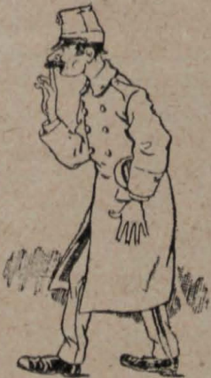
5.—Y á los del Orden.