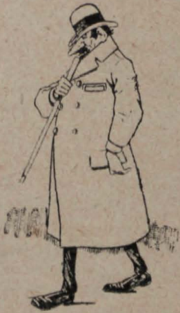
1.—Un agente de la frontera, ha sabido confidencialmente que.....