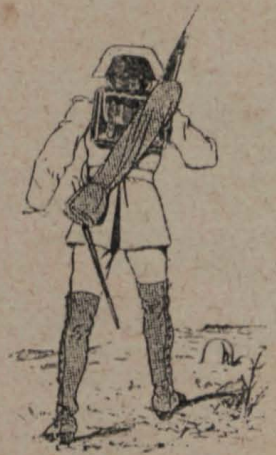
4.—Como así mismo á la Guardia civil.