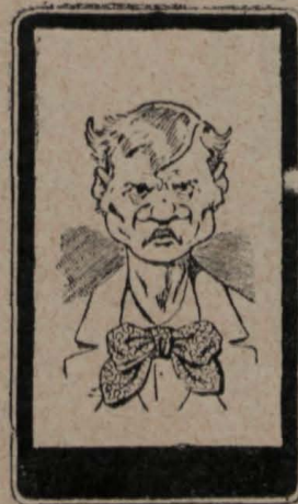
7.—Facilitándoles, por supuesto, á todos ellos un retrato del terrible criminal.