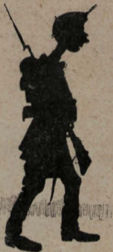
10.—El cual, manda acuartelar las tropas.