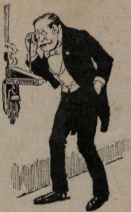
9.—Este, se pone en comunicación con el gobernador militar.