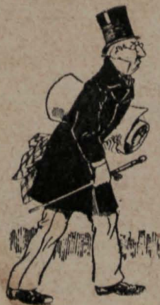
11.—Mientras el juzgado extiende y trasmite el correspondiente auto de prisión.....