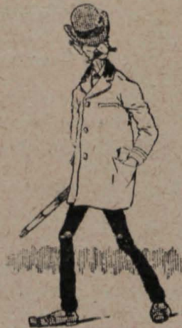
3.—Por lo que se dan terminantes órdenes para tener en movimiento á los de la secreta.