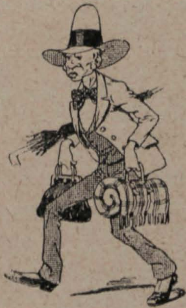
2.—Un sujeto peligrosísimo, ha logrado entrar en España con fines non-santos .