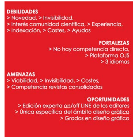
Figura 1. Amenazas/Debilidades/Fortalezas/Oportunidades