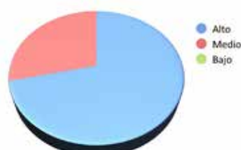
Figura 4. Interès de les aportacions