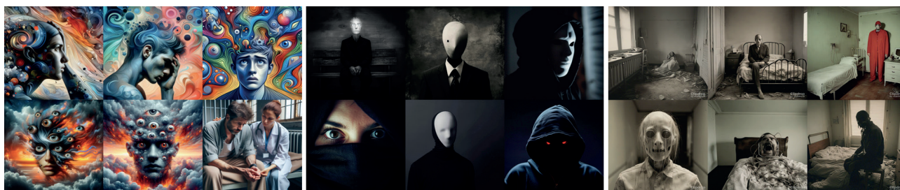
Figura 1. La esquizofrenia paranoide según la IA.