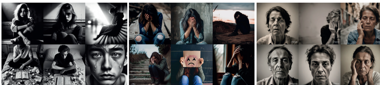
Figura 2. El trastorno de depresión mayor según la IA.