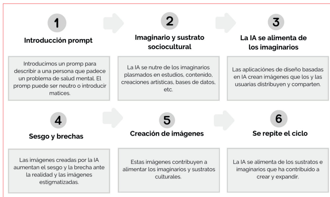
Figura 4. Infografía sobre el ciclo sesgo y brecha a través del diseño GenAI.

ciones usadas y en cada uno de los problemas de salud mental recreados visualmente. Sin embargo, existen una serie de elementos, variables y características que son comunes o mayoritarias. En primer lugar, en 53 de las 54 imágenes la persona afectada está representada en soledad y solo en una fotografía está acompañada por otra persona, concretamente por una doctora, aunque la persona acompañada parece estar en una cárcel o habitación con rejas, lo cual también hace que la única excepción sea bastante singular en este sentido. Otro resultado a destacar es que existe cierta tendencia a que la persona representada sea una mujer joven, mientras que los hombres solo aparecen en 15 imágenes de 54, aunque cabe señalar que en 11 imágenes no se puede determinar el sexo de la persona representada. En cuanto al tipo de raza, no hay representación de todas las razas, en solo 2 imágenes hay personas que podrían considerarse afroamericanas, no hay ninguna representación asiática, la gran mayoría de los representados parecen ser caucásicos. Respecto al rango de edad, sí existe más variedad, aunque el rango entre los 20 y 25 años es el más común, mientras que no hay representación de menores.