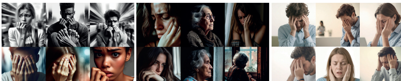
Figura 3 . La ansiedad según la IA.