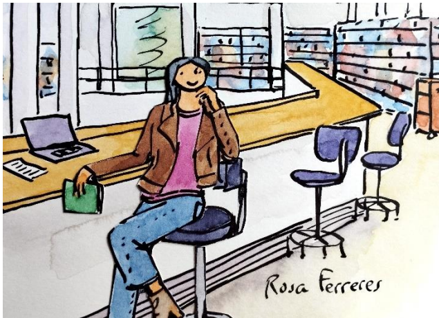
Rosa Ferreres (julio 2023)