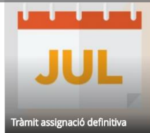
Tràmit assignació definitiva