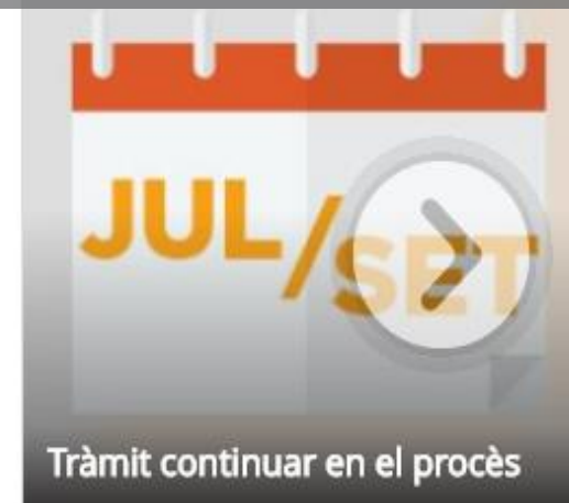
Tràmit continuar en el procés