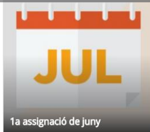
1a assignació de juny