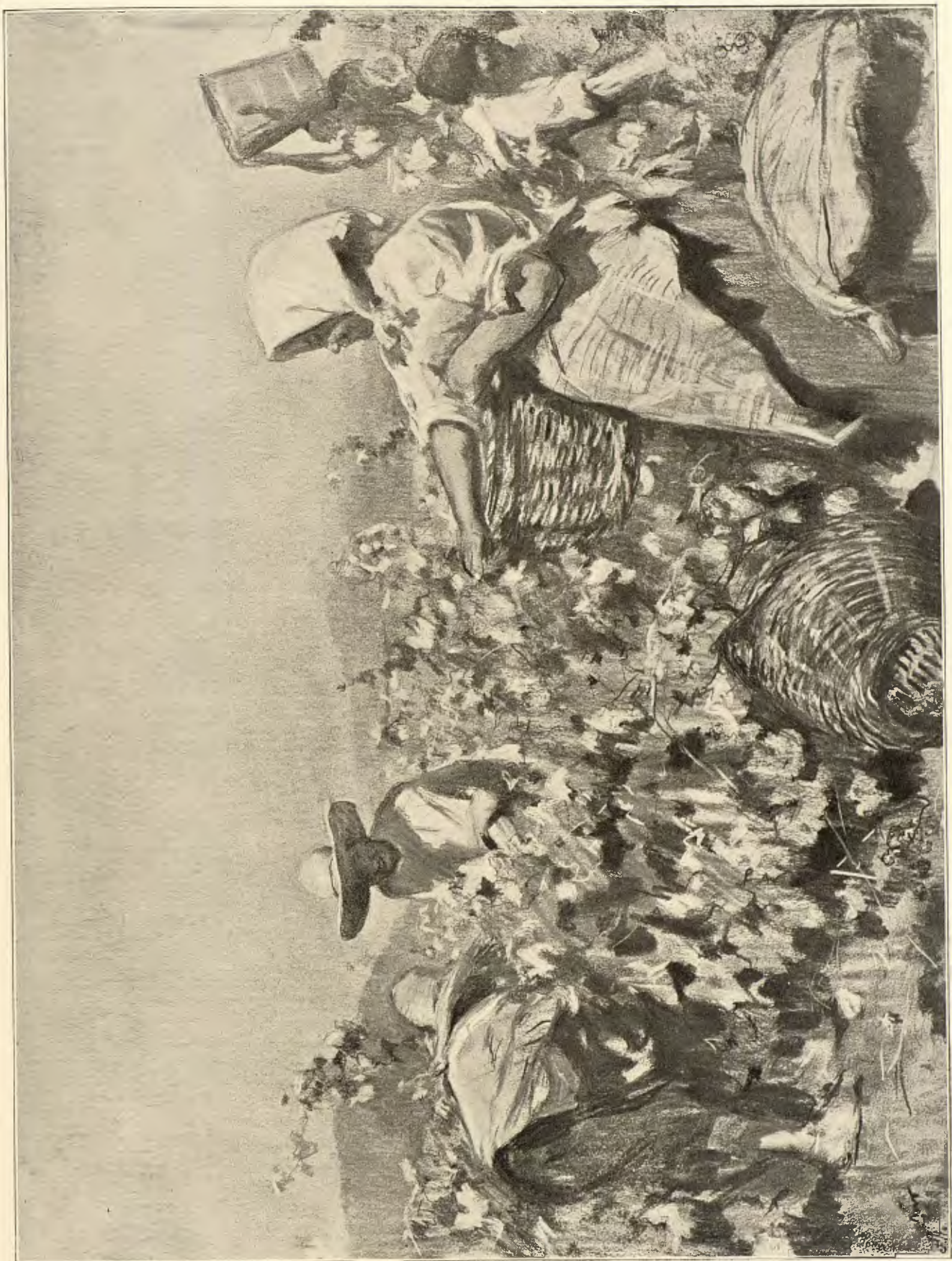
1. MIR. — VENDIMIA