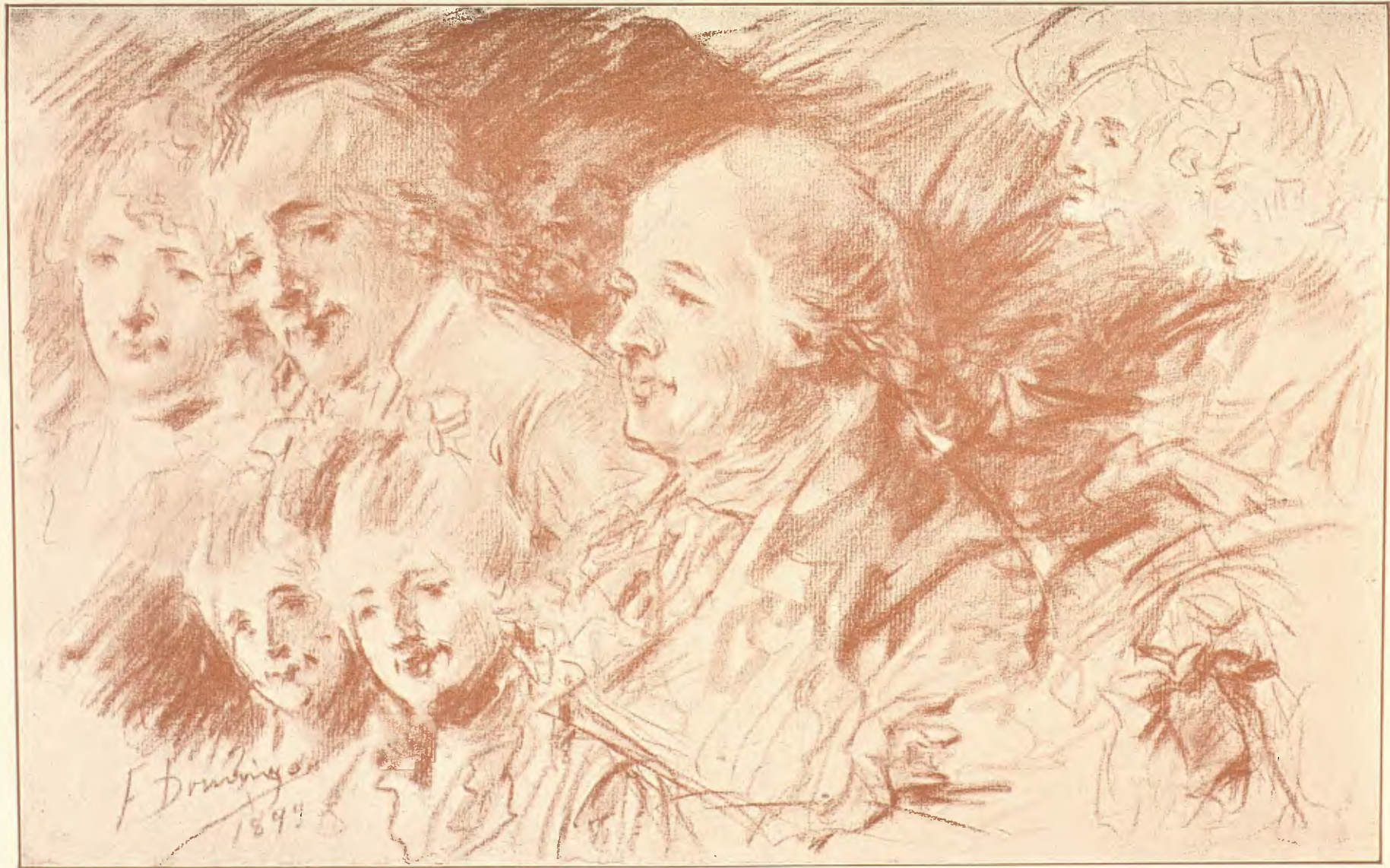
F. DOMINGO.—TIPOS DEL TIEMPO DE GOYA