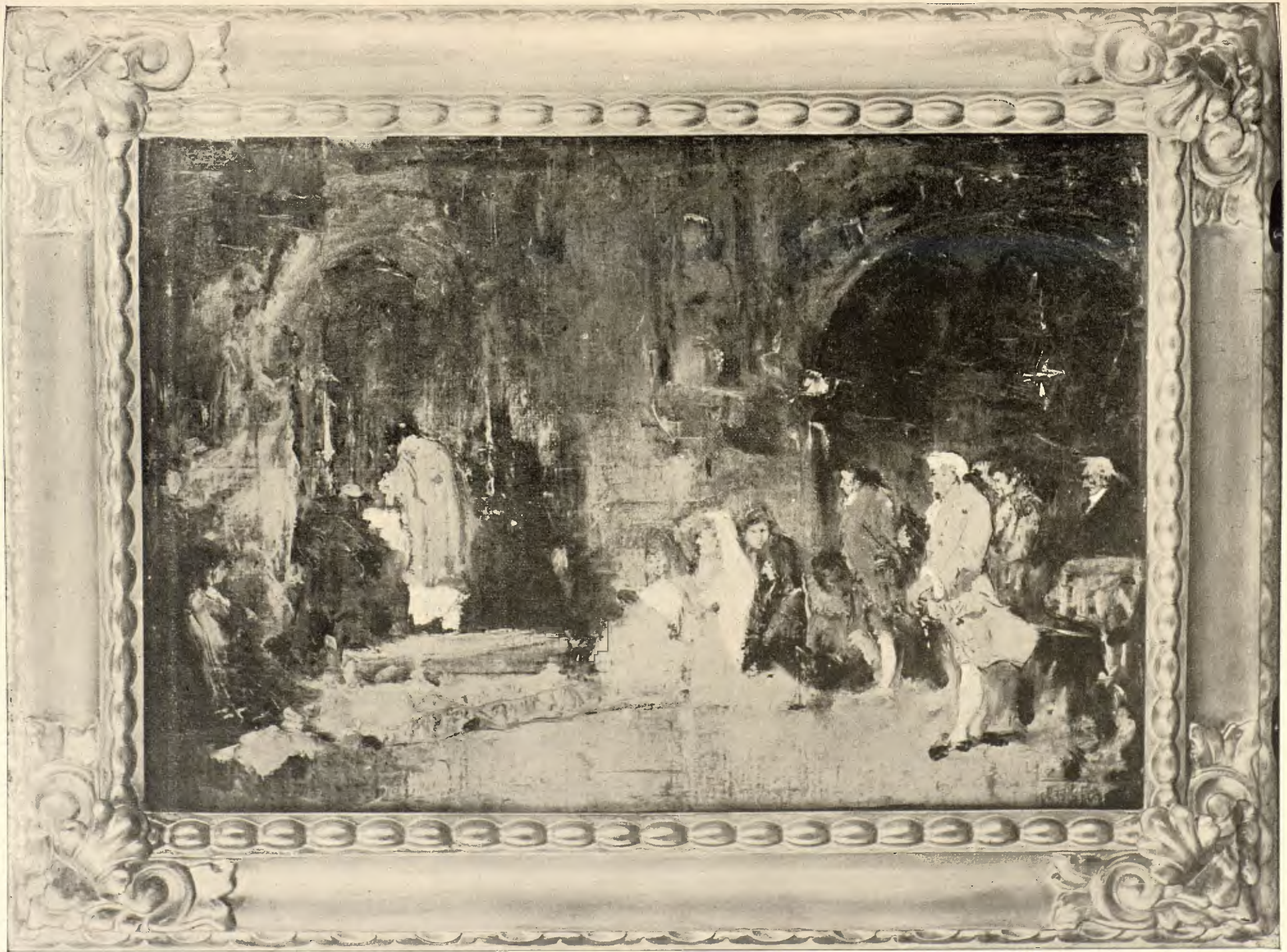
LA MISA EN LA CRIPTA