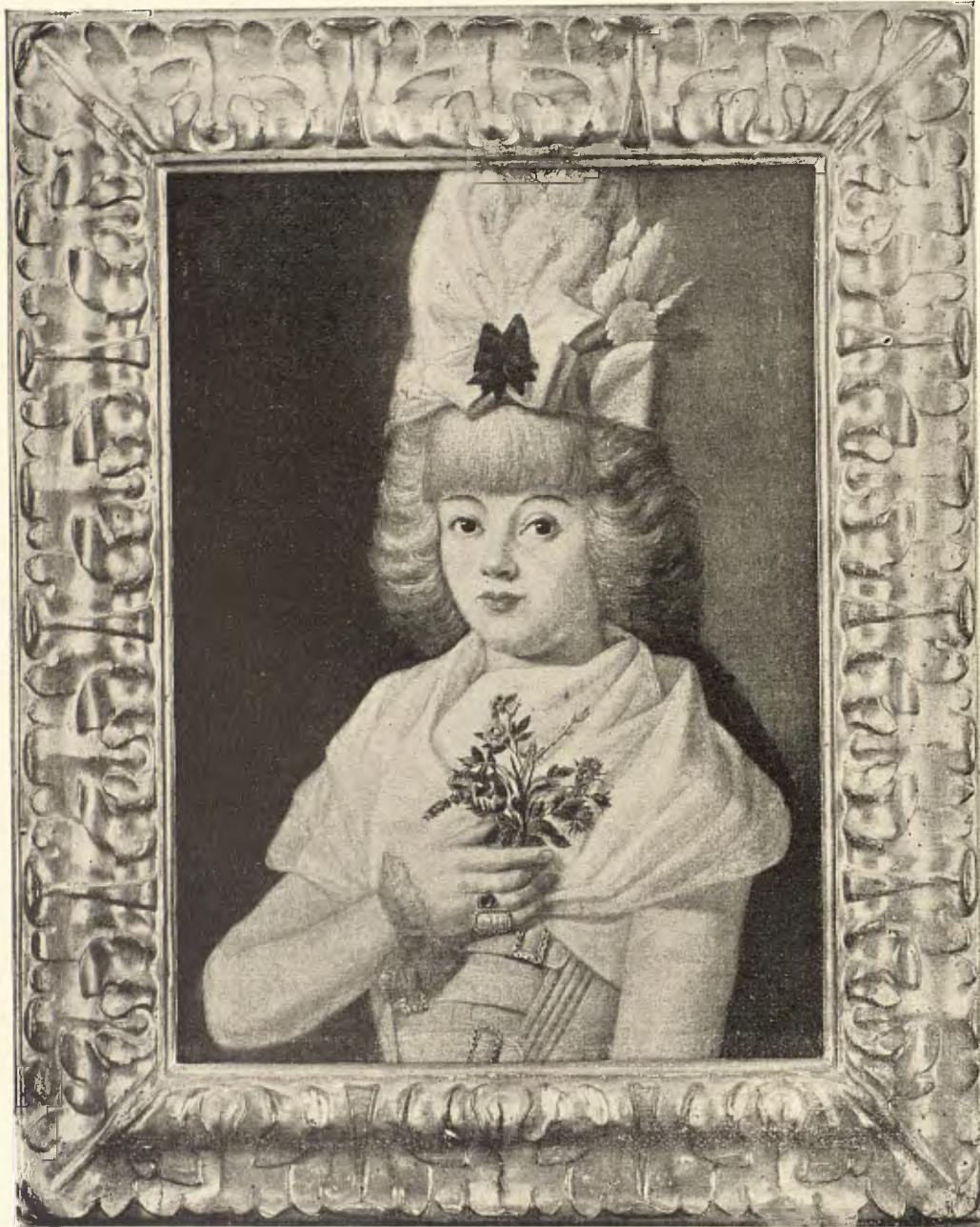
RETRATO DE UNA PETIMETRA

¡Escenas alucinantes, visiones apocalípticas, kaleidoscopo de visionario, que Goya supo traducir con extraordinaria intensidad, mezclando á la interpretación algo de este espíritu de lo sobrenatural horrible, que acaso constituye lo más profundo y original del genio del gran artista!