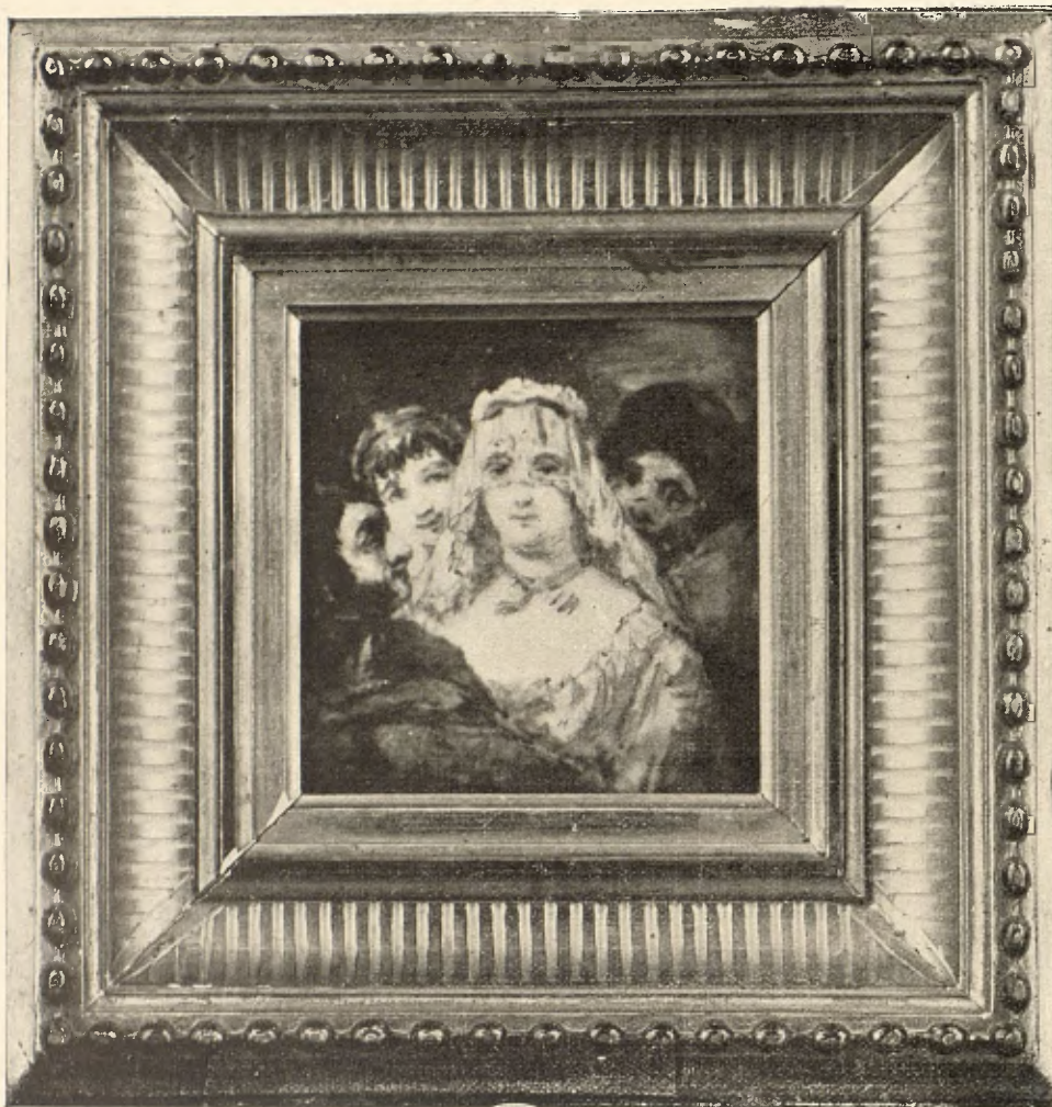
LA MAJA GALANTEADA. (Pintura sobre marfil)

objeto de divertimento popular se ve en el primer término; más lejos la casa de un pueblecillo asentado sobre una roca y, en lontananza, azuladas montañas.»