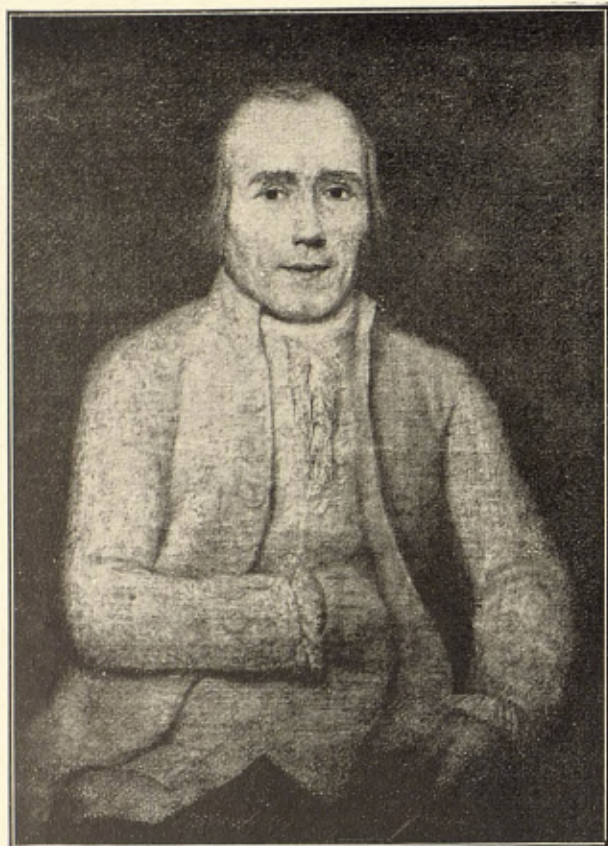
UN CABALLERO CATALÁN

de las procesiones, de las romerías de los autos de fe, de las corridas de toros, de las meriendas en el río, de los juegos de los muchachos en la pradera, de los corros de majas y chisperos, de busconas y petimetres.