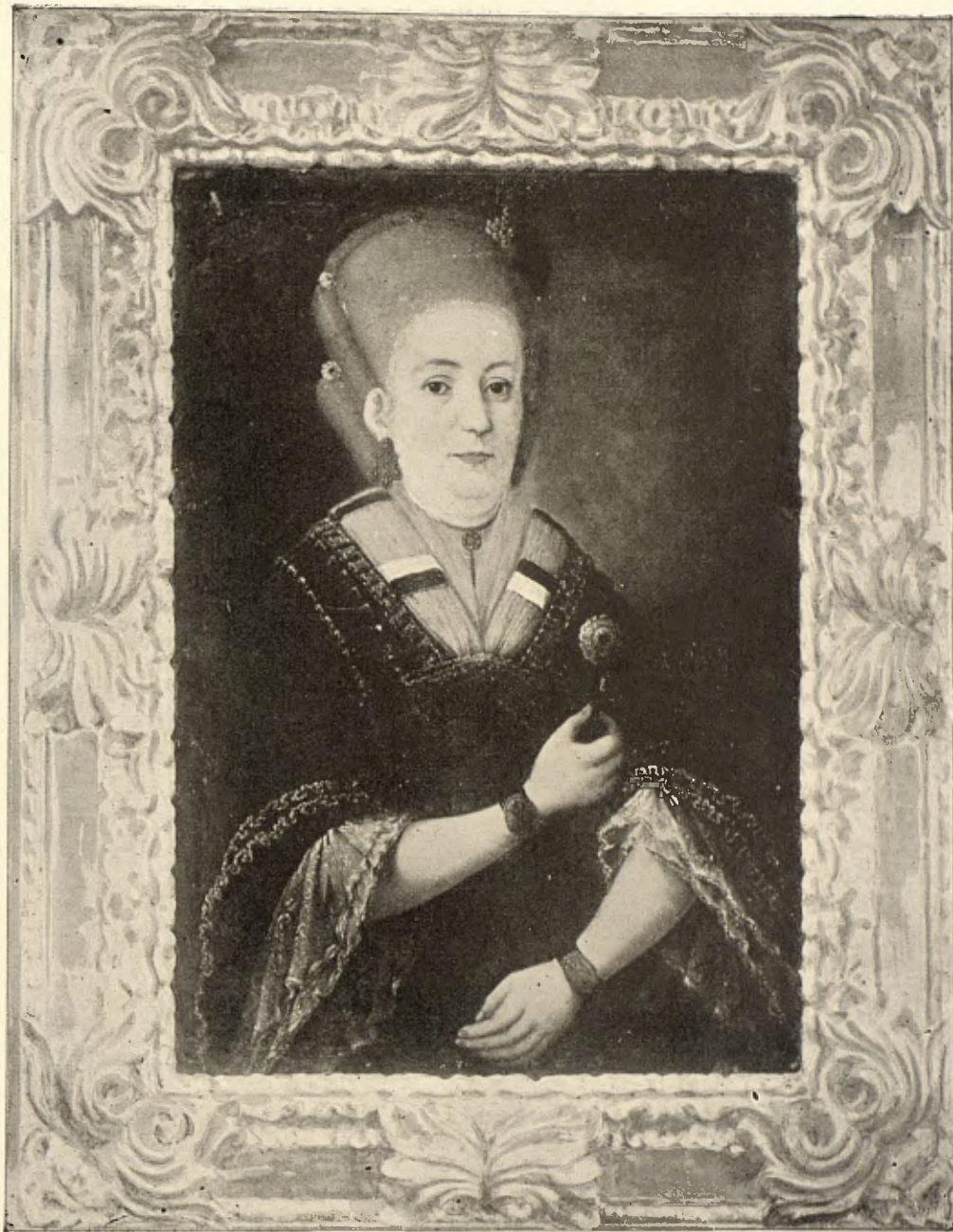
LA SEÑORA DE DEOCAMPO

Durante un buen rato no se oyó en el aposento más que el susurro de los rezos que entre-dientes murmurábamos los visitantes. Luego, D. Francisco, por cuyas mejillas resbalaban lentamente las lágrimas, se acercó al difunto y puso un piadoso ósculo en su frente amarillenta. Y tras él desfilaron todos rindiendo el postrero homenaje al gran poeta; y era de ver como aquellos hombres de pelo en pecho «capaces de echar con un suspiro una casa al suelo» y aquellas mozas bravías hincaban las dos rodillas en tierra y besaban llorando las manos yertas del que fuera Don Ramón de la Cruz. Y cuando nos fuimos,