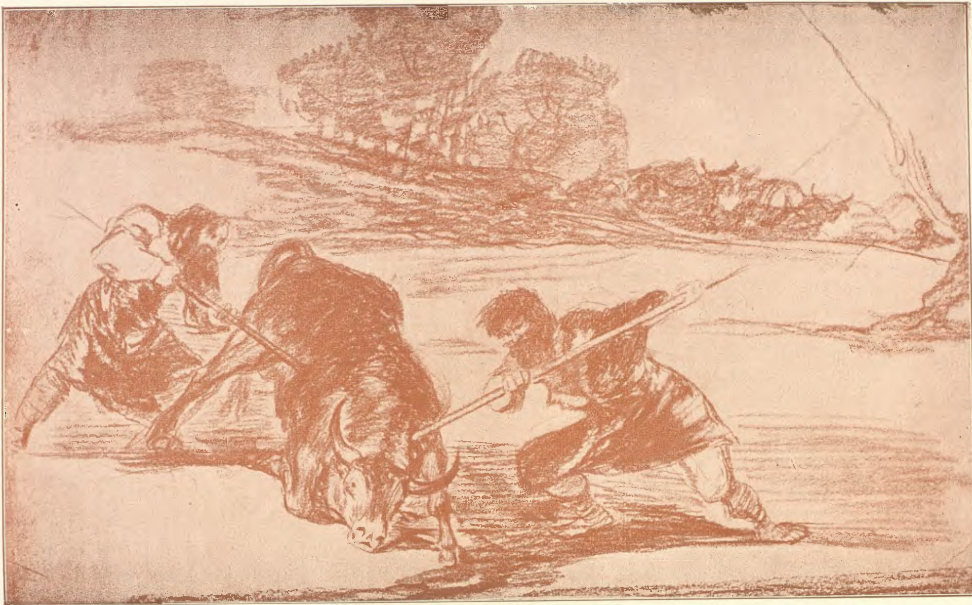
CAZANDO UNA RES.— DIBUJO Á LA SANGUINE