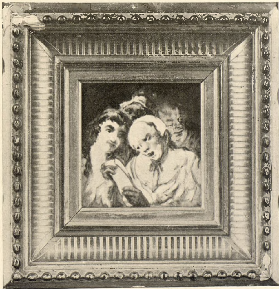
LA LECTURA DE LA CARTA. (Pintura sobre marfil)