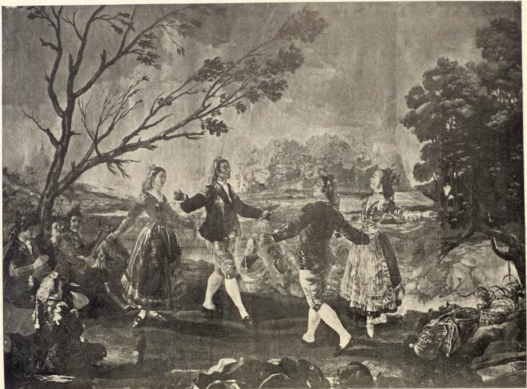
EL BAILE DE SAN ANTONIO DE LA FLORIDA — (Tercio)