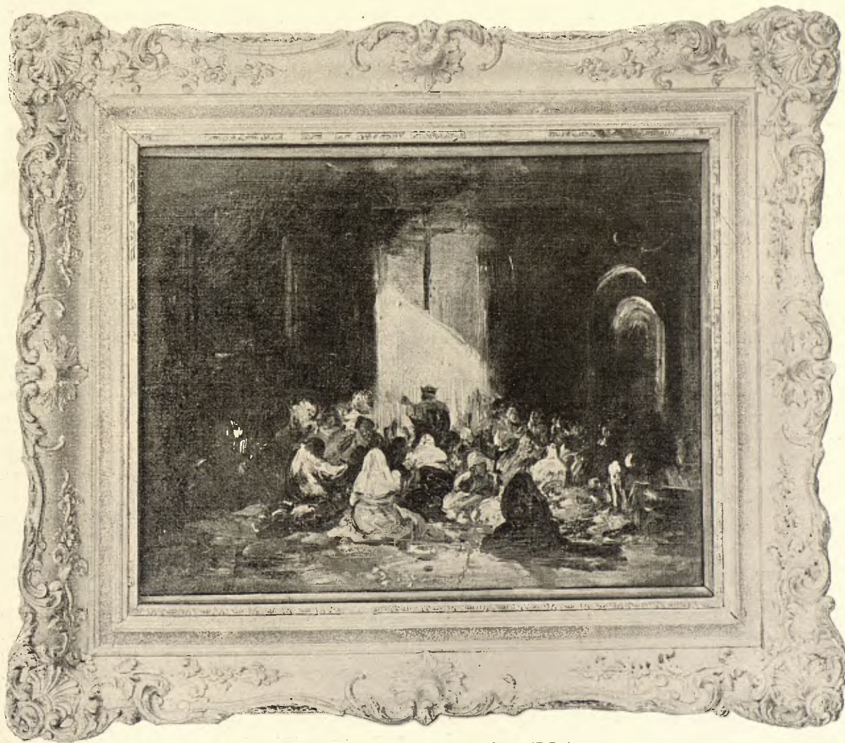
INTERIOR DE UNA CAPILLA

De un cuadro del mismo asunto, que el conde de La Viñaza cataloga con el número CXXIII, dice en su obra dedicada á Goya el expresado autor: « La Cucaña . Este