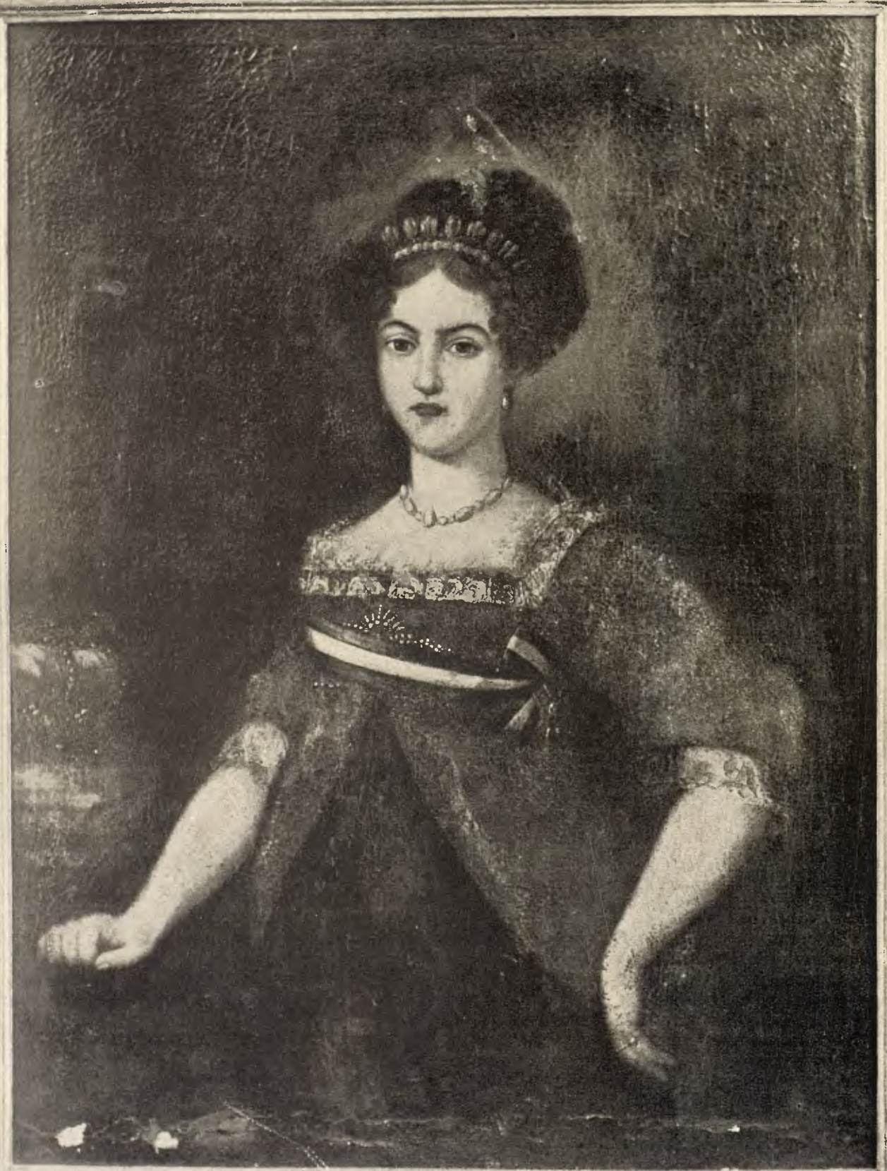
LA REINA D. a MARIA ISABEL, DE PORTUGAL