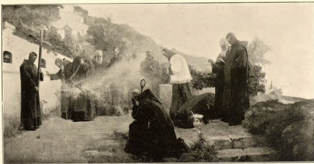
T. MUÑOZ LUCENA.— PLEGARIA EN LAS ERMITAS DE CÓRDOBA