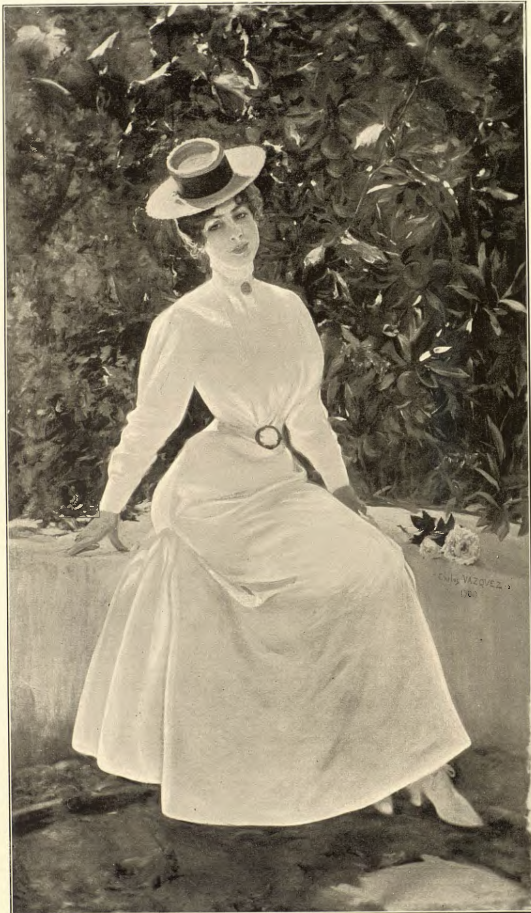
CARLOS VÁZQUEZ.—RETRATO DE MME. P. RIBERA