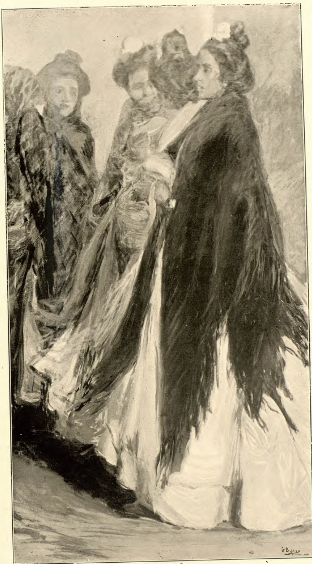
GONZALO BILBAO.—CIGARRERAS (ESTUDIO)