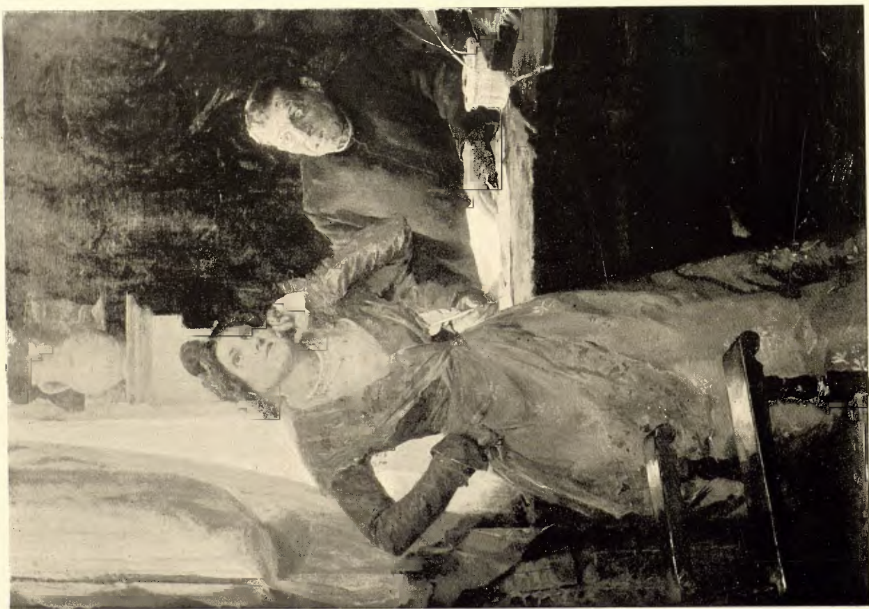
J. GARNELO.—¡Dios mío, cuántas cosas le diría si supiera escribir!