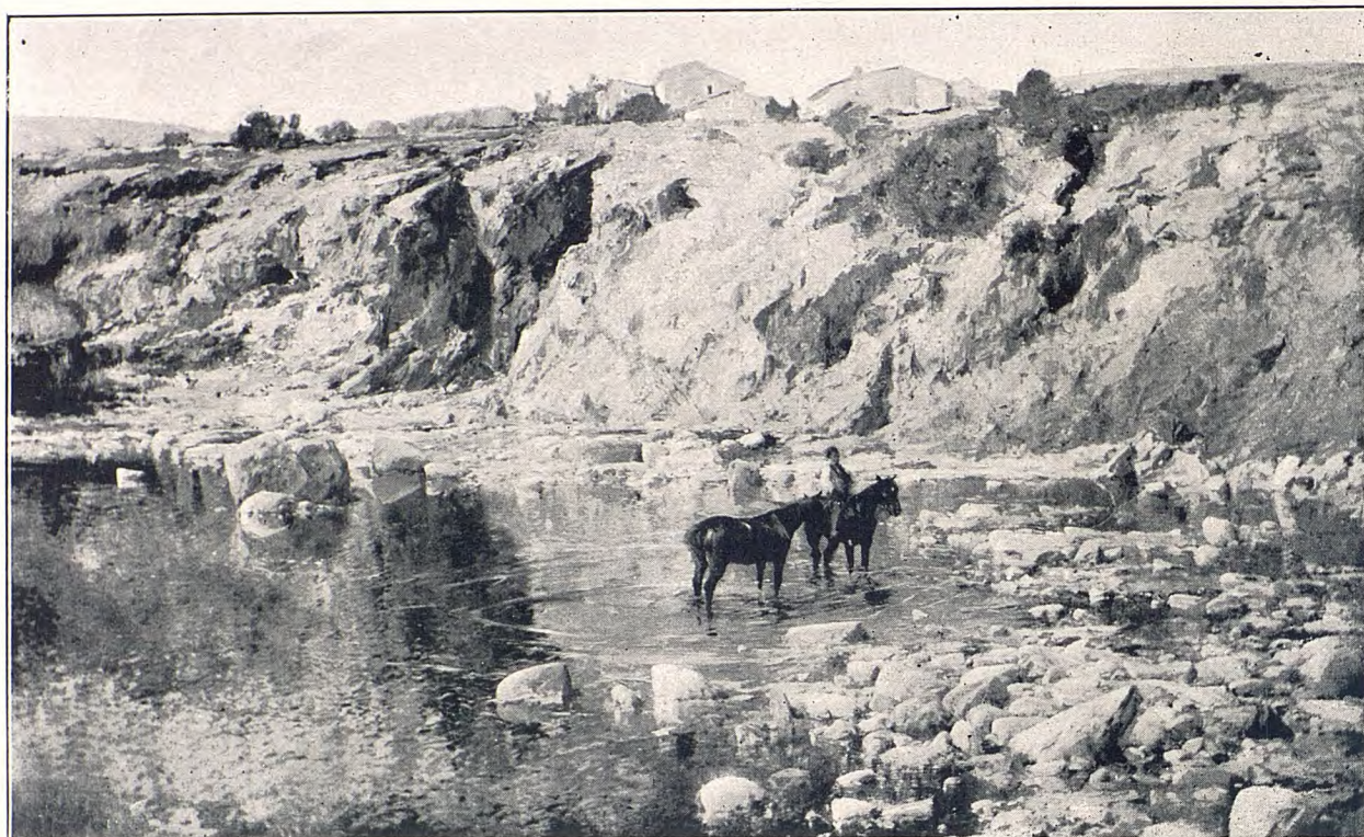
E. MEIFREN ROIG.—LA BARRACA DE LA VIRGEN