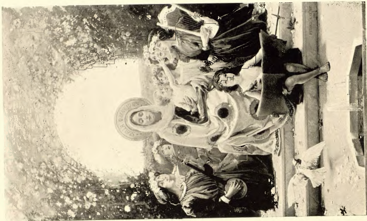
P. SAENZ.—STELLA MATUTINA