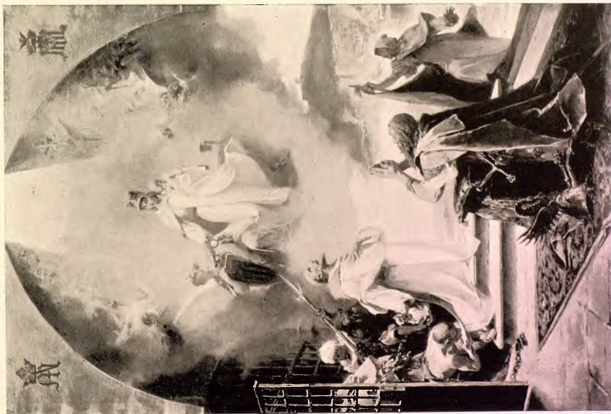
A. FERRANT. — APARICIÓN DE LA VIRGEN DE LAS MERCEDES