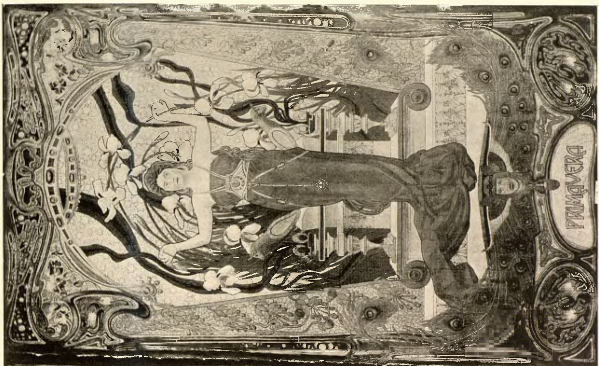
P. GUILLÉN. — AMOR Y PRIMAVERA. (PANNEAU DECORATIVO)