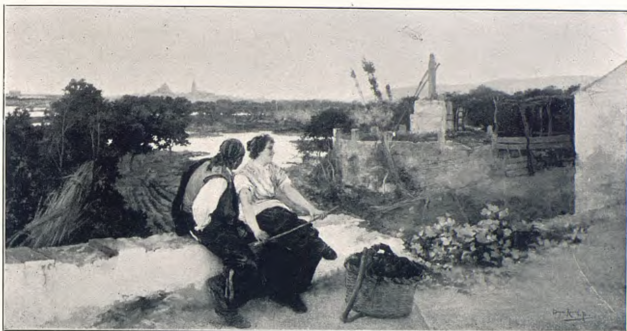
E. ROMERO DE TORRES.—ALREDEDORES DE CÓRDOBA