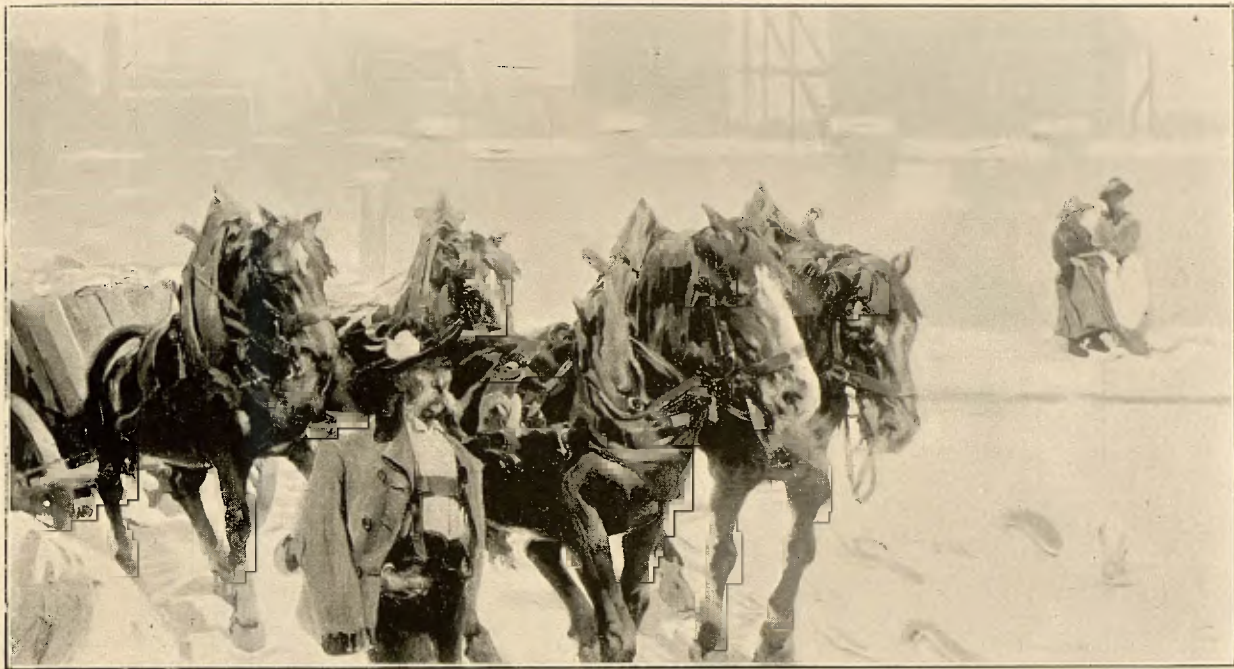
E. MARTÍNEZ RUIZ.—EL INVIERNO EN MUNICH