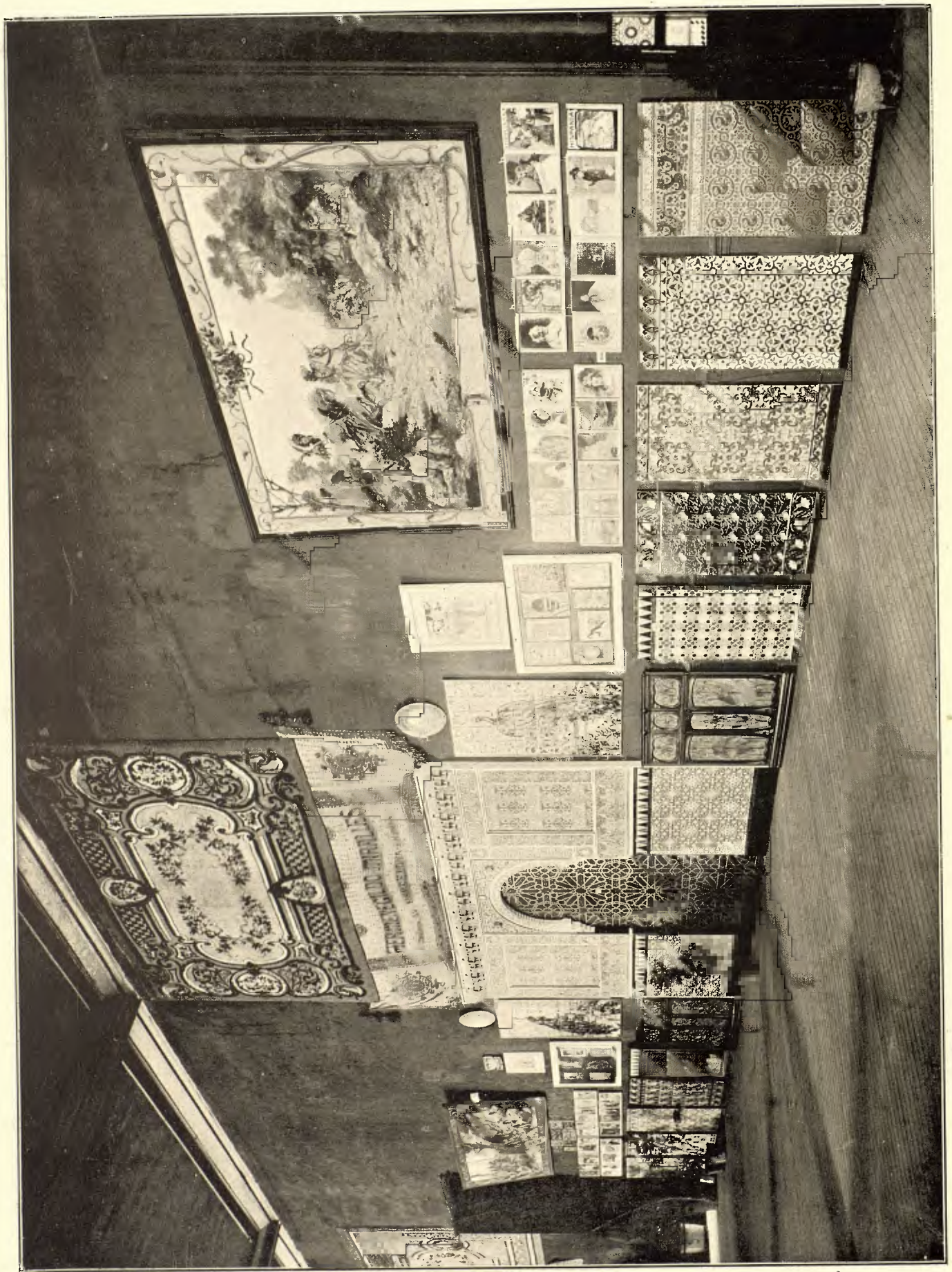
INSTALACIÓN DE AZULEJOS CARTÓN PIEDRA Y MOTIVOS DECORATIVOS DE LA CASA HERMENEGILDO MIRALLES, DE BARCELONA