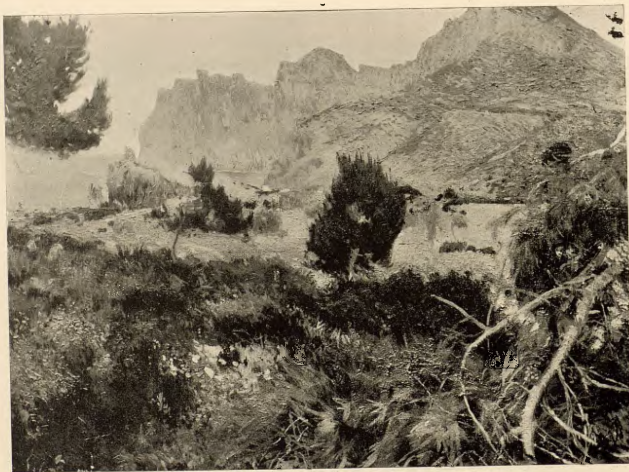
JOAQUÍN MIR.—MONTAÑAS ROJAS