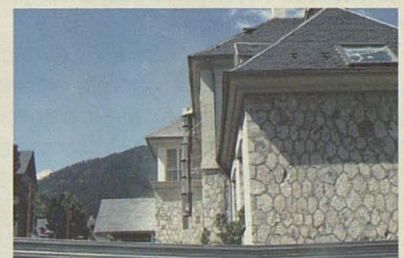
Vista exterior dera Residència Sant Antoni.