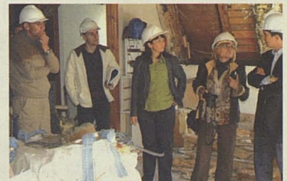
Era vicesindica Costa visite es òbres de remodelacion dera residència.

Después de la reforma del sistema de calefacción, la residencia geriátrica Sant Antoni de Vielha se encuentra ahora en plena remodelación integral del viejo edificio. Las obras, que durarán un año, suponen una inversión de 1,6 millones de euros. La actuación del departamento de Sanidad y Servicios Sociales contempla la creación de 14 habitaciones, que se podrán convertir en 16, cada una con un baño adaptado, y 10 más para la planta sociosanitaria. También se habilitarán espacios comunes y un auditorio y se homologará la altura de cada planta a la normativa vigente. El centro reformado ofrecerá un programa (Programa Respir) de apoyo a las familias que prestará servicio de estancia temporal en régimen sociosanitario.