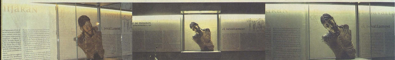
Eth nau expositor qu'acuelh ath Crist de Mijaran.