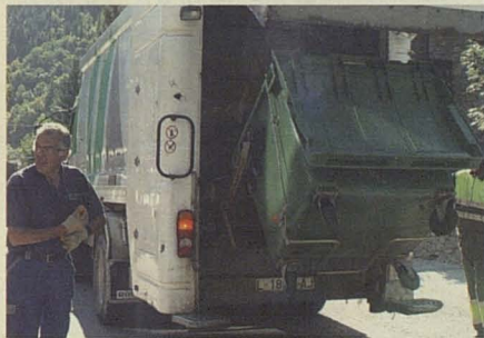
Camion deth servici de lordères.

En aguesti tempsi d'incertesa, eth torisme aranés, que depen sustot dera nhèu, a de besonh d'un nau reviscolament per miei dera melhora des infraestructures, d'ua clara politica autonoma entàs estacions d'esquí e d'un plan estructurat que definisque eth nòste producte e eth camin a seguir entà crear destinacion, entà plaçar Aran en món, entre d'autes accions. Entad açò, mos cau era concertacion de diuèrsi actors tant publics coma privadi