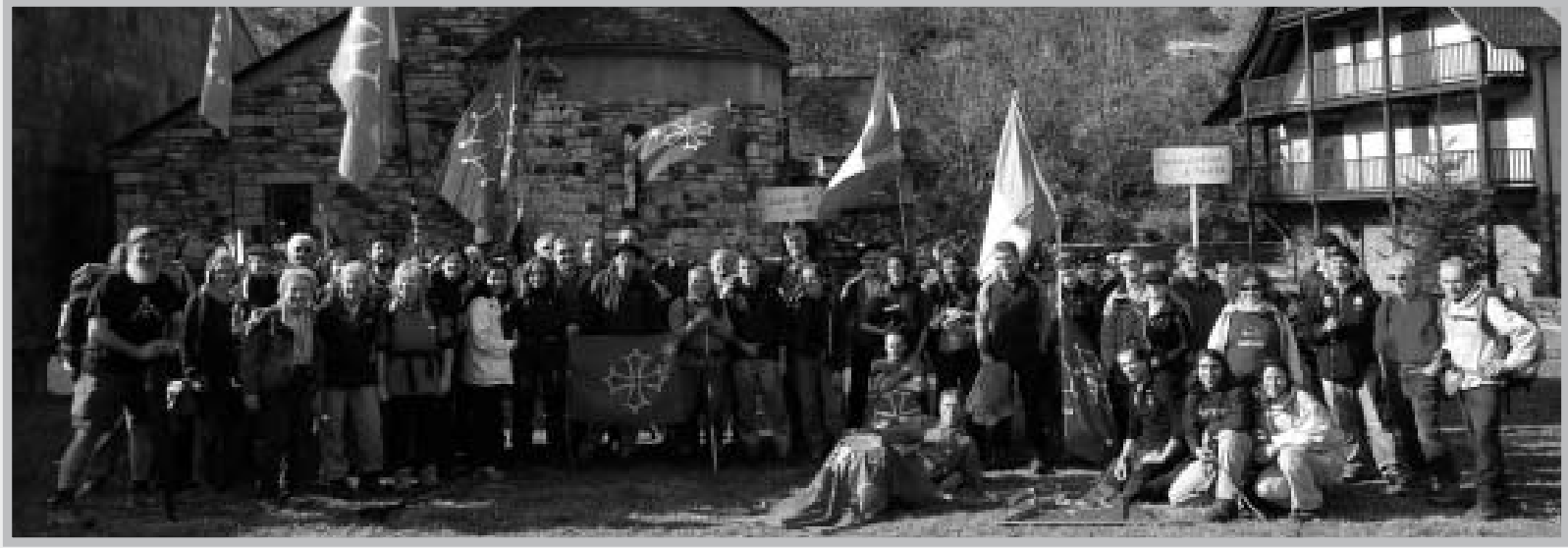
Foto de familia de los participantes en la última etapa de la marcha ‘Occitània a pè’.

CUATRO PATINADORES DEL CEGVA, SELECCIONADOS PARA EL EQUIPO INFANTIL