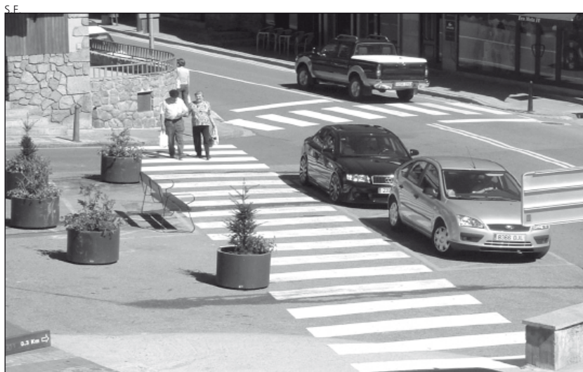
La ordenanza regulará el tránsito por vía pública en Vielha.

La regulación de esta ordenanza irá a cargo de los Agentes Municipales y de los Mossos d'Esquadra.