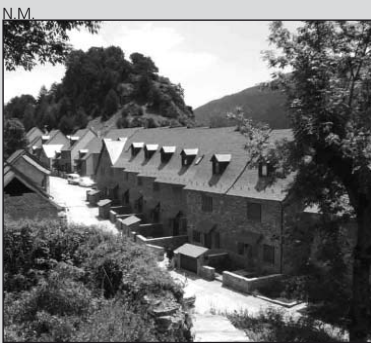
Vista de Vilamós.