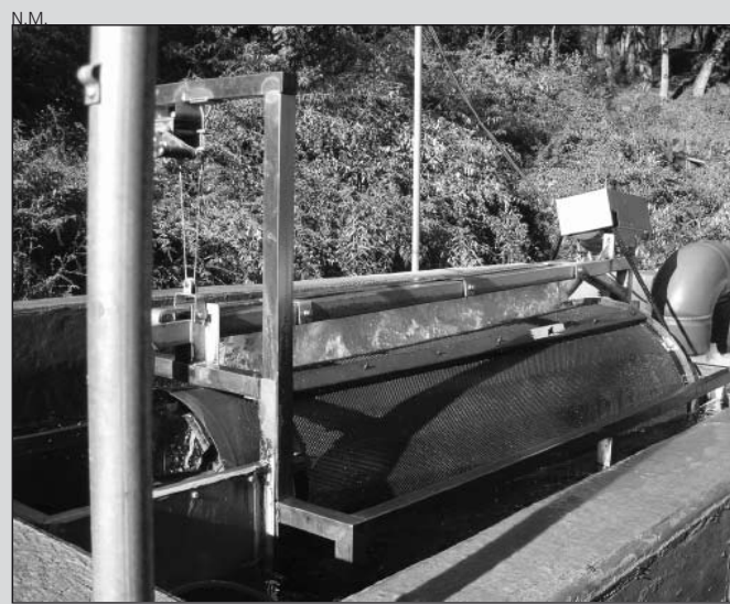
El nuevo filtro ya está en funcionamiento.