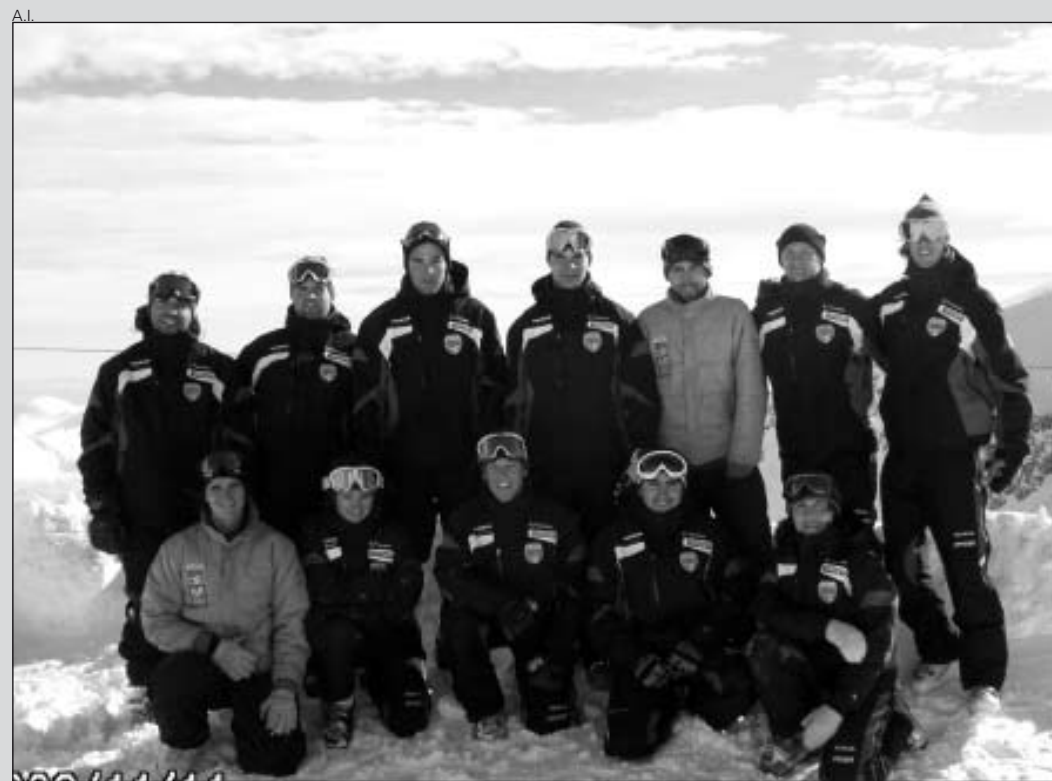
Foto de familia de los entrenadores en Saas Fee. A la izquierda, los entrenos.

El objetivo principal de esta concentración de pretempo-