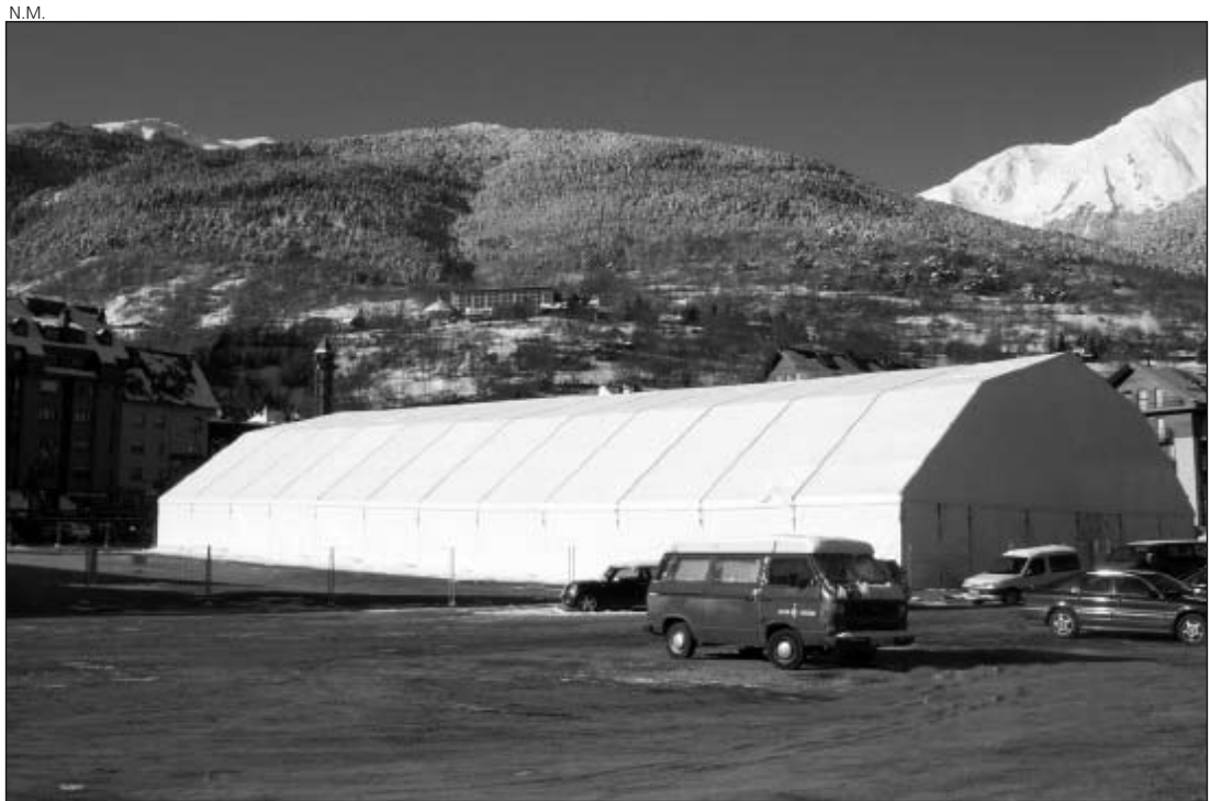
Una de las carpas que acogerán el certamen de ocio, turismo y moda de Vielha.