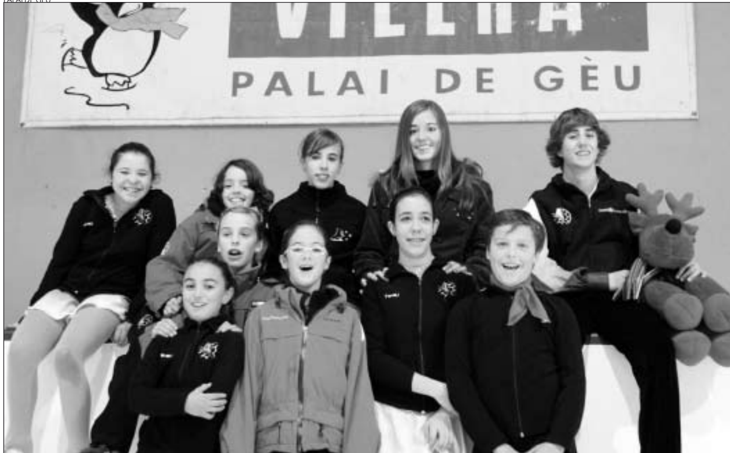
Los jóvenes patinadores araneses participaron en la Copa CEGVA celebrada en el Palai de Gèu de Vielha.