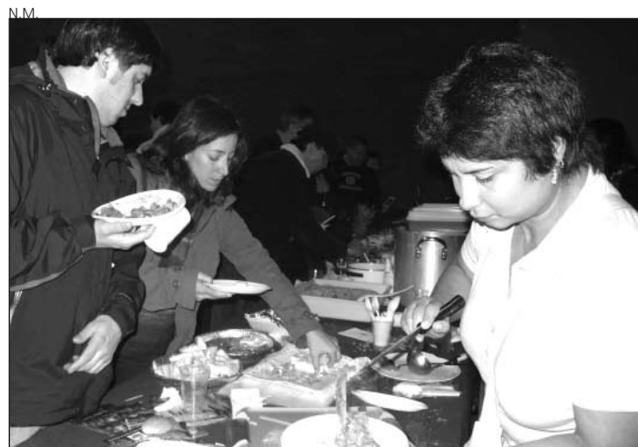
Por la noche hubo degustación gastronómica.