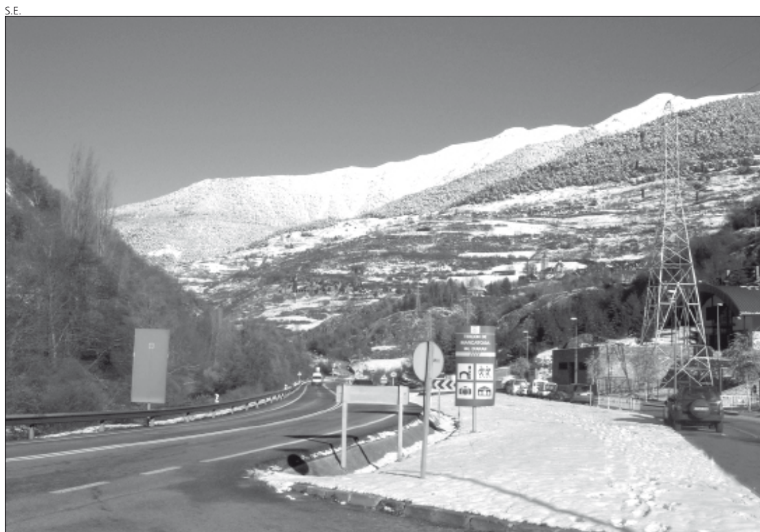
Aubèrt y Pont d'Arròs contarán con nuevas depuradoras en el año 2009.

Por su parte, Rella considera que es primordial retomar este proyecto ya que supone un importante paso en la dinamización del sector cultural y turístico del Terçon de Marcatosa, y, sobre todo, para potenciar los pueblos de Vilac, Mont e Montcorbau.