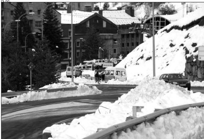
La nieve es fija este año en el paisaje aranés.