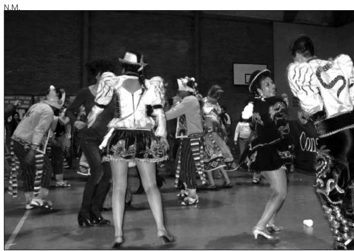
No faltaron los bailes y danzas tradicionales.

La III Jornada Intercultural de Aran tuvo lugar, un año más, con la participación de países de todo el mundo que se unieron en una fiesta en la que se dieron a conocer las diferentes culturas que conviven actualmente en la Val d'Aran.