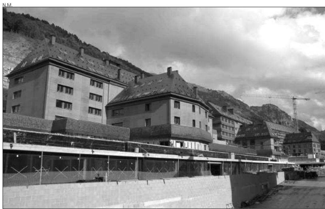
La constructora ha paralizado la tercera fase de la urbanización Val de Ruda.

El presupuesto inicial del aparcamiento ascendía a 2,5