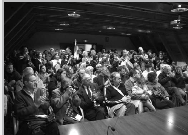
Los participantes en la marcha reclaman que el occitano sea declarado patrimonio de la humanidad.