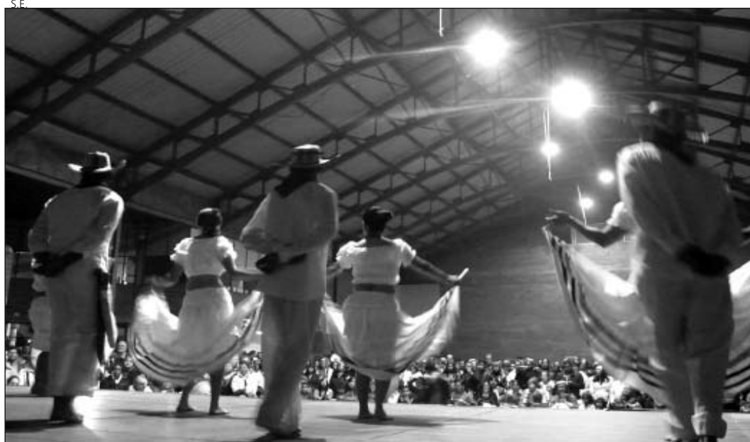
Países de todo el mundo mostraron sus culturas sobre el escenario.