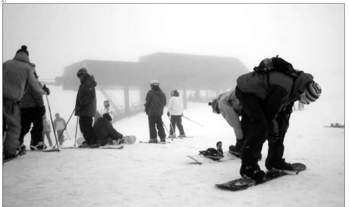
A pesar de que las condiciones no eran las mejores, más de 3.000 personas inauguraron la temporada.

HACÍA 44 AÑOS QUE NO SE DABAN ESTAS CONDICIONES DE NIEVE EN ARAN