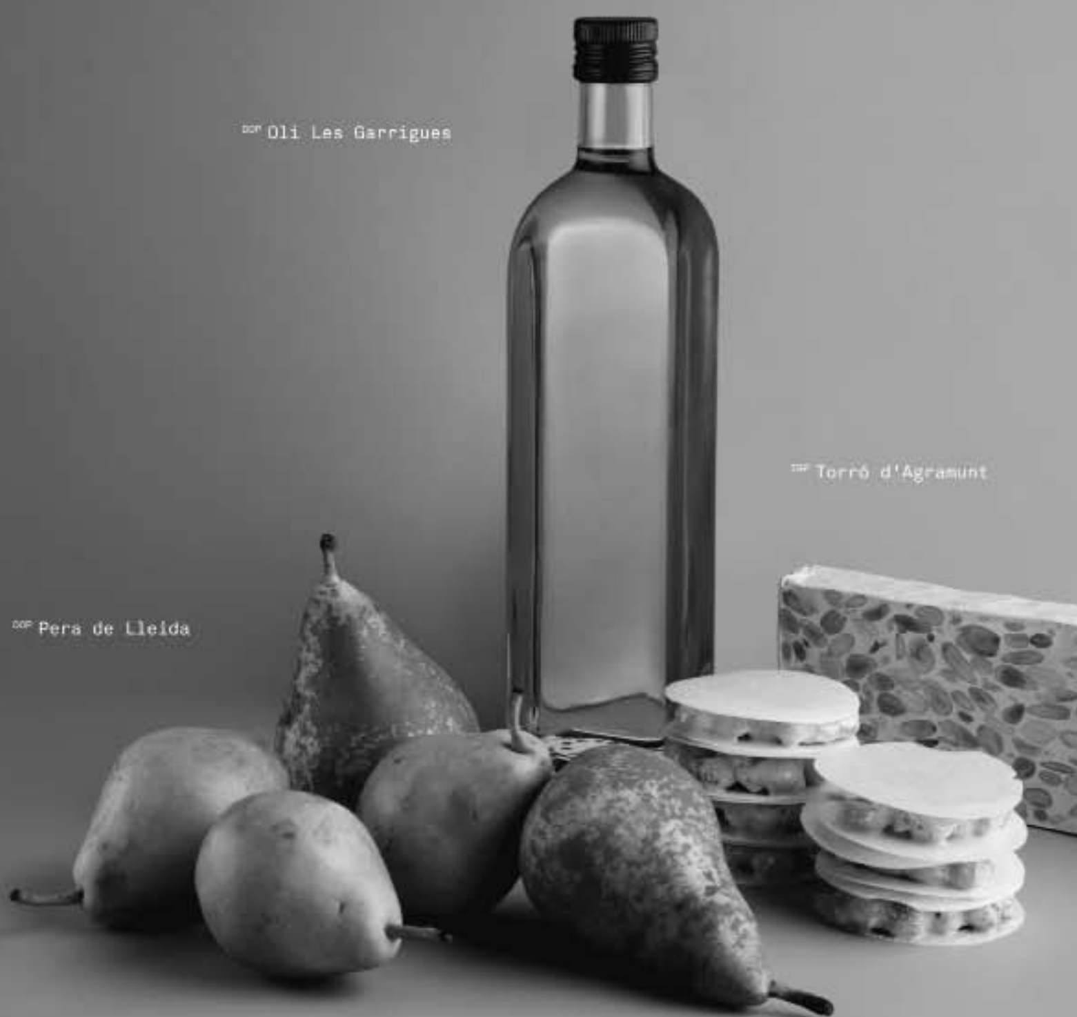
DOP Oli Les Garrigues