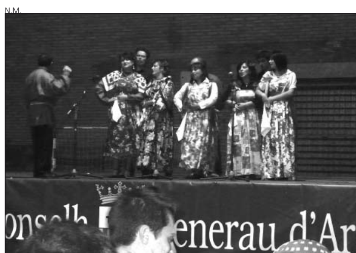
Una gran fiesta puso el punto final a la jornada.