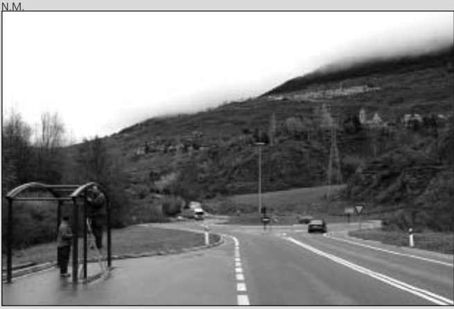
Dos nuevas paradas en la N-230.