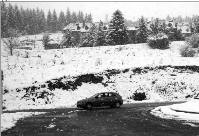
Las precipitaciones han sido habituales este mes.