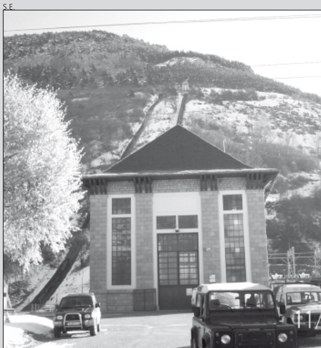
El sector eléctrico, a debate.