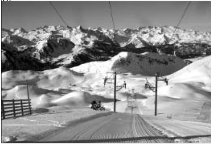
Baqueira ofrece unas condiciones idóneas.