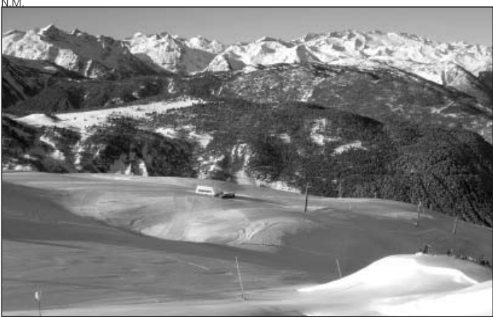
Las continuas nevadas han dejado un paisaje único.