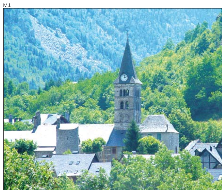
Arties prepara las fiesta del 'Taro'.