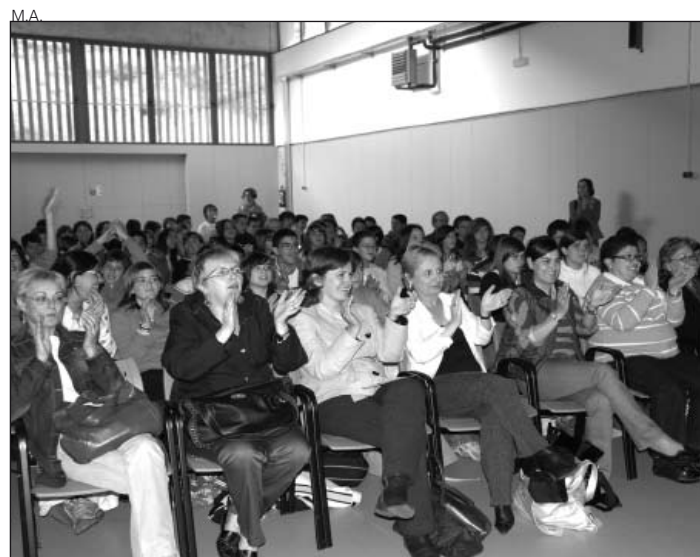
El público, entusiasmado con el CEIP Garona.