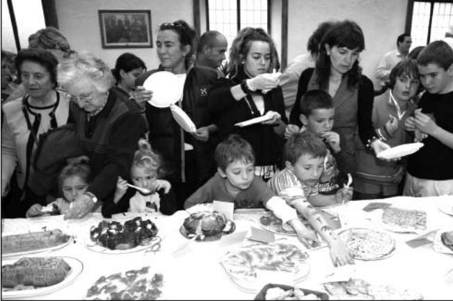
Se degustaron los postres el día de sant Pònc.