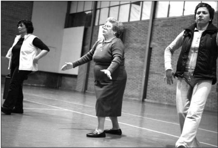
Hubo clases deportivas, como esta de taichi.

NUMEROSAS ACTIVIDADES ENTRE EL 26 Y EL 31 DE MAYO EN VIELHA