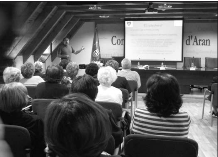
Las charlas versaron sobre diferentes temas.