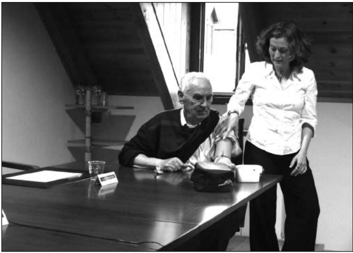
Durante la semana, hubo tomas de tensión arterial.