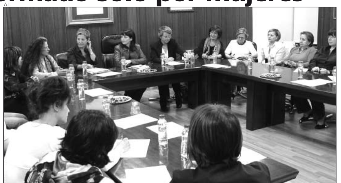
A la cita con Selva acudieron un buen número de mujeres aranesas.

El encuentro, asimismo, sirvió para presentar en sociedad el Servicio de Información y Atención a la Mujer (SIAH), pese a llevar casi un año en funcionamiento. Esta oficina,