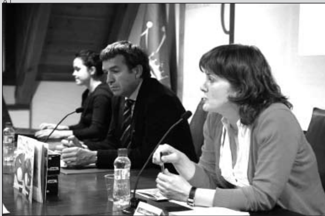
Presentación de la nueva revista infantil.