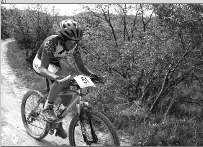
Un corredor aranes, en plena carrera.