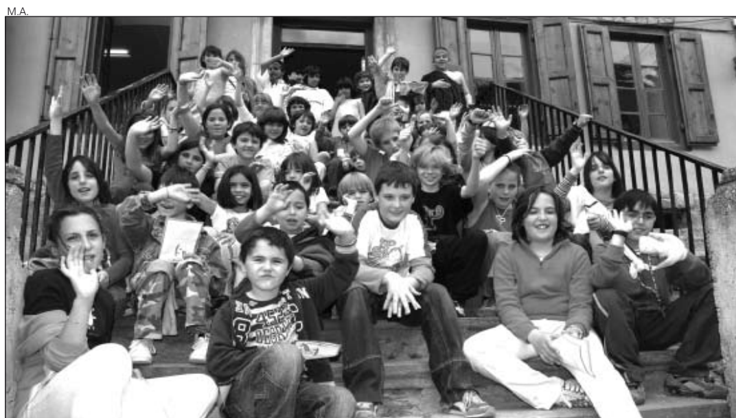
El grupo de teatro de Aubert actuó en su mismo centro.