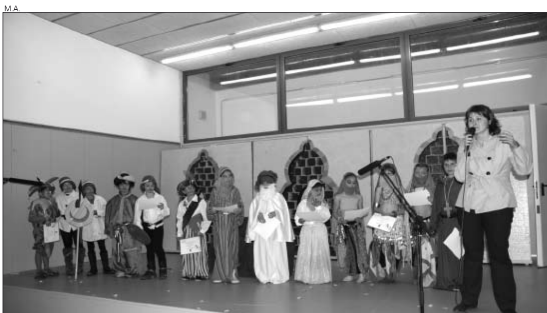
Los alumnos del CEIP Garona mostraron su representación en Les.

PRIMERA EDICIÓN DEL FESTIVAL DE TEATRO EN LA ESCUELA