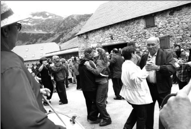
Baile para celebrar santa Quiteria.