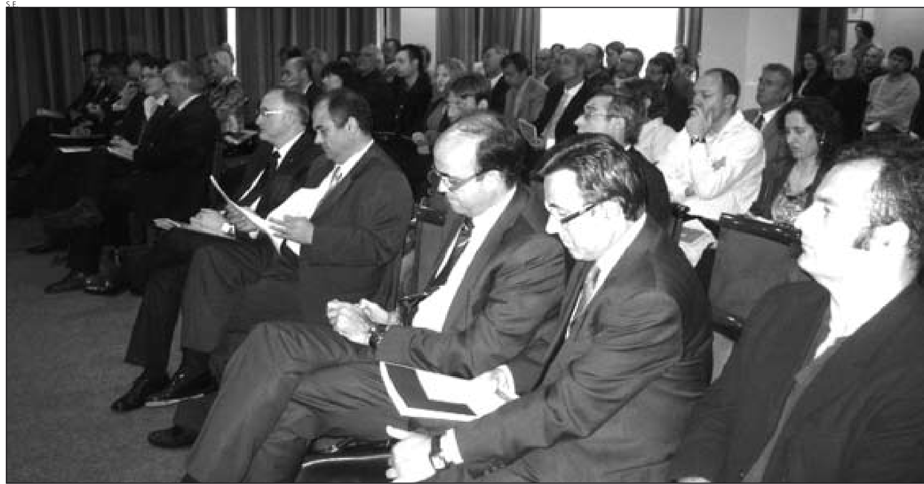
El número de inscritos llegó a las 150 asistentes entre técnicos, empresarios y personas vinculadas al mundo del turismo.

Un total de 150 inscritos entre empresarios, técnicos y profesionales del sector, garantizaron el interés de esta jornada enfocada a la innovación en el sector turístico catalán que tuvo lugar en el hotel Tuca de Betrén. La inauguración estuvo conducida por el presidente del Congreso Turístico de Cataluña, Josep Martí, quien destacó la necesidad de tener en cuenta un turismo más amplio que el centrado en la estrategia de "sol y playa" y en promocionar nuevos campos como el turismo de montaña englobando sectores como el esquí, los deportes