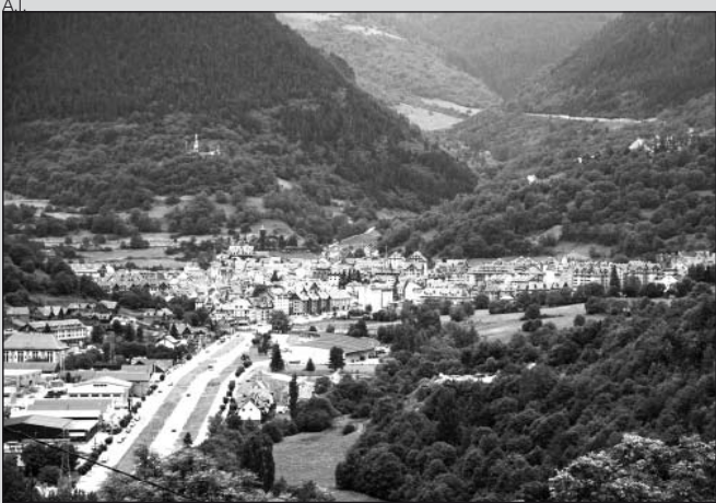
Se han modificado los límites de cotò Marco.