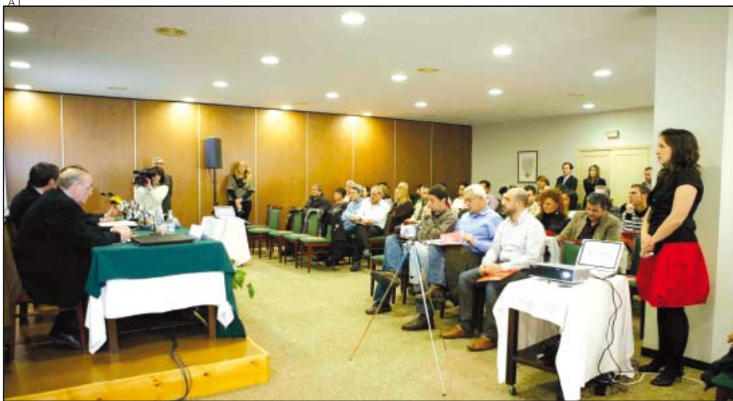
Las ayudas llegan hasta los 300 euros por empresa.

El director general de Redes e Infraestructuras de Telecomunicaciones de la Generalitat, Jo-