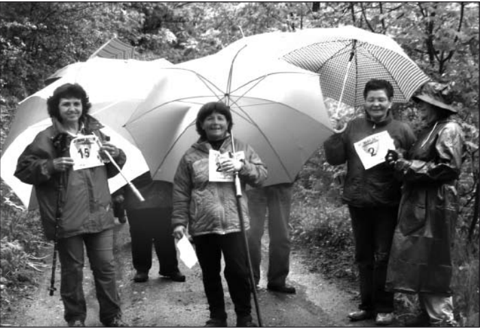
Andada para mantener el corazón sano.