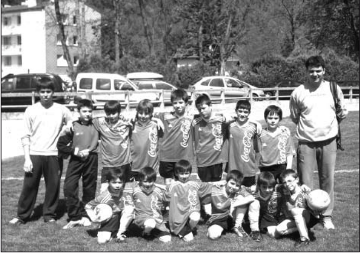
Equipo sub-11 de la Escòla de fútbol Val d'Aran.