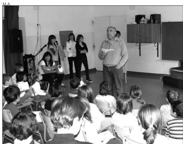
El IES Aran en Arties.