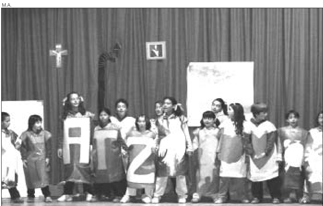
La escuela Loseron de Arties abrió el festival en Bossòst.