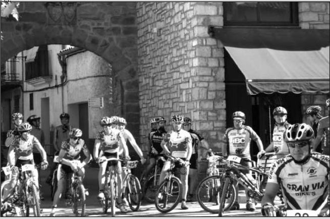
El grupo de araneses, antes de tomar la salida.