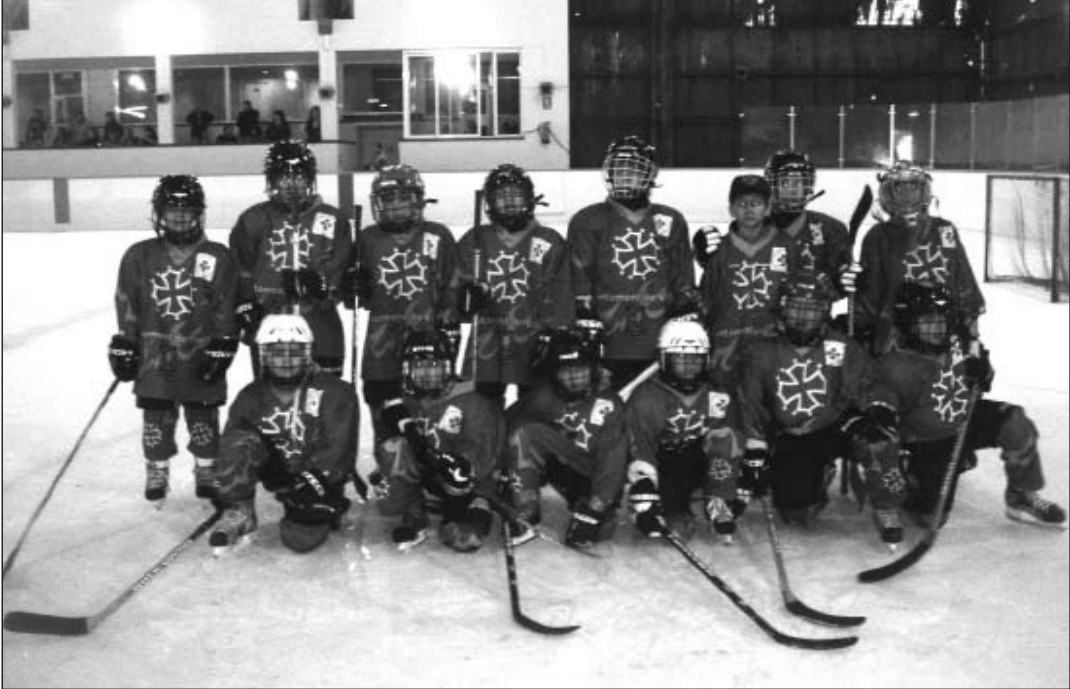
Jugadores que forman el equipo sub-11 de Hockey Geu d'Aran.