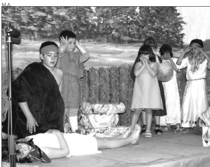
La actuación de los alumnos de Aubert.