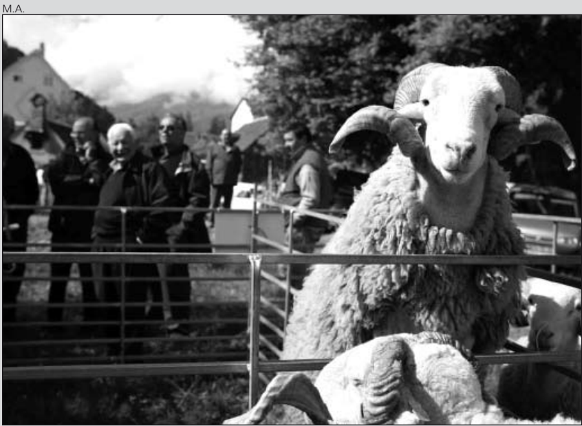
Participaron en el concurso más de cien cabezas de ganado.

Hubo tres premios especiales: mejor ejemplar de la feria, mejor ganadería y, como novedad, mejor presentación estética de los animales.