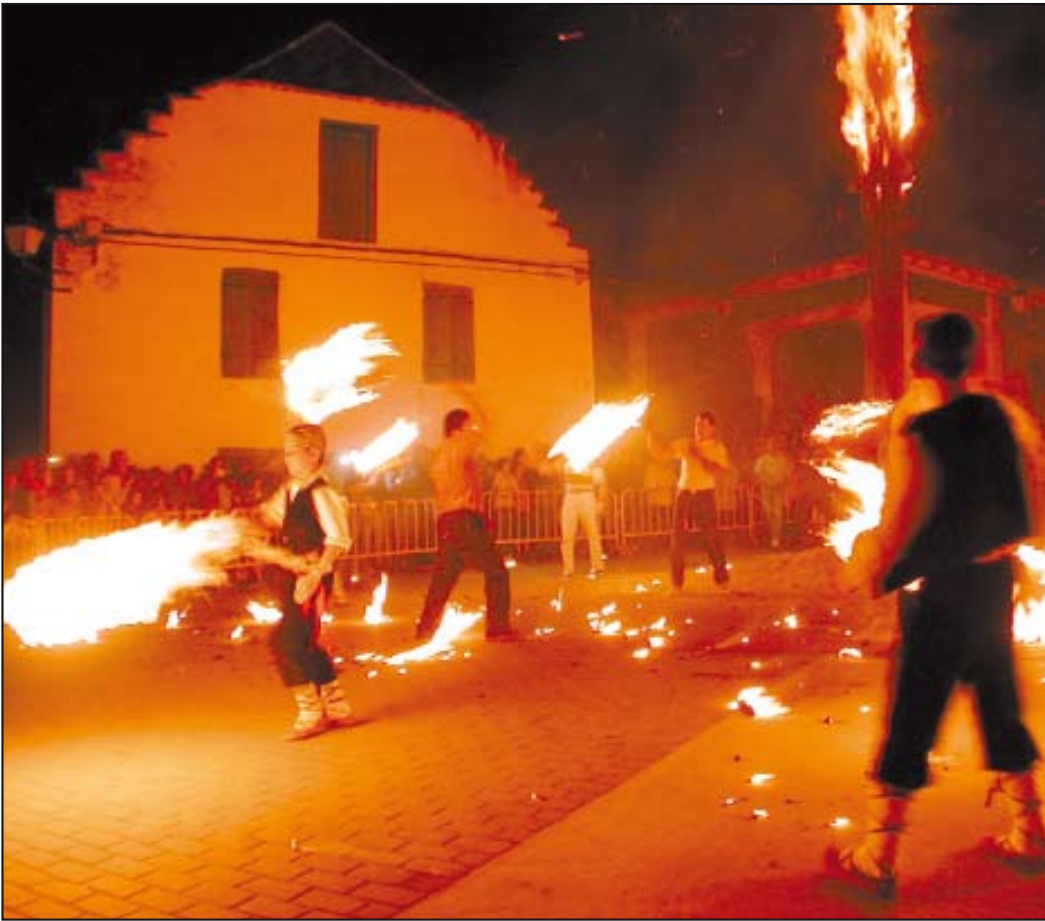
Con la quema del haro finaliza todo un ciclo festivo.