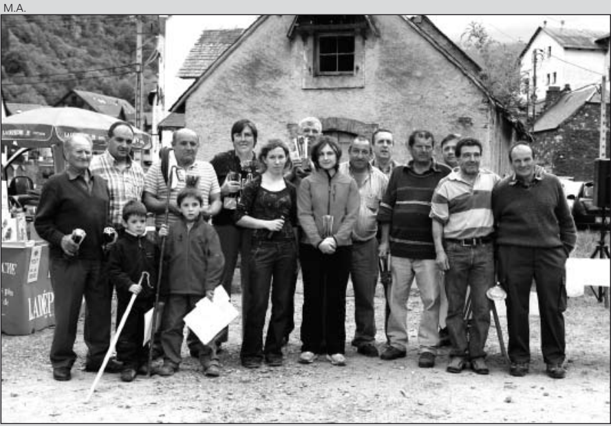
Ganadores del concurso ganadero en la feria de Les.