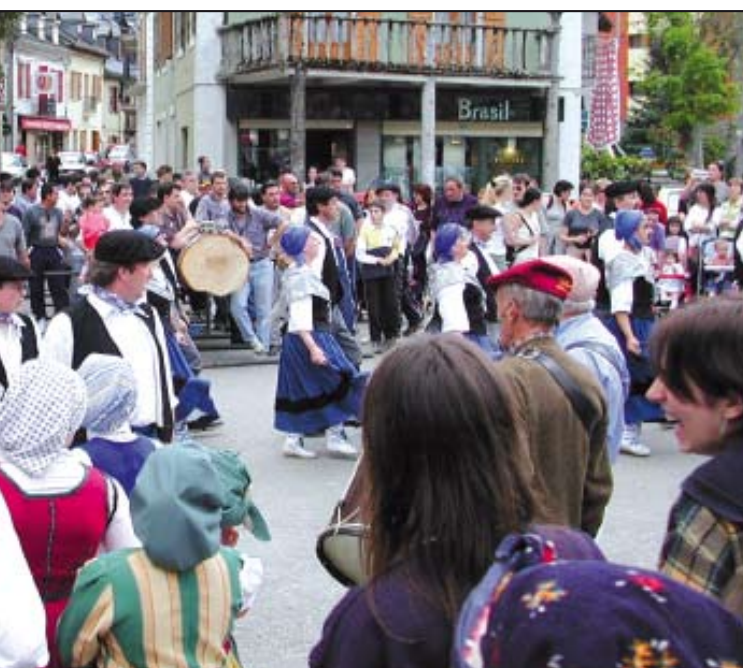
celebrar la hèsta del haro en Sant Joan.

pueblo encabezan la procesión y coronan el nuevo haro con ofrendas de flores (una corona, un ramo y una cruz) símbolos de fecundidad y fertilidad. El grupo de bailes y folclore tradicional volverán, una vez más, a ponerle un punto de gracia y