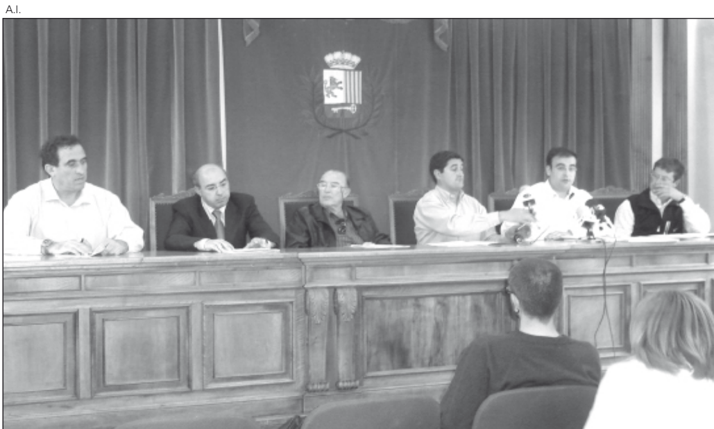
El 9 de mayo tuvo lugar la reunión para constituir este organismo.

OFRECERÁN INFORMACIÓN Y PARTICIPACIÓN CIUDADANA