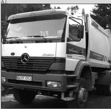
Camión de basuras.

El Conselh ya se ha asumido la recogida de enva-