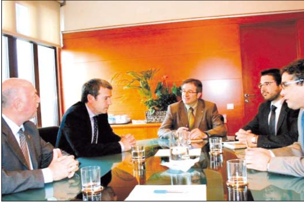
El encuentro de trabajo dejó patente la sintonía de los de Aran en este tema.

Durante la reunión también se fijó el calendario de trabajo hasta el final del proceso que señala la aprobación definitiva