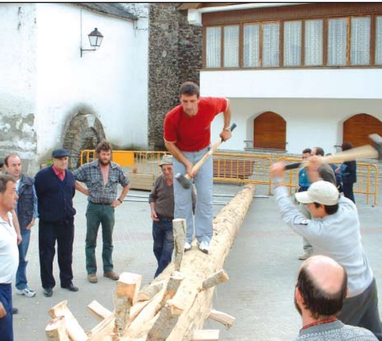
Prepara en la shasclada para que se seque bien.

ocan cuñas en el haro para que se seque bien