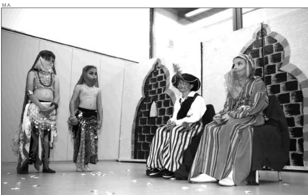
Representación del grupo de Les en Vielha.