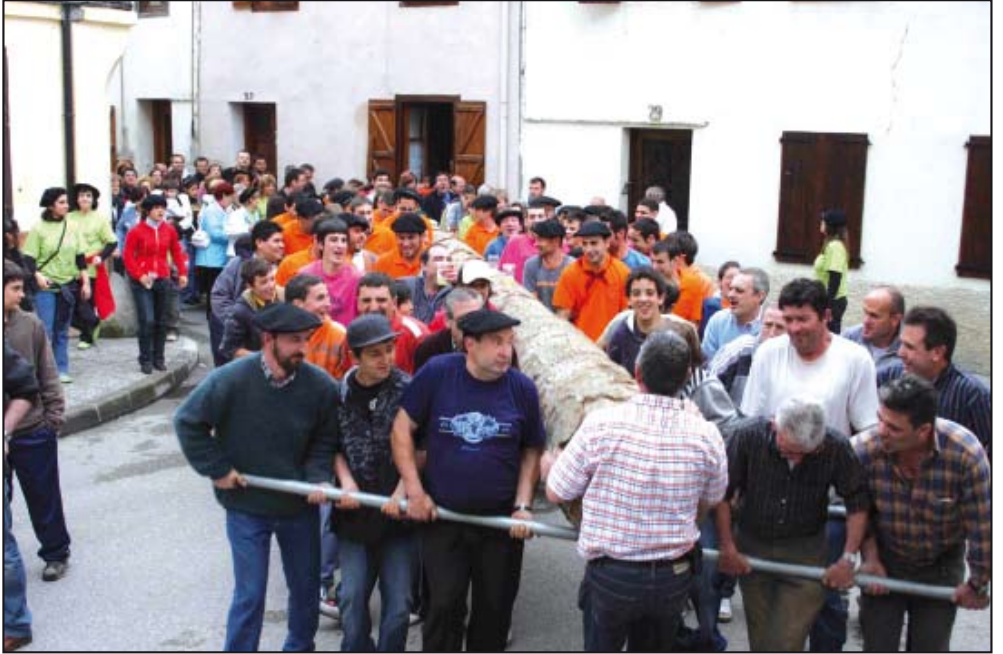
En primavera, una cuadrilla de hombres baja hasta el pueblo un buen tronco.