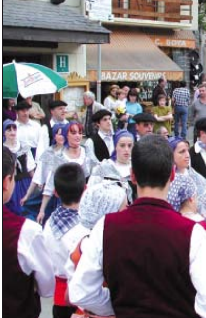
Bailes y folclore tradicional para

Sin embargo, regresamos al nuevo haro, al de la shasclada.