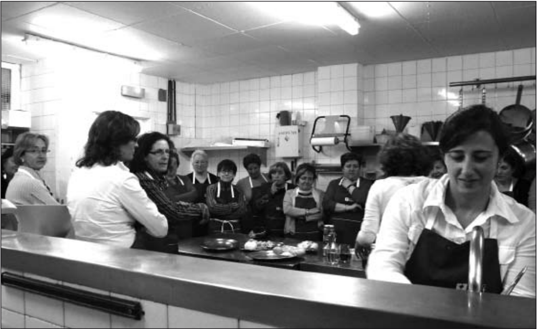
Los participantes aprendieron trucos de cocina saludable.