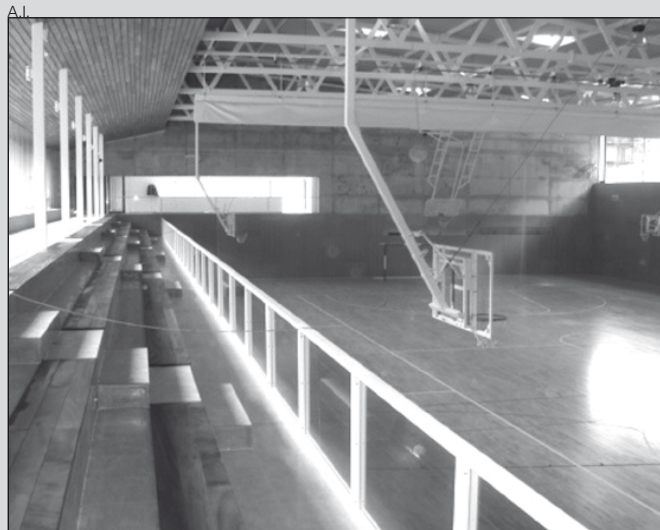
El Palai se estrenará el 14 y 15 con fútbol-sala.