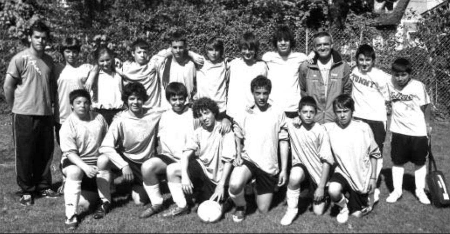
El equipo sub-13 se ha proclamado campeón de la Copa de Comminges.

BUEN BALANCE DE FIN DE TEMPORADA DE LA ESCÒLA DE FÚTBOL