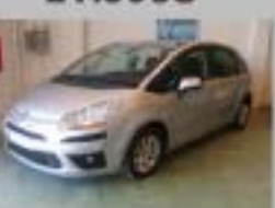
C4 PICASSO HDI 138 CMP SX AÑO 2008