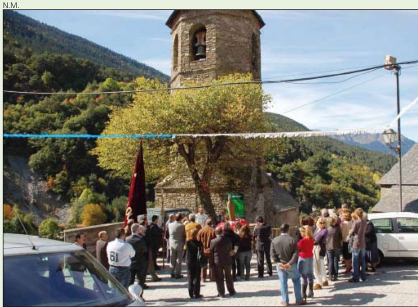
Numerosos vecinos asistieron al acto de inauguración.

Coincidiendo con sus fiestas mayores, Aubert inauguró la parte restaurada de la iglesia del Roser, cuyas obras finalizaron el pasado mes de septiembre. La intervención consistió en resolver problemas de humedad y de filtraciones de agua que presentaba el templo así como la construcción de dos escaleras de granito que mejoran el acceso. El presupuesto de la obra ascendió a 18.000 euros, un 70% de los cuales corrieron a cargo del Conselh Generau d'Aran, y el resto fueron aportados por la EMD d'Aubert y por la misma parroquia.