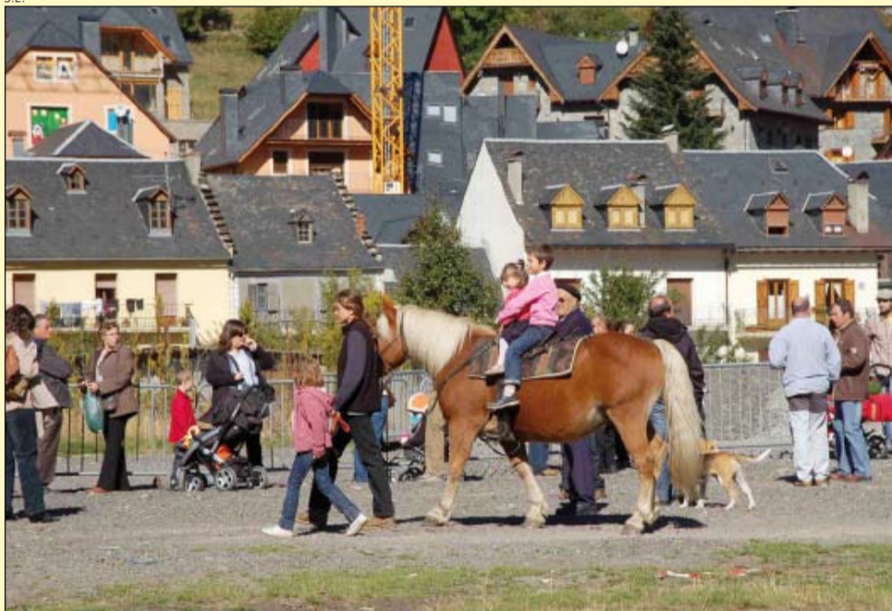
Los caballos fueron los protagonistas de las ferias ganaderas en Aran.