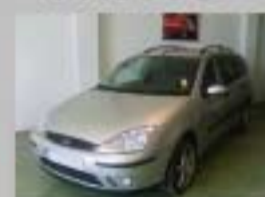
FORD FOCUS 1.8 TDI BK AÑO 2005