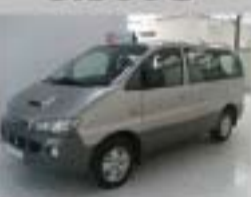
HYUNDAI H1 2.5D AÑO 2004

VEHÍCULOS DE GERENCIA Y DEMOSTRACIÓN 2 AÑOS DE GARANTÍA CITROËN