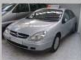
C5 HDI 136CV EXCLUSIVE AÑO 2003