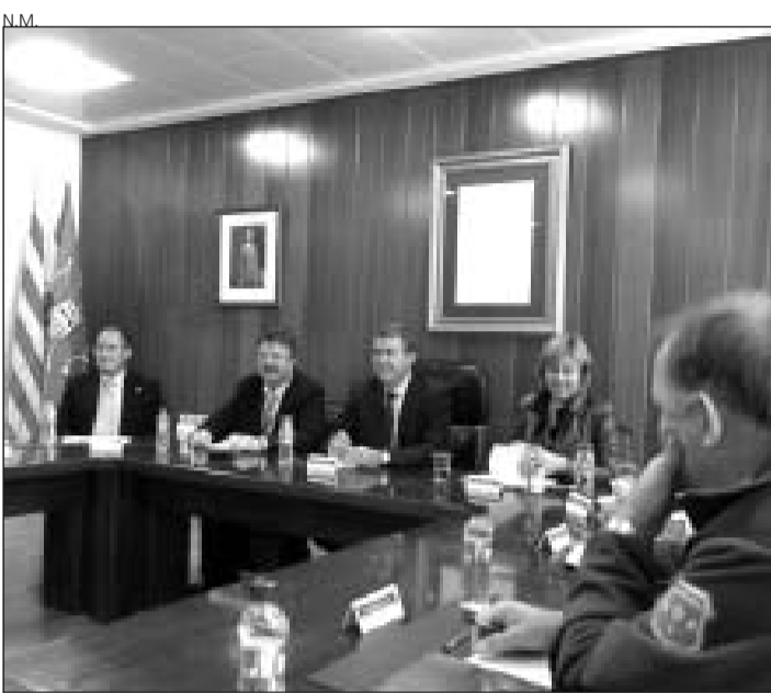
Reunión entre Conselh, Generalitat y Ministerio.