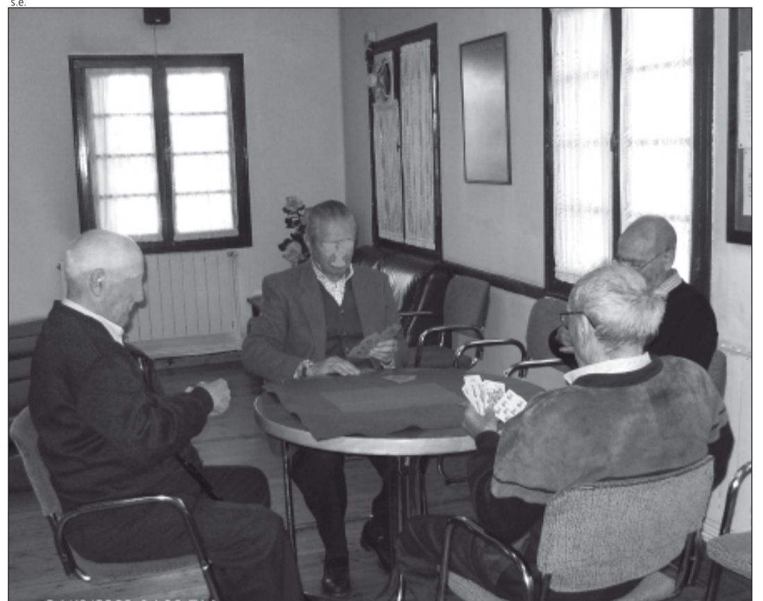
Casau deth Jubilat de Vielha.

actividades habituales, en el Casau deth Jubilat de Vielha se han iniciado unos cursos de yoga y que debido a la buena