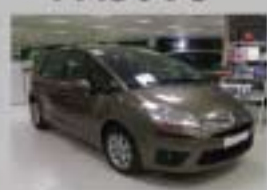
C4 PICASSO HDI 110 SX AÑO 2007