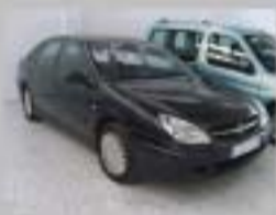
C5 136CV HDI EXCLUSIVE AÑO 2002