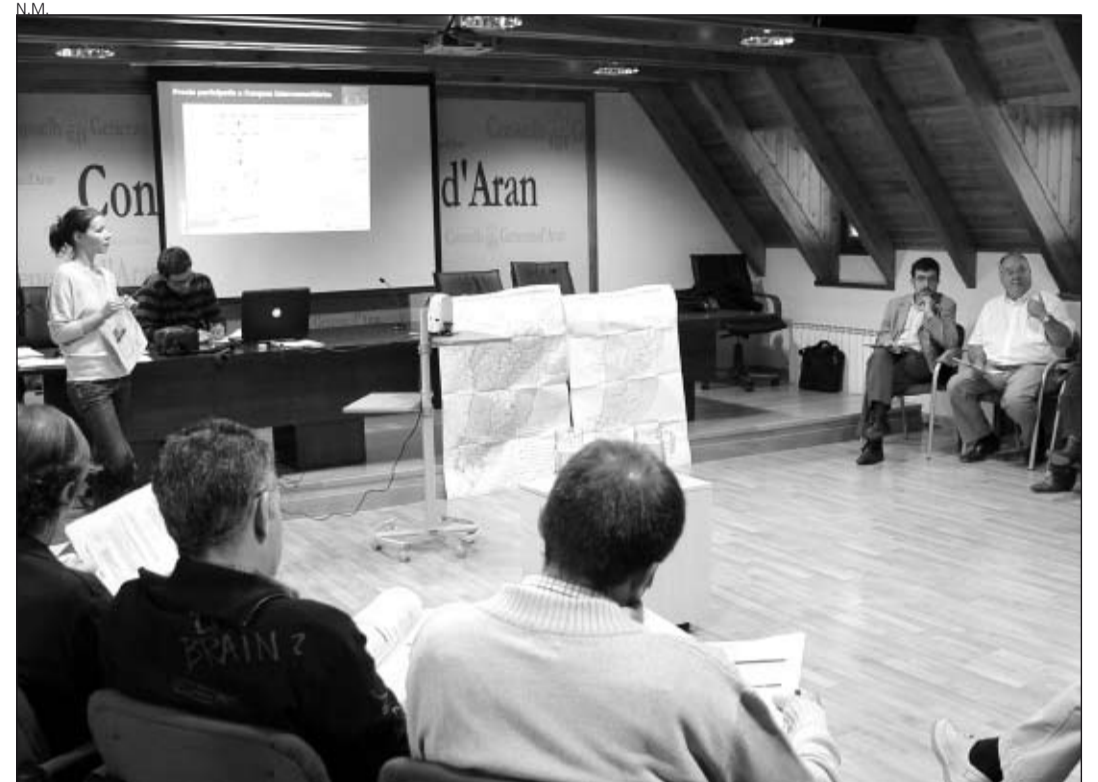
En la reunión se presentó las líneas básicas de la Directiva Marco del Agua.

Por otra parte, el conselhèr de Mieï Ambient e Pagesia del Conselh Generau d'Aran, Francisco Bruna, calificó de "desafortunado para el equilibrio del río" la muerte días antes de más de 2.000 ejemplares de trucha común en el término municipal de Les. Asimismo, recordó que el Departament de Mieï Ambient está esperando los resultados de las muestras de agua y animales