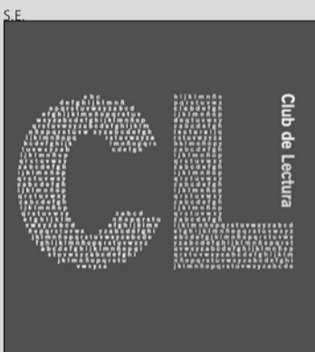
Logotipo del club.

Las inscripciones se formalizarán en la misma