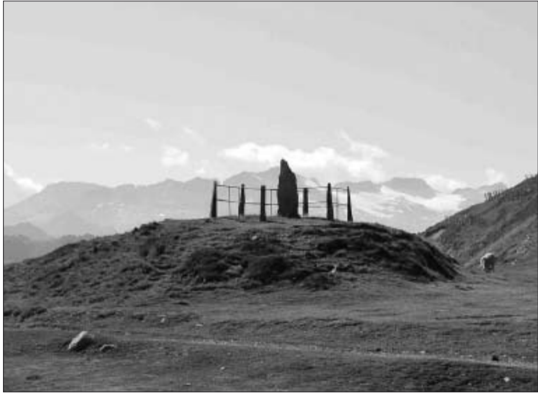
Los trabajos han localizado los elementos presentes en Beret.

denadas UTM los elementos arqueológicos presentes en Beret y estudiar sus características, con la finalidad de conocer la compatibilidad desde el punto de vista de patrimonio cultural de estos elementos con la cons-