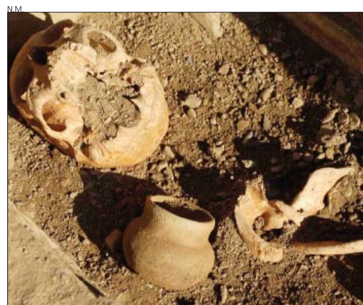
Detalle de uno de los enterramientos.

El presupuesto del proyecto asciende a 34.000 euros que corren a cargo de la Entidad Menor de Arties e Garòs con la colaboración del Conselh Generau d'Aran.