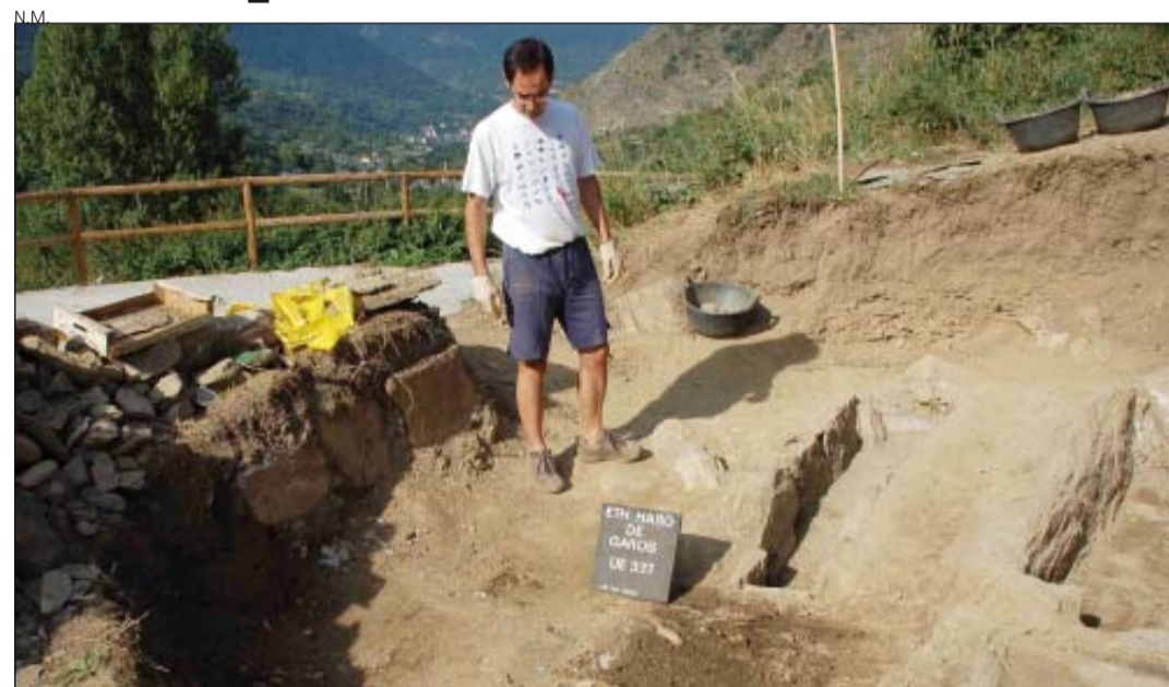
Las excavaciones han permitido descubrir nuevas tumbas de la necrópolis.