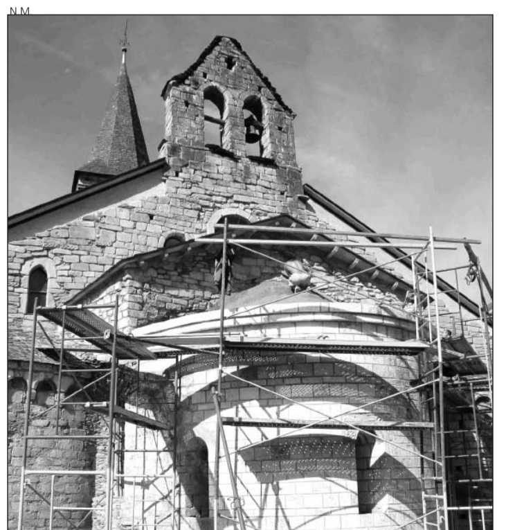
Obras del ábside de Santa María de Arties.

Las obras de restauración de la iglesia de Arties han contado con la participación del Conselh