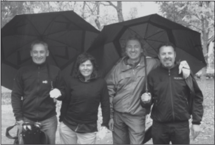
La lluvia no impide jugar al golf.

A falta del último torneo de la temporada el Trofeo Clausura que, si la climatología no lo impide, se celebrará el 2 de noviembre, las instalaciones de Golf Saldardú han sido el centro neurálgico de una gran actividad. Los pasados 11 y 12 de octubre se disputó el Torneo Pablos Cup, uno de los más importantes del calendario de golf aranes. La competición se disputa por parejas y este año la ganadora se llevó un cheque regalo por valor de 1.500 euros en material de golf. La cita, que desde hace ocho años tiene lugar gracias a la colaboración de la familia Pablos, contó con una gran participación y alto nivel de los participantes. La emoción presidió la emblemática competición, que