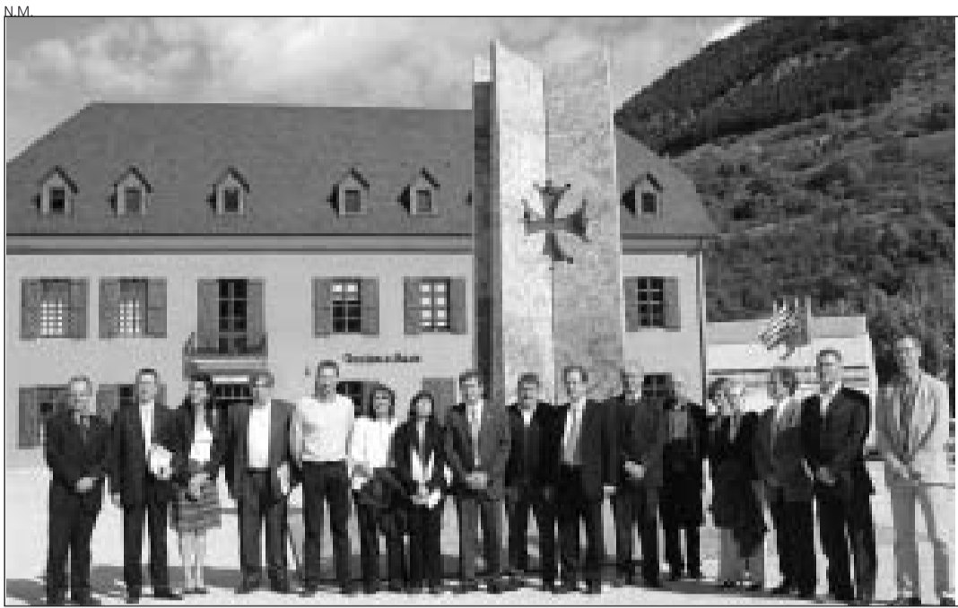
Integrantes de las dos delegaciones, en la plaza frente al Conselh de Aran.

De hecho, los equipos directivos y técnicos de los cua-