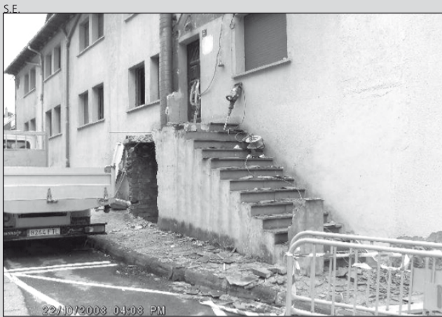
Escaleras que han sido derribadas.

dotar de este servicio, que funciona ya en la mayoría de los pueblos del municipio de Vielha e Mijaran.