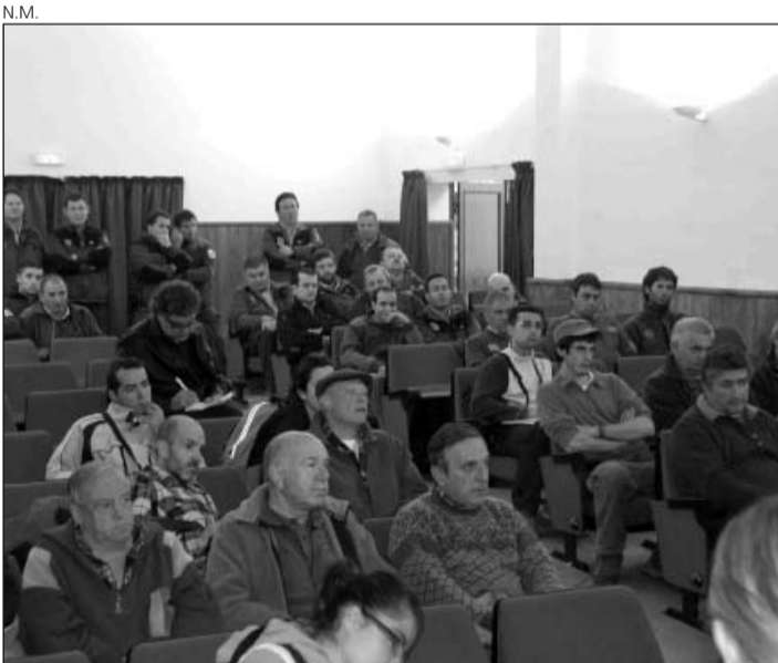
Expectación en la primera reunión del operativo.