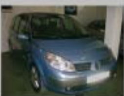
R.GRAND SCENIC 1.9D AÑO 2006