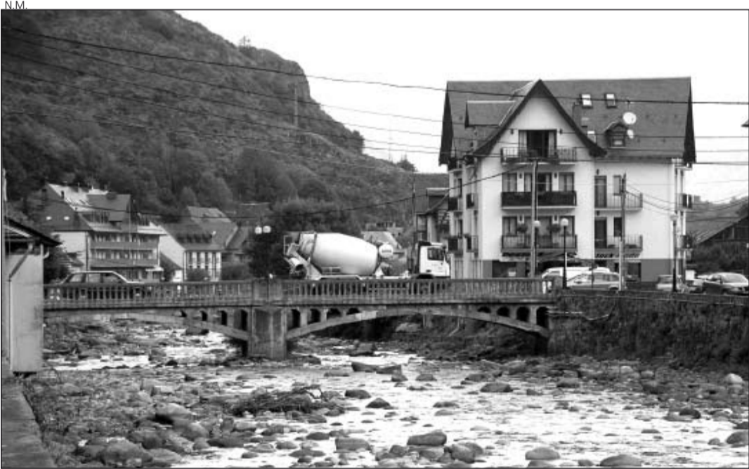
Puente que será derribado y sustituido por uno nuevo.