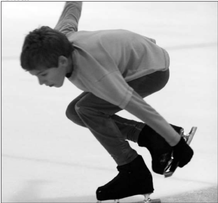
N.L.L. Uno de los deportistas, durante los entrenamientos.