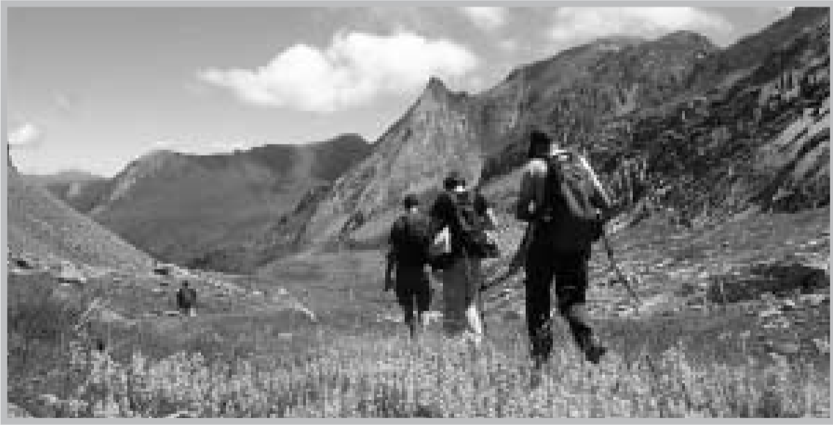
El Setau Sagèth o Séptimo Sello cada vez es más conocido y cuenta con más participación.

Durante su estancia en tierras suizas, los responsables del Setau Sagèth han establecido unos puntos de colaboración con el Tour de la Val d'Anniviers en los que se contempla el intercambio anual de información,