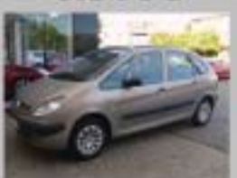
XSARA PICASSO 2.0 D AÑO 2004