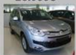
C-CROSSER HDI 160 VTR AÑO 2008