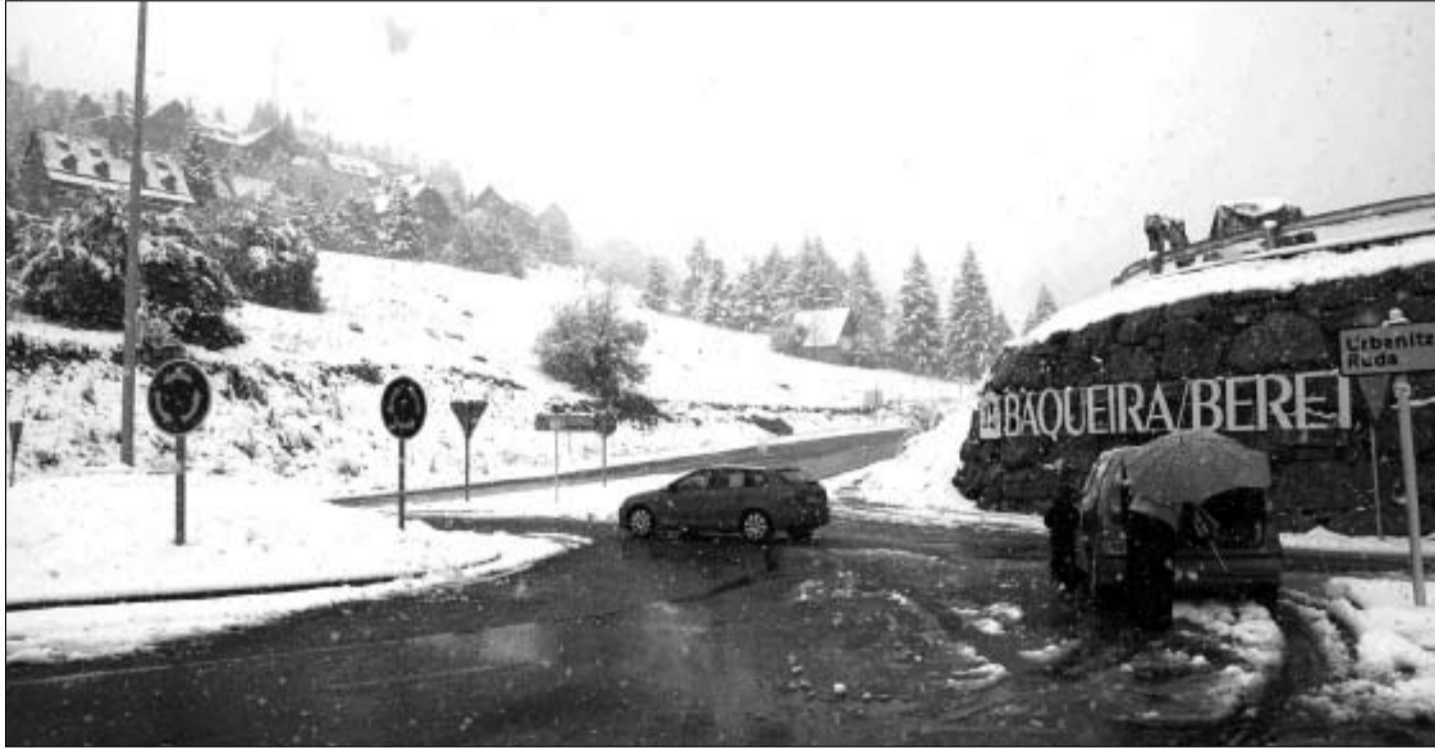
La nieve cubre ya las cimas de la Val d'Aran, que prepara una nueva temporada invernal.