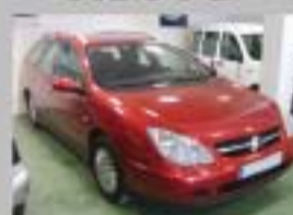
C5 HDI 110 EXCLUSIVE BK AÑO 2002