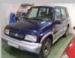
SUZUKI VITARA 2.0 AÑO 2004