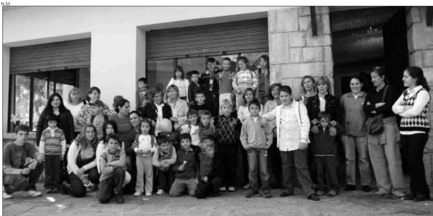
Los padres de los escolares de Gausac que demandan disponer de transporte escolar para sus hijos.

En la reunión con las madres de Gausac, Serrano anunció que el Conselh Generau colaboreará con el Ajuntament de Vielha-Mijaran y la EMD de Gausac para prestar el servicio de transporte escolar dado que, según la legislación vigente, el Conselh ha de garantizar la gratuidad del servicio a los alumnos que no tengan oferta educativa en su municipio. Así,