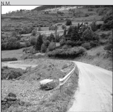
Obras en los accesos a Vilac.

Las obras para realizar mejoras en el acceso al núcleo de Vilac se están realizando ya y está previsto que terminen a principios del verano de 2009. Las obras son una reforma integral de la carretera a lo largo de 2 kilómetros, suprimiendo algunas curvas y dando 5 metros de ancho a la vía más un metro de arcén a cada lado.