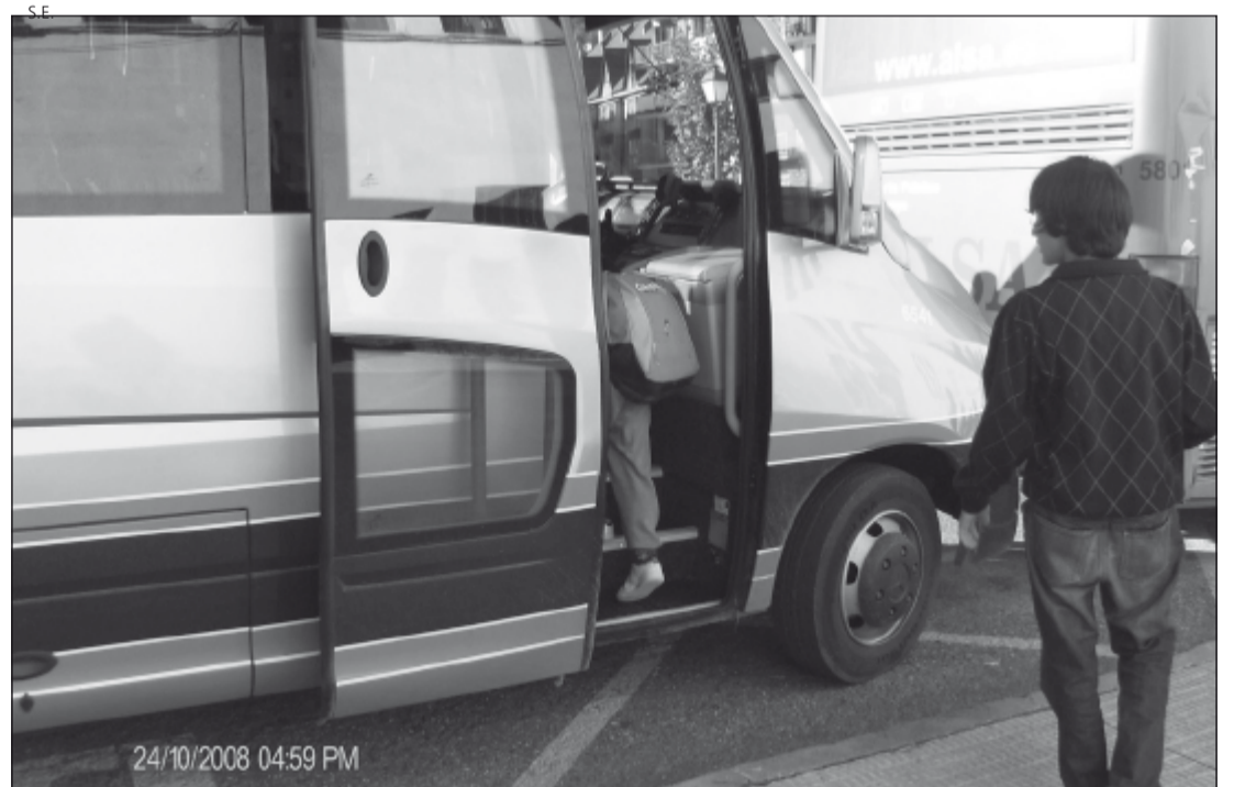
Numerosos escolares araneses utilizan el servicio de transporte escolar.

Generau d'Aran se ha comprometido a estudiar dichas propuestas mostrando una clara voluntad de colaboración para poder