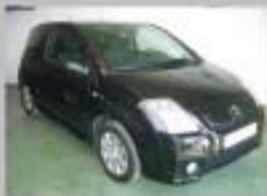
C2 1.4 i VTR PLUS AÑO 2007