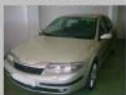
R.LAGUNA 2.2 D 110CV AÑO 2004