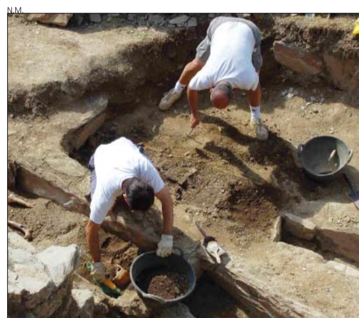
N.M. Los trabajos se han desarrollado este verano.