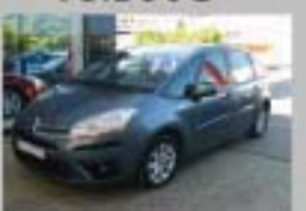
C4 PICASSO HDI 138 CMP SX AÑO 2007