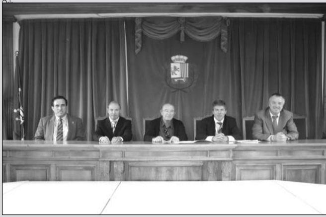
Imagen de la firma del convenio de gasificación.