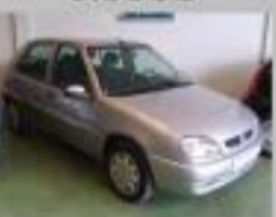
C.SAXO 1.5 D SX AÑO 2001