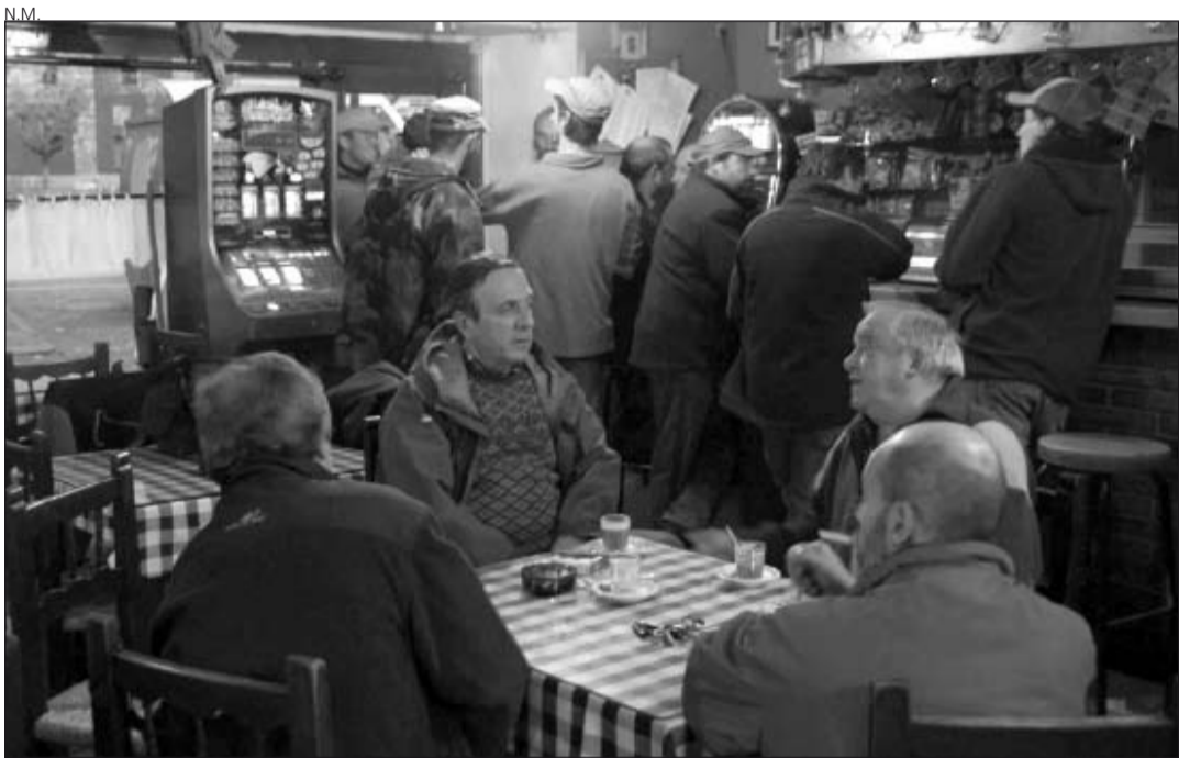
Participantes en una de las batidas del Conselh en Les, antes de salir.

Sin embargo, Buenaventura afirmó que el Departament de Medi Ambient de la Generalitat sigue apostando por el programa de reintroducción del oso en el Pirineo -ante el desacuerdo de Boya-, y destacó que se trata de un incidente aislado producido al cabo de 12 años de la reintroducción. Además, reconoció que es necesario la captura de la osa para conocer con más exactitud cuál es su estado de salud y