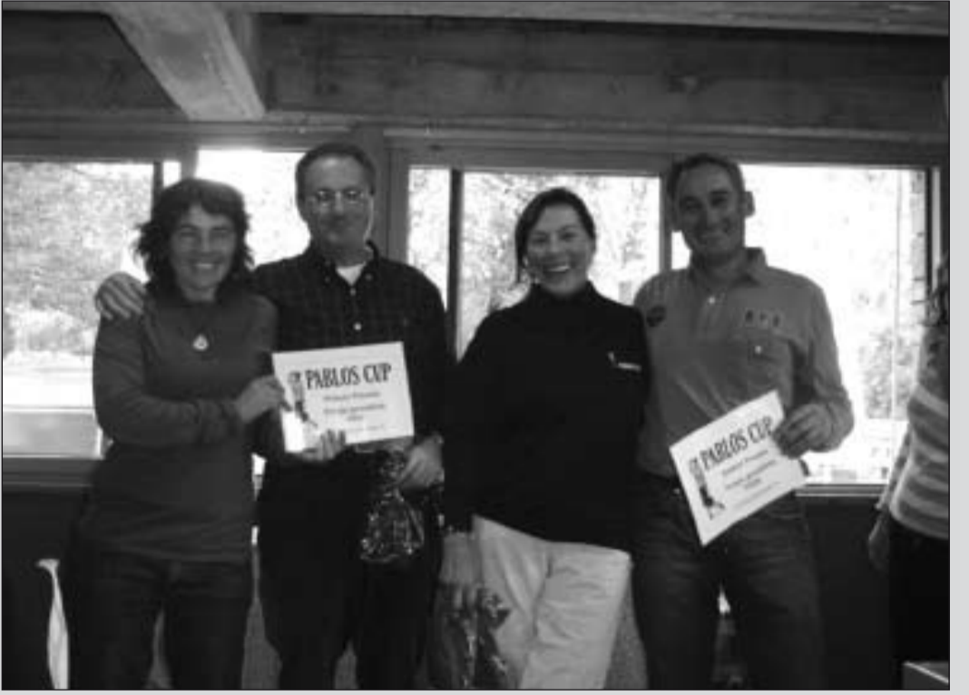
Parejas finalistas en el Torneo Pablos Cup con sus diplomas acreditativos.