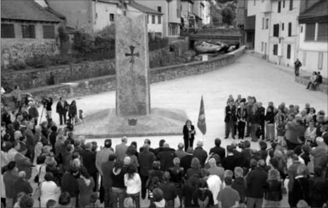
Más de trescientas personas se dieron cita en la inauguración.

LOS TRABAJOS HAN PERMITIDO LOCALIZAR LOS RESTOS ARQUEOLÓGICOS Y SU COMPATIBILIDAD CON EL CAMPO DE GOLF