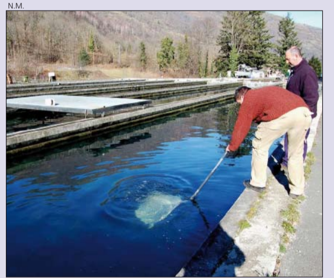
Instalaciones de Caviar Nacarii en Les.