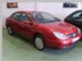
C5 HDI EXCLUSIVE AÑO 2002