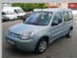
BERLINGO HDI SX PLUS AÑO 2006