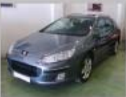
PEUGEOT 407 SW HDI SPORT AÑO 2005