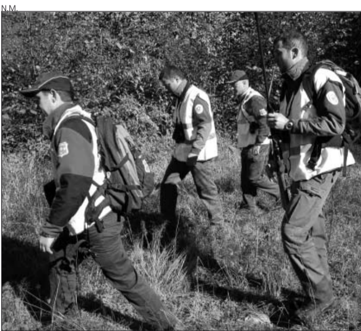
Los agentes forestales durante una de las batidas.