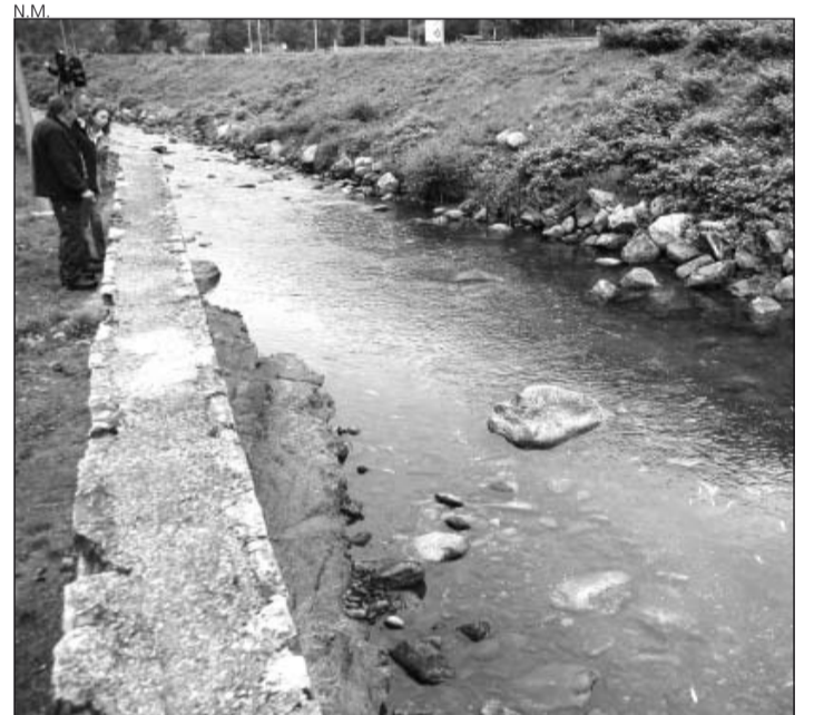
Truchas muertas en el Garona crearon expectación.