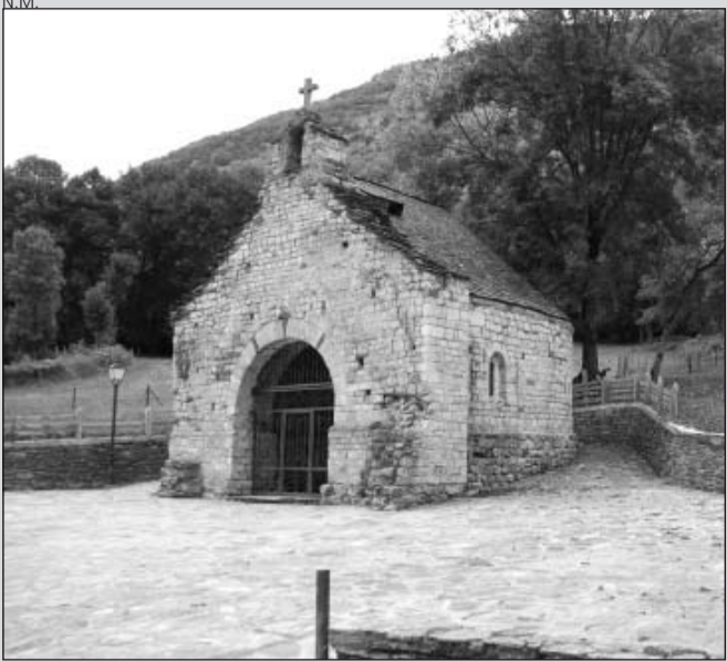
Aspecto que presenta la ermita de Sant Blai.