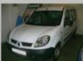
R.KANGOO 1.5 DCI AÑO 2005