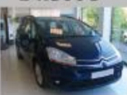
C4 GRAND PICASSO HDI 138 CMP SX AÑO 2008