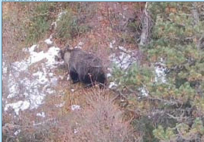
Primeras imágenes de la osa Hvala tras el ataque al cazador.