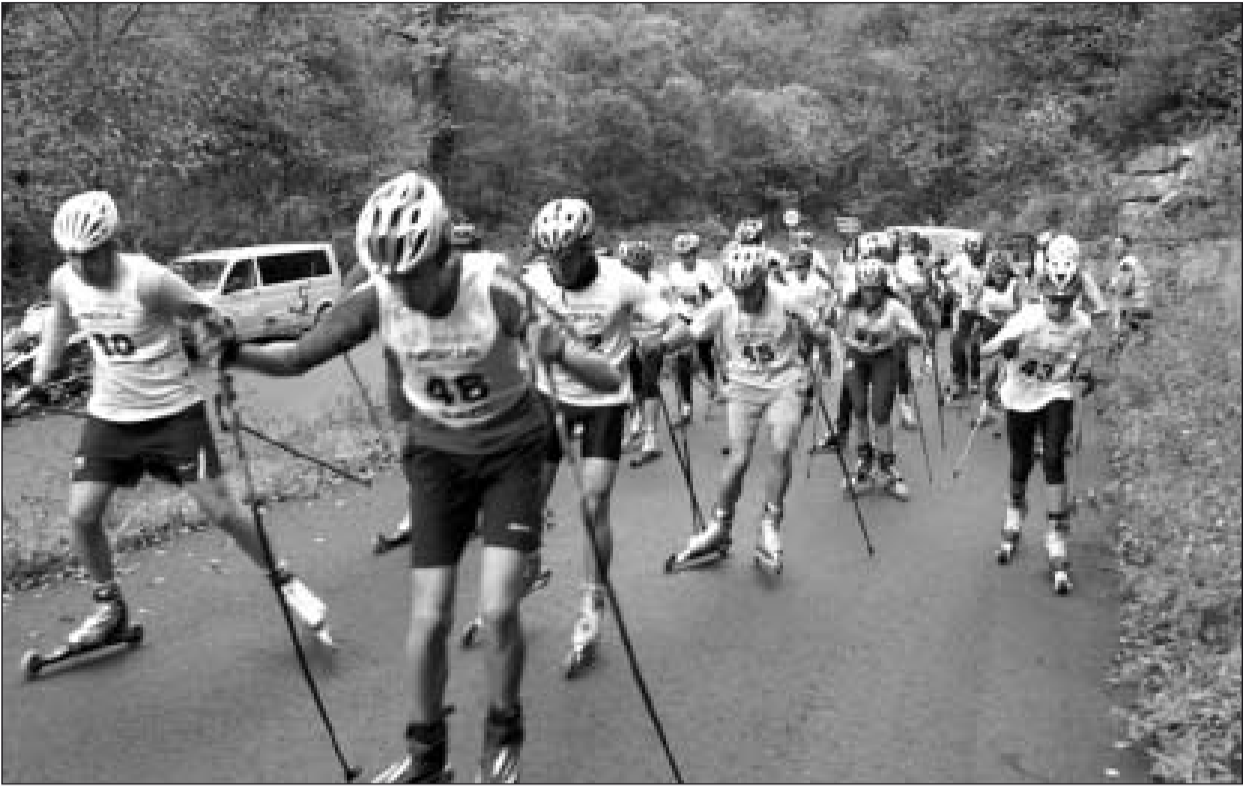
Los participantes en el I Aranroller destacaron la belleza y características del circuito.

El tiempo acompañó y a los participantes les gustó el recorrido, dentro de un paraje de gran belleza y con un colorido otoñal, además de la variedad del recorrido en el que se marca-