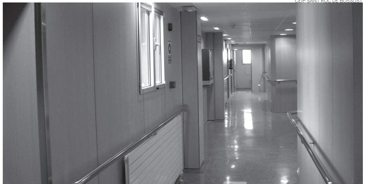
La residencia Sant Antoni presenta un aspecto renvado tras las obras. Sólo falta el equipamiento.

De esta forma, "se duplicarán las prestaciones sociales que afectan actualmente a la residencia, para dar una respuesta a las necesidades de asistencia generadas por el envejecimiento de la población aranesa", afir-