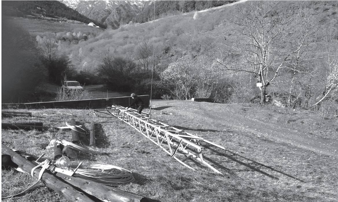
Endesa desmantela la línea eléctrica aérea entre el cap de la Vila y la boca norte del túnel.