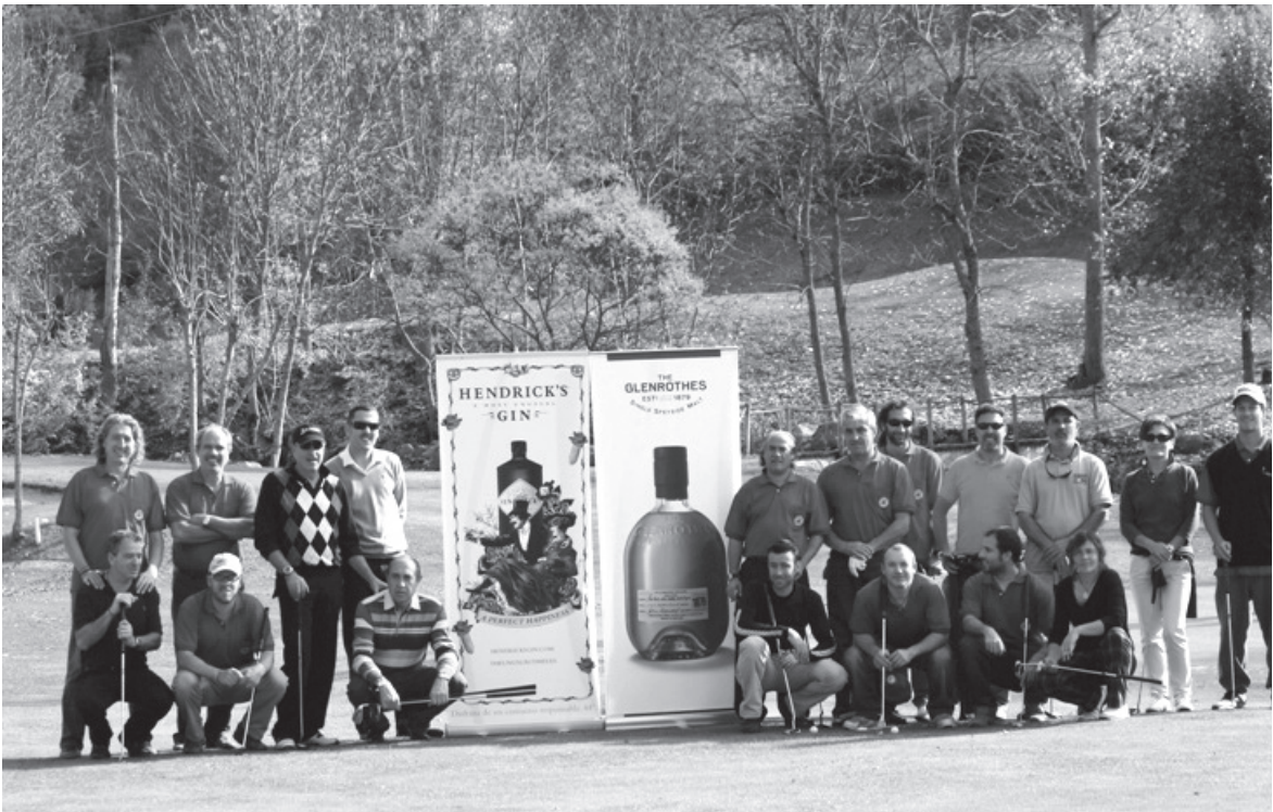
Foto de familia de los premiados en el Trofeo Clausura ‘Eth Bot’ celebrado en Golf Salardú.

Aunque falta mucho para la próxima temporada, la principal novedad ha sido la creación del Aran P&P Golf Club, que