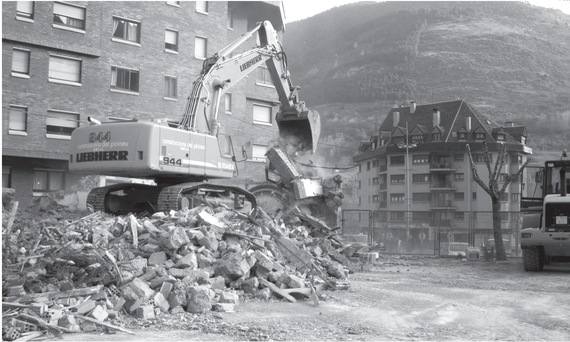
Las máquinas excavadoras derruyeron los muros del antiguo colegio de la capital aranesa.

El solar, de titularidad municipal, había sido cedido por el Ajuntament al Departament d'Educació de la Generalitat para acoger servicios educativos. Sin embargo, la construcción en el año 2007 del nuevo edificio del CEIP Garona en Betren, hizo que el Consistorio de la capital aranesa reclamara la desafectación del solar para acoger nuevos equipamientos. El año pasado se consiguió un acuerdo con el Departament d'Educació de la Generalitat para desafectar el 70 por ciento de la finca de 2.700 metros cuadrados, para poder ubicar allí equipamien-