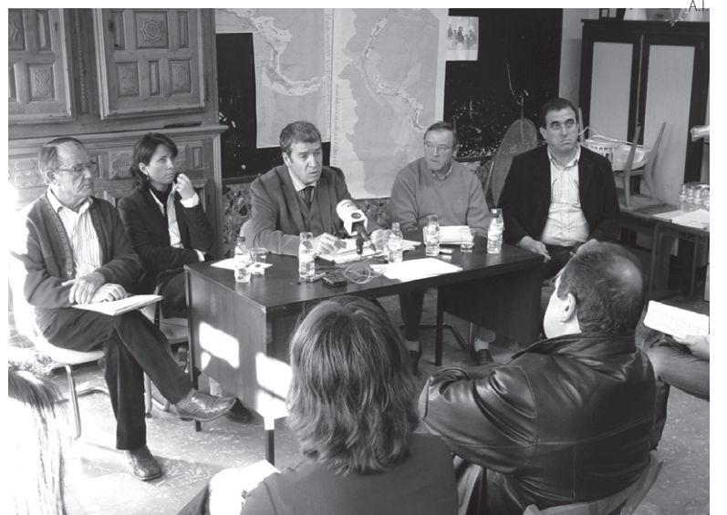
A.I. Reunión del Conselh de Marcatosa, celebrado en Vilac.

Mientras tanto, el Conselh ejecutará a partir de la próxima primavera, por fases desarrolladas en diferentes anualidades, el proyecto de adecuación del camino forestal de Salient, en Vilac, de 22 kilómetros de longitud.