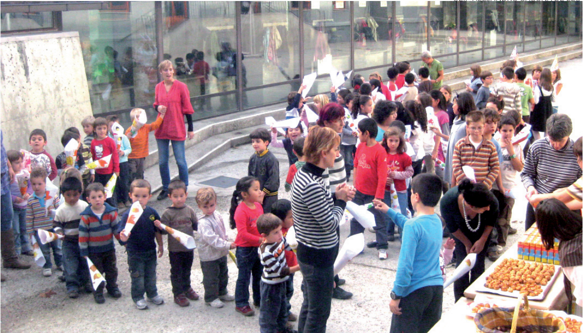
Toti vam a cercar es castanhes, es panelhets, chucs e... a minjar!

abantes dera hèsta, elaborèren es panelhets en minjador. Aguest dia es escolans d'infantila e de cicle iniciu cantèren cançons, es de cicle miei mos premaniren ua dança e es de cincau interpretèren ua version musicau deth conde "Era Castanhèra". Es de siesau heren a còder es castanhes e les repartiren damb es chucs e massapans.