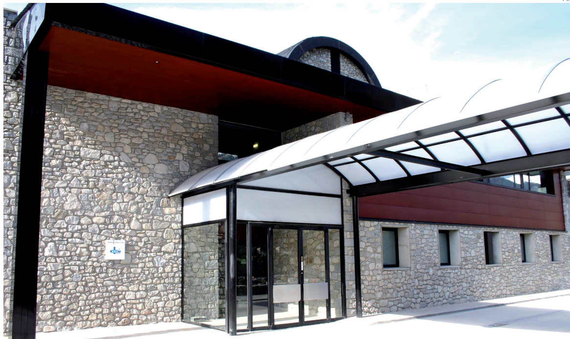
El Espitau Val d'Aran cuenta con un protocolo de actuación ante la Gripe A.