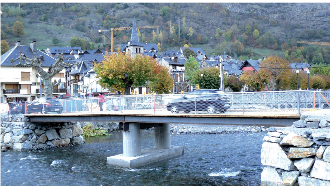
Nueva pasarela sobre el Garona que comunica las dos zonas de Bossòst divididas por el río.

Es el paso previo al derribo del viejo puente de la localidad