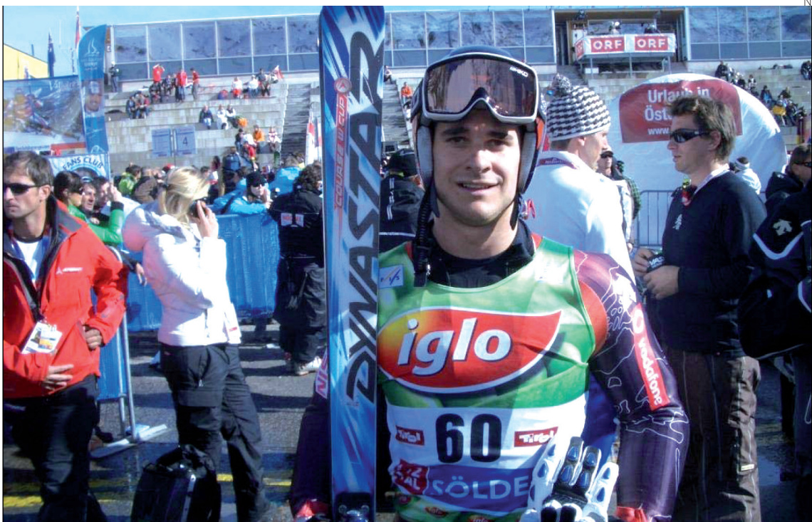
La competición reunió a nadadores de categoría benjamín, alevín e infantil de la Val d'Aran.