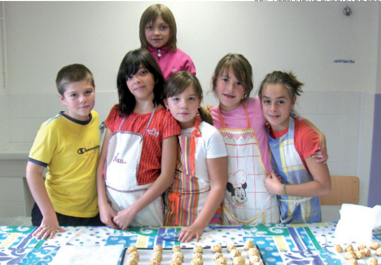
Elaboracion de panelhets. Cicle Superior.