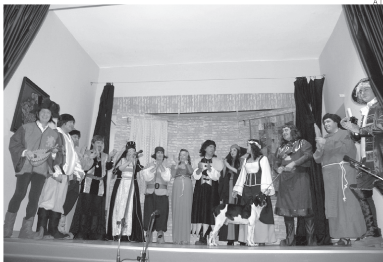
Actores de Era Cabana en su anterior representación.