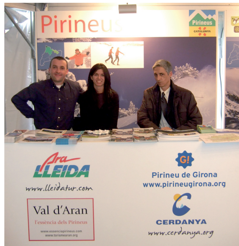
Aran mostró toda su oferta en la Barcelona Snow Show.

sector turístico. Allí, Torisme Val d'Aran presentó su oferta senderista y de naturaleza, de arte y cultura... en definitiva, de todas las posibilidades que ofrece el territorio aranés.