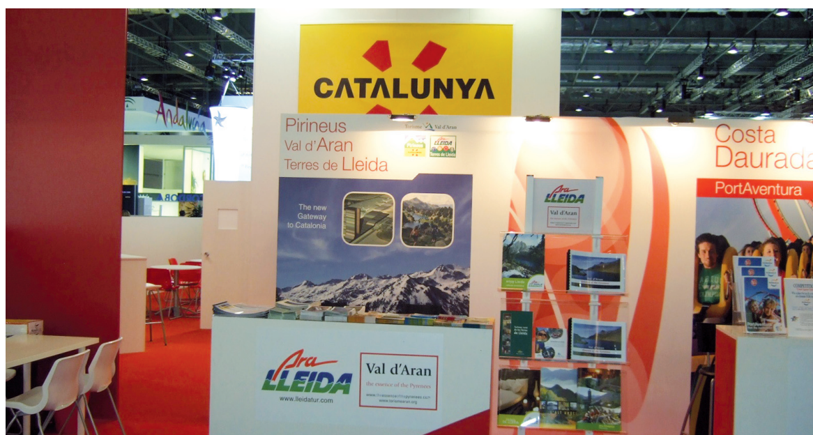
Stand de Torisme Val d'Aran en la World Travel Market de Londres.