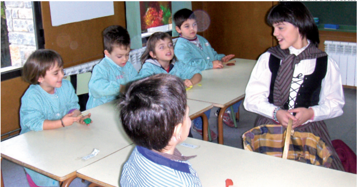
Era castanhera arremassant es castanhes en P4.