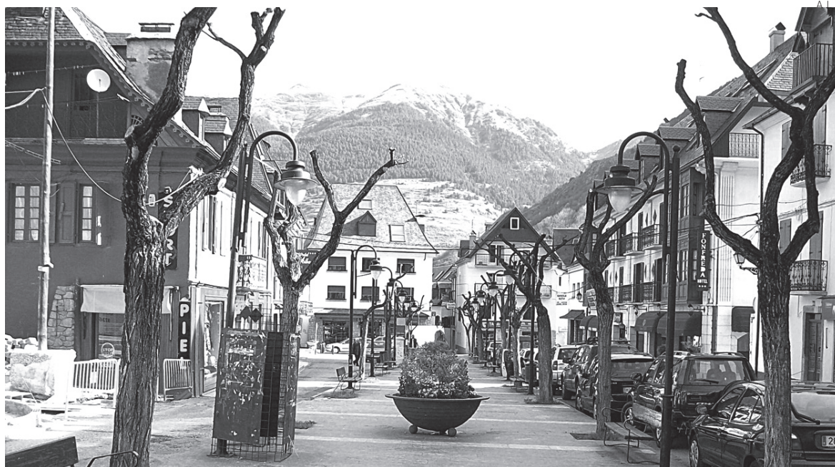
Imagen del Passeig dera Llibertat de Vielha, que será remodelado en breve.

El Ajuntament de Vielha e Mijaran explicó, en nota de prensa, que “las valoraciones catastrales que influyen en el IBI vienen determinadas por el Ministerio de Economía y Hacienda, quien decreta las revisiones de estos valores”. En el caso de Vielha e Mijaran, se realizó en 2001 y entonces el Ministerio decretó que la subida se prolongaría durante diez años, a razón de