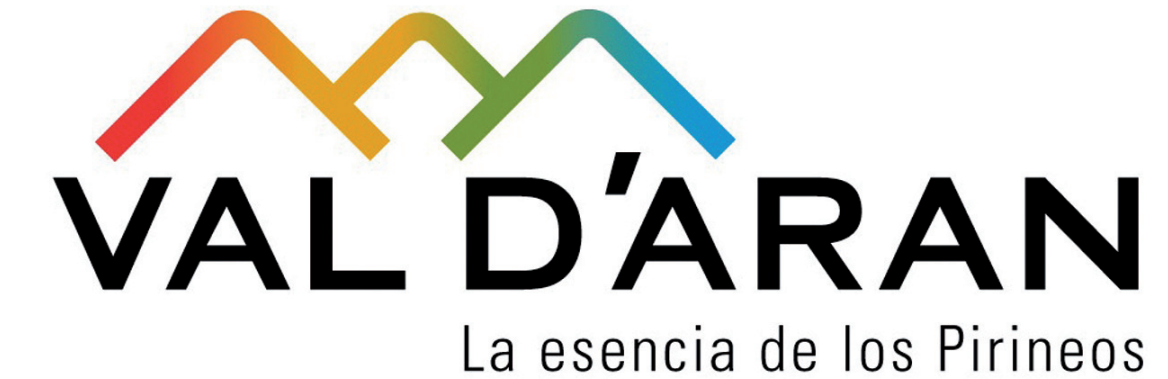
Imagen de la nueva marca turística de la Val d'Aran.

“Es una imagen representativa, que la gente identifica con el territorio nada más ver-