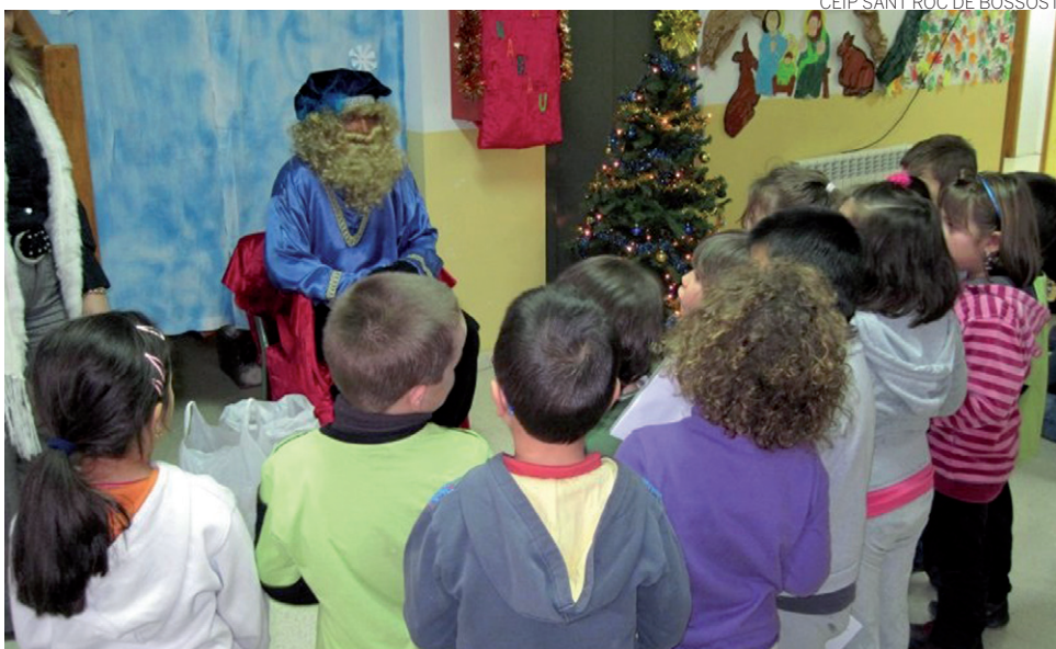
CEIP SANT RÒC DE BOSSÒST

Y, como broche final al año que se acaba, los alumnos de Educación Infantil y primer ciclo de Educación Primaria -1º y 2º- cumplieron la tradición de "hèr cagar era tronca", recibiendo caramelos de la tronca de Nadau que, a buen seguro, también tendrán en sus hogares en distintos puntos de la Val d'Aran.