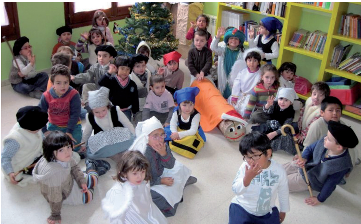
CEIP SANT RÒC DE BOSSÒST

No obstante, los más pequeños aguardan con impaciencia