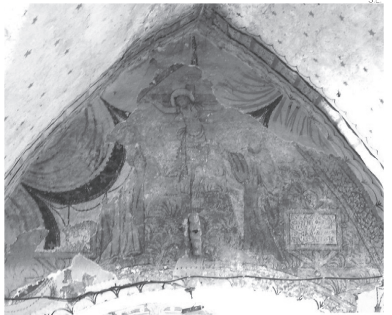
La imagen muestra a Jesús junto a María y Juan.

El descubrimiento de esta nueva escena, que se añade al conjunto encontrado este verano en la iglesia de Unha, también de estilo renacentista y representando las siete virtudes teologales, ha aumentado el valor artístico de la iglesia de Begòs, de origen románico, con una importante parte de estilo gótico y un retablo barro-