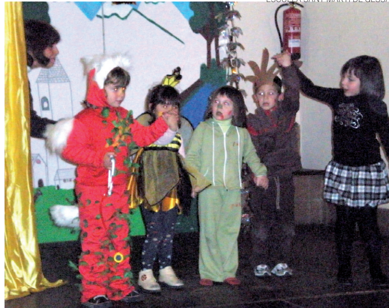
ESCUELA SANT MARTÍ DE GESSA

Los jóvenes escolares recibieron el aplauso del público tras su representación teatral.