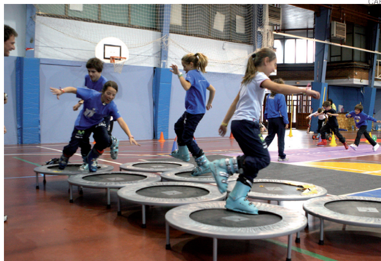
Entrenamiento en seco para ultimar la forma para la nieve.