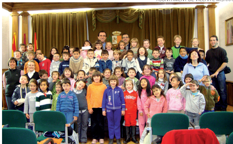
AJUNTAMENT DE VIELHA E MIJARAN

Los alumnos de primer ciclo de Educación Primaria del CEIP Garona de Vielha han tenido una apretada agenda antes de navidades. Los de 1º visitaron el ayuntamiento de Vielha, mientras que los de 2º se trasladaron al Conselh Generau d'Aran.