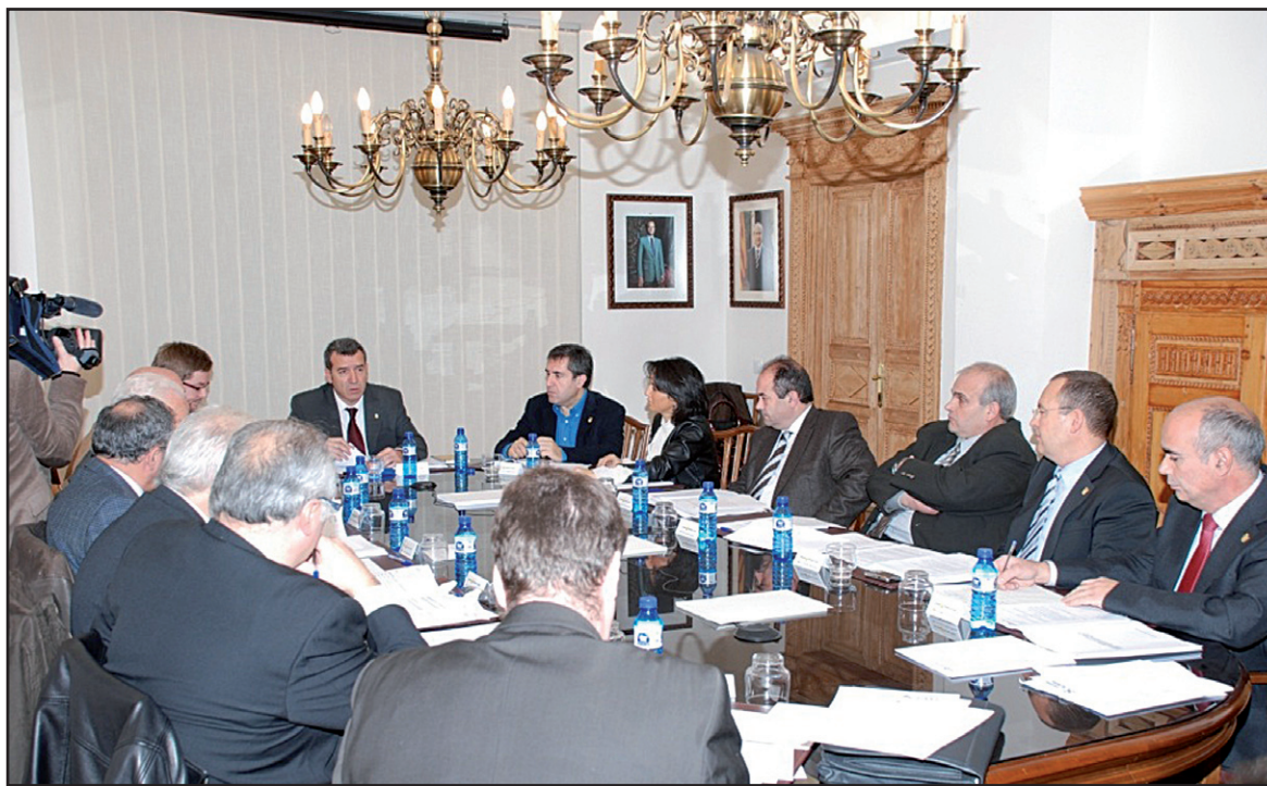
Los conselhers votaron unánimemente la propuesta.

El líder de UA y actual sindic d'Aran, Francés Boya, propuso reiterar el pacto de consenso entre los grupos políticos representados en el Conselh. Y eso se logró en la declaración institucional, aprobada de forma