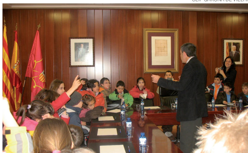
CEIP GARONA DE VIELHA