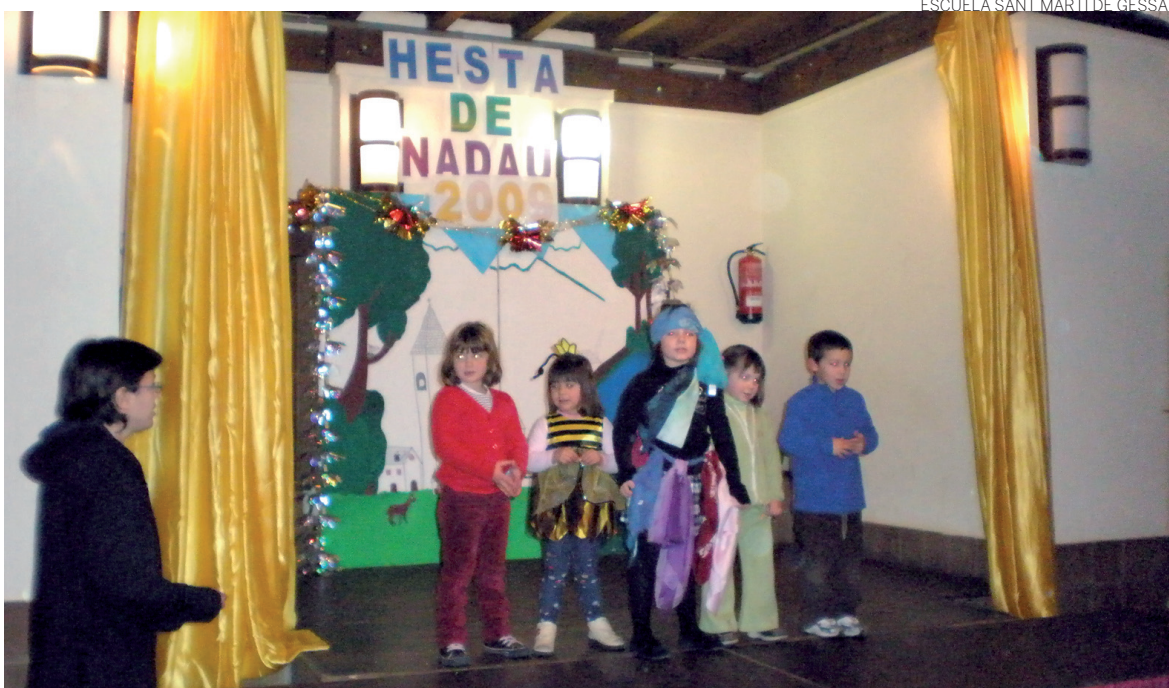
ESCUELA SANT MARTÍ DE GESSA

Los jóvenes escolares recibieron el aplauso del público tras su representación teatral.