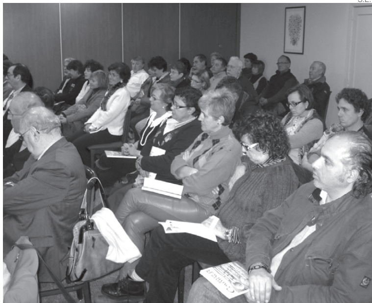
Asistentes a la conferencia de Isaure Gratacos.