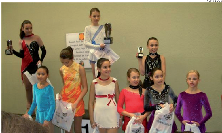
Podio de categoría benjamín, con presencia aranesa.