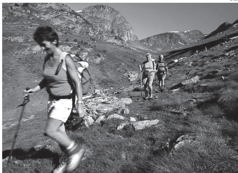
El senderismo es uno de los valores de la Val d'Aran.

El proyecto, que se lleva a cabo junto con Turespaña, prevé señalizar una ruta en cada localidad aranesa, que comenzará, pasará o finalizará en la misma población, con el fin de poner en valor sus elementos patrimoniales.