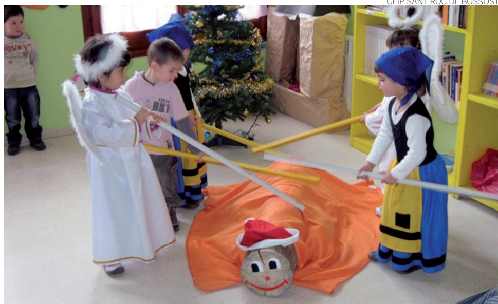
CEIP SANT RÒC DE BOSSÒST