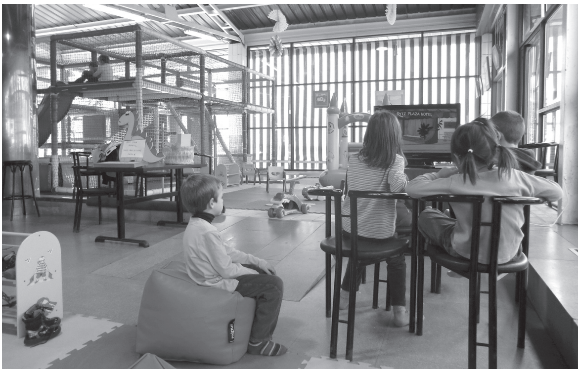
El nuevo espacio infantil de Vielha está totalmente acondicionado para recibir a los niños.

Situado en el Palai de Gèu y abierto a todos los niños