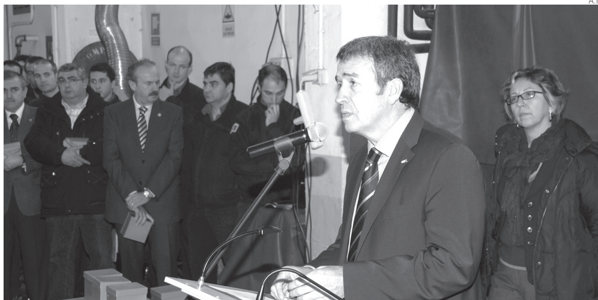
A.I. El sindic felicitó a los bomberos homenajeados por su dedicación al cuerpo.