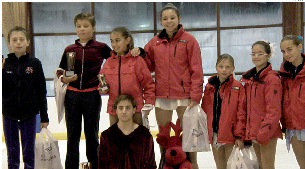
Los patinadores araneses consiguieron un total de siete medallas en el campeonato.