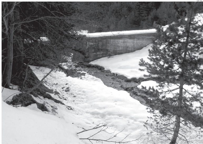
Un alud afectó al barranco del río Loseron en primavera.