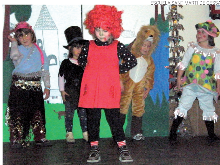
ESCUELA SANT MARTÍ DE GESSA

A.I. Los pequeños cantaron y recitaron poesías sobre el circo.