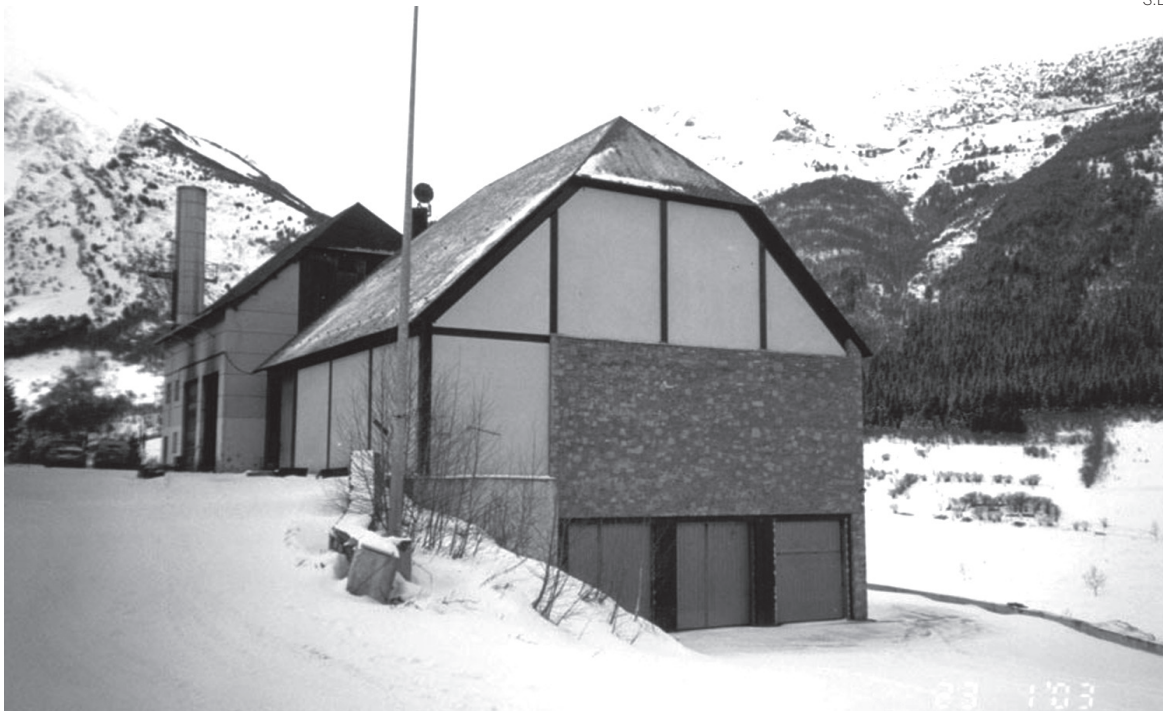
La antigua incineradora acogerá la planta de transferencia de residuos.

El proyecto contempla el aprovechamiento de las instalaciones de la antigua incineradora, que acabó su ciclo vital en 2003. Con esta intervención se adecuarían las dos naves