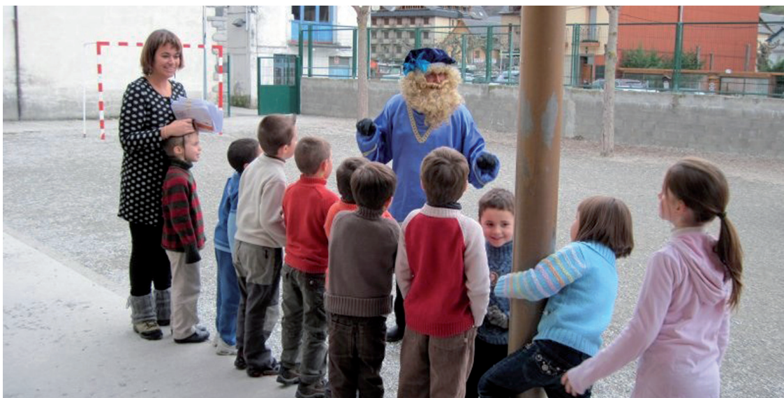
CEIP SANT RÒC DE BOSSÒST