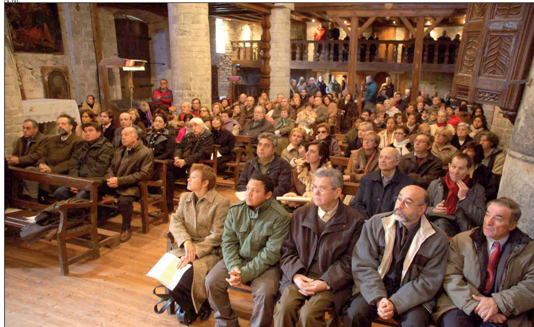
Un gran número de araneses asistieron al acto inaugural.

se encontraban en mal estado, y se ha sustituido el pavimento del presbiterio. La empresa Fecsa Endesa se ha hecho cargo de la renovación de la iluminación, tanto interior como exterior del templo.