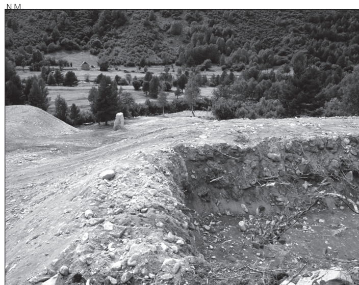
El campo de tiro ya tiene la licencia de obras.

Además, a lo largo de este año, el Ajuntament de Naut Aran confía en poder afrontar diversas actuaciones en el