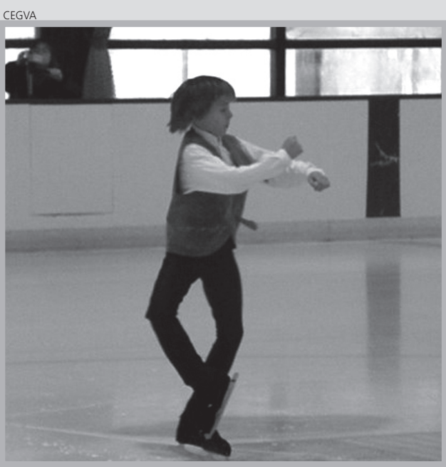
Los patinadores del CEGVA consiguieron buenos resultados en la Copa Federación celebrada en Vielha.

EL CEGVA FUE EL PROTAGONISTA DE LA COMPETICIÓN CELEBRADA EN VIELHA