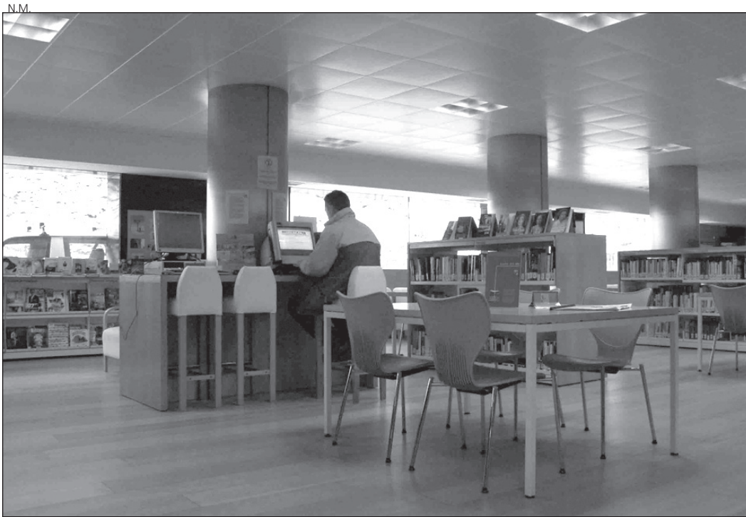
Instalaciones de la Bibliotèca Generau de Vielha.

García declaró también que la ampliación del horario permite más flexibilidad a los usuarios, que podrán acceder a las instalaciones durante más horas