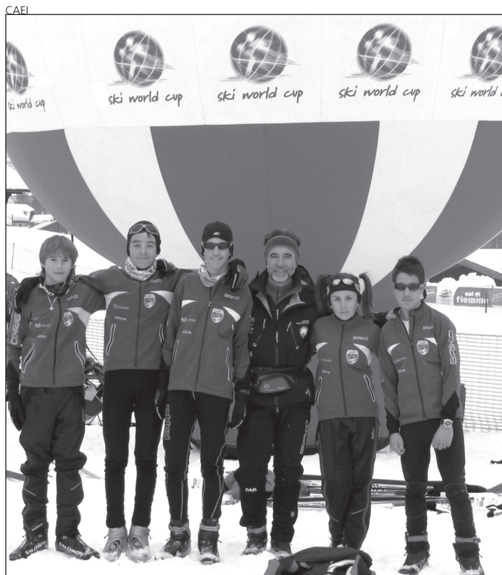
Los fondistas araneses, en la Copa Topolino.

Cuatro medallas de oro y tres bronce es el balance con-