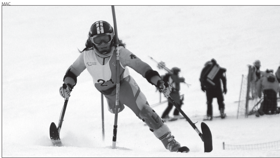
Una de las integrantes del MAC durante una competición esta temporada.

Por otra parte, la aranesa Ainhoa Cardet participó el pasado 11 de enero en los Campeo-