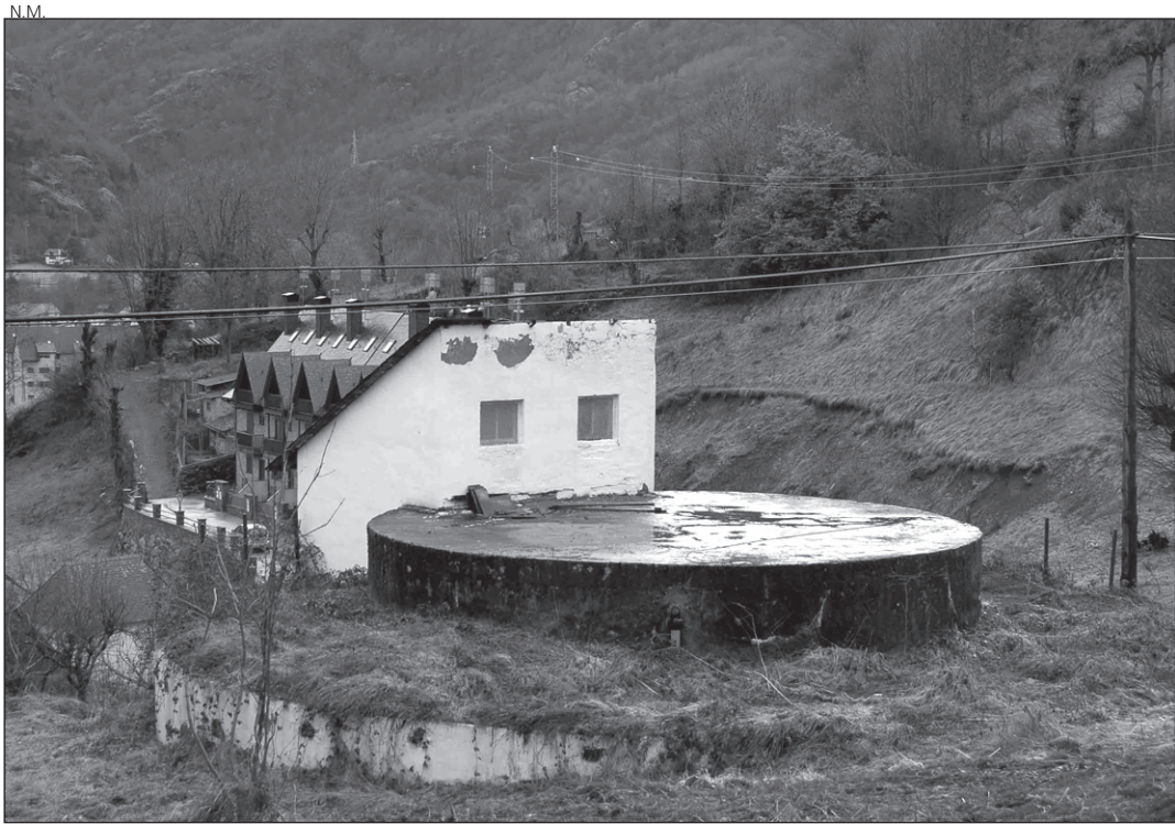
El Ajuntament de Bossòst mejorará la red de abastecimiento de agua de boca.