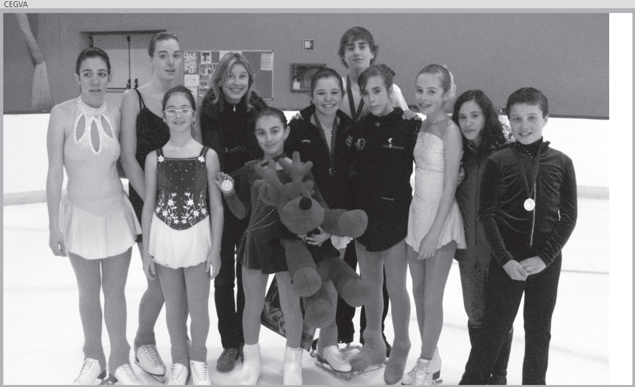
Foto de grupo de los araneses que compitieron en la Copa Federación en Vielha.

Los resultados finales de los patinadores araneses fueron los siguientes: