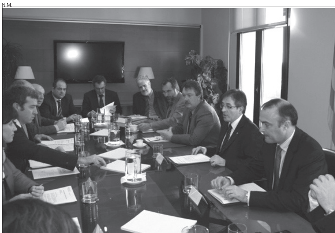
La reunión de la comisión Generalitat-Conselh se celebró en Barcelona.

La comisión aprobó un convenio entre el Departament de Salut de la Generalitat y el Servei Català de Salut con el Conselh Generau d'Aran y el Servei Aranés de Salut para desarrollar los contenidos del traspaso