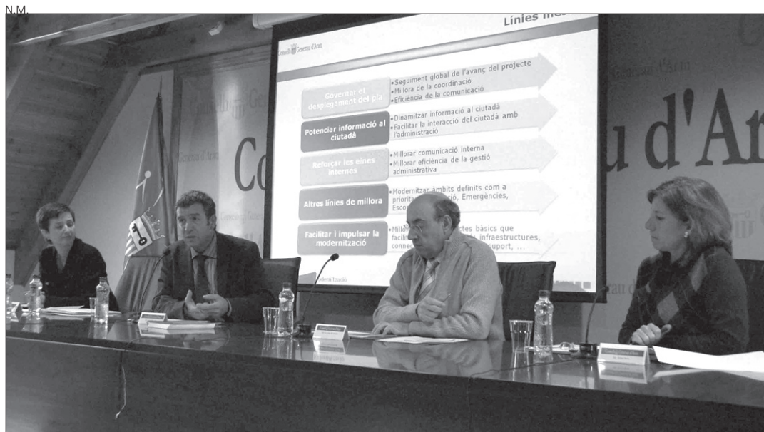
El síndic d'Aran y el conseller de Innovación y Empresa presentaron el Plan.