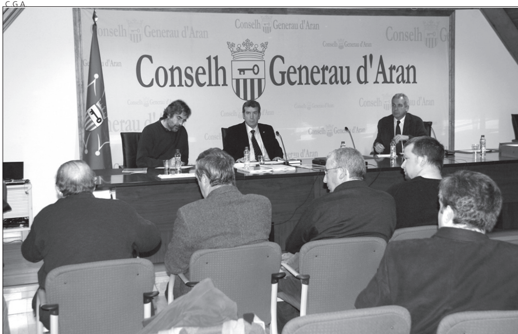
Los alcaldes de todos los municipios araneses, representados en la comisión.

El objetivo, según explicó Boya, es "abrir un debate responsable" y contar con el asesoramiento técnico que tanto desde el Conselh como desde la Generalitat se ponen a disposi-