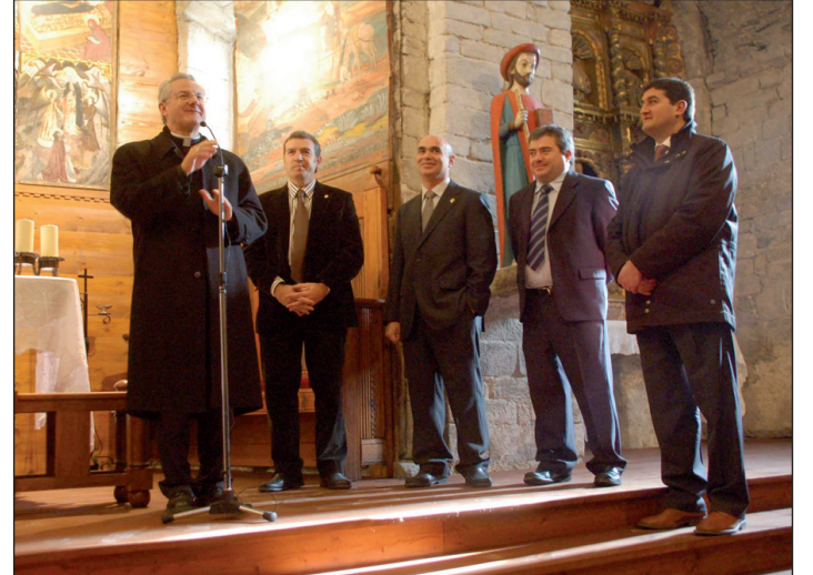
Explicación de las pinturas recuperadas en Arties.