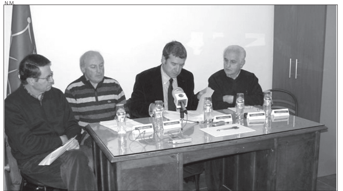
Asistentes a la sesión del Conselh de Terçon de Lairissa.

El síndic d'Aran se comprometió a la dinamización del terçon de Lairissa, con otras actuaciones como el acondicionamiento integral de la carretera que conduce de Varradòs