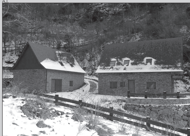
Las bordas están situadas en Canejan.