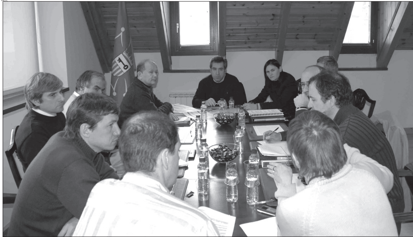
Los equipos técnicos del Conselh se reunieron con el gabinete de arquitectos y con el promotor del proyecto.

Fuentes del Conselh Generau d'Aran aseguran que se llegó a un acuerdo con los representantes del gabinete de arquitectos Isozaki y que ahora se encuentran a la espera de que el Departament de Medi Ambient de la Generalitat presente los informes pertinentes