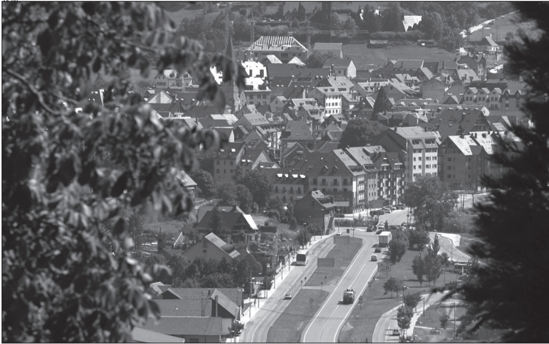
La Val d'Aran ha recibido con buenos ojos el Plan Estatal de Inversión Local.

El Fondo Estatal de Inversión Local (aprobado por el Gobierno central como medida contra la crisis y de reactivación del sector de la construcción) va a permitir que los Ayuntamientos acometan diferentes proyectos en sus municipios. En la Val d'Aran todos los Ayuntamientos, exceptuando el de Arres, han presentado sus propuestas de obras, que permitirán realizar algunos proyectos pendientes en las diferentes localidades. En este número de Aran Información recogemos las actuaciones que se van a desarrollar en Vielha e Mijaran y Naut Aran, y en el próximo repasaremos las inversiones en el resto de municipios de la Val d'Aran.