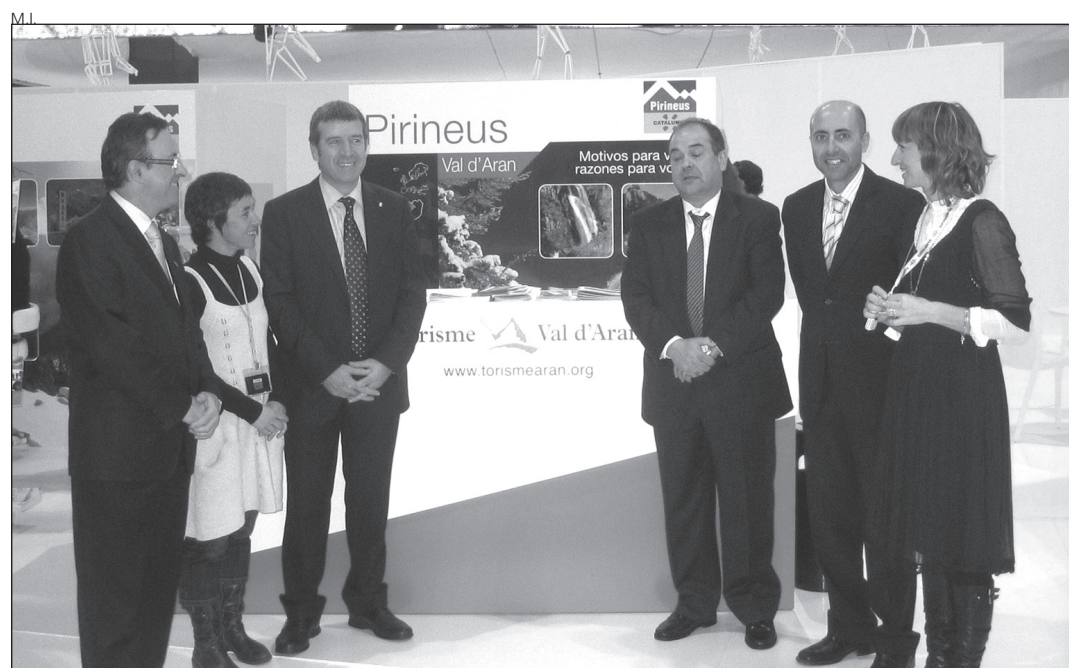
Aran presentó su oferta de BTT y senderismo en FITUR.

Camin Reiau es una propuesta de senderismo que permite recorrer 150 kilómetros por caminos que antiguamente comunicaban los 33 pueblos de