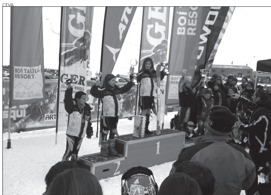
Las esquiadores de CEVA dominaron el podio alevín II en Boi Taull.