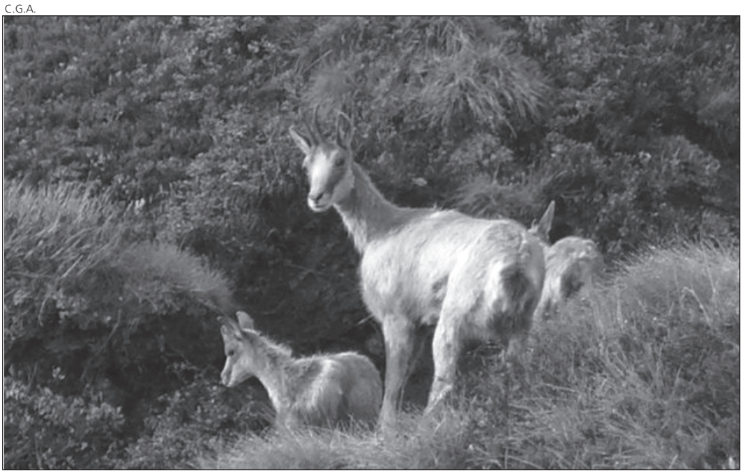
El rebeco es objeto de un plan piloto de seguimiento puesto en marcha en Aran.

Hace unos días, se colocó un collar a un ejemplar de la zona de Colomers, en la Val d'Aran, en una operación en que participaron agentes rurales del Conselh Generau junto a los agentes de la Generalitat,