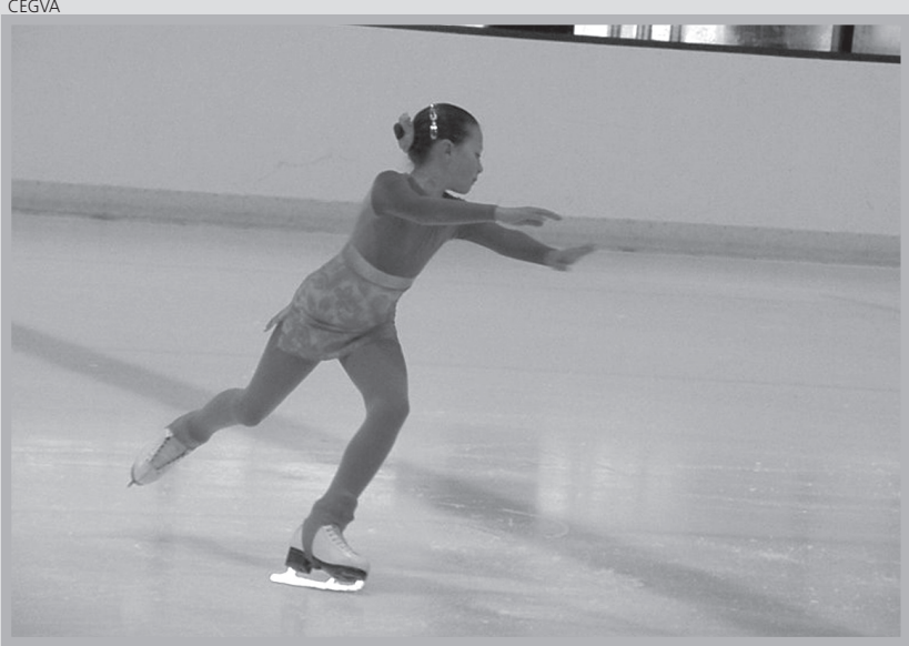
Una de las patinadoras aranesas, durante su actuación.