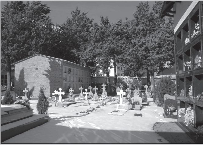
El cementerio de Vielha-Mijaran será más grande.