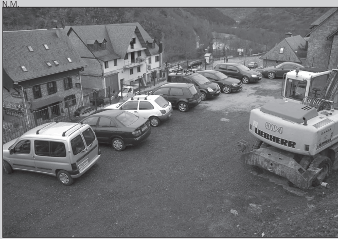
Vista del área que ha sido modificada.