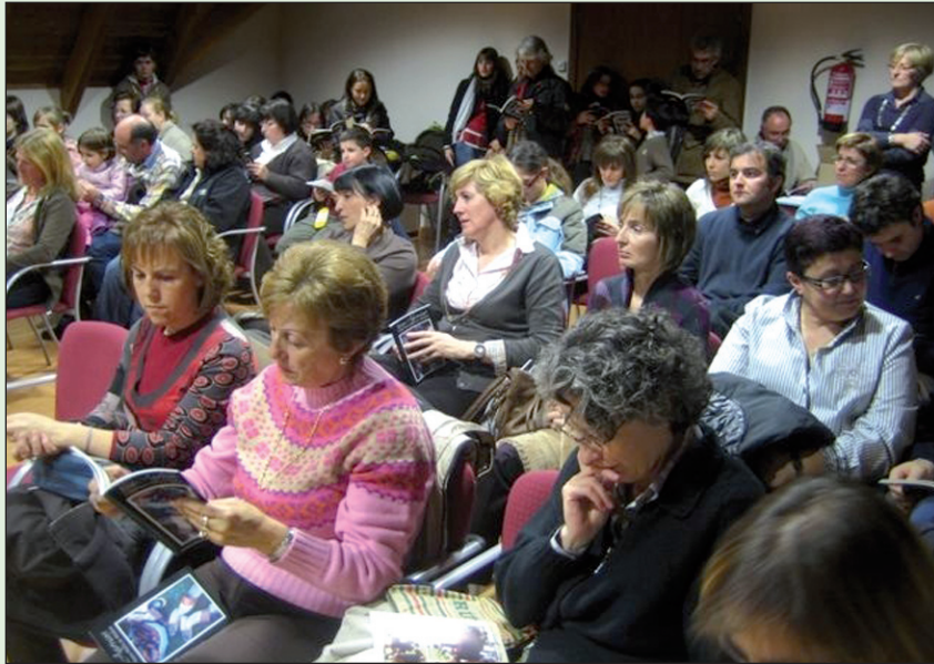
Al acto asistieron antiguos y actuales integrantes de la Còlha.