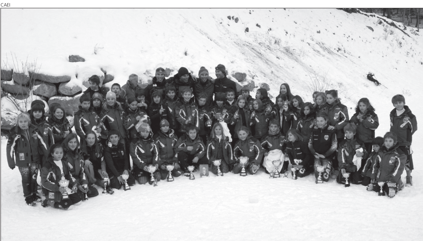
Los alevines del CAEI han conseguido buenos resultados en el Floquet de Neu y en el Ger.