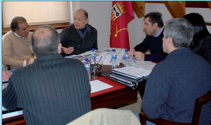
Reunión entre arquitectos, promotores y técnicos del Conselh.