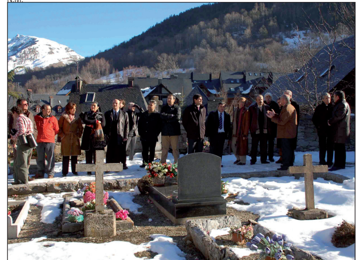
Visita al cementerio anexo a la iglesia.