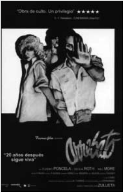
Cartel de ‘Arrebato’.