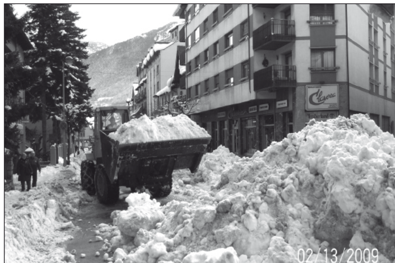
Las máquinas se han empleado a fondo en Vielha.

Para que esta limpieza se pudiera realizar en todas las poblaciones, en las mejores condiciones y a la mayor brevedad posible, el Ayuntamiento de Vielha e Mijaran ha contratado maquinaria y