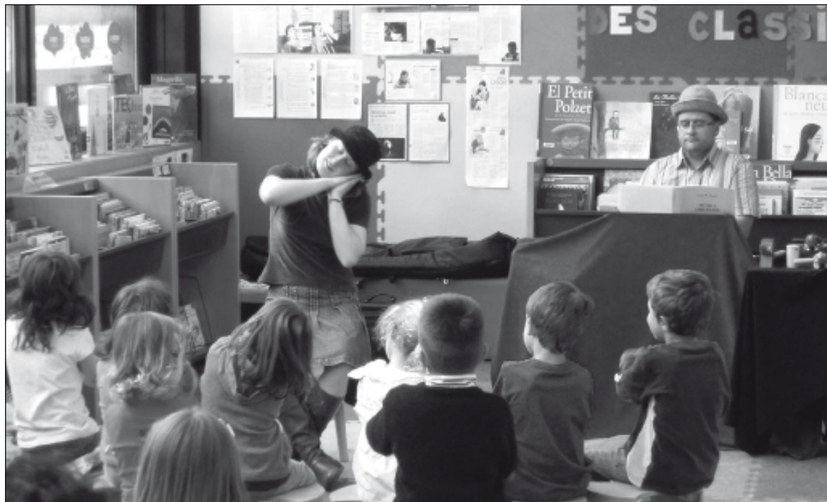
La Bibliotèca ha acogido un gran número de actividades durante 2008.

En cuanto al número de visitantes, y según las cifras contabilizadas por los responsables de la bibliotèca, durante el año 2008 pasaron por las instalaciones un total de 46.588 personas. De esa cifra, un total de 6.939 de las cuales hicieron uso del servicio Internet de que dispone