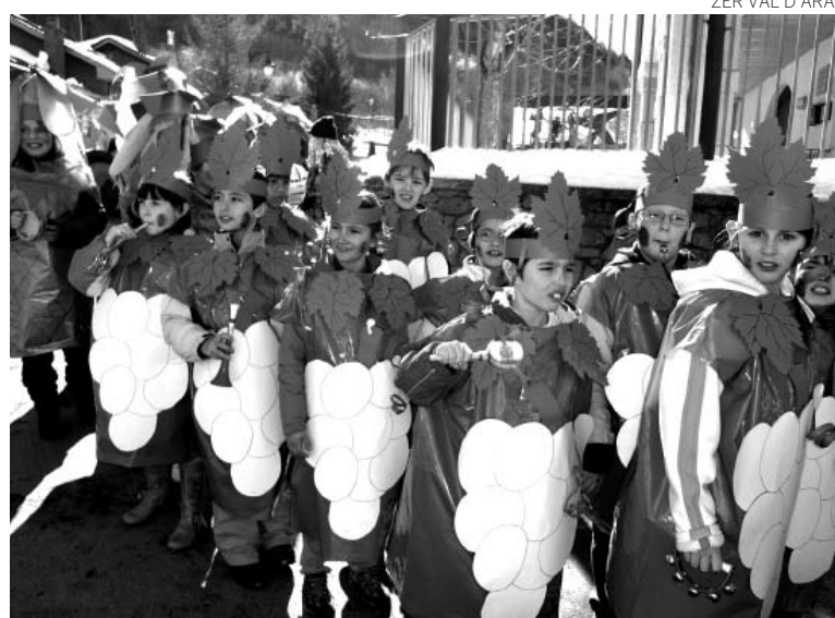
ZER VAL D'ARAN