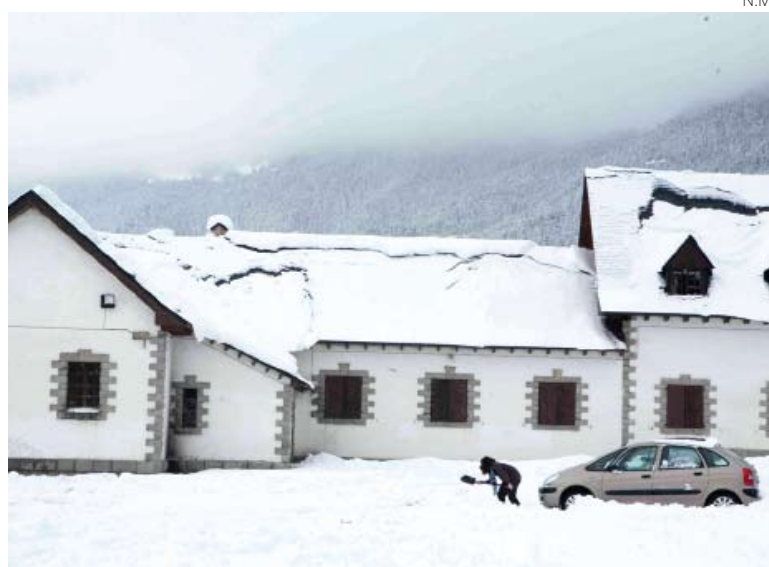
Singular imagen nevada de la capital aranesa.