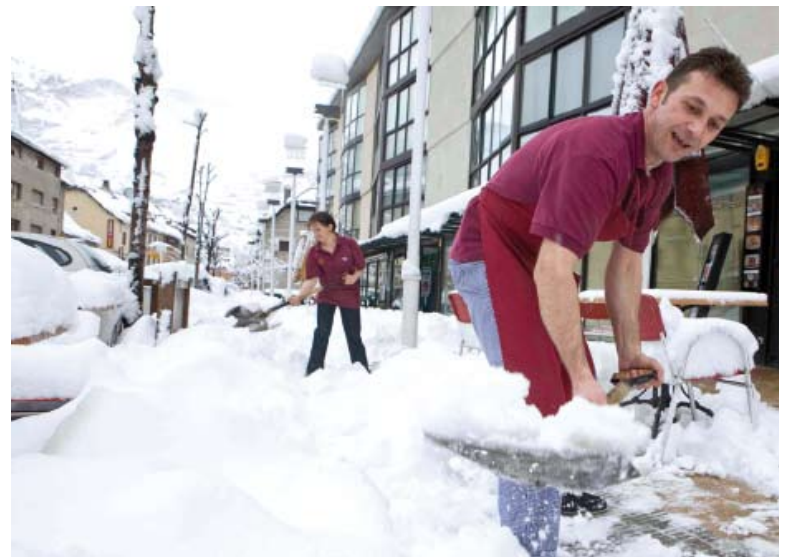
Las máquinas quitanieves se han empleado a fondo.