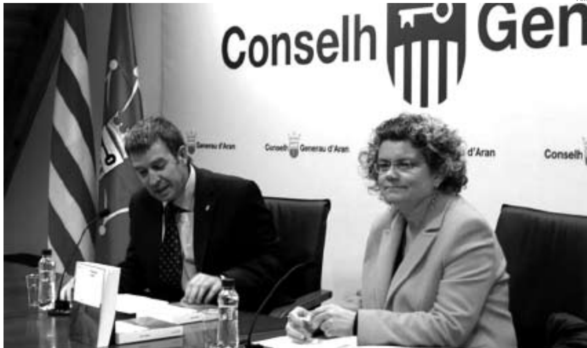
Marina Geli visitó las instalaciones del Espitau Val d'Aran.

Aranés dera Salut (SAS) compartirá con el sistema catalán los historiales clínicos por medio de un programa informático que comenzará a implantar la receta electrónica a medio plazo, según se desprendió de la reunión con Marina Geli.