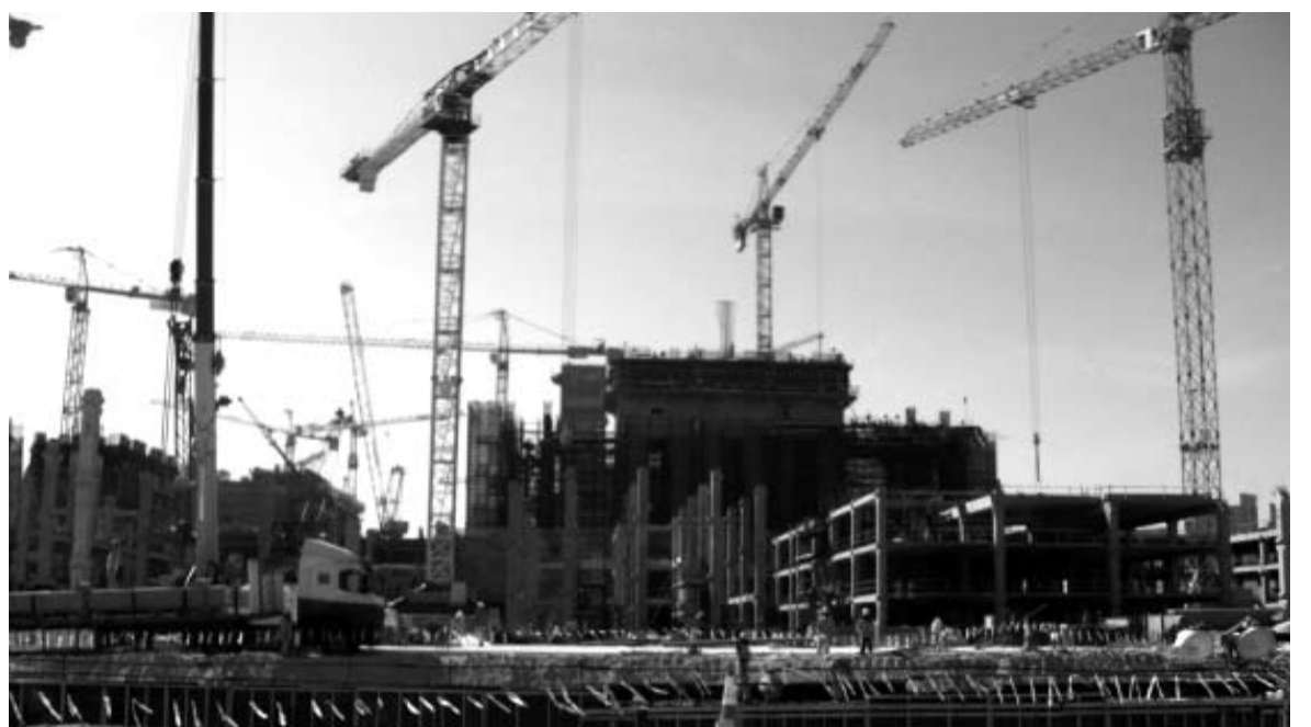
Aran Arabia está ya trabajando en un edificio para el Ayuntamiento de Jeddah.

El primer proyecto que desarrollará la sociedad en el país árabe es un trabajo de construcción para el Ayuntamiento de Jeddah, la segunda ciudad más importante del país. A partir de ahí, Aran Arabia seguirá trabajando conjuntamente en distintos proyectos que salgan, tanto en Arabia Saudí como por todo el Golfo Pérsico, ya que la empresa árabe con la que se han asociado tiene abierto mercado en distintos países.