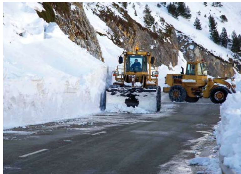
El puerto de la Boinagua se cerró al tráfico.