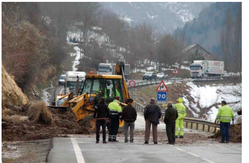
Último desprendimiento en la N-230.