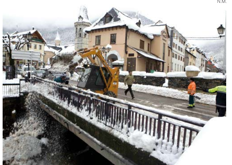
La nieve ha afectado a la vida diaria de los araneses.