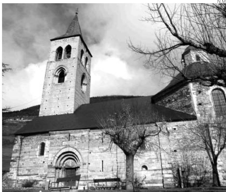
El campanario de Vilac podrá ser visitado.