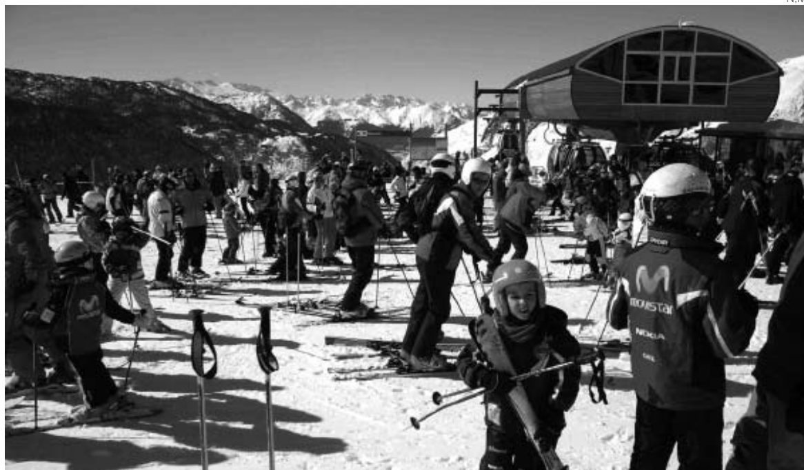
La nieve es uno de los sectores estratégicos de la Val d'Aran.

Ese llamado Libro Blanco del Turismo de Nieve tendría que incorporar la hoja de ruta para la promoción de los destinos de esquí, el posicionamiento de los mercados, el