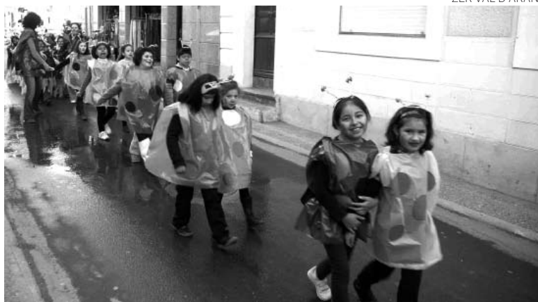
ZER VAL D'ARAN