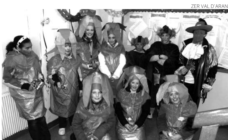
ZER VAL D'ARAN