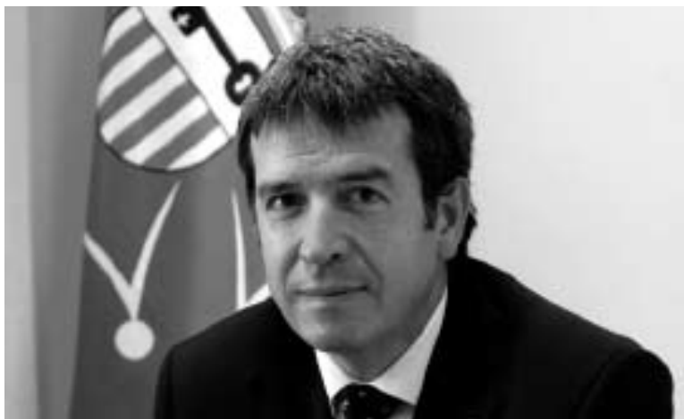
El síndic d'Aran aboga por crear un libro blanco.