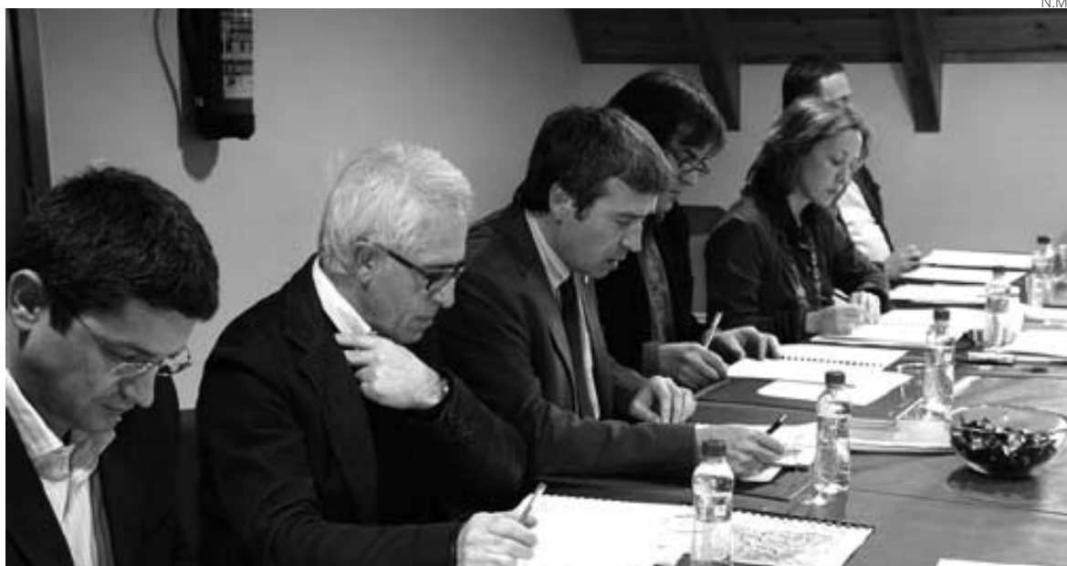
La Comisión Territorial de Urbanismo se reunió a mediados de febrero en Vielha.

La Comisión Territorial de Urbanismo da luz verde