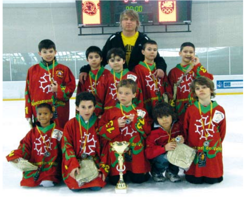
El sub-9 logró un destacado sexto lugar en Jaca.