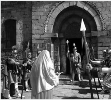
Semana Santa en Bossòst.

El Cine Fòrum de Vielha continúa los jueves de abril en el cine de Vielha. El 2 de abril, la película ‘Gattaca’, dirigida por Andrew Niccol, precedida del corto ‘El ataque de los robots nebulosa’, de Chema García Ibarra. El 9 de abril, ‘En el hoyo’ documental de Juan Carlos Rufo, con el corto ‘Runner. A bonus points story’, de Gavi Martín. El 23 de abril, ‘Tarza´n de los monos’, de W.S. Van Dyke, y el corto ‘Rutina’, de Suda Sánchez. Y, el 30 de abril, ‘Conversaciones con mi jardinero’, de Jean Becker, y el corto ‘Por que hay cosas que nunca se olvidan’, de Lucas Figueroa.