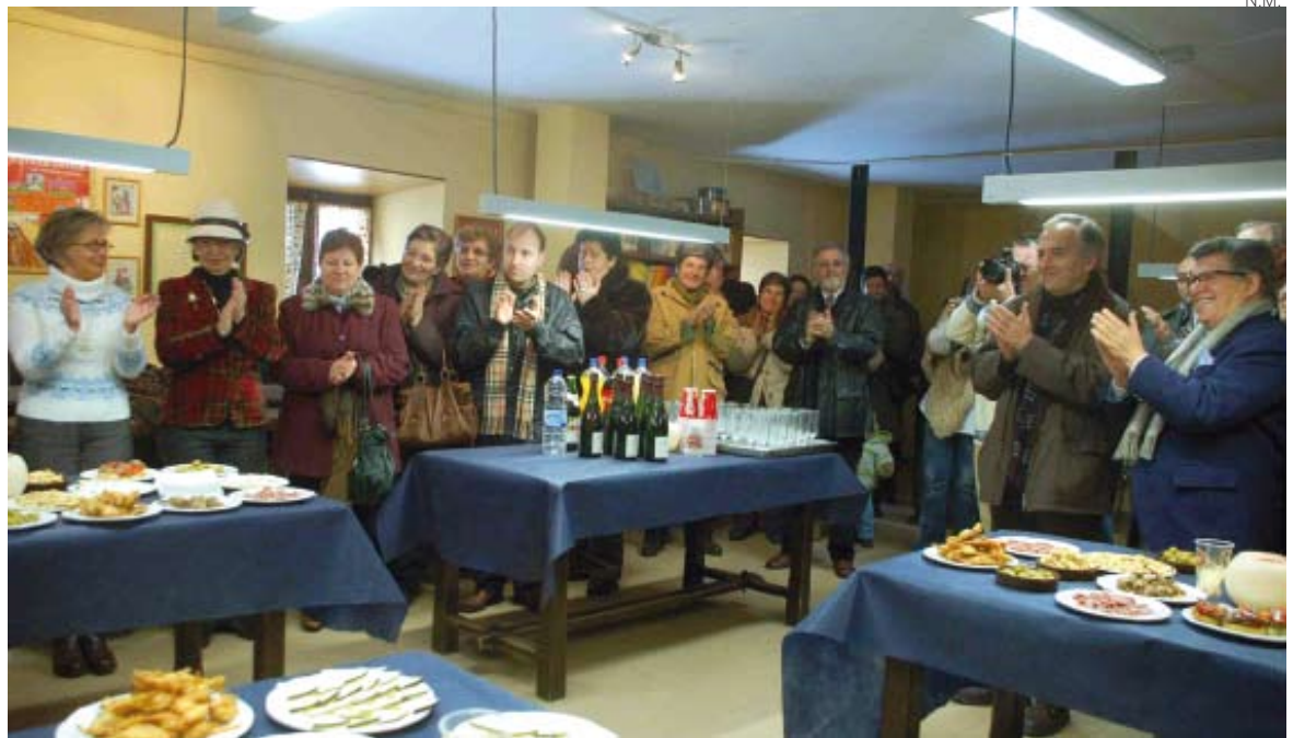
Unas cincuenta personas asistieron a la inauguración de la nueva biblioteca.

La Biblioteca de Escunhau estará abierta los viernes de seis a ocho de la tarde, horas en que el centro social alberga las actividades destinadas a los habitantes del núcleo. Además de la cesión de los libros de Benedito, la Diputación de Lleida ha colaborado con el proyecto, aportando 4.500 euros que se han destinado a la adecuación del espacio y a la compra de material, entre ellos el 5% de los libros restantes. Así mismo, Benedito quiso agradecer al resto de instituciones, en especial a las aranesas el soporte y la ayuda que le han brindado.