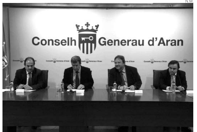
Presentación de las nuevas líneas desde la Val d'Aran.