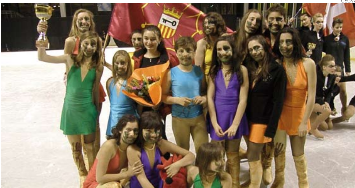
Equipo del Aran Crystals Team, que compitió en el Gran Prix de Niza.

Los jóvenes patinadores araneses marcan un nuevo hito