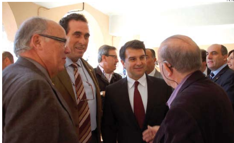
Joan Laporta firmó en el libro de oro del Ajuntament de Vielha.

tituciones aranesas la buena acogida que habían tenido en la Val d'Aran. Reconoció también que el FC Barcelona es consciente de la singularidad de Aran como territorio y que respeta la historia, la cultura y la identidad propia aranesas. El máximo responsable de la entidad azulgrana admitió que haber celebrado su junta en Aran permite la aproximación del territorio al club.