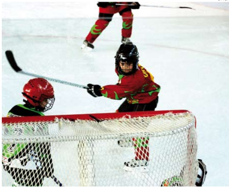
El hockey sobre hielo cuenta con una gran cantera en Aran.

El técnico ucraniano se lamentaba de "no poder entrenar más, ya que estos niños tienen cualidades suficientes