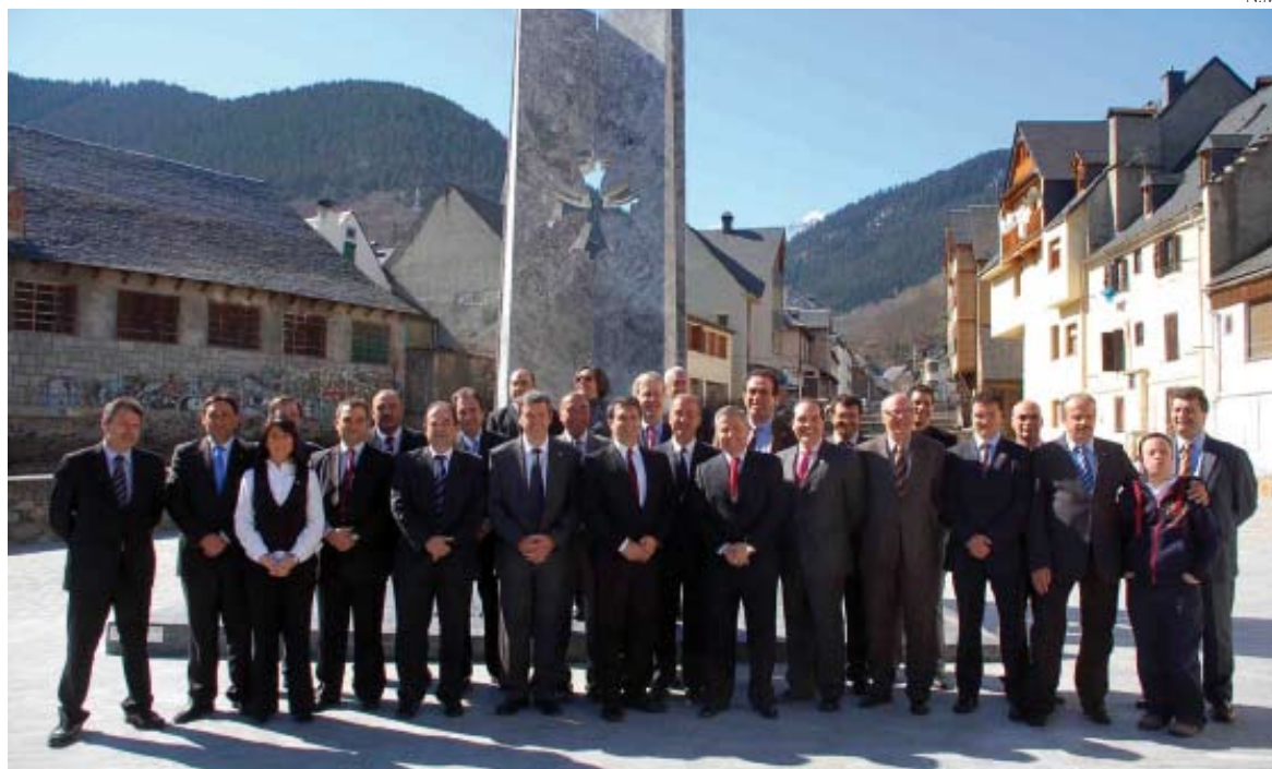
La directiva del FC Barcelona se reunió en la sede del Conselh Generau d'Aran.

tituciones aranesas la buena acogida que habían tenido en la Val d'Aran. Reconoció también que el FC Barcelona es consciente de la singularidad de Aran como territorio y que respeta la historia, la cultura y la identidad propia aranesas. El máximo responsable de la entidad azulgrana admitió que haber celebrado su junta en Aran permite la aproximación del territorio al club.