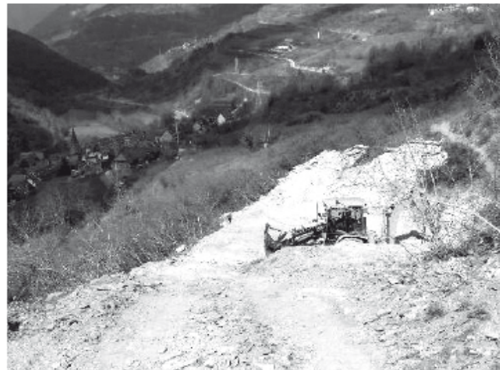
Aubèrt tendrá un nuevo depósito de agua.