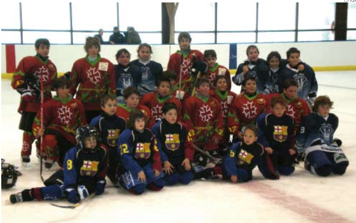
Integrantes del equipo sub-11 del CH Gèu d'Aran, que compitieron en Vielha.

para poder estar a la altura de los mejores clubes de España".