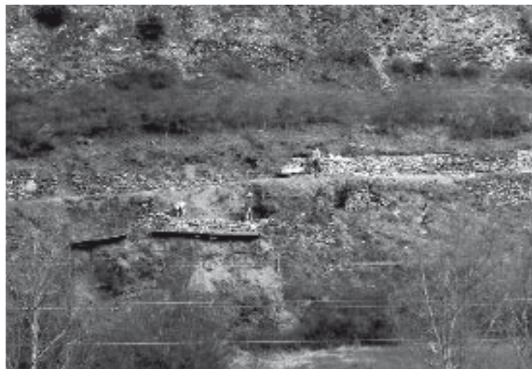
Obras de rehabilitación del camino rural.

El presupuesto de la obra es de 40.000 euros, y otra de las actuaciones previstas es la rehabilitación de un tramo del camino en la Boca Norte del túnel, deteriorado a raíz de las obras del nuevo túnel de Vielha.