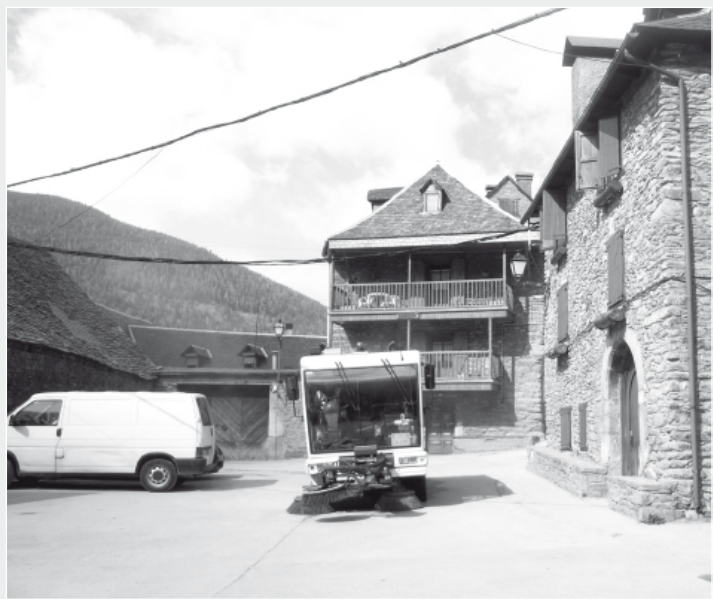
Labores de limpieza de las calles del municipio.

La finalización de estos trabajos está prevista para el mes de abril y la financiación corre a cargo de REPSOL Gas.