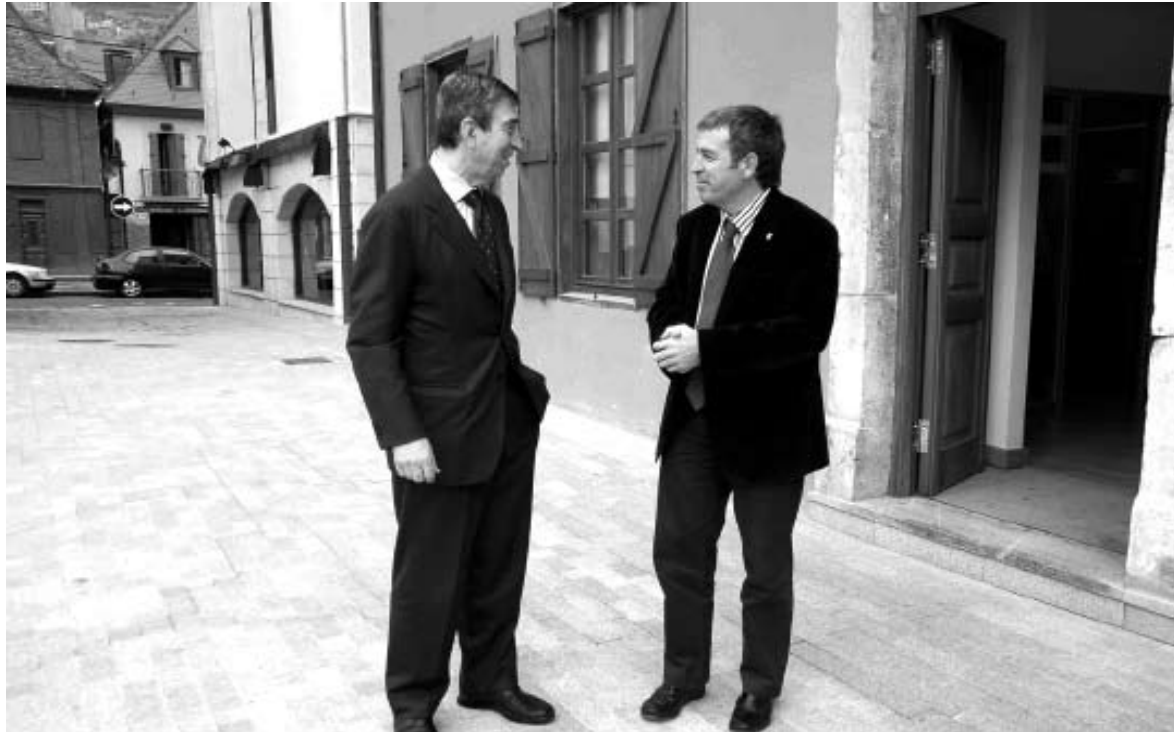
El presidente de Andorra realizó una visita institucional a la Val d'Aran.

El presidente andorrano declaró que es necesario cuidar la economía con el fin de que todo el territorio pueda aprovecharse de la industria