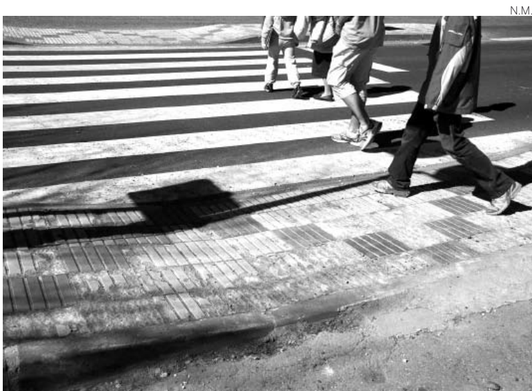
Las baldosas se han roto por las bajas temperaturas.