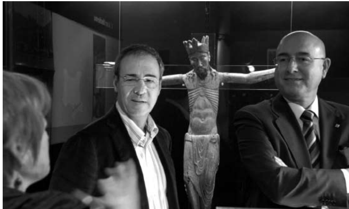
El conseller Joan Manuel Tresserras visitó el Musèu de Vielha.

Asimismo, el conseller de Cultura y Mitjans de Comunicació de la Generalitat se comprometió a "asegurar una mayor presencia del aranés en los medios de comunicación con la finalidad de garantizar su uso en el marco social y cultural". En este sentido, Tresserras afirmó que esa presencia vendrá garantizada gracias al inminente cambio tecnológico, principalmente con la implantación de la TDT en el territorio.