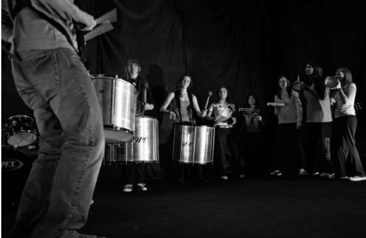
El festival suele ser uno de los actos que despierta más interés entre los araneses.

El miércoles, 15 de abril, se proyectará un documental