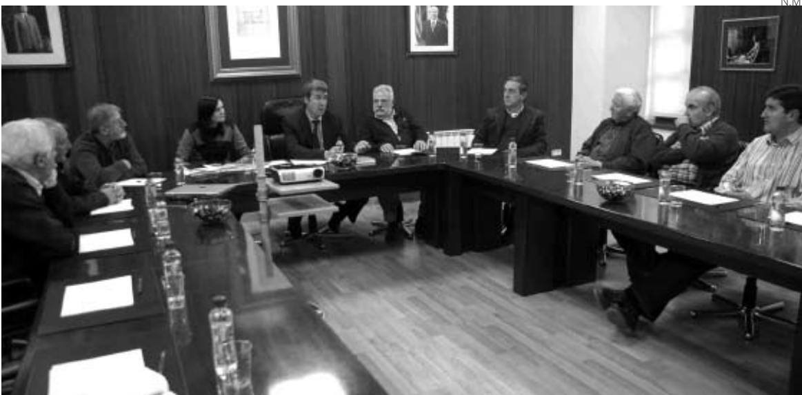
Imagen de la reunión de la Comisión Conselh-Ayuntamientos de la Val d'Aran.

Reunión de la Comisión Conselh-Ayuntamientos