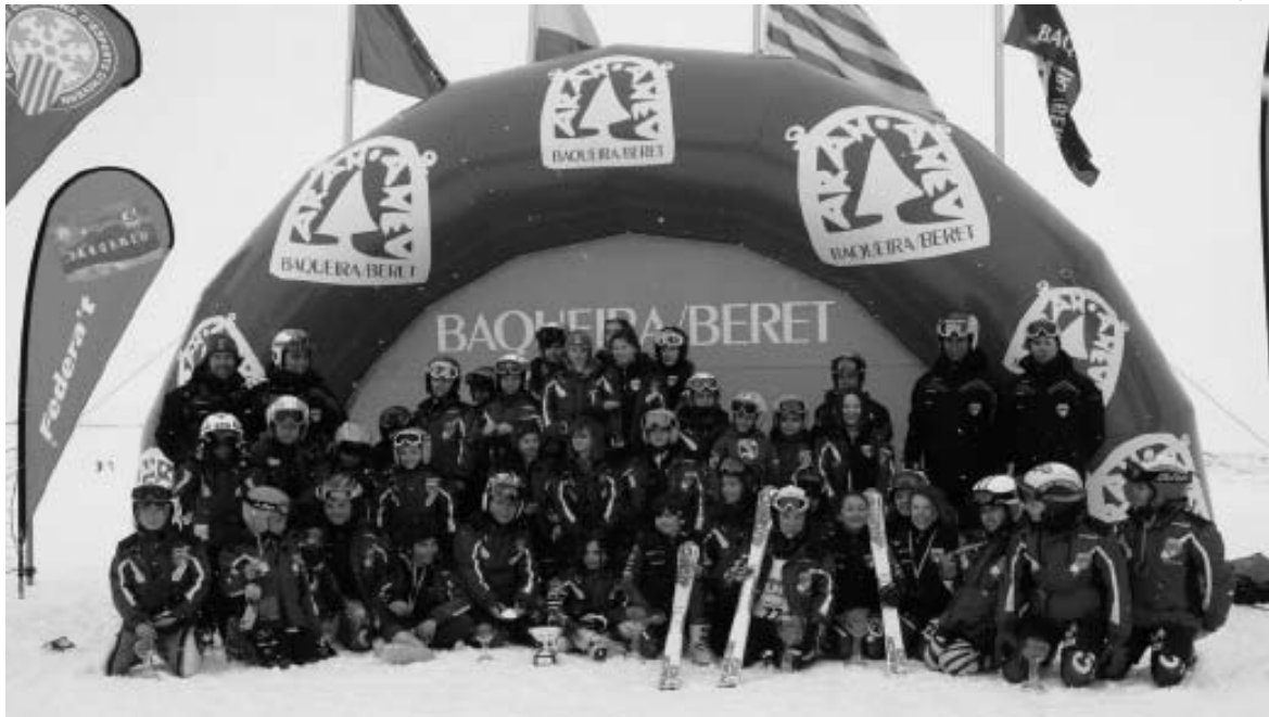
Foto de familia del CAEI tras disputarse el I Trofeo Carcamal 'Audi Quatro' en Baqueira.

El CAEI y el CEVA dominaron el trofeo por clubes del I Torneo Carcamal Audi Quatro disputado en Baqueira Beret. La carrera, reservada a corredores de categoría alevín, reunió