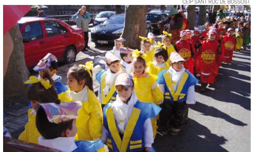
CEIP SANT ROC DE BOSSÒST