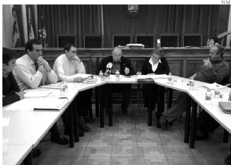
El último pleno de Vielha sirvió para cambiar de alcalde.