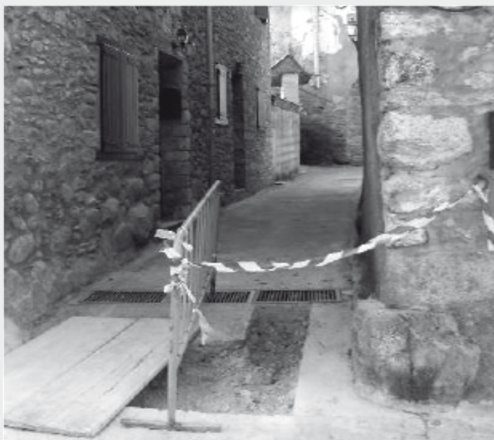
Tareas de gasificación en Betrán.