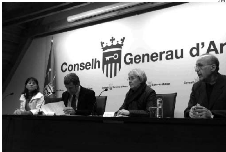
Firma del convenio entre el Conselh y Cáritas d'Aran.