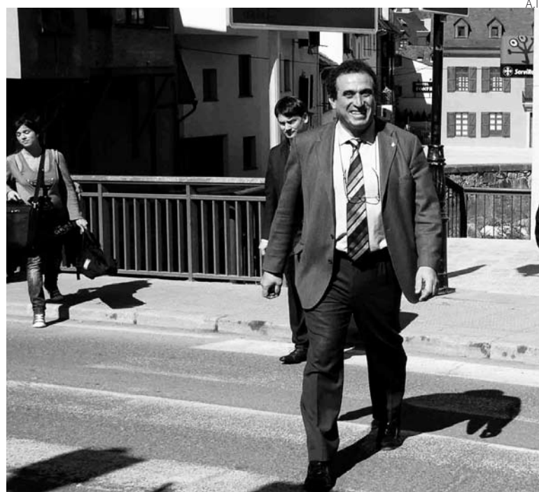
Pau Perdices, nuevo alcalde de Vielha e Mijaran.