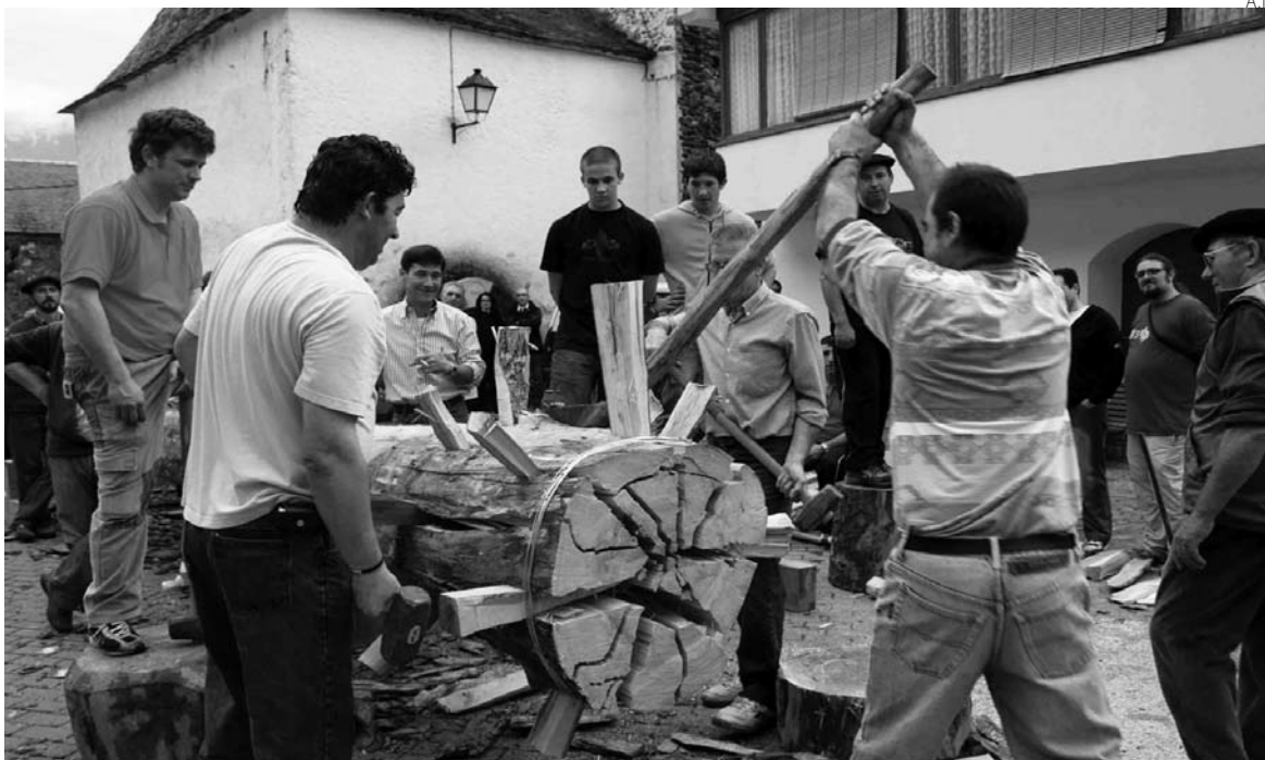
Los vecinos de Les viven con intensidad la 'shasclada deth haro', una fiesta muy especial.

El próximo sábado, 9 de mayo, los vecinos de Les se ayudarán de grandes barras de hierro para trasladar el tronco hasta la plaça deth Haro. Es un esfuerzo común, una unión de fuerzas en las que participan todos los vecinos, hombres y mujeres. Estas últimas se han ido sumando en los últimos años a la fiesta, en la