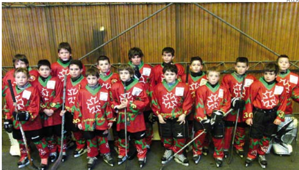
...a las más serias tras la actuación en el Campeonato de España sub-11.