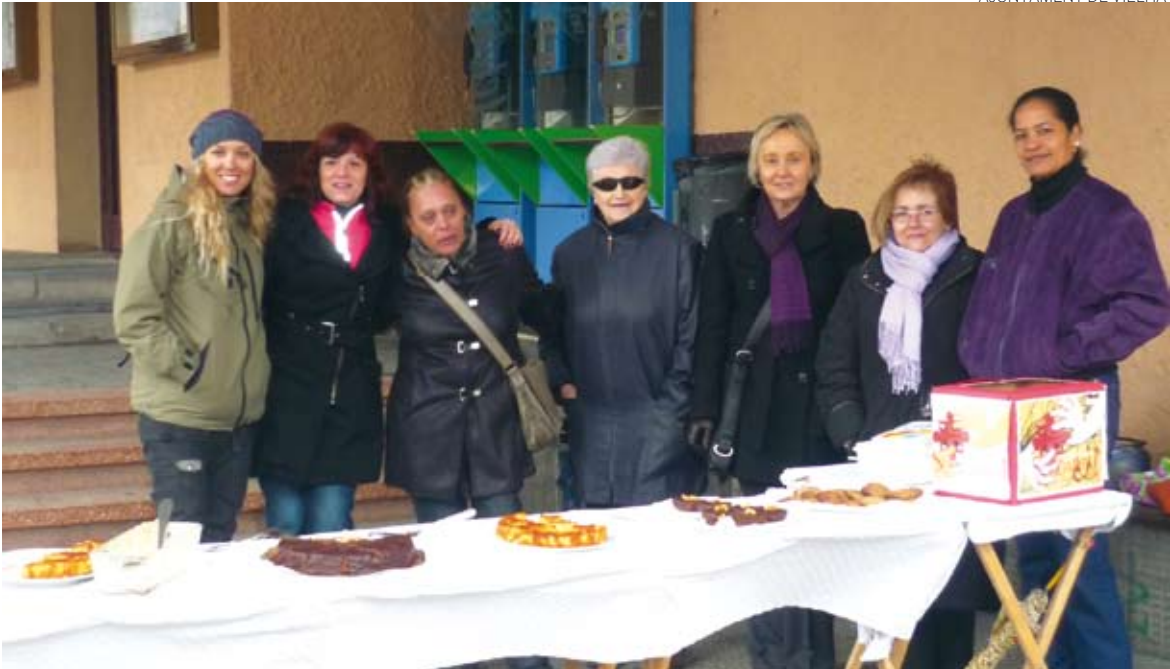
Una de las tómbolas benéficas organizadas durante la Setmana dera Solidaritat de Vielha.