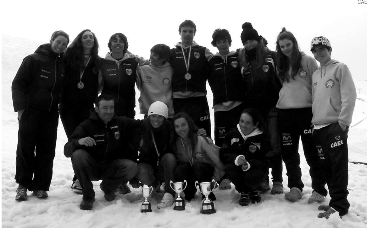
Foto de familia de los infantiles del CAEI que participaron en el Campeonato de España.

Los esquiadores araneses han tenido una destacada actuación en este Campeonato de España Infantil que ha