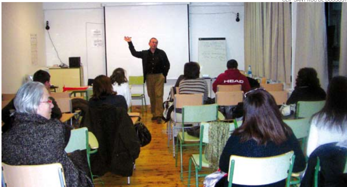
Asistentes a la charla organizada por el AMPA del IES d'Aran de Vielha.

La Asociación de Madres y Padres del IES d'Aran de Vielha organizó una charla para padres y alumnos sobre el programa 'Viure i conviure', un programa de ayuda mutua que supone un inter-