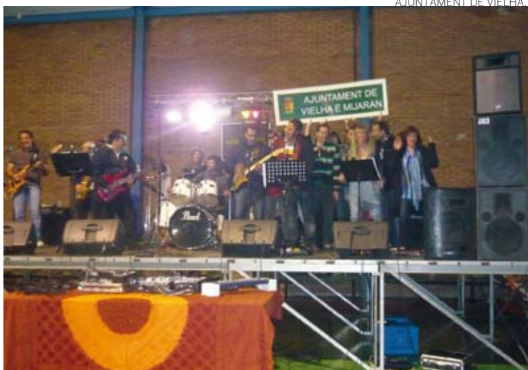
Los jóvenes también se sumaron a los actos.