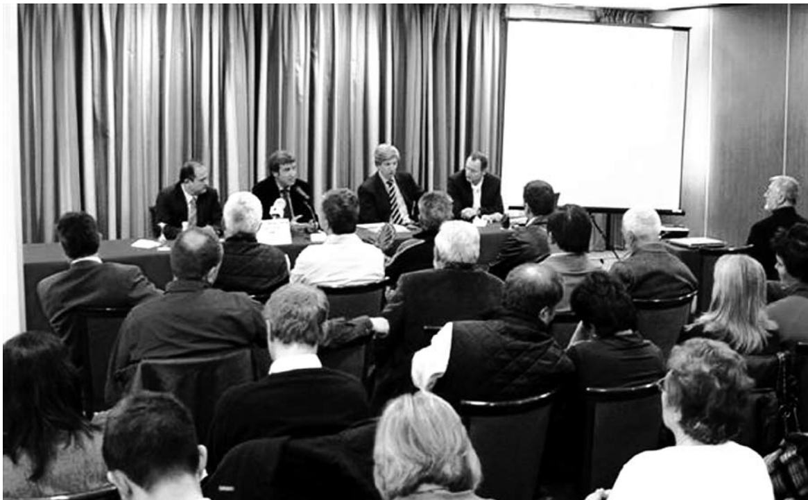
El sector turístico aranés asistió a la presentación de las líneas generales del nuevo plan.

Una numerosa representación del sector turístico aranés asistió a la presentación, celebrada en el Hotel Tuca.