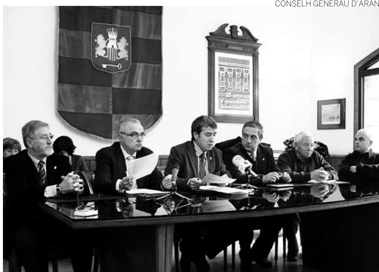
La sesión del conselh de Quate Lòcs tuvo lugar en Les.