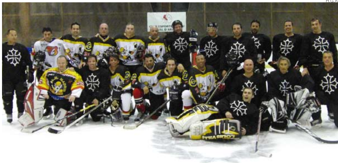
Los veteranos araneses se impusieron al Madrid en el amistoso celebrado en Vielha.