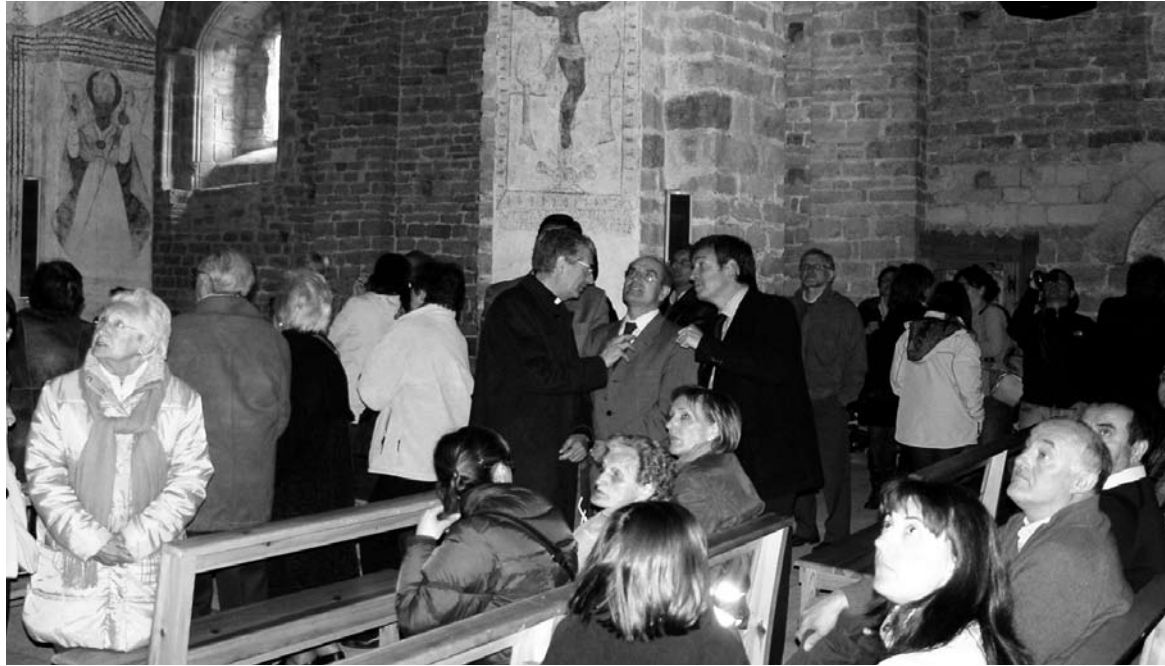
Las autoridades, interesadas en la moderna forma con la que Tredòs ha recuperado sus pinturas.

La reproducción de las imágenes, que ya pudieron ser admiradas por los visitantes durante la pasada Semana Santa, ha sido posible gracias al acuerdo entre el Departamento de Política Territo-