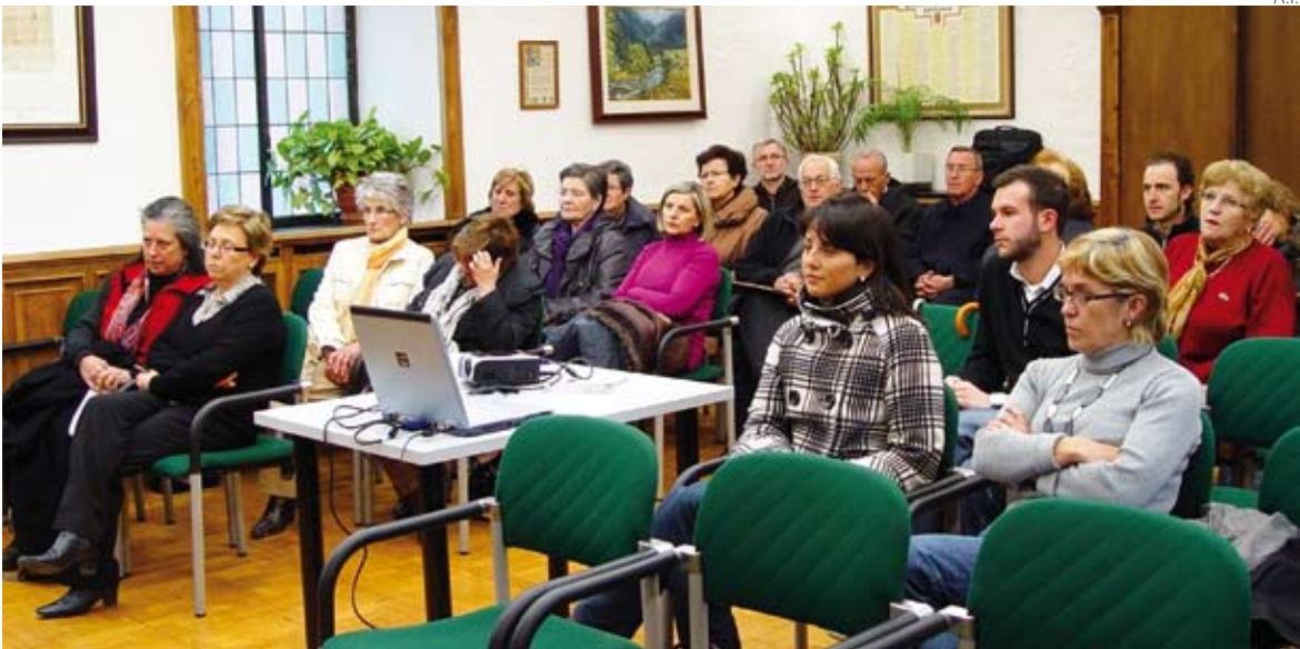
A.I. Asistentes a una de las charlas sobre Cáritas celebrada en el Ajuntament de Vielha e Mijaran.

edición de la Setmana dera Solidaritat que, organizada por el Ajuntament de Vielha e Mijaran, se ha celebrado en el municipio a beneficio de Cáritas Val d'Aran. Esta entidad recibirá el dinero recaudado en los distintos actos programados.