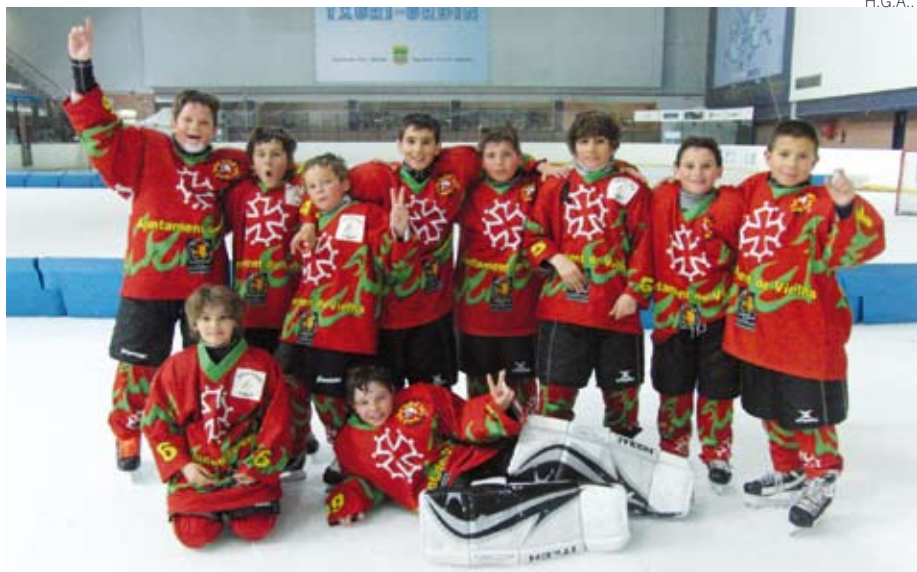
De las caras sonrientes al final del torneo de San Sebastián...