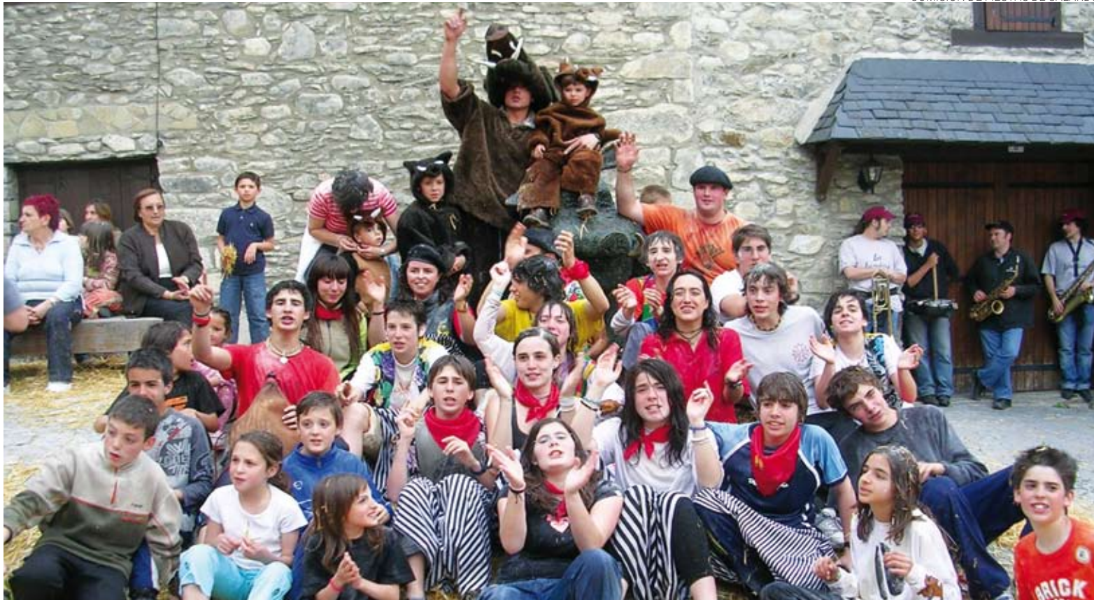
Foto de familia de los jóvenes que integran la comisión que se encarga de preparar el programa de la fiesta de Salardú.

Aran abrirán el turno de las actuaciones vespertinas, con sus bailes a las 18 h. Será el preámbulo para el espectáculo principal de las fiestas: la actuación del mago Yunke en el polideportivo de Salardú.