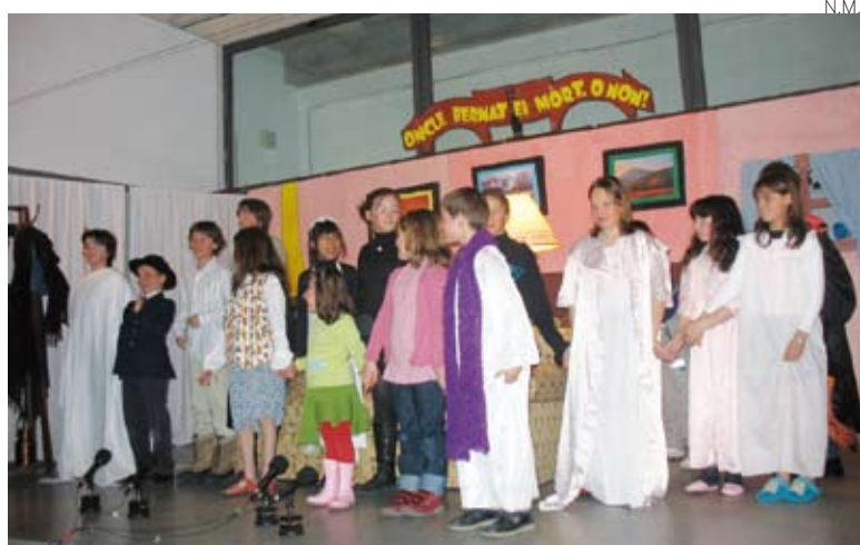
La obra de teatro resultó todo un éxito.