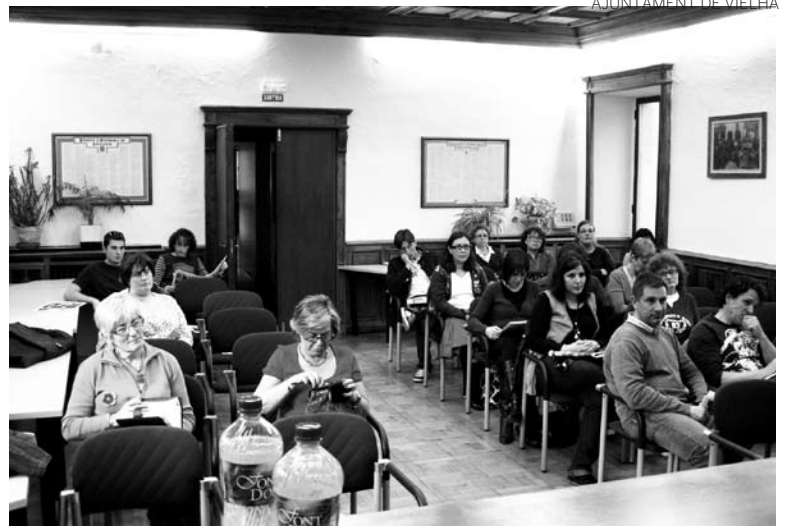
Asistentes a la charla sobre el Plan Bolonia en Vielha.