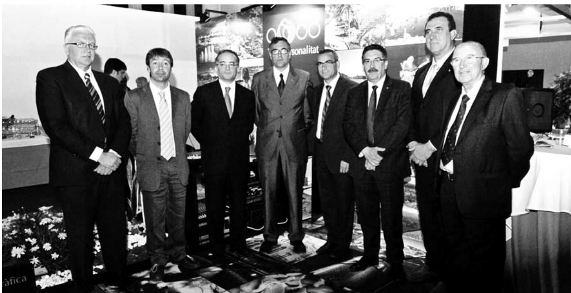
La presentación del consorcio 'Viles amb personalitat' tuvo lugar en el SITC de Barcelona.

Consorcio junto con Puigcerdà, Cadaqués y Sitges