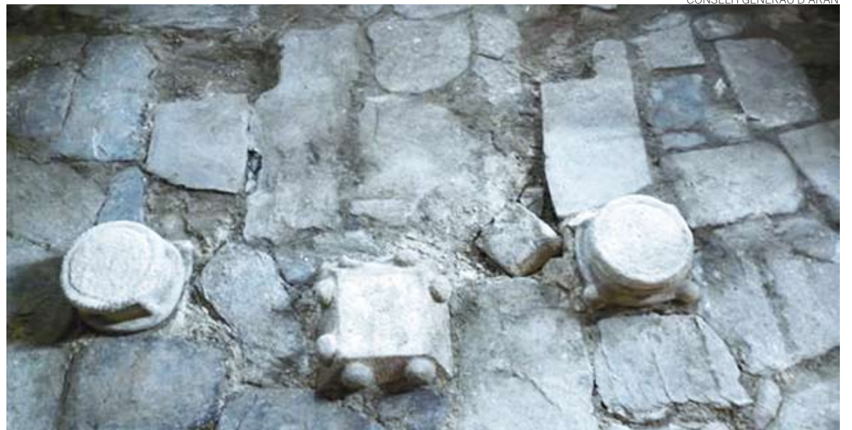
Arriba, las reliquias encontradas. Debajo, los restos del basamento que ha salido a la luz.