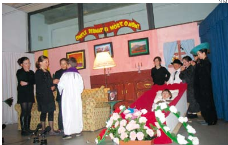
Un momento de la representación teatral escolar.

A.I. Joan Laporta, con sus entrevistadores de Radio Garona.