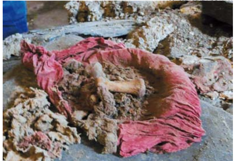
CONSELH GENERAU D'ARAN

les, por el Conselh Generau d'Aran, Ajuntament de Naut Aran, al que pertenece Salardú, y el Obispado de L'Urgell. A.I.