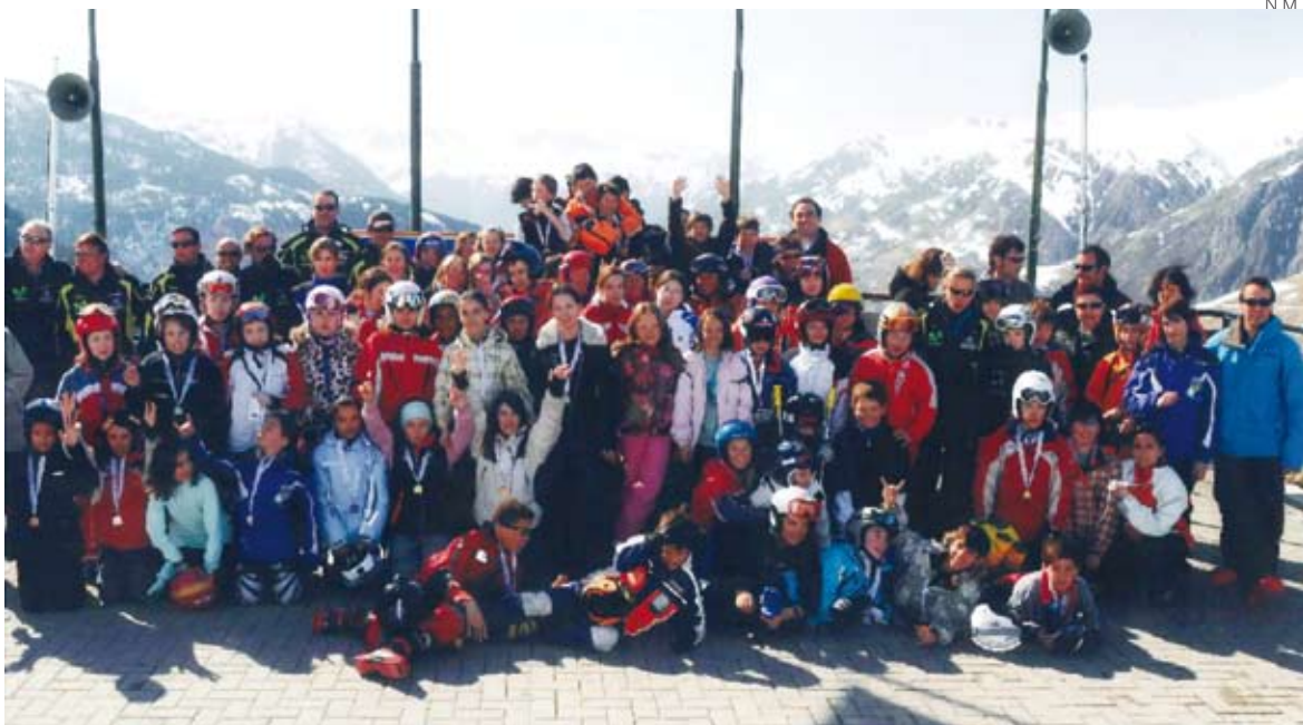
Grupo de alumnos participantes en la campaña de esquí escolar del CEIP Garona.