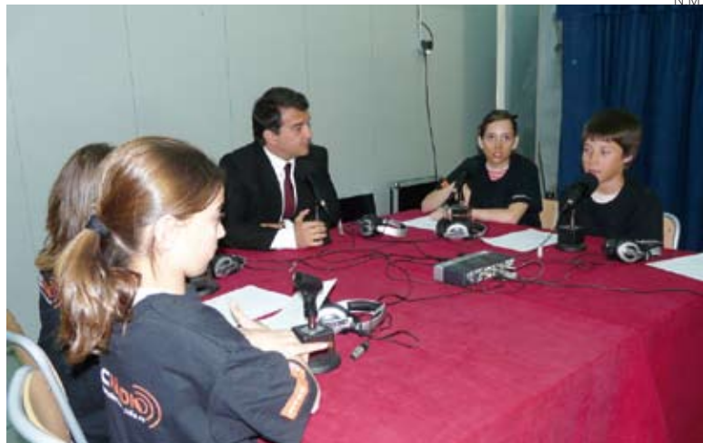
A.I. Joan Laporta, con sus entrevistadores de Radio Garona.