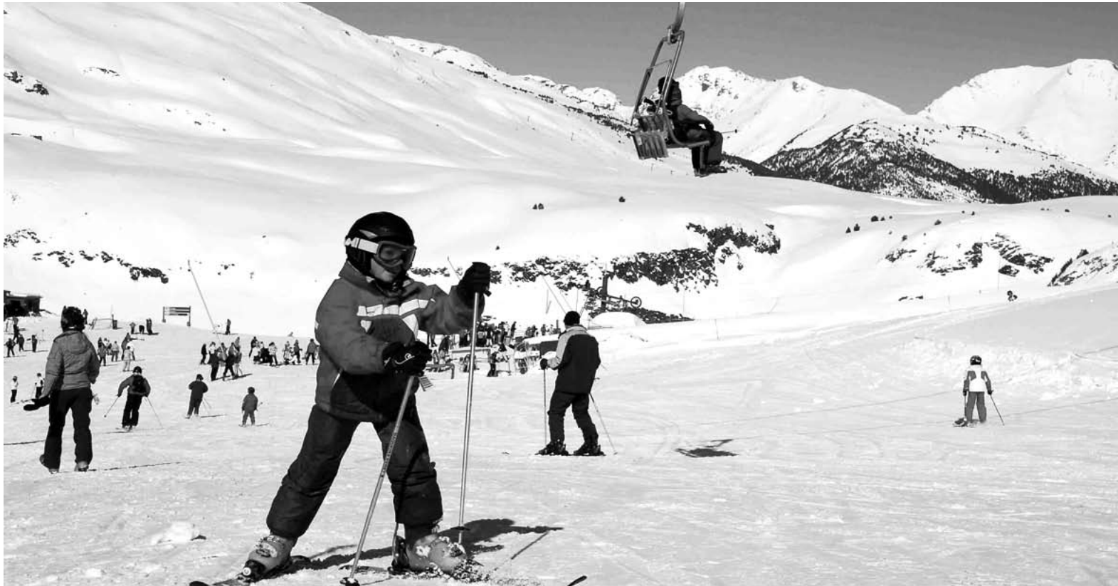
Baqueira Beret ha superado los 800.000 esquiadores esta temporada, a pesar de la crisis.

Las buenas condiciones de las pistas de Baqueira, gracias a las continuas precipitaciones de nieve tras dos malos años, han hecho que pese a la crisis muchos aficionados al deporte blanco hayan esquiado con asiduidad en la estación aranesa, aunque esa afluencia no haya tenido demasiada incidencia en otros sectores económicos del valle.