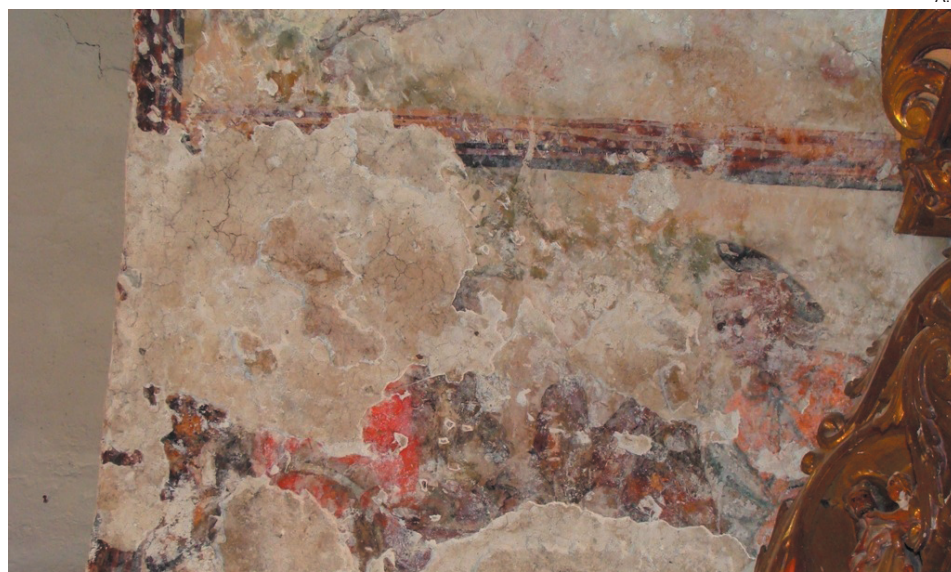
Fragmento de las pinturas que se han encontrado en la iglesia Santa Eulària d'Unha.

El Conselh Generau d'Aran ha destinado 14.000 euros a esta actuación y en estos momentos desarro-