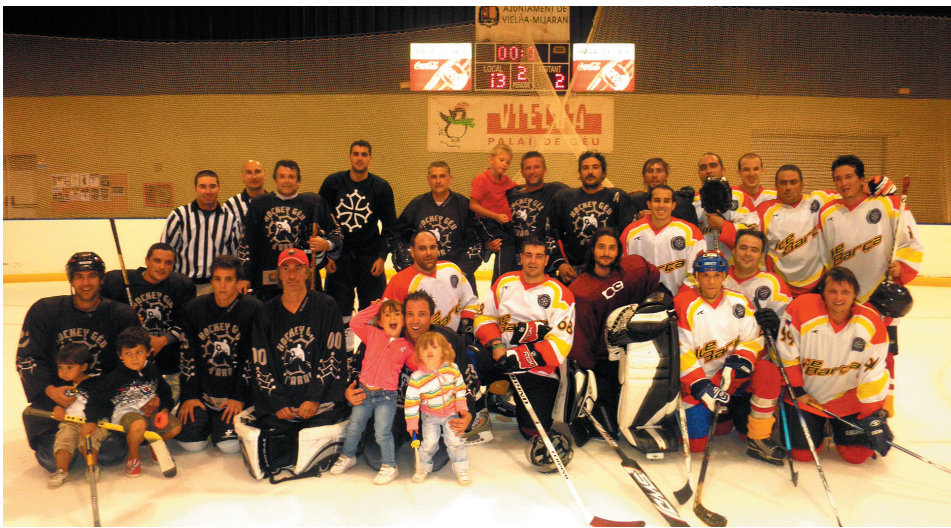
El Gèu d'Aran de veteranos se enfrentó al Ice Barça en un amistoso.