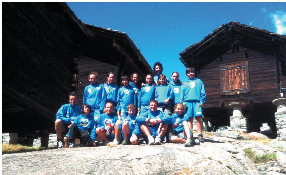
El grupo de esquiadores infantiles trabajó en el glaciar suizo de Saas Fee.