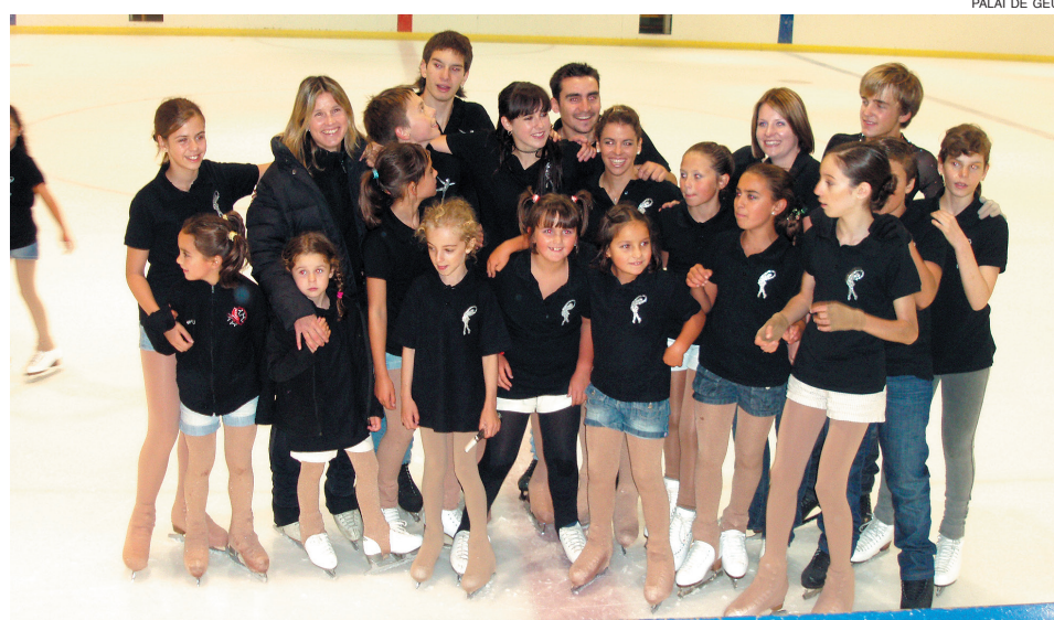
Grupo de los patinadores araneses que han participado en el 'stage' del Palai de Gèu.

El Palai de Gèu de Vielha permanecerá cerrado desde el lunes 6 al domingo 19 de septiembre, inclusive.