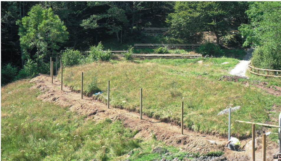
En el recinto ya se aprecian las parcelas que acogerán los diferentes animales.