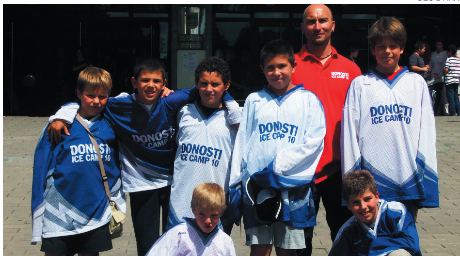
Siete araneses participaron en el stage de hockey sobre hielo celebrado en San Sebastián.