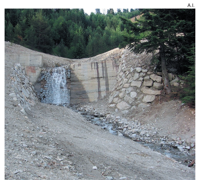
Imagen del barranco de Loseron.

Asimismo, en el año 2011, la ACA actuará en el río Garona, en concreto en el tramo comprendido entre el puente de Vielha y el puen-