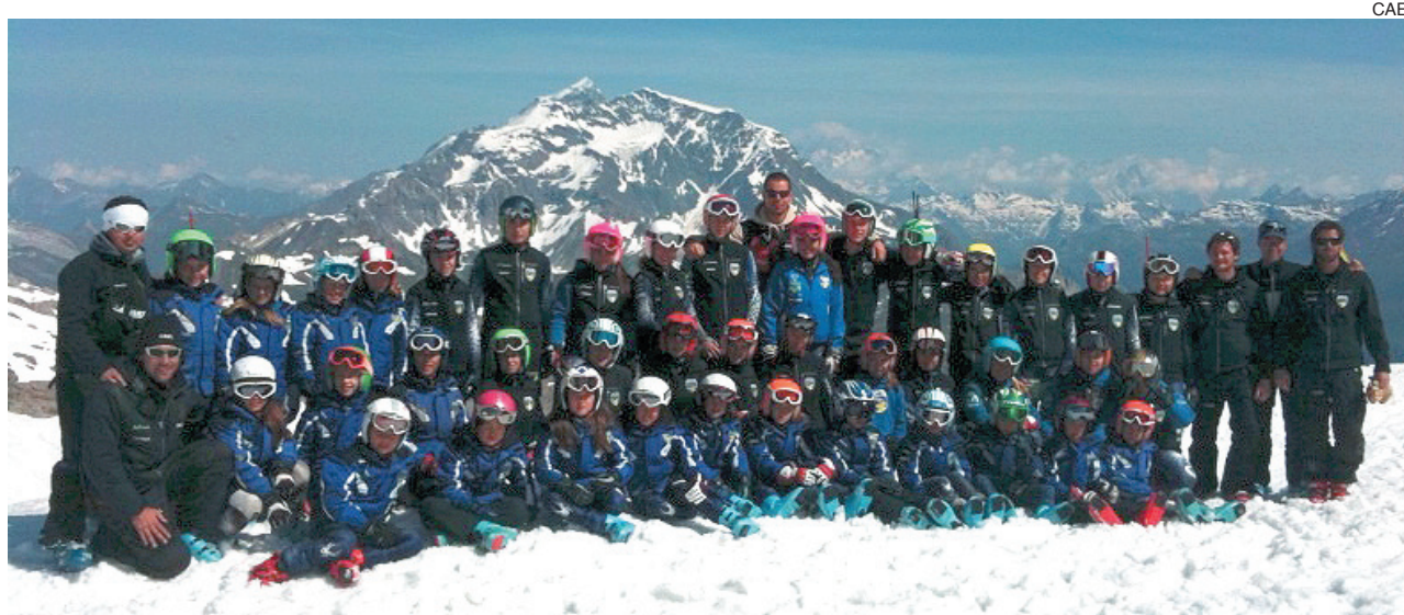
Tignes fue escenario del trabajo realizado por los grupos de competición del CAEI de categorías alevín, infantil y juvenil.