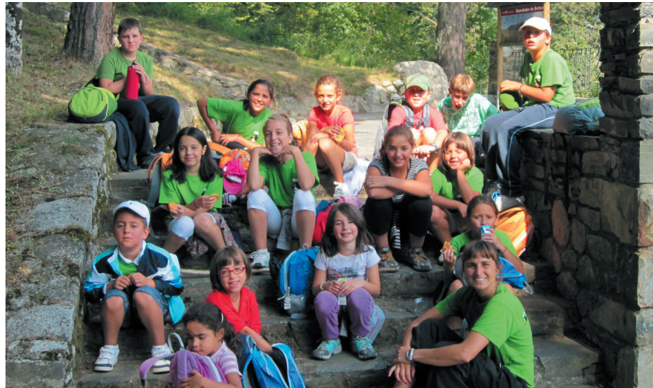
Los participantes en el campus del Palai han podido disfrutar de actividades de naturaleza.