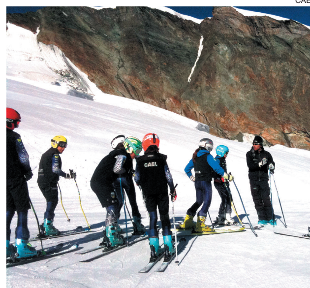
Los esquiadores, durante una de las concentraciones.