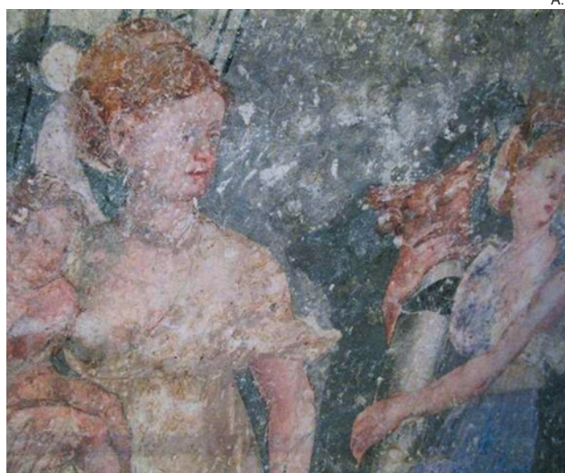
Pinturas del siglo XVI descubiertas el pasado verano.

Hay que recordar que en 2009 se encontraron en la