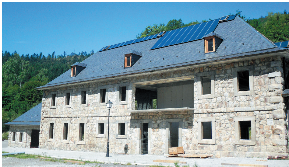
El antiguo cuartel de la Guardia Civil servirá como museo y centro de visitantes.