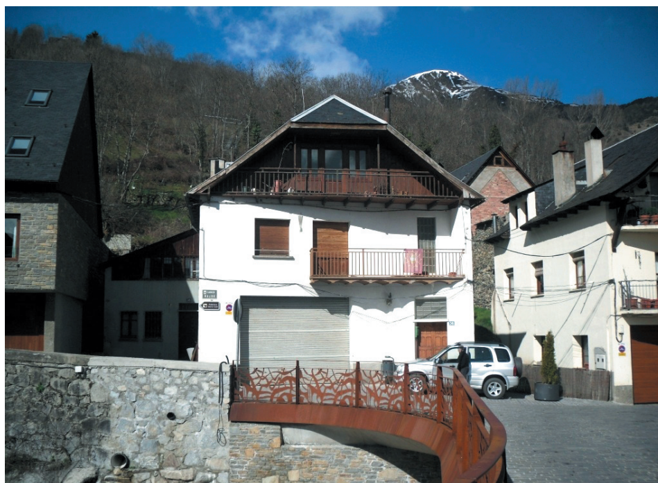
La antigua casa forestal de Vielha será remodelada en breve.