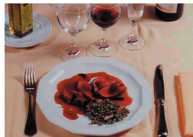
El pato, ingrediente principal de la Mòstra de Tardor.

Más información en la Oficina de Torisme dera Val d'Aran, en el teléfono 973 640 110.