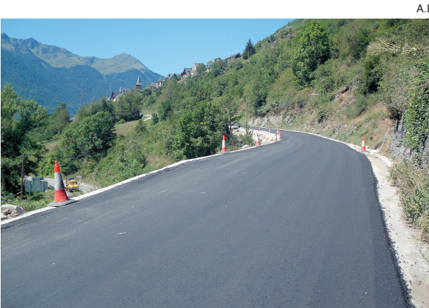
Una de las carreteras pavimentadas en los últimos días.

El sindic d'Aran, Francés Boya, ha asegurado que la voluntad del Conselh es "incentivar el voluntariado en los 'Pompièrs', para mantener y reforzar su espíritu y su tradición". Boya explica también que el nuevo organismo "permitirá hacer frente a las emergencias y desarrollar con mayor eficiencia las actividades propias de la entidad". De esta forma, "se adopta un modelo autónomo, diferenciado y cooperador de gestión y organización para mejorar los servicios públicos".