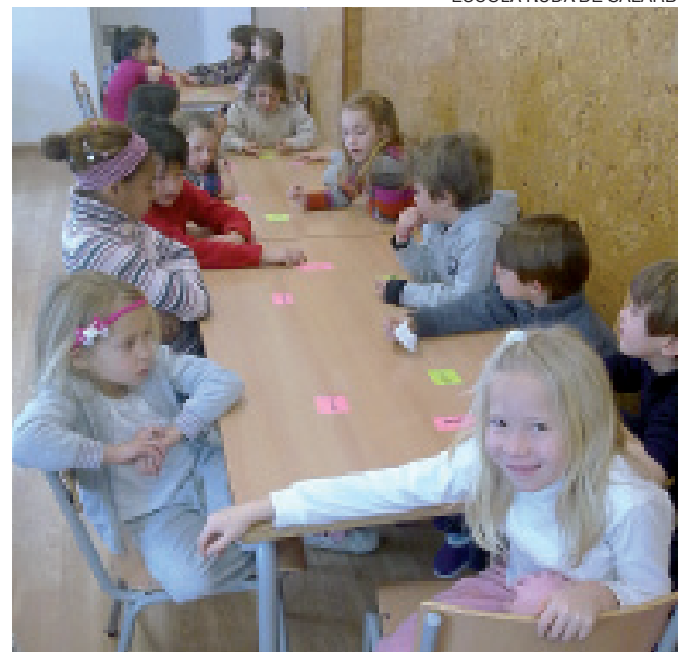
Mientras, los escolares realizaron algunos talleres.