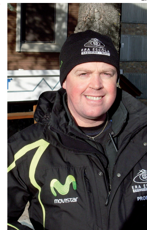
Profesional de Era Esc3la.

Para evitar este fen3meno insisto en que tengamos los esqu3s siempre bien encerados y sobre