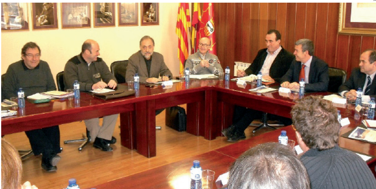
Asistentes a la reunión en la que se creó el comité aranés de la candidatura Barcelona Pirineu 2022.