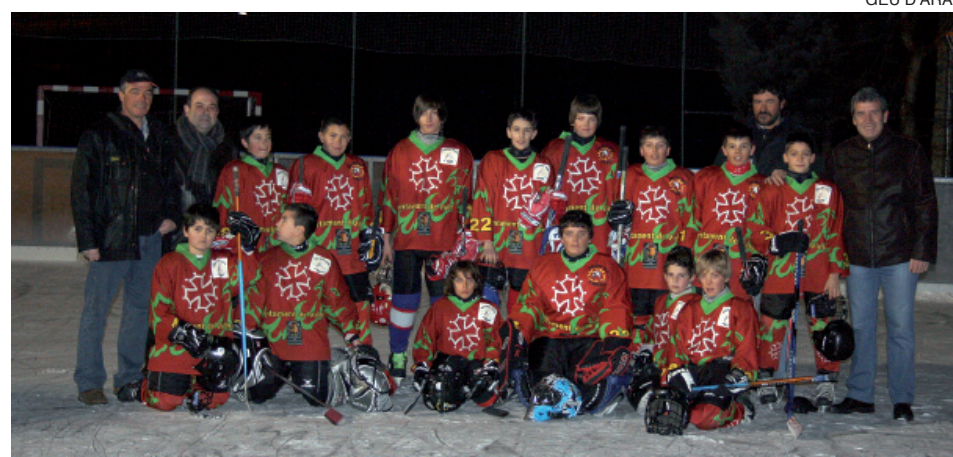
Los equipos infantiles del Hockey Gèu d'Aran inauguraron la pista de Arties.

ha permitido que los jugadores puedan continuar con su preparación.