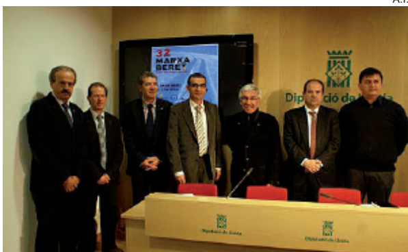
Acto de presentación de la Marxa Beret en Lleida.

Ante esta situación, la pista de hielo al aire libre que la empresa Nivalia ha instalado en la localidad de Arties, en la Val d'Aran, se ha convertido en alternativa. De hecho, ya lo es para los deportistas de los equipos sub-15 y sub-11 del Hockey Gèu d'Aran, que han cambiado sus entrenamientos de Vielha a Arties.