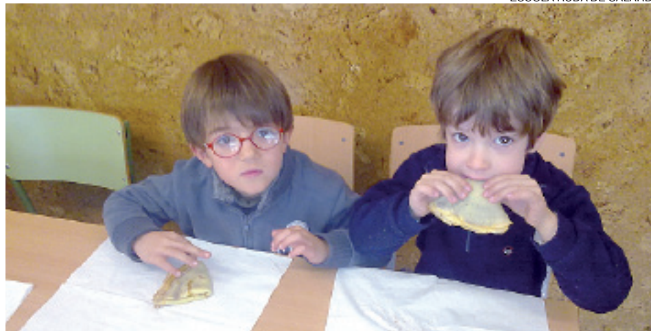
Nadie quiso perderse la oportunidad de degustar el sabroso plato.