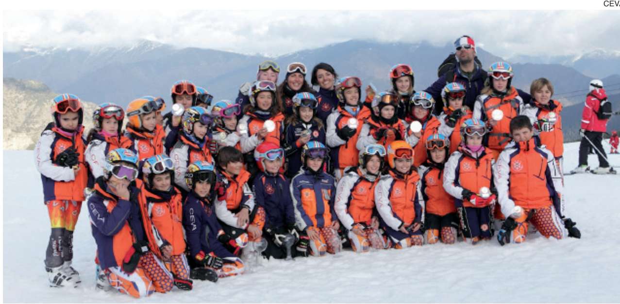
Grupo de alevines del CEVA que compitió en el VII Trofeo Floquet de Neu celebrado en Espot Esquí.