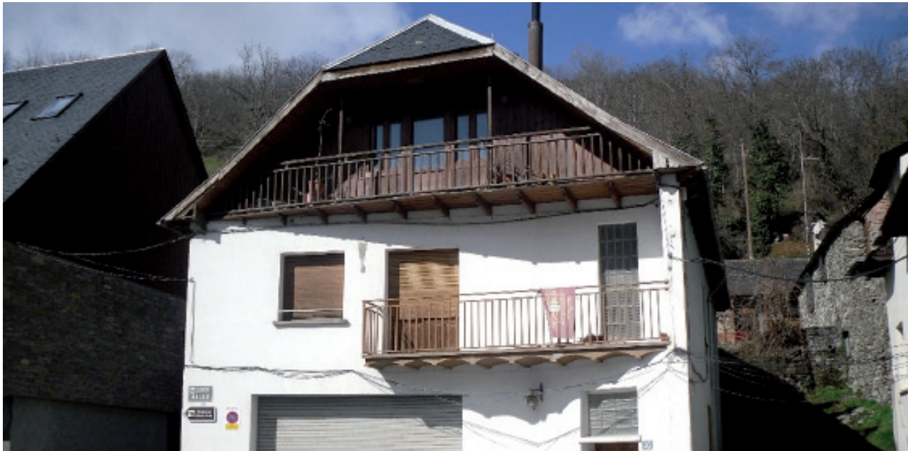
La antigua casa forestal de Vielha acogerá la sede administrativa de Miei Ambient e Pagesia del Conselh.