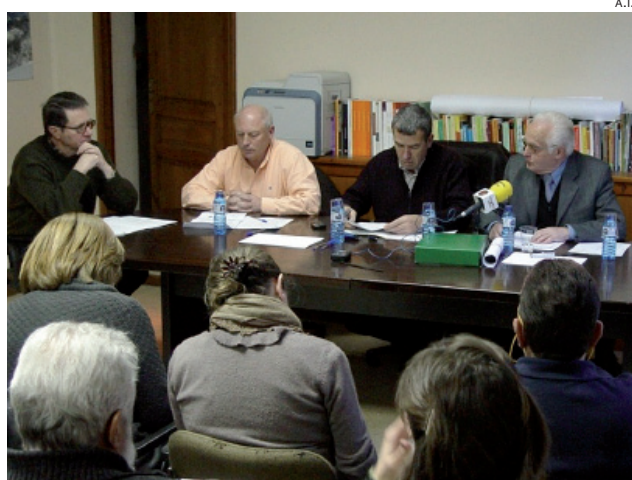
Imagen del último conselh de terçon de Lairissa.