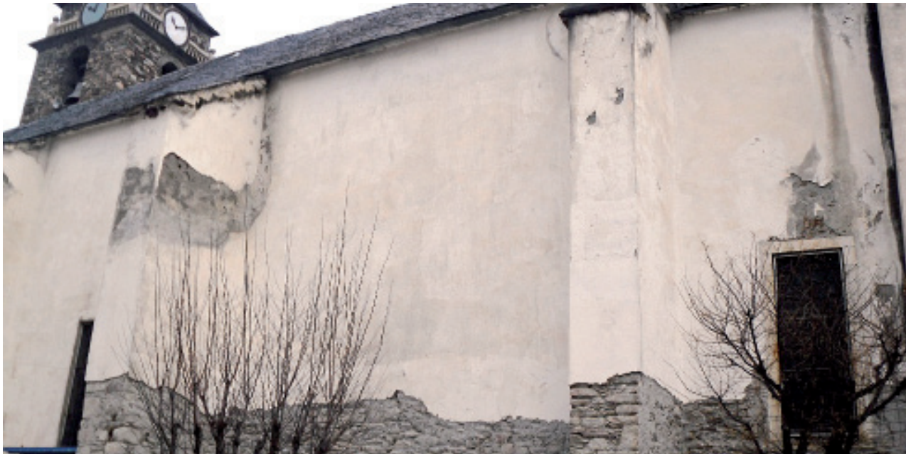
La iglesia de Sant Joan de Les está siendo objeto de una importante restauración.

Esta primera actuación ha permitido descubrir las bases y algunos trozos de la pared de la primitiva iglesia medieval en la parte exterior del presbiterio. La piedra del resto de la fachada, que será repicada, se dejará a la vista para respetar el conjunto de la iglesia, que está situada en el centro de Les. Además, el Conselh Generau también tiene previsto reformar el campanario y afianzar la estructura.