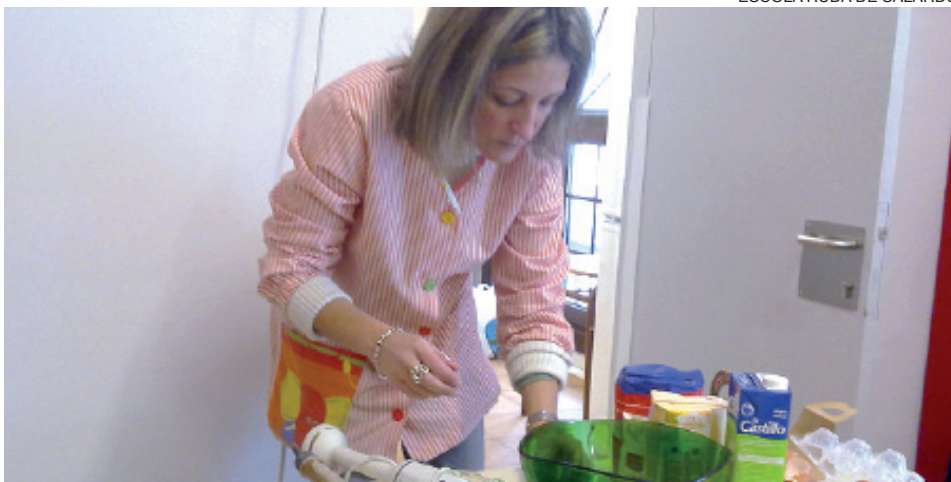
Una de las profesoras, elaborando la masa de los crepes.