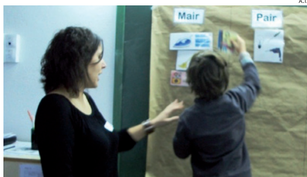
Los talleres se han adaptado en función de los ciclos.

Las sesiones se celebraron durante los meses de noviembre y diciembre y en ellas participaron los alumnos de todos los ciclos, desde Infantil al ciclo superior de Primaria. En total se han impartido 26 talleres en el centro escolar de la capital