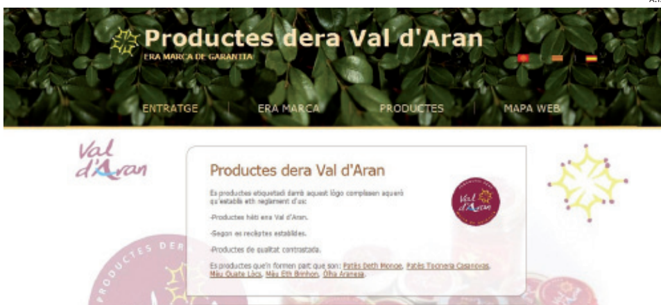
Web creada por el Conselh para promocionar los productos de la Val d'Aran.