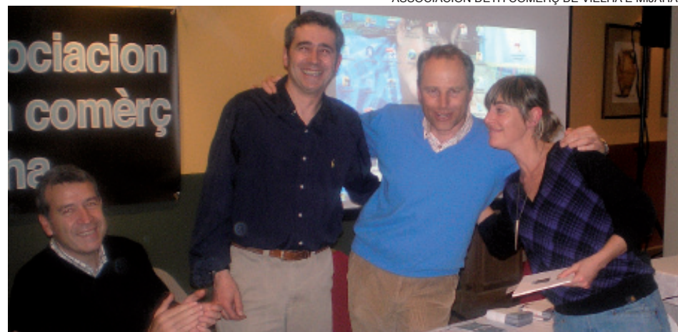
Una de las galardonadas, recibiendo el diploma acreditativo del concurso.

Por otra parte, la Asociación deth Comèrç de Vielha e Mijaran aprovechó el acto para presentar la nueva web del colectivo, que puede consultarse ya en la dirección www.comerciantsvielha.org .