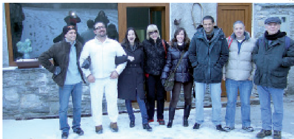
Grupo de periodistas israelíes que han visitado la Val d'Aran durante el mes de enero.

El turismo israelí se encuentra en segundo lugar en número de usuarios de las