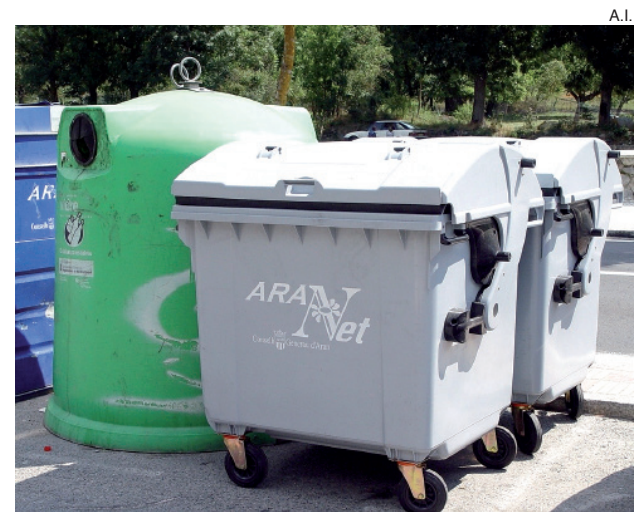
Los camiones pudieron acceder a los contenedores.

Asimismo, el Conselh aranés pidió a los Ajuntaments que se señalizaran las áreas de recogida y que se trasladaran los contenedores de los puntos más conflictivos a otras zonas de mejor acceso. También se adelantó el horario de recogida y, en algunos momentos, se activó una tercera línea de refuerzo de la recogida.