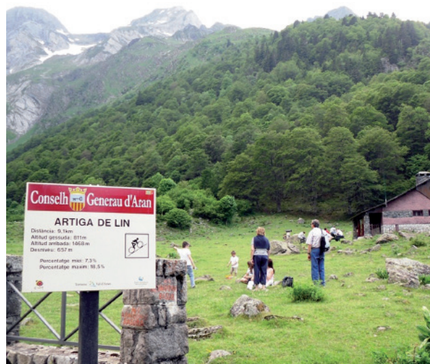
Artiga de Lin es un área natural muy visitada en la Val d'Aran.

En la Artiga de Lin está previsto acondicionar la zona de