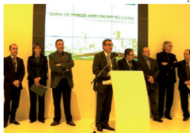
Imagen de la presentación de la Red de pueblos en FITUR.

cales descentralizadas que tengan un máximo de 1.000 habitantes y que dispongan de elementos de interés turístico relevantes, tanto por su importancia paisajística, cultural, científica, patrimonial o urbanística, como por la accesibilidad y la sostenibilidad.