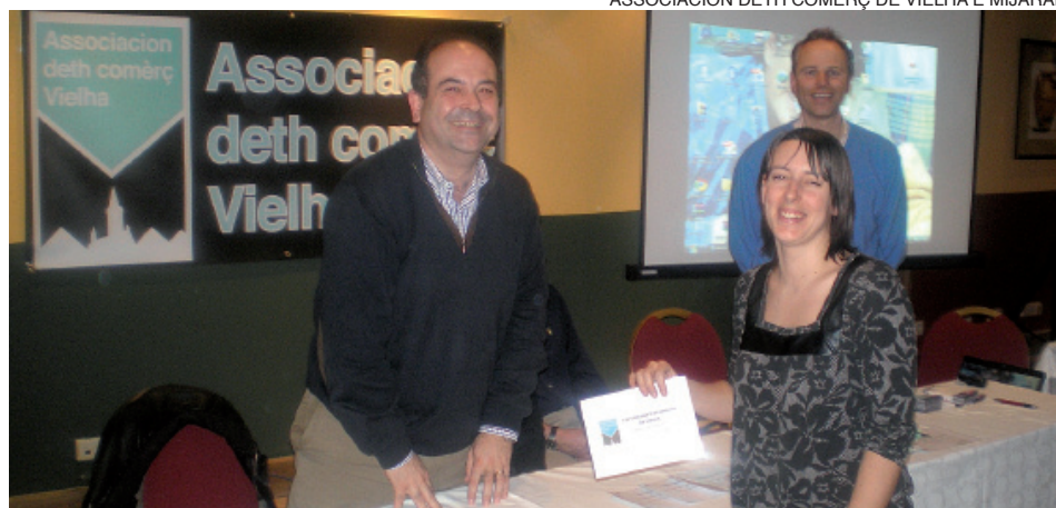
La entrega de galardones se celebró en el transcurso de un acto celebrado en Vielha.