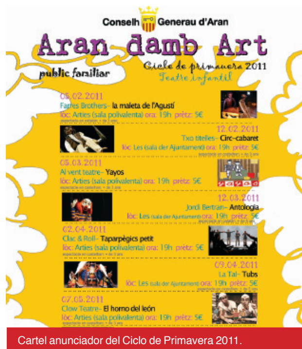
Cartel anunciador del Ciclo de Primavera 2011.

El telón de la campaña de primavera se levantará este sábado, 5 de febrero, en Ar-