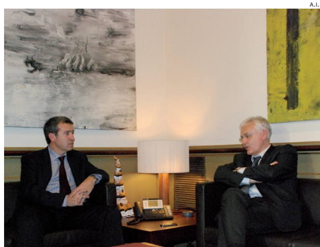
Boya y Mascarell, dispuestos a renovar la colaboración.

Mòla de Les como Bien Cultural de Interés Local, BCIL, con el objetivo de promover el edificio por su valor etnológico, arquitectónico e industrial.