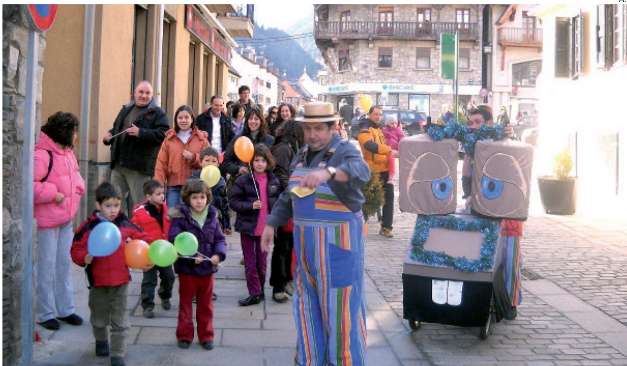
Las calles de Vielha registraron una especial animación en Navidad gracias a una campaña de dinamización.

Durante las pasadas fiestas navideñas, la ocupación de los alojamientos del valle alcanzó la cifra histórica de 320.000 estancias