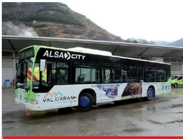
Uno de los autobuses que presta servicio en Aran.

Con esta medida, "el Govern aranés incrementa las prestaciones de transporte escolar, que en los últimos años ha llegado por primera vez a Casau, Vilac, Mont y Montcorbau", informó el