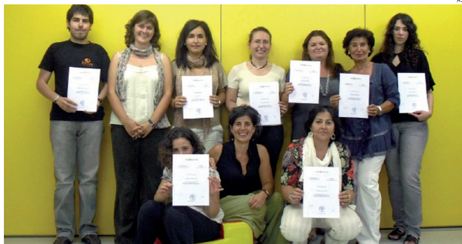
Grupo de participantes en uno de los talleres de teatro celebrados en Aran.