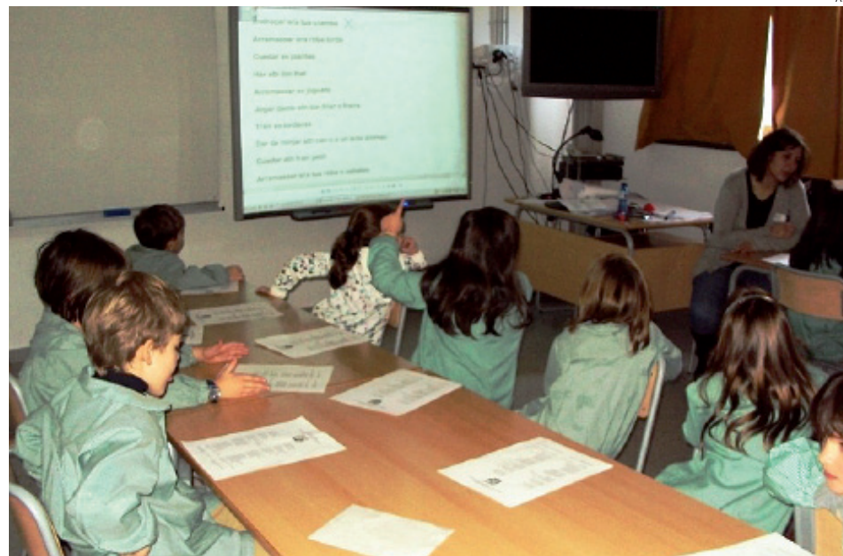
Alumnos del ciclo Medio de Primaria, durante una de las sesiones.

Con estos talleres se pretende promover la transmi-