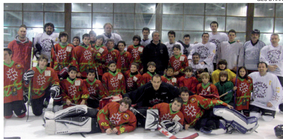
Foto de familia de los participantes en el I Torneo Social del Hockey Gèu d'Aran.

El cierre de la pista de hielo de Vielha ha obligado a los equipos inferiores del Hockey Gèu d'Aran a trasladar sus entrenamientos a la pista de hielo situada durante estos meses en Arties, gracias a la buena predisposición de la empresa Nivalia, encargada de gestionar el recinto, que