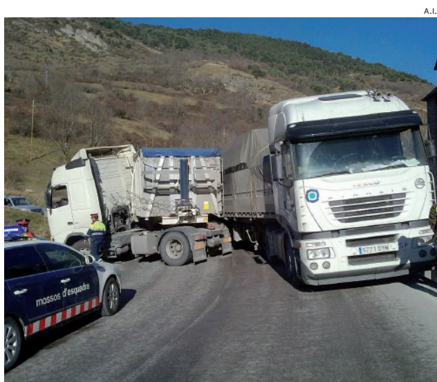
Imagen del último accidente ocurrido en el tramo de la N-230.

Por último, Es Bòrdes cuenta con 245 vecinos; Vilamòs tiene 202; Canejan, 103; Arrés 63; y Bausen, 61.