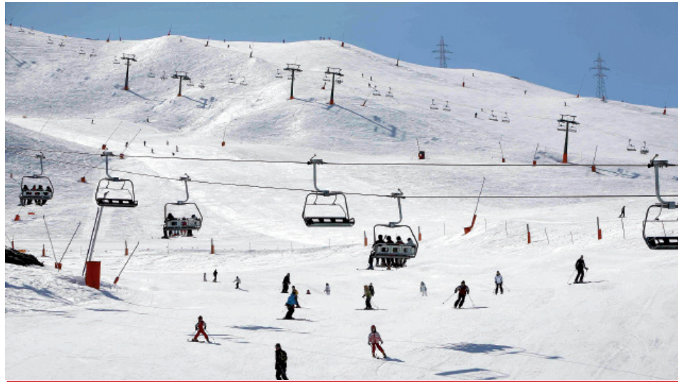
Las pistas de Baqueira Beret son gran reclamo para la Val d'Aran en temporada de esquí.

Las cifras que manejaba Torisme Val d'Aran ya lo dejaban entrever, pero ya es una realidad y por primera vez los visitantes de Francia ya suponen un 20% de los turistas que visitan la Val d'Aran en invierno. Asimismo, las