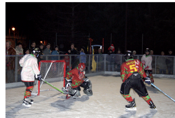
El hockey aranés inauguró la nueva pista de Arties.